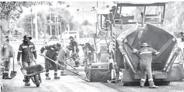
El mantenimiento de av. Kyllmann. GAMC

Plan. El municipio anunció que se realizará una intervención sostenida en varias zonas para mejorar la transitabilidad