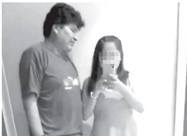
El expresidente Evo Morales y su presunta víctima.

Entre los implicados se encuentran el exgerente