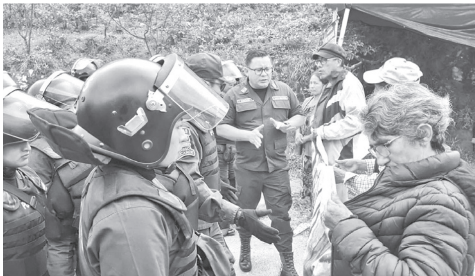
La Policía sobrepasó la resistencia de los comunarios que defienden Tariquía. T. NOTICIAS

Los defensores describieron el ingreso: "Vinieron en