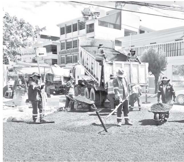
La obra se ejecutó en más de 20 meses.

Señaló que el municipio programa el mantenimiento de varias vías.