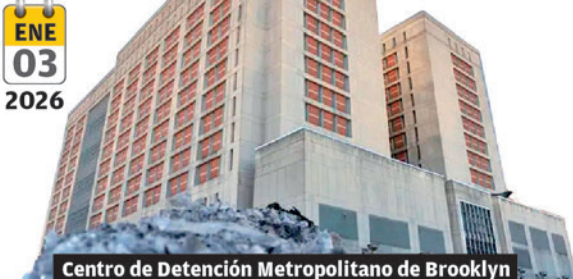
Centro de Detención Metropolitano de Brooklyn

Maduro y su esposa Cilia Adela Flores, fueron capturados en Caracas en una operación militar estadounidense y trasladados a Estados Unidos, donde se encuentran en el Centro de Detención Metropolitano de Brooklyn, Nueva York.