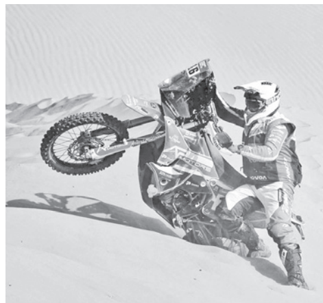
La competencia en motos en el rally, una de las pruebas más difíciles.