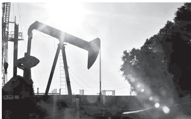
La extracción de petróleo para el mercado.

Los amplios stocks a nivel mundial contrarrestaban las preocupaciones sobre el impacto en los flujos petroleros tras la captura por parte de Estados Unidos del presidente de Venezuela, Nicolás Maduro.