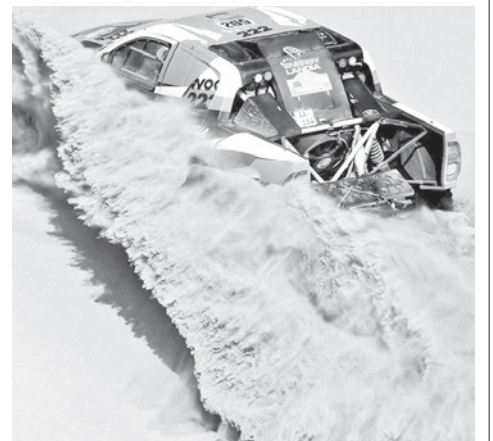
La competición del lunes fue una de las más complicadas.