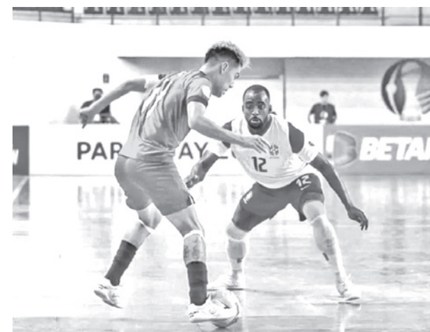
Uno de los partidos de la selección de futsal.

“La Copa América es un torneo en el que queremos dar lucha. El equipo comenzó a trabajar, tenemos establecida nuestra planificación de entrenamientos”, mencionó Errol Mendoza, titular de la Comisión de Fútbol de la Federación de Fútbol sobre el interés de participar en el torneo internacional en Paraguay.