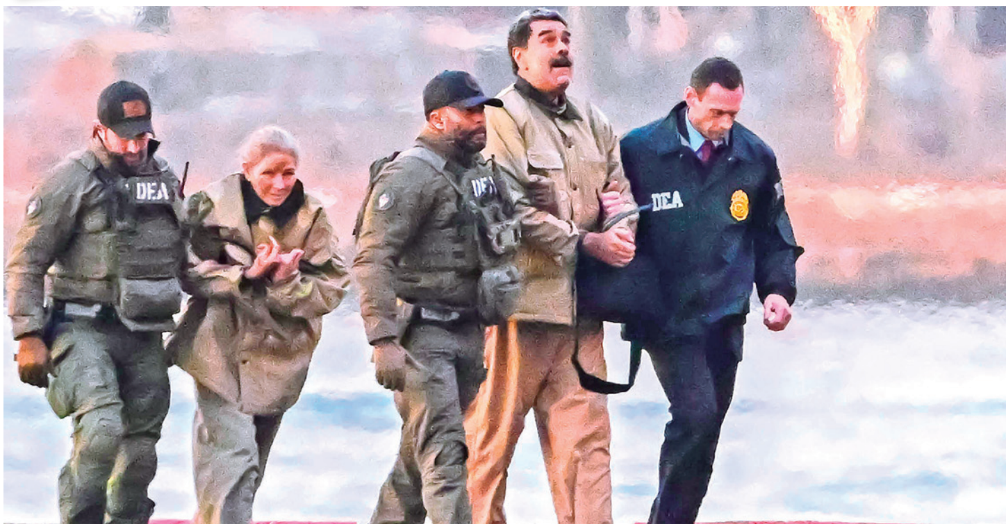
Nicolás Maduro y su esposa Cilia Flores, vestidos de presidiarios, son trasladados por la DEA a su audiencia en Nueva York, ayer.