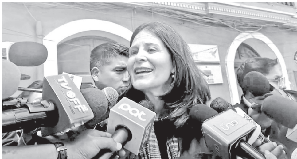
Autoridades del Ministerio de Educación en conferencia de prensa, ayer.

El Ministerio de Educación establece que “queda terminantemente prohibido el uso de celulares en el aula por parte de estudiantes y maestros”, medida que busca garantizar la concentración y el desarrollo de las clases. Otras regulaciones incluyen la prohibición de actos de graduación en niveles distintos al secundario, la no obligatoriedad del uniforme en unidades educativas fiscales, privadas y de convenio, así como la prohibición de exigir la compra de materiales escolares en lugares exclusivos.