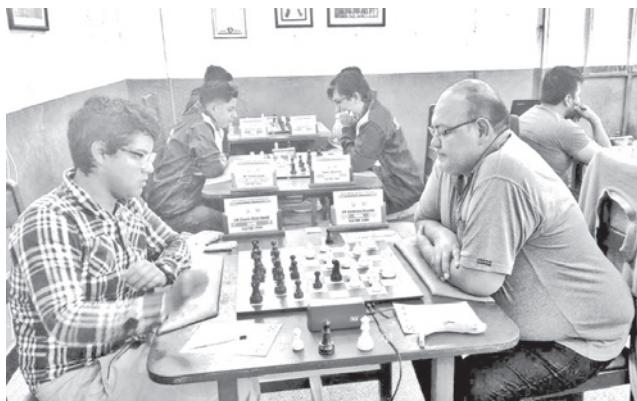
Una competencia de ajedrez en 2025.

en la primera mitad del año será la Final Nacional Mayores Absolutos y Femenina que se disputará del 7 al 12 de abril.