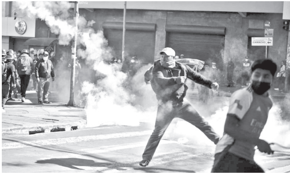
Enfrentamientos entre trabajadores de la COB y policías, ayer en La Paz. CARLOS SANCHEZ

La movilización de la COB inició el sábado 3 de enero en Calamarca.