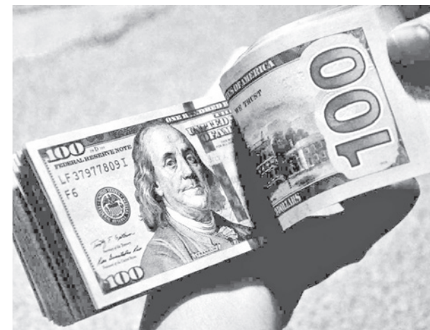
La venta de dólares en el mercado boliviano. CARLOS LÓPEZ

La cotización del tipo de cambio para la venta con relación al cierre de la pasada jornada, el 30 de diciembre, sufrió leves variaciones, puesto que el dólar paralelo se registraba a la venta en Bs 9,57, y en las últimas horas registró a Bs 9,61