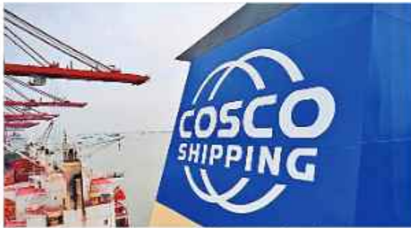
EMPRESA. Logo del consorcio de capitales chinos.

"Un gran agradecimiento a todos los que hicieron posible este primer paso. Estamos listos para escalar y respaldar un flujo constante y sostenido de exportaciones refrigeradas de Bolivia", complementó.