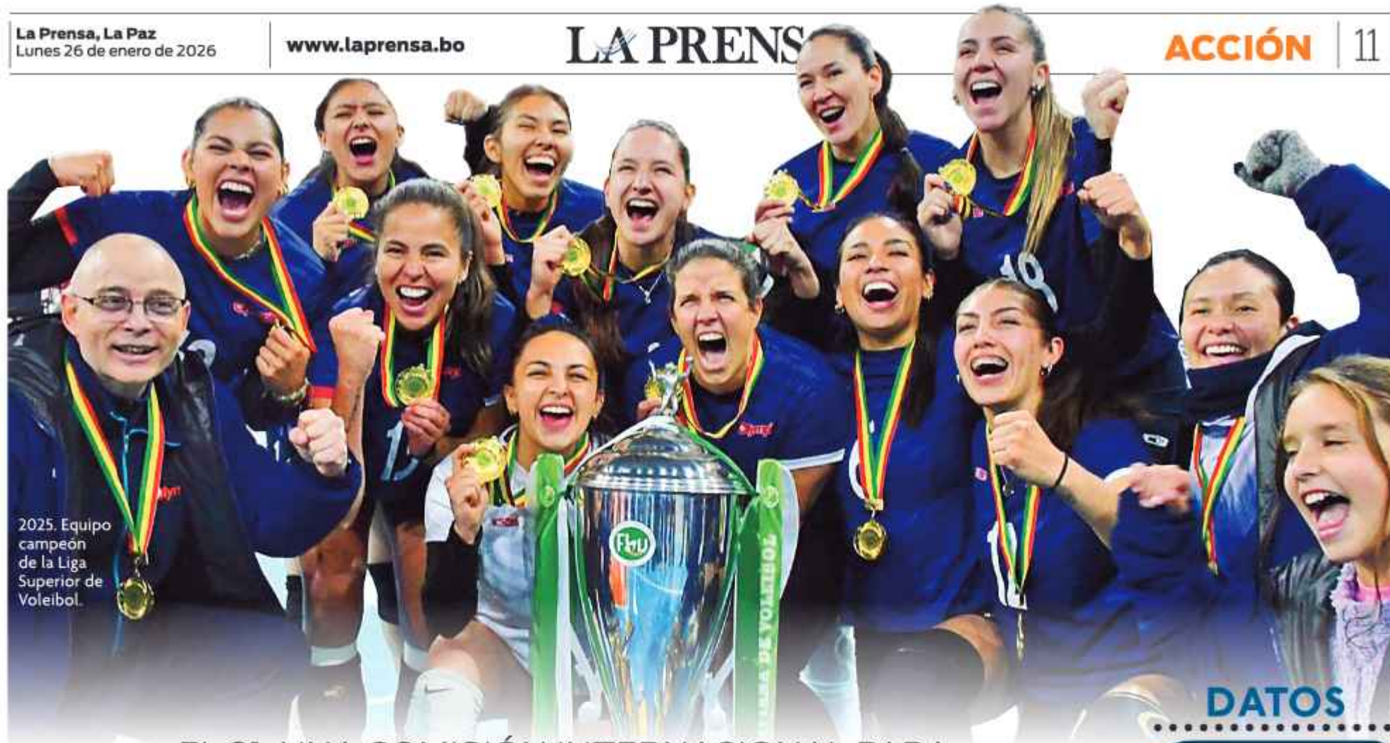
2025. Equipo campeón de la Liga Superior de Voleibol.