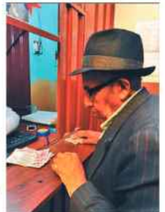
PAGO. Una persona de la tercera edad recibe su renta.