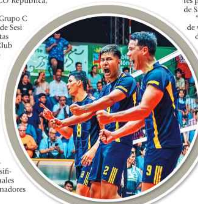
CAMPEÓN. Jugadores del club San Martín celebran el título.

Hace algunos días en Rivadavia, de Argentina se desarrolló el Campeonato Sudamericano Sub-17 de voleibol, en la