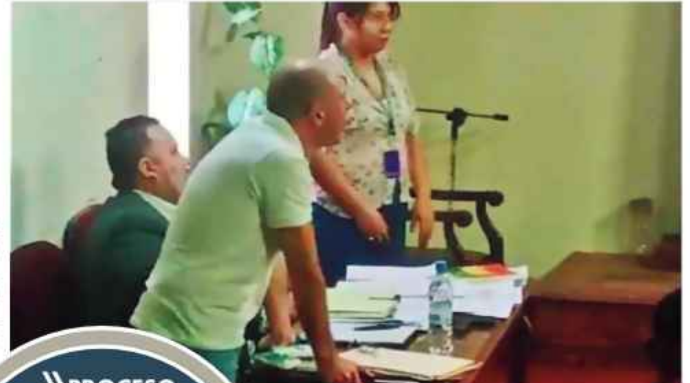
AUDIENCIA. El juez Zaballos, en el banquillo de los imputados.

El Ministerio Público solicitó 180 días de detención en una audiencia que enfrentó diversos incidentes ayer, desde el cambio de lugar hasta la presencia de un grupo de mujeres en el Palacio de Justicia que acusaba al procesado de liberar a quienes fueron acusados de ser violadores. Se supone que hay una conexión entre la droga que ingresó en 32 maletas procedentes de Estados Unidos, en un vuelo charter que contrató la exlegisladora, al aeropuerto internacional de Viru Viru el 29 de