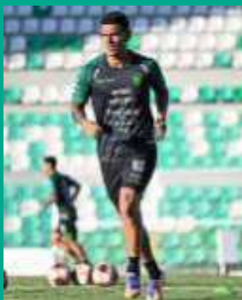
GÓMEZ. Defensor central de la Selección Nacional.

La Selección Nacional enfrentará esta tarde a un duro escollo, el Seleccionado de México ante el que buscará encontrar el fútbol y los goles necesarios para dejar tranquila a la afición local que ha visto como en los partidos recientes hubo falta de gol y de resultados.