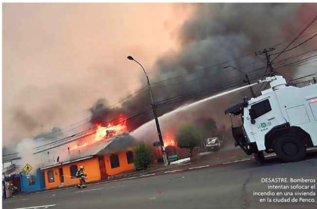
DESASTRE. Bomberos intentan sofocar el incendio en una vivienda en la ciudad de Penco.

Asimismo, el presidente electo, José Antonio Kast, se pronunció sobre el desastre natural y pidió apoyar a las autoridades en la lucha contra las llamas. "Frente a los devastadores incendios en Ñuble y Bio Bio, hoy el foco debe ser combatir los incendios, ir en auxilio de las personas afectadas y apoyar a las autoridades para enfrentar esta emergencia. No hay espacio para la política en este momento crítico de