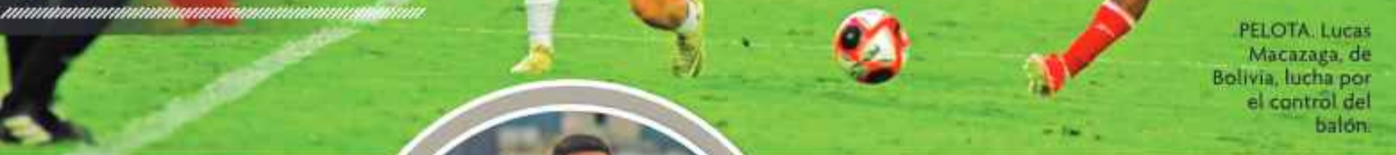
PELOTA: Lucas Macazaga, de Bolivia, lucha por el control del balón.

El estadio IV Centenario quedó abarrotado, la expectativa para el partido amistoso fue diferente.