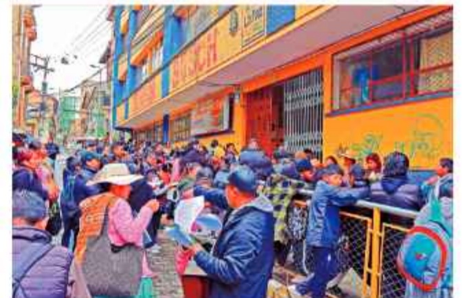
EDUCACIÓN. Inscripciones en una unidad educativa.

El inicio de clases se producirá el lunes 2 de febrero, la conclusión el 2 de diciembre, y el cierre administrativo será el viernes 11 de diciembre.