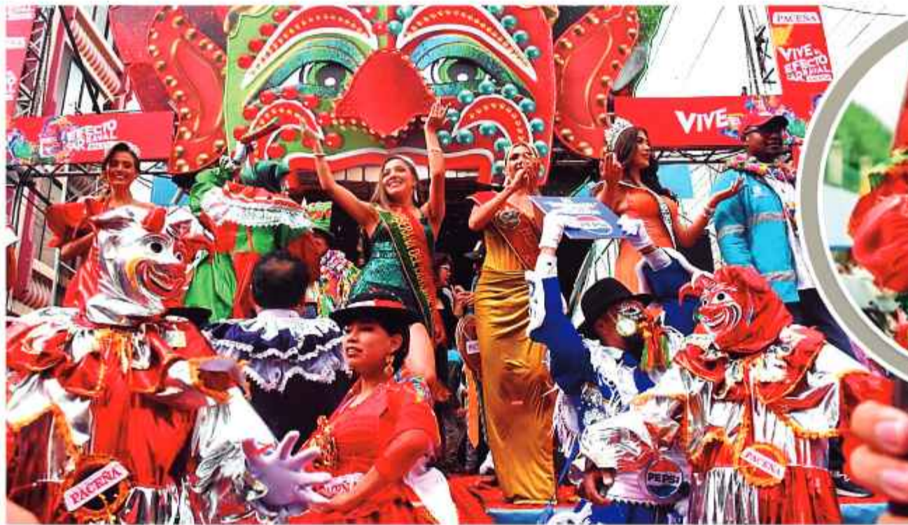
ALEGRÍA. El Pepino resucitó y bailó con las reinas de belleza, ayer. Comenzó el Carnaval paceño.