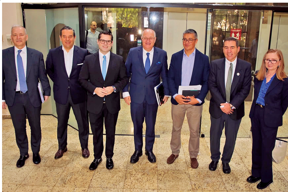
ENCUENTRO. El Presidente del BID junto a funcionarios de Gobierno y empresarios privados.

“Hablamos de ejecución, de estimular inversiones y de acelerar resultados en sectores clave como la agroindustria, energía, minería y el turismo”, escribió en sus redes sociales el presidente del Banco Interamericano de Desarrollo (BID), Ilan Goldfajn, después de reunirse con empresarios privados en la ciudad de Santa Cruz de la Sierra. Según autoridades del Gobierno, en el primer semestre de esta gestión se pretende contar con 500 de los 4.500 millones de dólares comprometidos por la institución financiera.