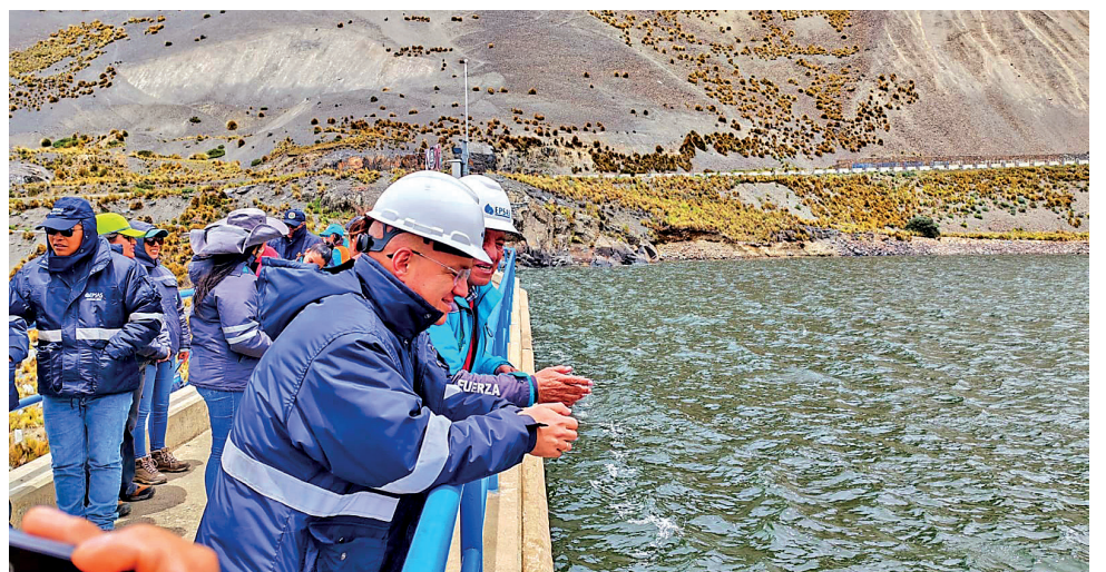
INSPECCIÓN. Las autoridades observan el líquido acumulado en las represas de La Paz.