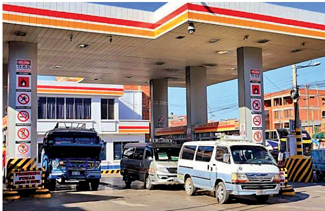
ESTACIÓN. Vehículos cargan carburantes en un servicentro.