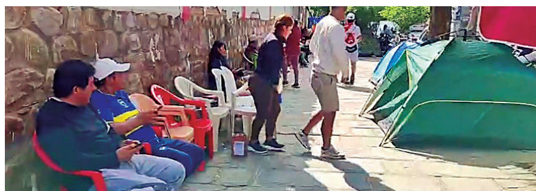
ENTRADAS. Desde el lunes, las personas forman fila para comprar boletos.

Los precios de las entradas son de 300 bolivianos para las butacas; 240 bolivianos, para Preferencia; 180 bolivianos, para General A y C y para las curvas, 80 bolivianos. Otras 6.000 localidades fueron puestas a la venta la pasada semana por internet y se agotaron en menos de 24 horas, lo que permite adelantar que las