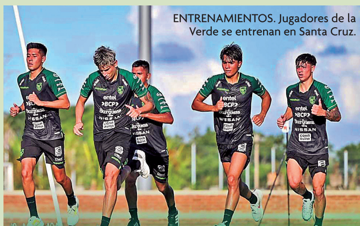
ENTRENAMIENTOS. Jugadores de la Verde se entrenan en Santa Cruz.

“Por el momento, la presencia del Presidente está asegurada, pero también debemos tomar en cuenta la agenda del Mandatario. Entre el jueves y viernes sostendré una reunión con personeros del Viceministerio de Planificación. El domingo atenderé la invitación de la Federación, esperemos que los resultados nos favorezcan para el país esté de fiesta al igual que la afición tarijeña”, afirmó la primera autoridad deportiva nacional.