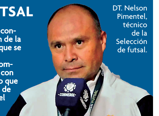
DT. Nelson Pimentel, técnico de la Selección de fútbol.

En tanto, el 26 jugará contra Colombia desde las 11:00, y el 28 rivalizará con Venezuela a partir de las 11:00 con lo que concluirá su participación en la fase de grupos. El equipo viajará a la sede del certamen el próximo 22.