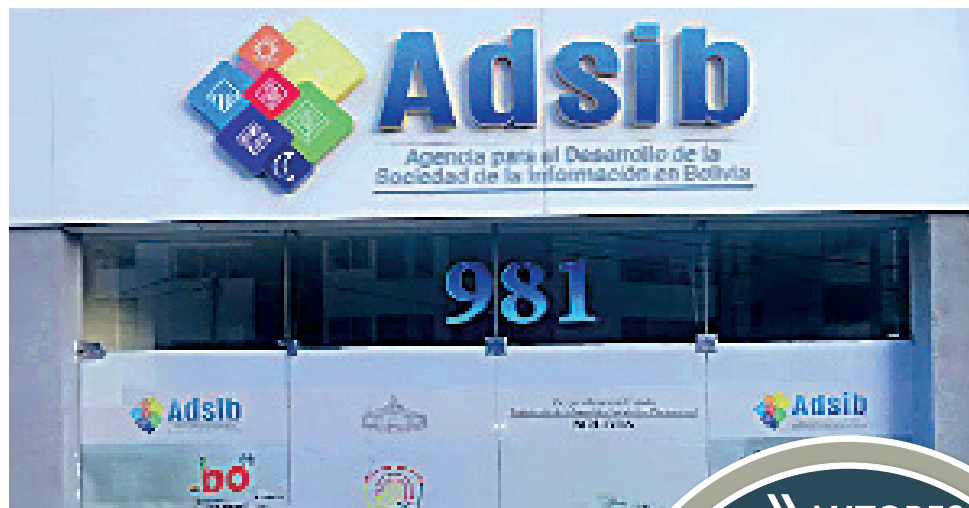
DATO. La Adsib proveía de servicios técnicos y la Agetic busca reducir la burocracia estatal y dar paso al gobierno electrónico.

De acuerdo con el nuevo decreto, todas las compe-