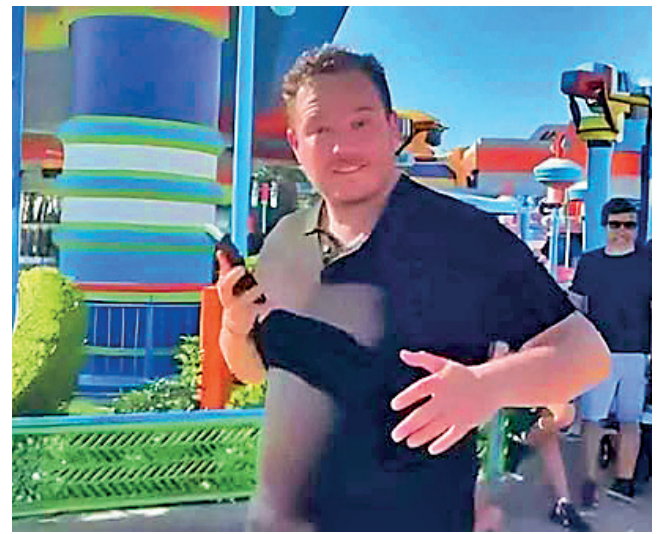
CIFRA: Dorgathen habría generado un daño por $us 857 millones.

El ejecutivo de YPFB es investigado por la firma de 12 contratos entre Botrading y YPFB, que habrían generado un presunto daño económico al Estado.