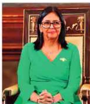
PRESIDENTA. Delcy Rodríguez, de Venezuela.

El Estado venezolano concretó recientemente 116 nuevas excarcelaciones, que se suman a otras 187 otorgadas en diciembre de 2025 y que benefician a personas relacionadas con hechos asociados a "alterar el orden constitucional", informó ayer el Ministerio del Poder Popular para el Servicio Penitenciario de Venezuela.