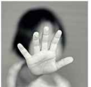
VIOLENCIA. La imagen ilustra la nota.

La Policía ya desplegó un operativo de búsqueda en las zonas aledañas y en la franja fronteriza para ubicar al el paradero del agresor, quien tras cometer el delito huyó del lugar. La niña está hospitalizada. Se recupera.