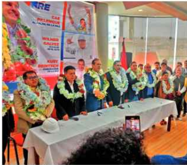
ACTO. Los candidatos fueron presentados por Tuto Quiroga.

En un acto político, la alianza Libre, de Jorge Tuto Quiroga, oficializó ayer a sus candidatos para el departamento y los principales municipios de La Paz, de cara a los comicios del próximo 22 de marzo.