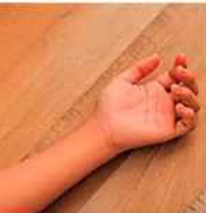
MUERTE. El niño estaba en la sembradora y cayó.

El Ministerio Público tiene conocimiento del caso y su personal evalúa si corresponde la imputación del adulto mayor del delito de homicidio culposo agravado por la falta de documentación legal para operar maquinaria pesada.