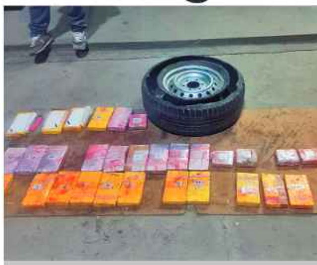
DROGA. La cocaína encontrada en poder de uno de los efectivos de Gendarmería.

El caso de narcogendarmes llegó a juicio. Un tribunal oral federal de Salta, desde mediados de diciembre, juzga a la organización criminal detenida tras los dos operativos en los que las autoridades secuestraron un total de 334 kilos de cocaína. Durante el debate se conoció que los acusados organizaban sus movimientos a través de un grupo de WhatsApp llamado Los peluches, donde compartían audios y videos con instrucciones precisas para ocultar