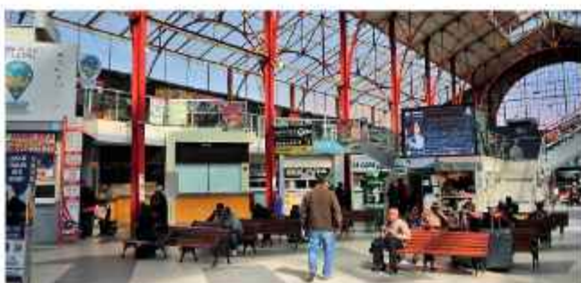
SITUACIÓN. Las empresas se quejaron de los bloqueadores.

La directora de la Terminal de Buses de La Paz, Iveliz Asturizaga, se refirió a las pérdidas económicas que dejaron los bloqueos en las diferentes carreteras del país. "Los bloqueos perjudicaron de gran manera a las empresas de transporte interdepartamental, porque tuvimos una pérdida de cerca de seis millones de