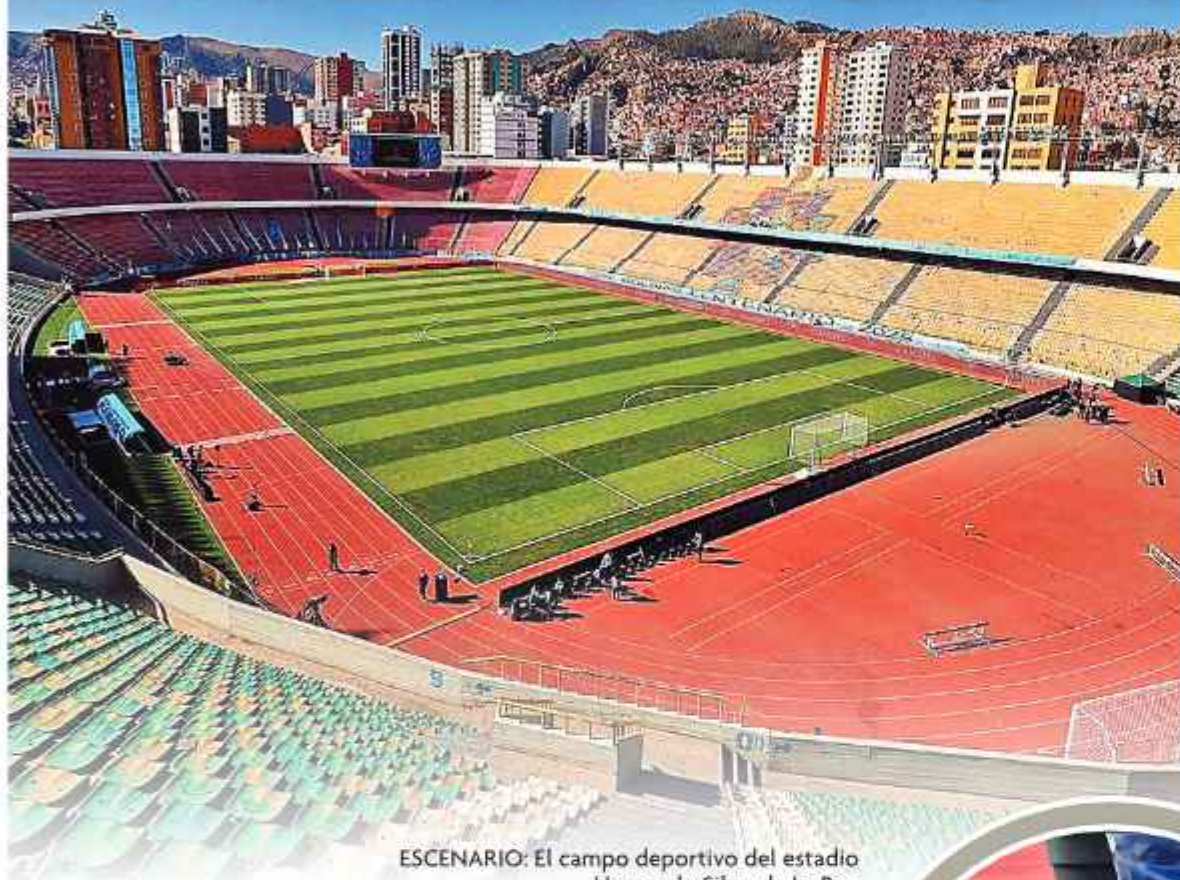
ESCENARIO: El campo deportivo del estadio Hernando Siles, de La Paz.

Las labores en el campo de juego continuarán hasta el inicio del torneo de la División Profesional.