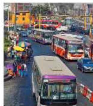
PELIGRO. Buses transportan pasajeros en Perú.

Vargas recordó que alrededor de 10 atentados se han producido contra las unidades de transporte en lo que va del año. "El 14, desde las 00:00 horas, el servicio de transporte público de Lima y Callao estará suspendido", precisó Ojeda por su parte. ANDINA