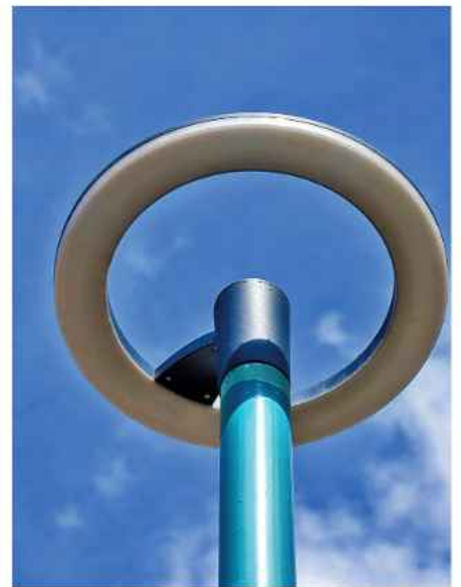
INSTALACIÓN. El lugar cuenta con iluminación de luces LED.

LA DIRECTORA DE LA TERMINAL DE BUSES DE LA PAZ DIO LA INFORMACIÓN