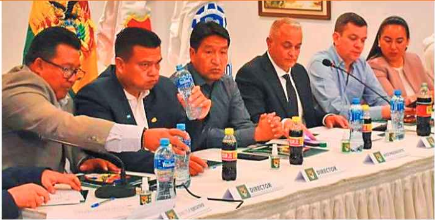
REUNIÓN. Miembros del Comité Ejecutivo de la FBF, en una anterior reunión.

Serán en total, 30 partidos que se disputarán en el campeonato de verano que otorgará los mismos premios del año pasado, 30 pasajes aéreos para cada fecha