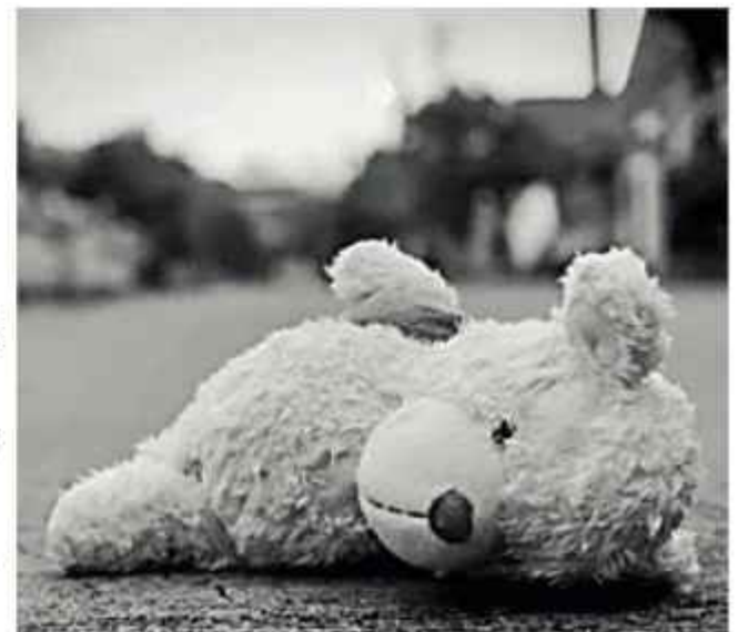
VIOLENCIA. La imagen solamente ilustra la nota.

El viernes 9, otra madre denunció que su hija de 14 años fue vejada por un extraño. Su hija estaba con su amiga, de 17, en una casa abandonada y el sindicado ingresó para vejlarla. El hombre estará privado de libertad por 45 días.