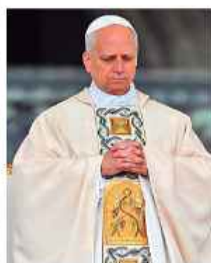
PONTÍFICE. León XIV.

El papa León XIV subrayó esta semana la importancia de escuchar a las víctimas de abusos sexuales a manos de religiosos, durante una reunión con cardenales de todo el mundo, según comentarios difundidos ayer.