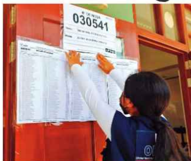
INFORMACIÓN. Una funcionaria del Jurado Nacional de Elecciones coloca un listado de votantes en Perú.

Antes del cierre del plazo de inscripción, las organizaciones políticas deberán realizar sus elecciones primarias internas el domingo 17 y el domingo 24 de mayo de este año.