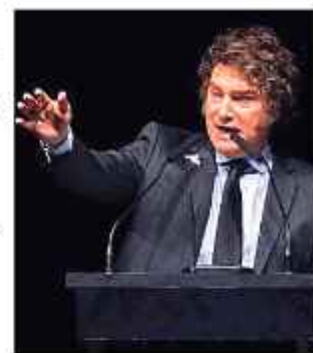
MANDATARIO. Javier Milei, de Argentina.

Dicha transacción se acordó a un plazo de 372 días y con una tasa de interés equivalente al 7,4 por ciento anual y el BCRA usó títulos públicos Bonares 2035 y 2038, entregados como garantía a los bancos internacionales. XINHUA