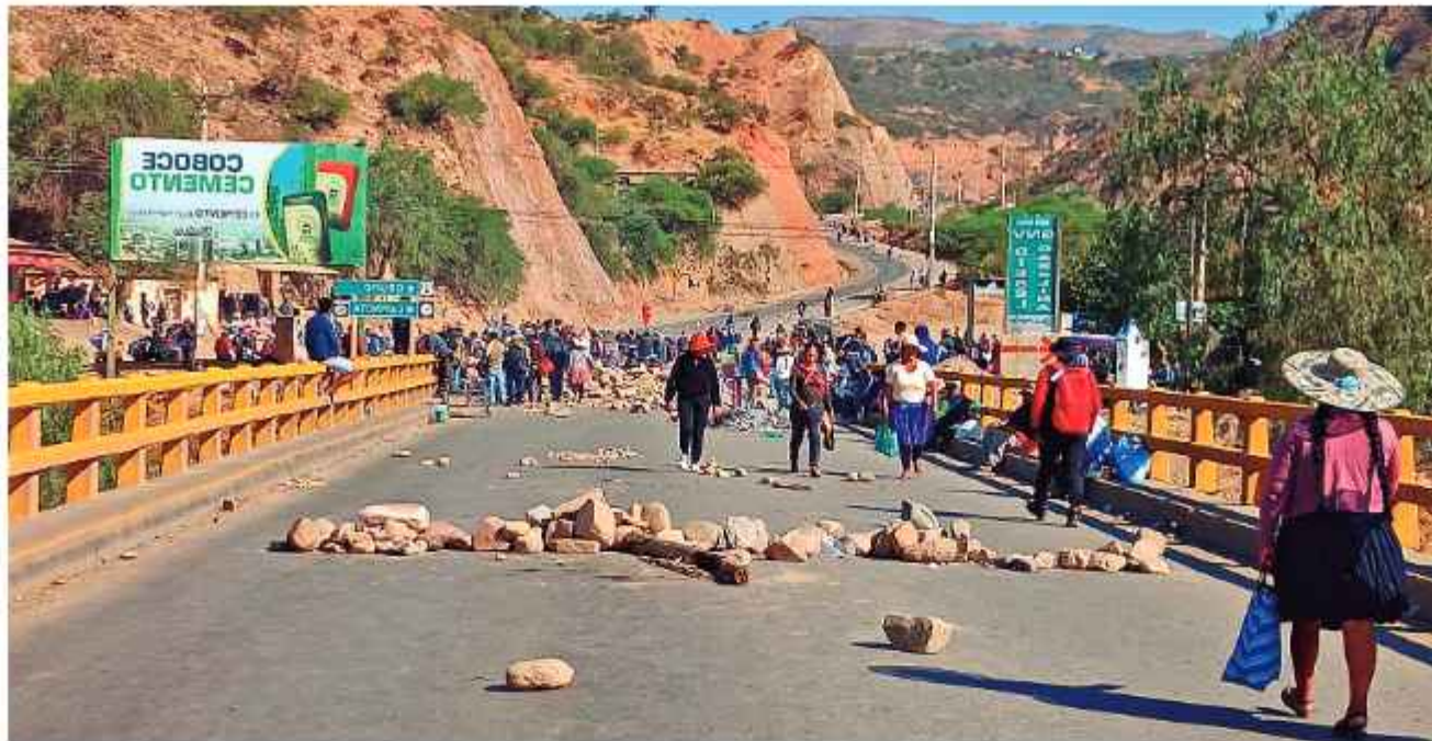
ZOZOBRA. El país vuelve a sufrir por los bloqueos, una imagen de similares medidas en octubre de 2024.