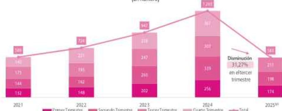
BOLIVIA: DENUNCIAS DE TRATA DE PERSONAS, DELITOS CONEXOS(1) Y TRÁFICO DE PERSONAS, POR AÑO, 2021 - 2025(p) (En número)

Información: OBSOD. Fuente: Policía Boliviana. Nota: Las denuncias de trata de personas pueden incluir denuncias de personas desaparecidas, de acuerdo con la Ley N° 3953. (1). Información preliminar actualizada a septiembre del 2025. (2). Comprende los delitos de prostitución, proxenetismo y violencia sexual comercial.