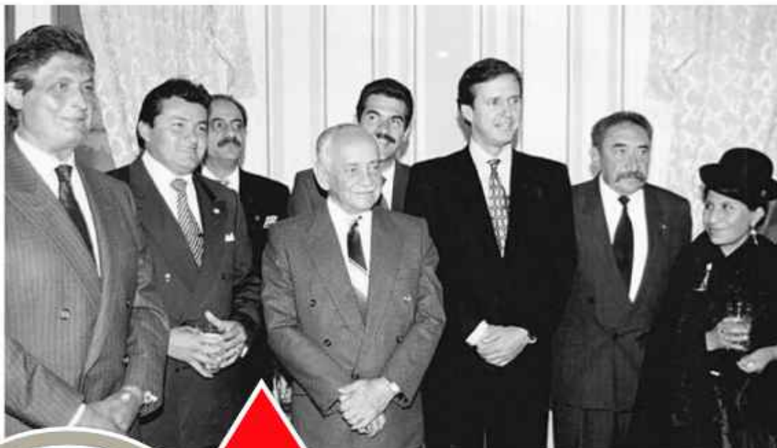
HITO. Banzer posa con políticos de la década de 1990.

En el año de su fundación, después del retorno a la democracia, el líder socialista Marcelo Quiroga Santa Cruz impulsó un histórico juicio de responsabilidades contra