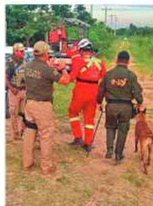
BÚSQUEDA. La Policía realiza un rastillaje.