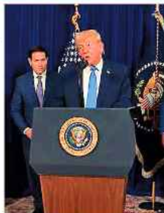
INFORME. El presidente estadounidense Donald Trump explica ayer los pormenores del ataque a Venezuela.

El ataque a Venezuela recibió la condena de Francia, Rusia, Brasil, México y Uruguay, mientras que otros países la aplaudieron, como Bolivia.