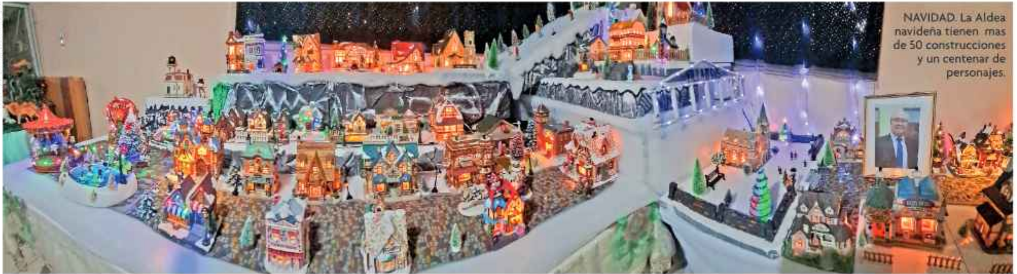
NAVIDAD: La Aldea navideña tienen mas de 50 construcciones y un centenar de personajes.

CUANDO LA NAVIDAD SE CONVIERTE EN UN LEGADO