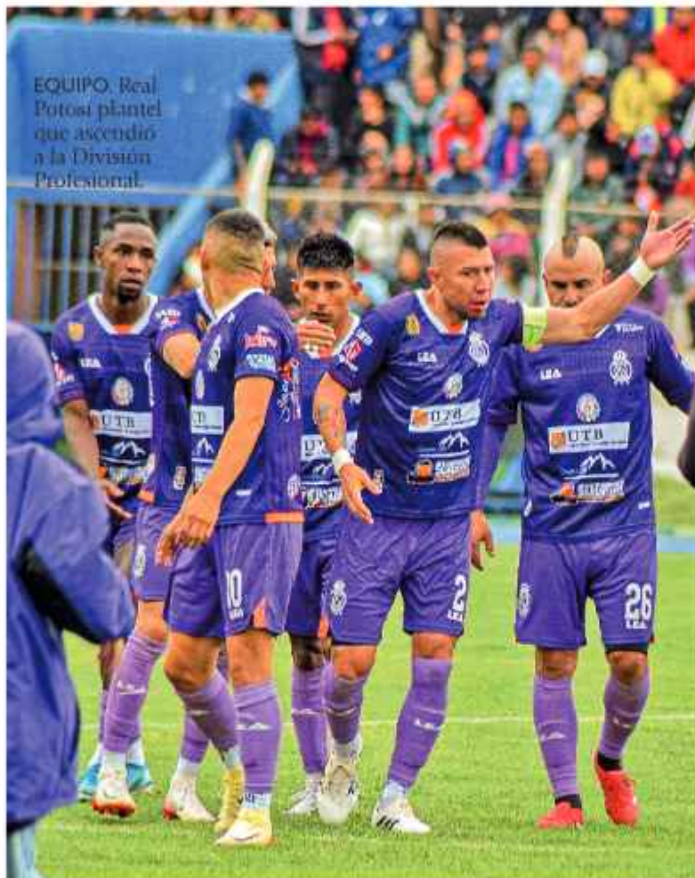
EQUIPO. Real Potosí plantel que ascendió a la División Profesional.

Para el campeonato largo está prevista la disputa de 30 fechas que se jugarán a lo largo de todo el año, mientras que el torneo corto se disputará por series y, posiblemente, más corto que el de la pasada temporada,