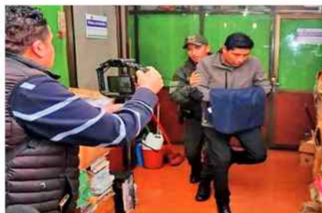
MEDIDA. La exautoridad fue aprehendida el pasado viernes.