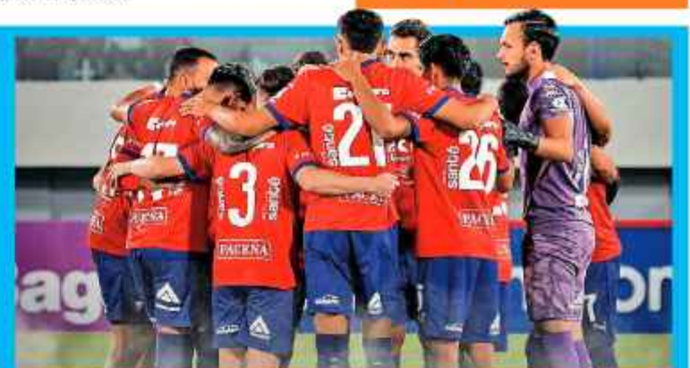
JUGADORES. El club Wilstermann jugará en la Primera A de la AFC.