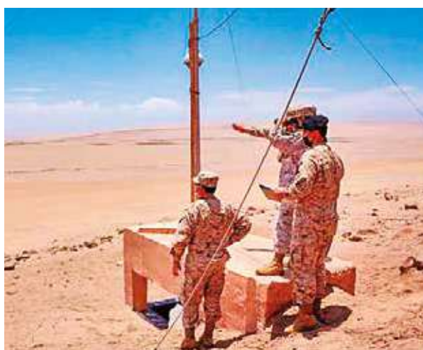
VIGILANCIA: Militares resguardan la frontera con Bolivia.

"El ingreso a territorio nacional se habría debido a un error al no contar con equipos tecnológicos que les permitieran determinar el lugar exacto en que se encontraban", refirió la fiscal.