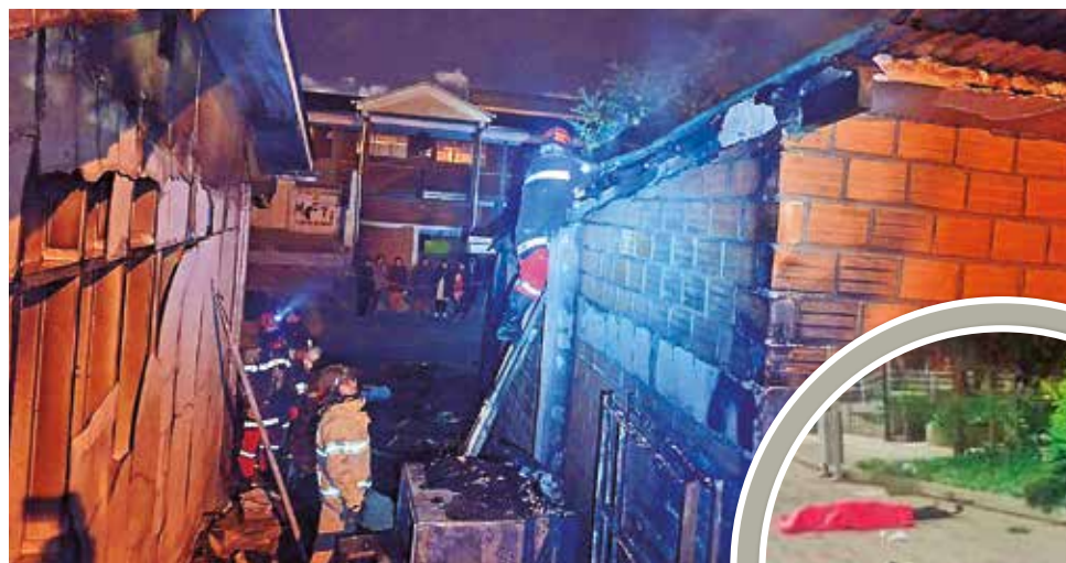
INCENDIO: Bomberos sofocan el incendio en una unidad educativa en la ciudad de El Alto.

En la ciudad de Cochabamba dos jóvenes de 20 a 30 años, aproximadamente, fueron atacados por dos