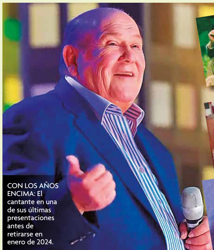
CON LOS AÑOS ENCIMA: El cantante en una de sus últimas presentaciones antes de retirarse en enero de 2024.