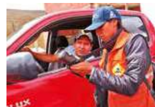
OPERATIVOS: Policías realizan controles de SOAT y la ITV

Las autoridades explicaron que el SOAT es una obligación