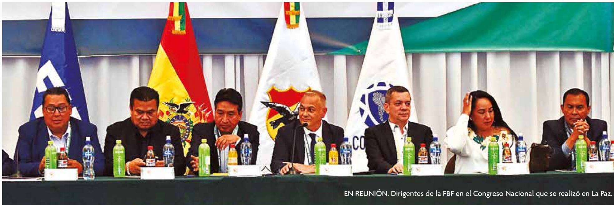
EN REUNIÓN. Dirigentes de la FBF en el Congreso Nacional que se realizó en La Paz.

> El registro de futbolistas se hará en dos periodos, el primero será el más largo del 1 de enero hasta el 21 de marzo.