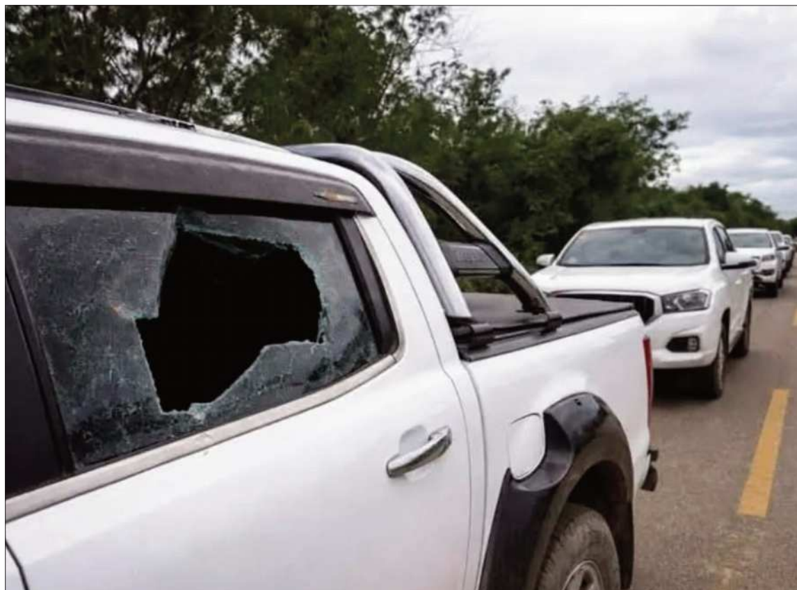
EMBOSCADA. Varios vehículos que se usaron para la intervención fueron atacados con piedras.

La caravana estaba conformada por al menos 10 vehículos