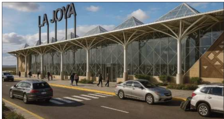
PROYECTO. Proyección de la nueva terminal aérea.

El proyecto contempla la edificación de una moderna infraestructura que incluye una caseta de control, parqueo vehicular, una moderna terminal de pasajeros, iluminación exterior, una torre de control, bloque técnico, instalaciones para el área de Bomberos y un sistema integral de control de incendios, entre otros componentes.