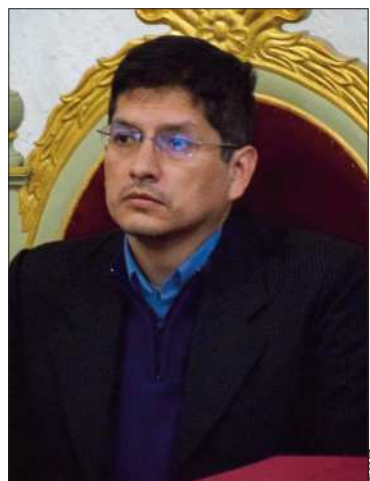
El magistrado del TCP, Boris Arias.

El TCP rechazó la inconstitucionalidad presentada por UCS