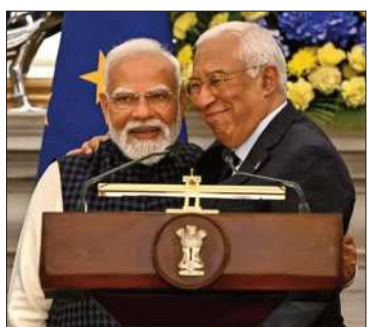
Formalizaron el acuerdo.

Este nuevo pacto busca proteger a ambas partes de la competencia china.