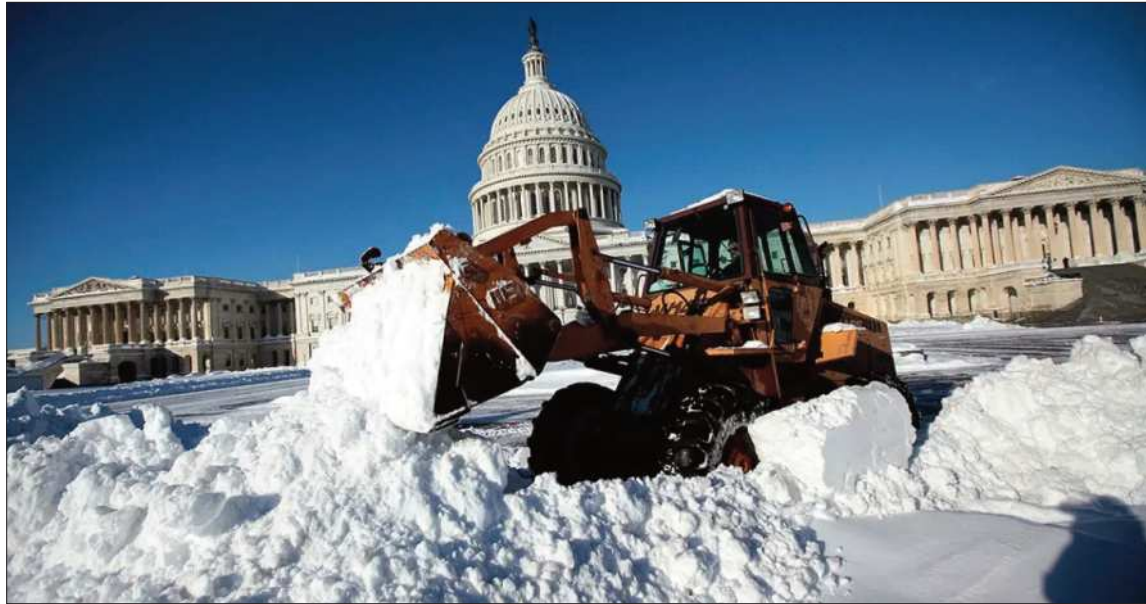
NEVADA. Los alrededores del Capitolio, en Washington están cubiertos por una densa capa de nieve.

En Misisipi más de 140.000 hogares se encuentran sin electricidad y en Tennessee son más de 175.000. El peso del hielo derribó las líneas eléctricas en ambos estados. En Luisiana suman más de 100.000 clientes con cortes eléctricos. La experta del servicio de meteorología nacional (NWS), Allison Santorelli, declaró a la AFP que la recuperación de esta tormenta fue particularmente ardua debido a la gran cantidad de estados afectados.