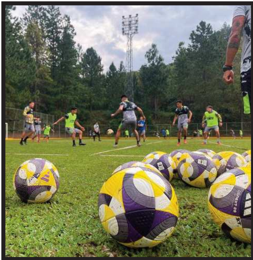
LLANEROS. Jugadores de Táchira en pleno entrenamiento en San Cristobal

En esos cotejos se dieron estos resultados, en los cuales igualó sin goles con Trujillanos F.C.; caída 2-1 ante Inter de Bogotá (Colombia); victorias 1-2 a Fortaleza F.C. (Colombia); 2-3 a Independiente Santa Fe (Colombia); 15-