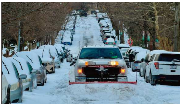
RIESGO. La nieve es más difícil de retirar de las calles y carreteras.

Extremo. La sensación térmica es de -45^{\circ}\text{C} en varios estados.