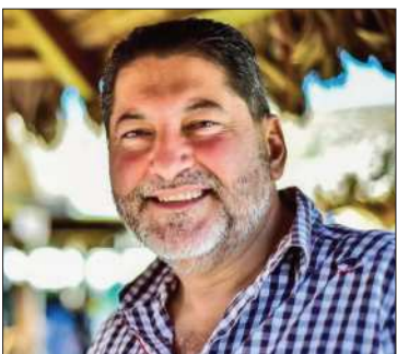
Un referente de la música cruceña

Estaba llevando a cabo un tratamiento pero no resistió a la enfermedad