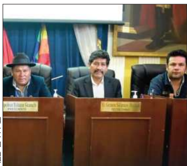
Miembros de la directiva de la ALD.

La remisión se realizó luego de subsanar algunas observaciones