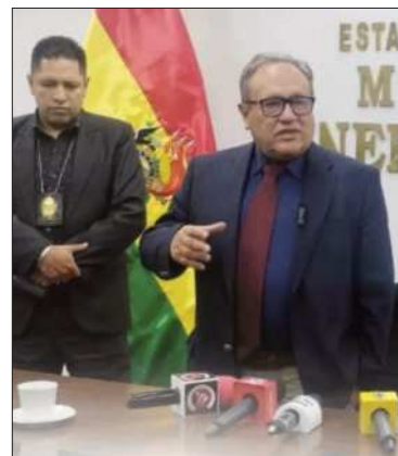
El ministro de Minería.

“Un precio alto no puede significar desorden. Debe traducirse en mayor control y una agenda de industrialización que genere valor agregado”, subrayó.