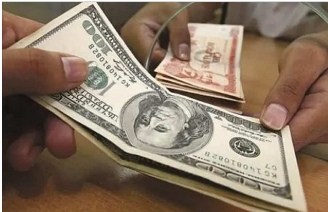
BENEFICIO. Los ahorristas pueden retirar sus ahorros en dólares hasta $us 1.000.

Aseguró que los ahorristas no están obligados a retirar sus recursos de inmediato y pueden hacerlo en cualquier momento. El objetivo del plan, afirmó, es dina-