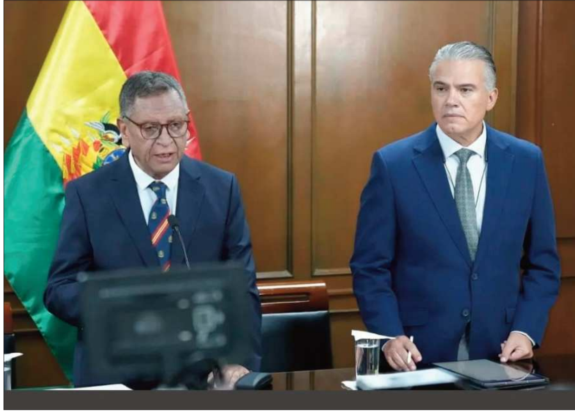
AUTORIDADES. Los ministros de Gobierno y de Sustancias Controladas, Marco Oviedo y Ernesto Justiniano.

El Ministerio de Gobierno añadió que realiza seguimiento a las actuaciones de la justicia,