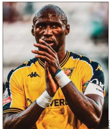
El francés Eliaquim Mangala.

Consultado sobre su presencia en el clásico ante Blooming, este domingo 1 de febrero, fue cauto. "He llegado un poco pronto, ahora ya es martes, pero veremos si para la vuelta estoy listo", indicó.