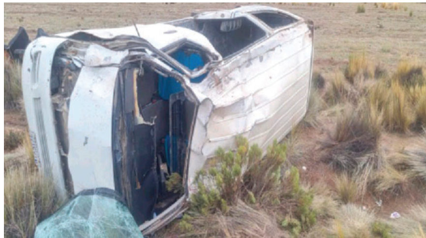
Tras el vuelco del minibus, 12 pasajeros resultaron heridos

Uno de los hechos más violentos es el que se reportó en la carretera Huari-Sevaruyo el 22 de enero de