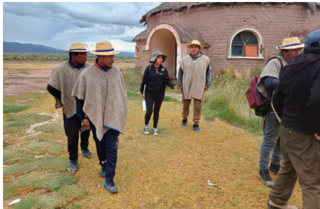
El circuito busca dar nuevas fuentes de ingreso a comunarios afectados por la sequía del lago Poopó