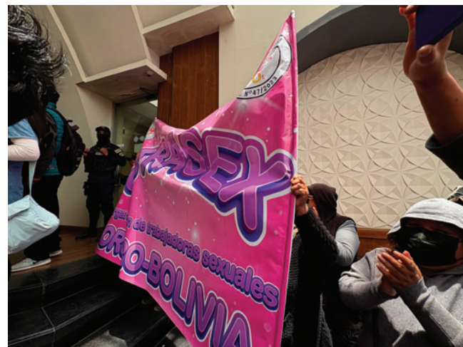
Otrasex pide consenso para el traslado de las casas de tolerancia

Las trabajadoras sexuales demandan ser parte activa del proceso de decisión y que se retome el diálogo para consensuar una ubicación que no afecte sus condiciones de trabajo ni su seguridad.