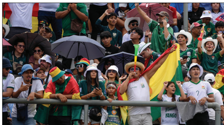
La afición deportiva del país no pierde la esperanza de clasificar al Mundial

A diferencia de las demás posiciones en la formación, Villegas no cuenta con un delantero con roce internacional y que sea referente en este momento. La actuación de