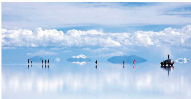
El salar de Uyuni en Potosí, uno de los lugares más visitados de Bolivia

Ampuero señaló que la subida de las tarifas aéreas genera dificultades para el sector, especialmente en un contexto en el que se buscaba impulsar el turismo a través de medidas como los feriados largos. Indicó