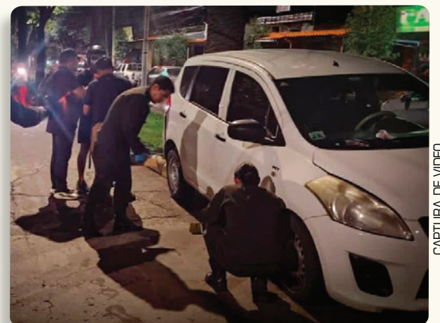
CAPTURA DE VIDEO