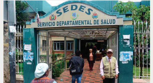
Instalaciones del Servicio Departamental de Salud de Cochabamba