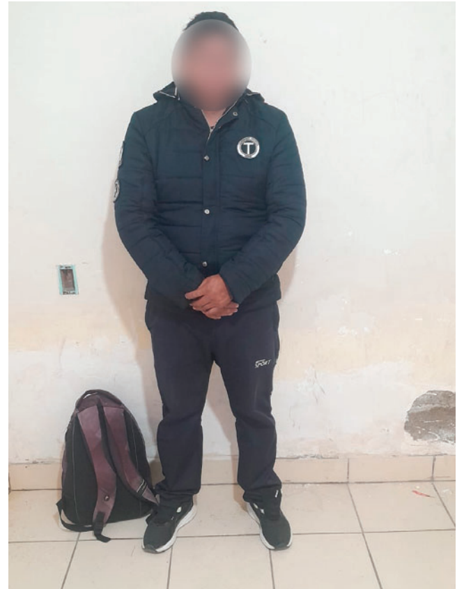
El funcionario fue encarcelado en San Pedro

Agregó que, en audiencia de medidas cautelares, la justicia dispuso su reclusión en el penal de San Pedro por un mes mientras las investigaciones continúan.