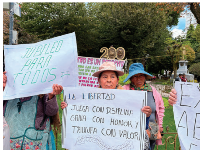
Familiares alertaron sobre el deterioro de salud de los huelguistas al interior del penal

También denunciaron que la atención sanitaria dentro del recinto sería insuficiente y que, en algunos casos, los propios privados estarían auxiliando a los huelguistas ante la falta de personal médico.