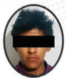
Nombre: R. B. R. Edad: 18 AÑOS