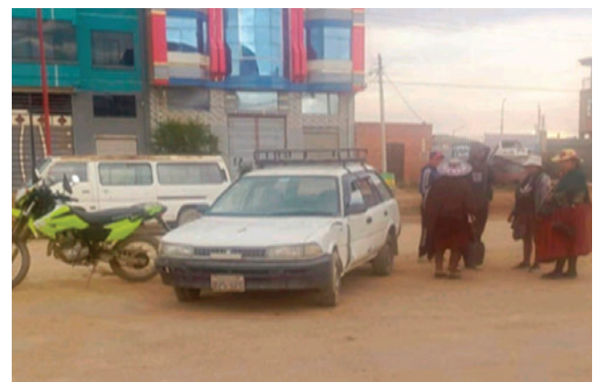
El grave incidente se registró el domingo por la tarde