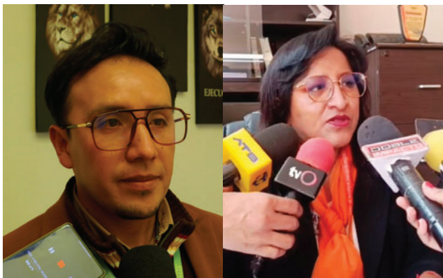
El fiscal Montaña y la titular de la DIO, Gutiérrez se pronunciaron sobre el caso

El conserje del Centro de Acogida Gota de Leche fue enviado a la cárcel de San Pedro con detención preventiva, imputado por el delito de estupro con agravante, tras mantener una relación sentimental con una adolescente de 15 años, quien se encuentra en situación de acogida