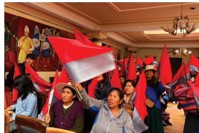
Agrupación respalda la repostulación del alcalde

“Estamos hablando de una inversión de entre 17 y 18 millones de dólares. La pregunta es de dónde se van a sacar esos recursos”, señaló, aunque afirmó que, de no ser reelecto,