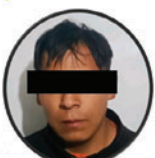
Nombre: J. A. Y. Edad: 26 AÑOS