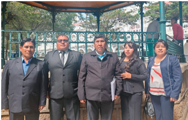
Desde La Joya llegaron a presentar su denuncia en Oruro