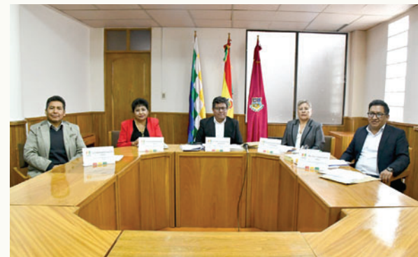
Nuevo directorio del TED Oruro fue presentado oficialmente