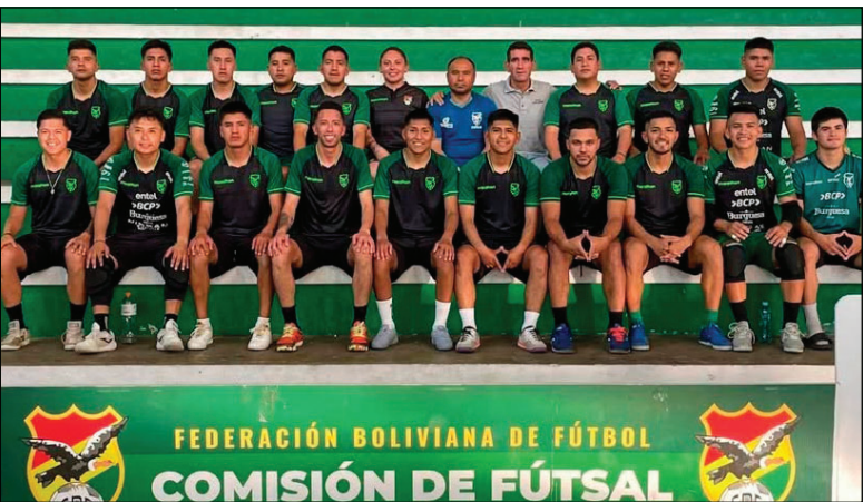
El equipo boliviano que participa en la Copa América de Futsal

cación. Bolivia, sin unidades, quedó sin posibilidades y solo aspira a cerrar con dignidad. La eliminación temprana obliga a la Verde a replantear su estrategia en los partidos restantes. El objetivo ahora será evitar el último lugar de la tabla y demostrar que, pese a los resultados, el equipo puede competir con carácter y orgullo. La jornada también tuvo la goleada de Perú 5-1 sobre Ecuador, resultado que consolidó a los peruanos como líderes del Grupo “A” con puntaje perfecto. Argentina y Uruguay