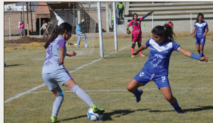
No hay fecha definida para el inicio del campeonato de fútbol femenino

De este certamen surgen los equipos clasificados a la Liga Nacional Femenina, torneo en el que participan clubes profesionales. En el caso de Oruro, los representantes profesionales son GV San José y CDT Real Oruro, a ellos se suman otros dos clubes.