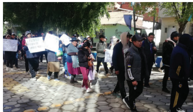
La marcha de este lunes

Asimismo, advirtió que muchas familias que subsisten día a día en Huanuni no cuentan con recursos suficientes para cubrir la canasta familiar y que la falta de empleo pone en riesgo la continuidad de los estudios de sus hijos.