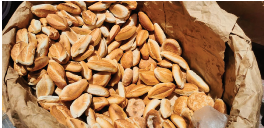
El pan ahora se vende en 60 y 80 centavos

Por su parte, desde el GAMO se ratificó que el nuevo precio del pan no se encuentra normado, por lo que