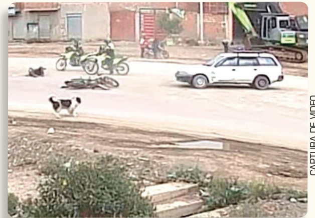
CAPTURA DE VIDEO