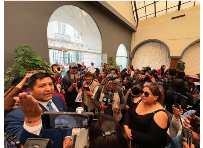
Trabajadoras sexuales se movilizaron para exigir una audiencia con el alcalde

Ante la falta de audiencia, las representantes de Otrasex advirtieron que continuarán con medidas de presión hasta ser escu-