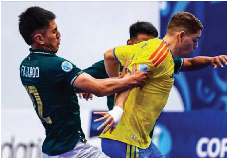
Una acción del partido en el cual Bolivia perdió ante Colombia

El torneo, por su parte, empieza a perfilar a sus candidatos más sólidos. Perú, con un ataque contundente y defensa ordenada, se erige como el gran favorito del Grupo “A”; Venezuela, con su triunfo sobre Chile, se posiciona como la revelación del campeonato. Brasil, siempre candidato, mantiene su jerarquía y experiencia. Argentina y Uruguay, aunque con altibajos, siguen en carrera y podrían sorprender en la recta final. La Copa América de Futsal 2026 entra en su fase decisiva. Los equipos líderes buscan asegurar su pase a semifinales, mientras los rezagados luchan por no quedar en el fondo. El torneo tendrá jornada de descanso este martes, la competencia se reanuda el miércoles, pero en esa jornada, Bolivia tendrá descanso, recién el jueves jugará su último partido de esta primera fase del campeonato, frente a Venezuela.