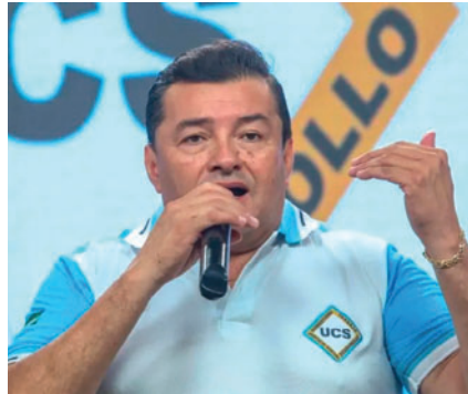
El partido de Jhonny Fernández no logró superar el 3% en las elecciones generales

El presidente del órgano electoral, Gustavo Ávila, señaló de manera reiterada que cualquier determinación debía basarse en la resolución constitucional correspondiente.