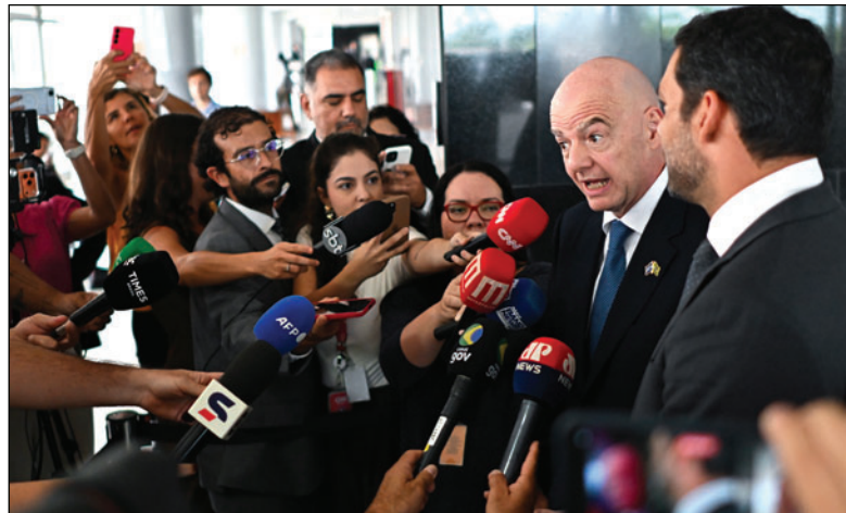
Infantino, después de la reunión con el presidente de Brasil, Lula da Silva

El próximo Mundial de fútbol femenino tendrá lugar entre el 24 de junio y el 25 de julio de 2027 y contará con la participación de 32 selecciones nacionales. Ocho ciudades brasileñas acogerán los partidos de la gran cita: Belo Horizonte, Brasilia, Fortaleza, Porto Alegre, Recife, Río de Janeiro, Salvador y São Paulo. Nueva Zelanda, será la defensora del título.