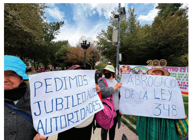
Familiares de privados de libertad exigen ley de jubileo

sentantes señalaron que la protesta también visibiliza el hacinamiento en el penal, donde varios internos duermen en pasillos, baños o duchas.