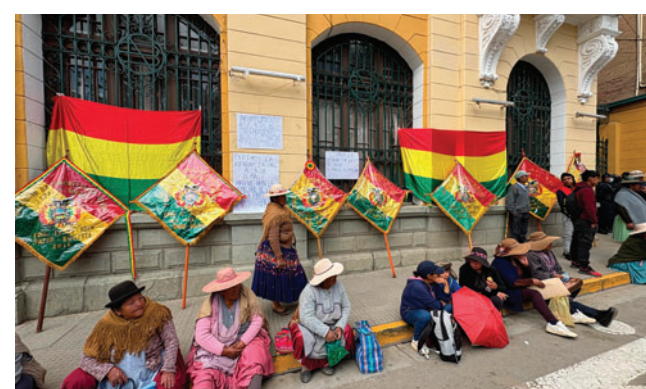
Comerciantes del mercado Max Fernández se movilizaron en puertas de la Alcaldía

También se acordó controlar el avance de productos en las tiendas para adecuarse a la normativa municipal vigente e inspeccionar sectores específicos respecto a solicitudes para instalar anaqueles.