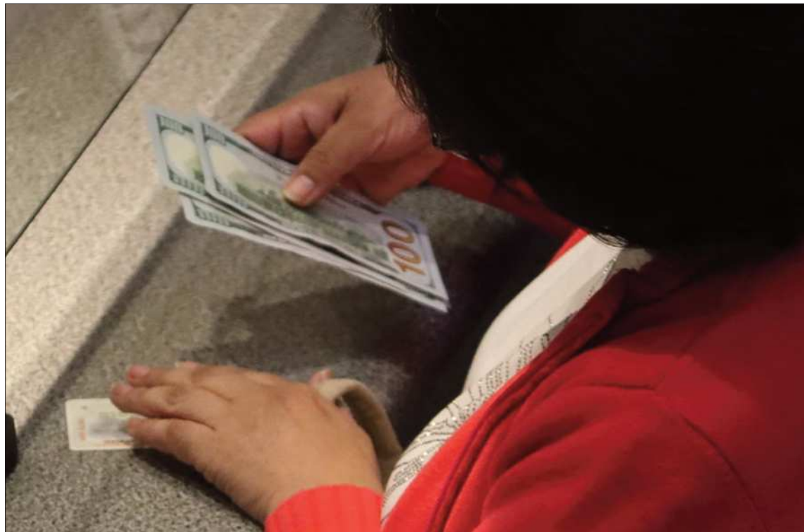
AHORROS. Tras el incremento de las divisas, el Gobierno permite nuevamente el retiro de dólares.

“Casi el 30% de este Estado tranca está empezando a desaparecer porque estamos descubriendo ítems fantasmas, gran cantidad de trabajos que no existían y