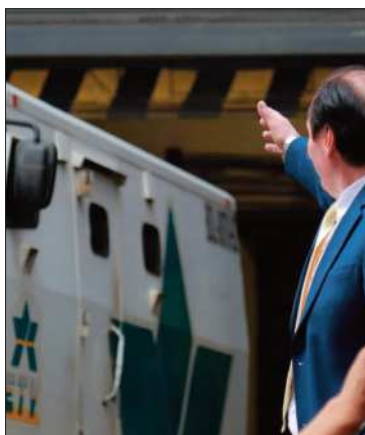
Camiones blindados llevan dólares.

La devolución beneficia también a 20.000 pequeñas empresas