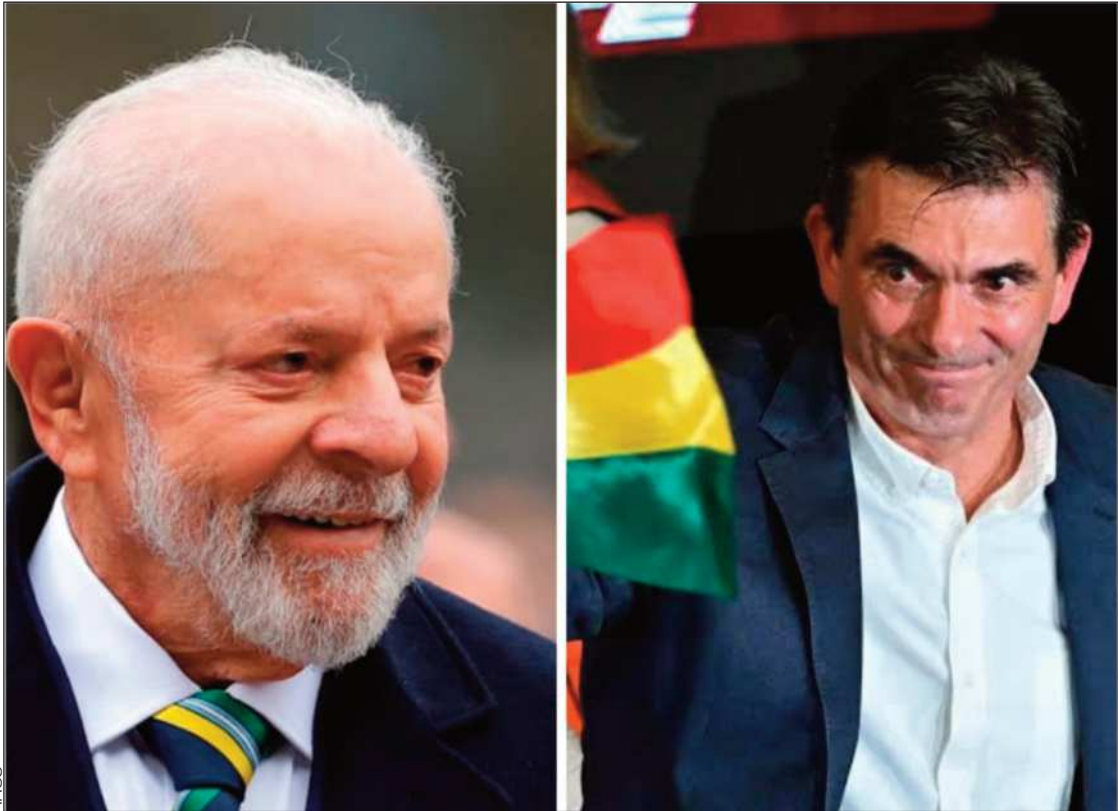
PRESIDENTES. El presidente de Brasil, Luiz Inácio Lula da Silva, y el presidente de Bolivia Rodrigo Paz.