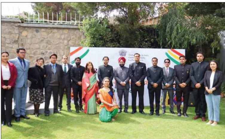
ENCUENTRO. Personal diplomático de ambos países compartiendo.

La flamante embajada del gigante asiático organizó dos eventos para festejar