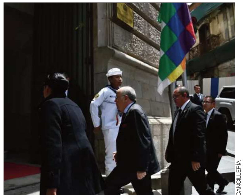
VISITA. El canciller de Brasil ingresa a la Cancillería de Bolivia en La Paz.