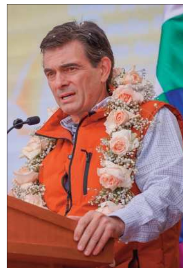
El Presidente estuvo en Potosí.

En ese marco, comparó la situación con un conflicto vecinal e indicó que si uno le golpea a su vecino y el policía no hace nada, “de seguro que ese vecino que tenía su platita se va a ir del barrio. Eso pasa con las regiones donde se bloquea”. Remarcó que la migración interna y la inversión se están desplazando hacia el oriente del país, donde no existen menos bloqueos. “Nuestros hermanos potosinos, orureños y chuquisaqueños se van al oriente, porque fluye más la economía”, dijo.