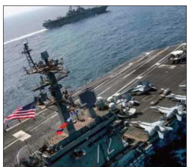
El USS Abraham Lincoln.

La medida fue aplicada en medio de una fuerte tensión con Irán.