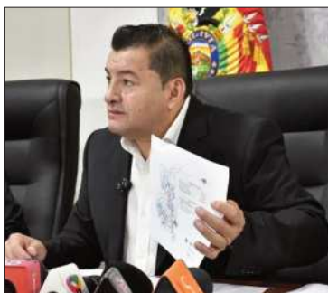
Jhonny no logró apoyo del TCP.

La Unidad Cívica no logró el 3% en las elecciones y perderá su personería