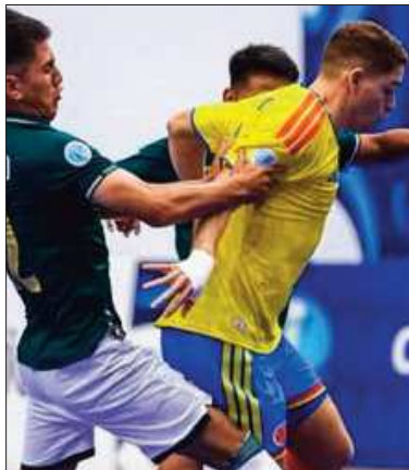
Incidencia del Bolivia-Colombia.

Sin embargo, según su ubicación final, aún no está del todo claros los detalles y otros aspectos relacionados al trato.