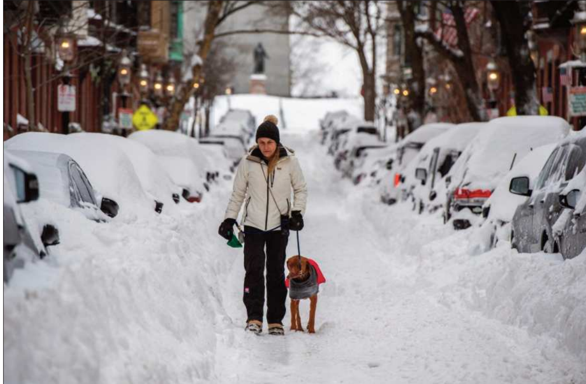
NEVADAS. Una mujer pasea con su mascota en una calle cubierta de nieve en Boston.

Considerada por algunos expertos como uno de los peores fenómenos meteorológicos invernales de las últimas décadas en Estados Unidos, la tormenta viene acompañada de acumulacio-