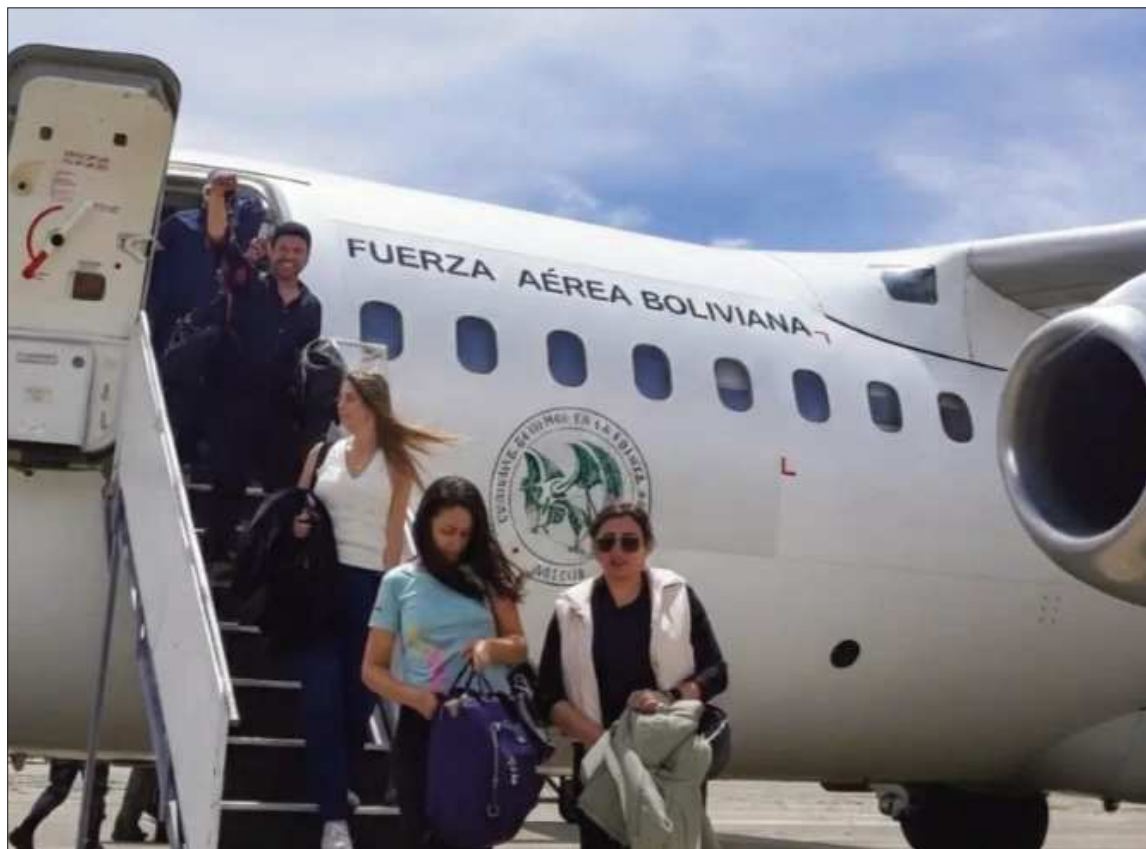
TURISMO. Pasajeros arriban al aeropuerto de la ciudad de El Alto.

El nuevo tarifario contempla incrementos en 17 rutas nacionales. En el tramo La Paz-Santa