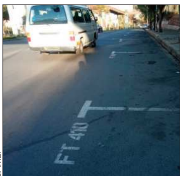
Parqueos tarifados en La Paz.

El alcalde paceño enfatizó que no dará marcha atrás en el proyecto