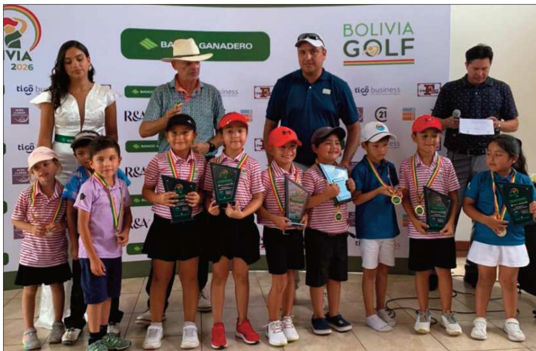
DISTINGUIDOS. La premiación de la categoría de los niños y niñas fue una de las más emotivas.