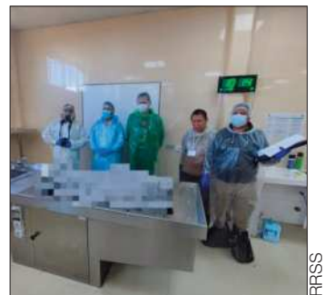
La víctima en la morgue.

Asimismo, confirmó que la autopsia determinó que las víctimas recibieron entre tres y cuatro impactos de arma de fuego cada una, los cuales fueron fatales para la niña.