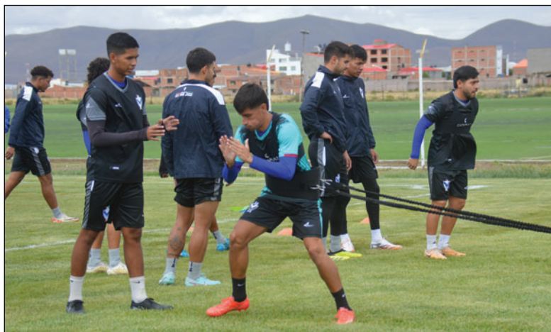
La plantilla de jugadores no descuida su trabajo de preparación

De cara a la temporada 2026, Rivas buscará mantener la solidez defensiva del equipo y contribuir a