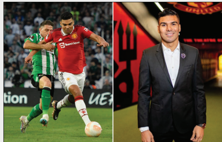
Casemiro dejará el Manchester United a fines de junio de este año

Sin embargo, su alto contrato, uno de los más grandes del club, impedían que una renovación fuera posible. El pasado sábado en el derbi de Manchester que finalizó con triunfo del United por 2-0, el brasileño fue elegido figura del partido.