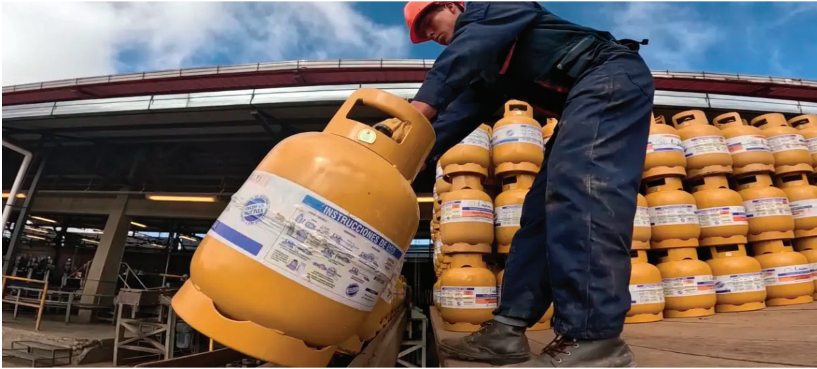
El despacho se incrementó de 144.000 a 152.000 garrafas diarias entre diciembre de 2025 y enero de 2026, según el reporte