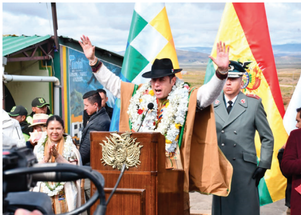
El vicepresidente en el acto de aniversario de la creación del Estado Plurinacional

De manera paralela, distintas organizaciones sociales y sectores afines al expresi-