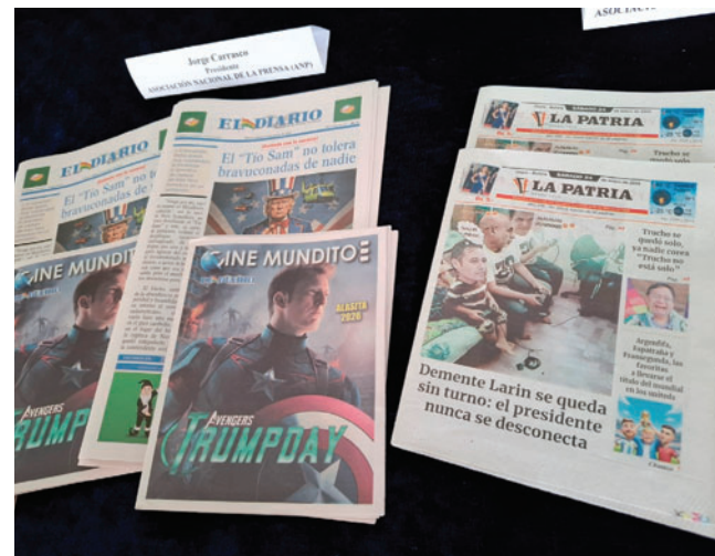
LA PATRIA estuvo presente en la presentación de periodiquitos

“Los periódicos de Alasita son la muestra de la libertad de expresión en versión de humor, que es otra faceta graciosa y necesaria para salir de la rutina”, comentó el director