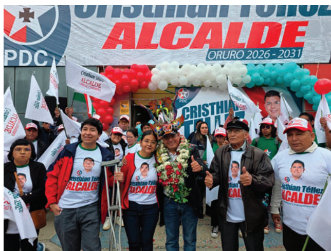
Inauguración de la Casa de la Victoria del PDC

Durante el acto, Téllez explicó que su propuesta busca dejar atrás la impro-