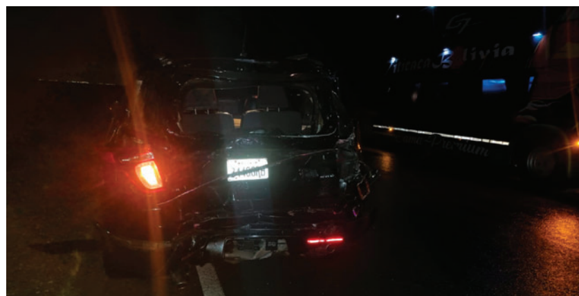
Dos ocupantes de la vagoneta resultaron heridos