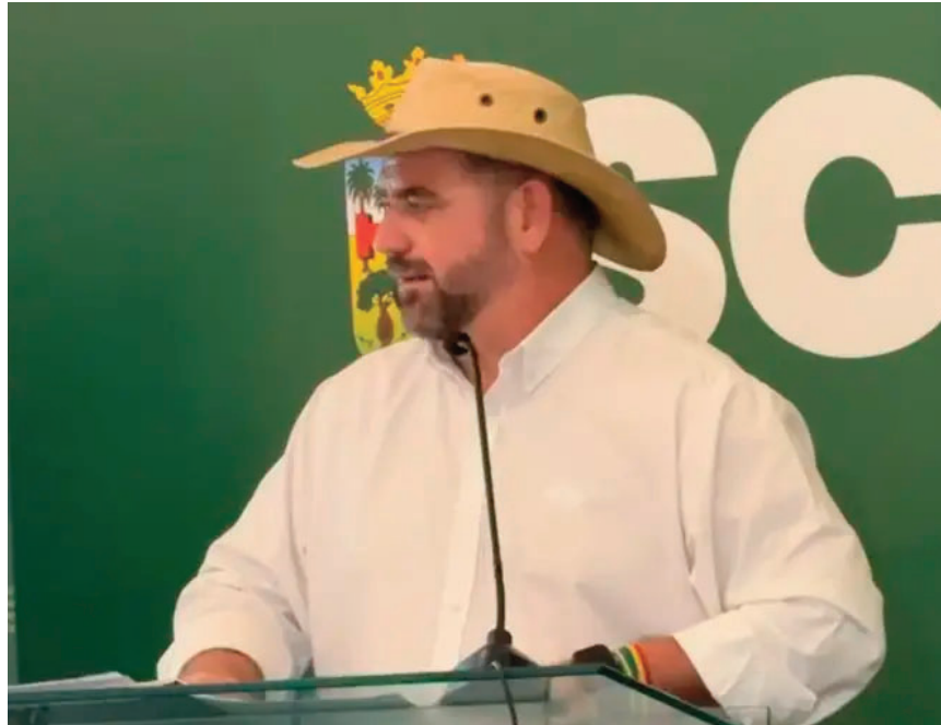
El presidente de la CAO resaltó que el problema de avasallamiento de tierras es en todo el país

“Cuando se avasalla una propiedad, no solo se invade la tierra,