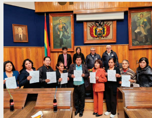
10 nuevos trabajadores eventuales ahora son parte de planillas de la UTO