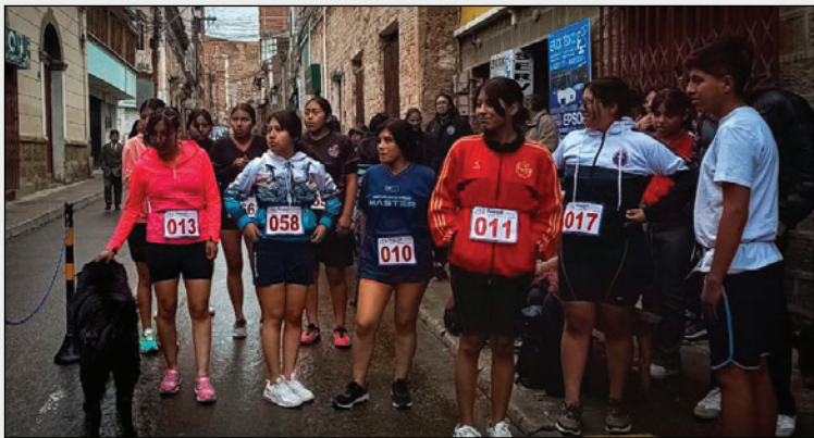
Deportistas de diferentes edades participaron en la prueba de acuatlón

La competencia se dividió en categorías por edad, con distancias diferenciadas para fomentar el aprendizaje y la participación. Los niños de 5 a 9 años corrieron 200 metros y nadaron 25; los de 10 a 12 años completaron 800 metros de