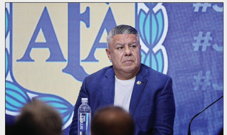
Claudio Tapia titular de la AFA hizo conocer la decisión mediante un boletín

La retirada de las sanciones resuelve una situación polémica desatada a fines de noviembre, cuando jugadores de Estudiantes de La Plata se negaron a homenajear con un 'pasillo del campeón' a sus pares del Rosario Central antes del encuentro entre ambos equipos por el Torneo Clausura.