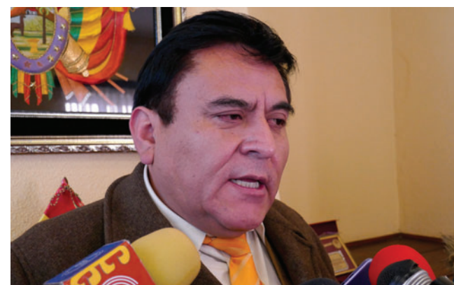
El fiscal Morales señaló que el pasante fue desvinculado tras conocer su denuncia por violencia de género

Tras este hecho, Morales apuntó que desde la fecha se verificará los