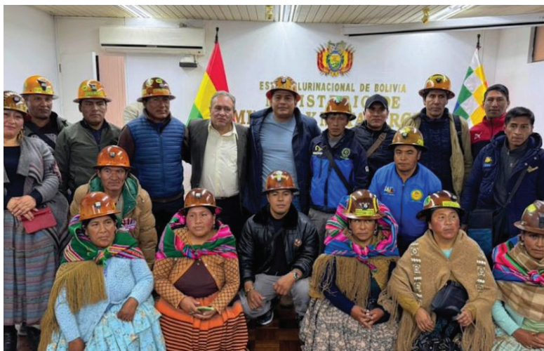
Reunión del Ministerio de Minería con cooperativas auríferas de La Paz.