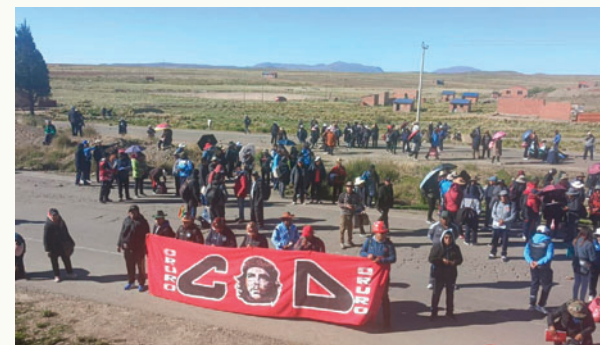
APDH cuestiona bloqueos que afectan a la ciudadanía