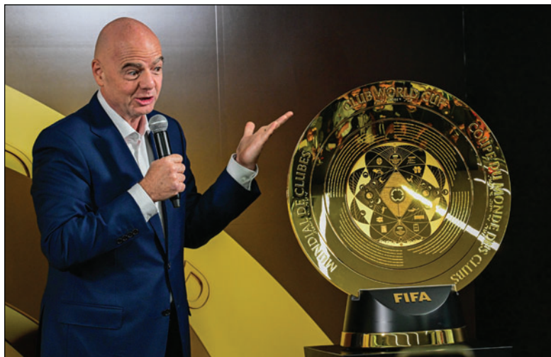
Gianni Infantino, presidente de la FIFA, durante el foro económico de Davos

"Este trofeo lo entregaré al campeón con el presidente de Estados Unidos. Nadie puede tocarlo, solo los que lo ganan o yo. Cuando yo era más joven, y comprendí que mis habilidades no me iban a permitir tocarlo, decidí que tenía que buscar otra forma de hacerlo y convertirme en presidente de la FIFA".