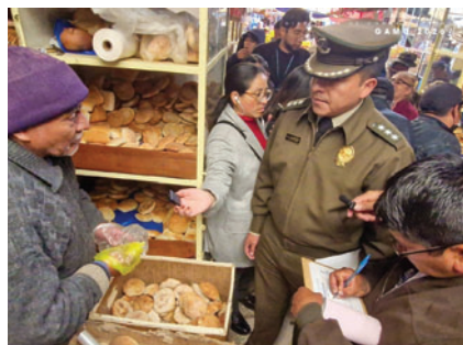
Operativo se realizó en el Mercado Campero

“En este operativo se evidenció que el peso del pan oscilaba entre 50 y 55 gramos, cuando la normativa establece un peso mayor. Por ese motivo se procedió a emitir los comparendos correspondientes”, explicó la autoridad.