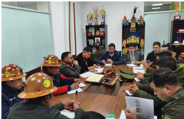
Distintas autoridades fueron parte de la reunión en busca de soluciones contra el juqueo

instancias competentes, como la Gobernación y otros organismos involucrados en el sector minero. Se espera que las medidas acordadas contribuyan a reducir el robo de mineral, un problema que ha afectado significativamente a la