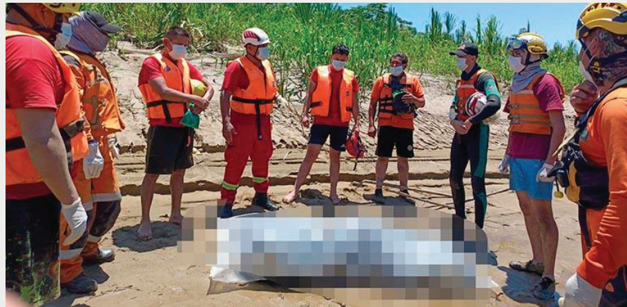
Rescatistas encontraron el cuerpo del menor de 15 años /SAR-BOLIVIA FILIAL COCHABAMBA.

Las autoridades reiteraron el llamado a la población a extremar precauciones, especialmente durante la temporada de lluvias, cuando los ríos incrementan peligrosamente su caudal.