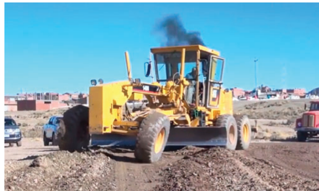
El asfaltado Caracollo-Cañohuma contempla la ejecución de 19 kilómetros de tratamiento superficial doble

dificultades para mantener el ritmo de trabajo.