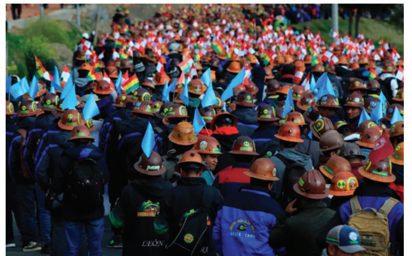
Acuerdan trabajar en minería sostenible con los cooperativistas mineros

Se subrayó que el fortalecimiento de la coordinación institucional contribuye a mejorar los