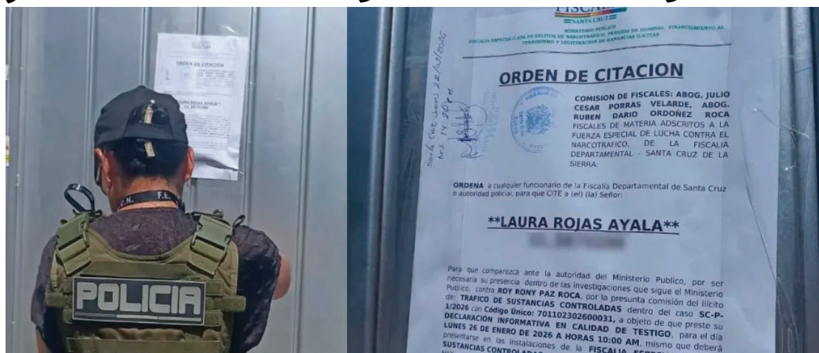
La exdiputada y candidata a concejal será interrogada el 26 de enero

El fiscal señaló que Rojas no es investigada en el caso de tráfico de sustancias controladas,