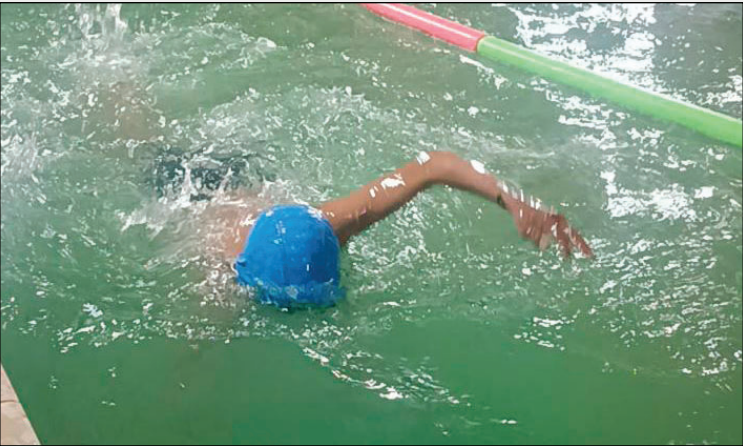
El duatlón es una prueba que combina natación y atletismo

Al tratarse de un festival para novatos, no se entregaron premios, pero todos los participantes recibieron medallas de reconocimiento, en un gesto que valoriza el esfuerzo y motiva la continuidad en el deporte. El acuatlón, como disciplina formativa, se consolida así como una herramienta clave para cultivar el interés de las nuevas generaciones en el triatlón, y el Club Neptuno se posiciona como referente en esta labor.