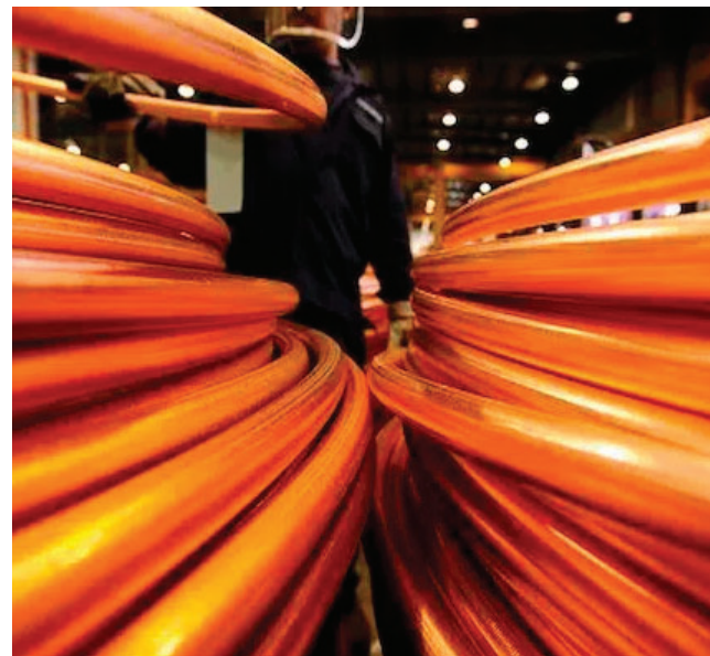
Según el analista, el reciente repunte de los metales industriales estuvo impulsado principalmente por factores externos y no por cambios en los fundamentos de oferta y demanda /rumbominero.com

El ajuste en los precios se produjo luego de que Trump descartara el uso de la fuerza militar para tomar Groenlandia y se retractara de los aranceles que había amenazado imponer a países europeos. Estas medidas habían elevado la incertidumbre geopolítica y favorecido un rally en las materias primas.