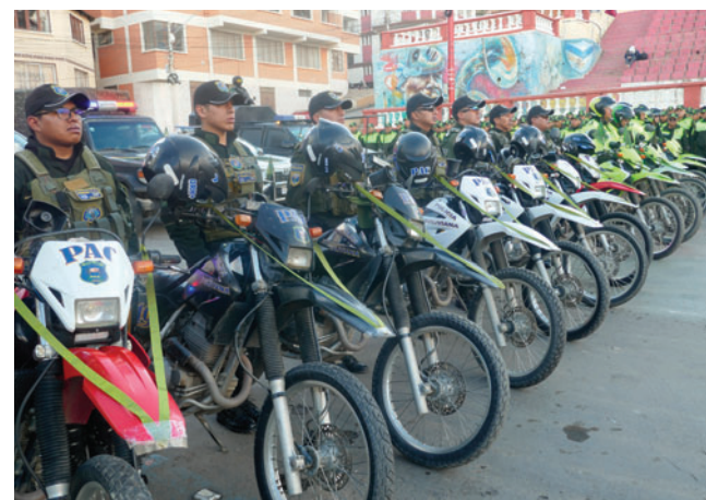
Cerca de 2 mil policías estarán destinados a tareas de prevención

Asimismo, precisó que agentes de la Policía Forestal y de Preservación del Medio Ambiente (Pofoma) efectuarán operativos de control para evitar que los danzarinés utilicen en sus trajes derivados de fauna silvestre.