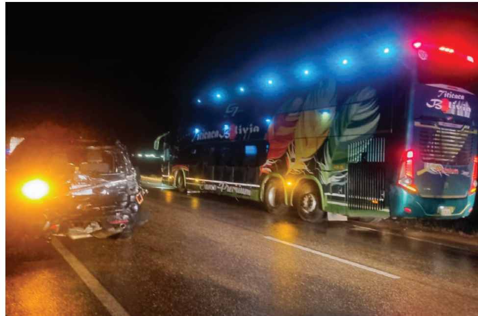
Presumen falta de precaución de ambos conductores