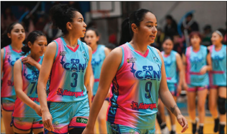
Las integrantes de CAN tienen como premisa ganar a Club Tennis La Paz

cería a Carl A-Z, que el sábado enfrentará un duro compromiso frente a Universitario de Tarija. Alemán, mientras tanto, tendrá descanso debido a la decisión de Leones de retirarse del campeonato.