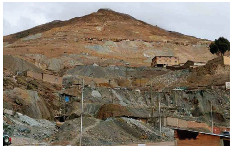
Buscan eliminar el robo de mineral en el Cerro Rico de Potosí

Las autoridades han señalado que es fundamental establecer un marco operativo claro para enfrentar esta problemática. Las acciones preventivas incluirán operativos coordinados entre las diferentes