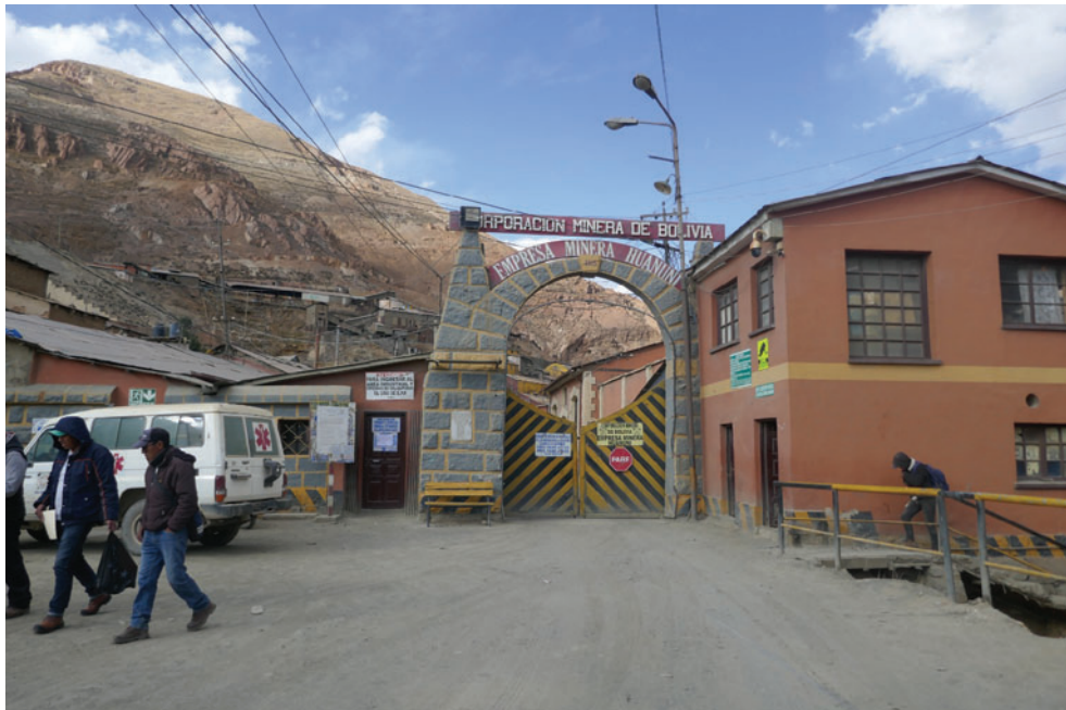
Evaluarán la situación económica y técnica de la EMH /LA PATRIA

ciones efectivas para combatir esta problemática.