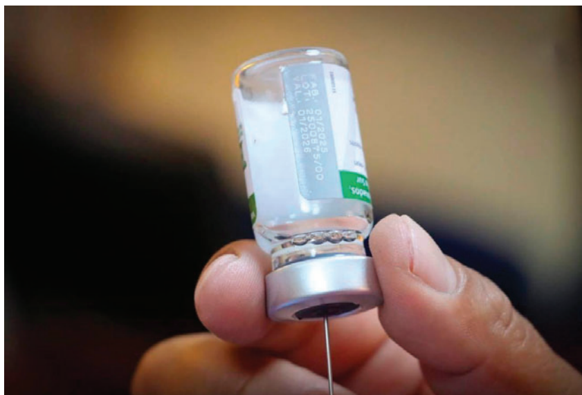
Vacunas contra la influenza aún no llega