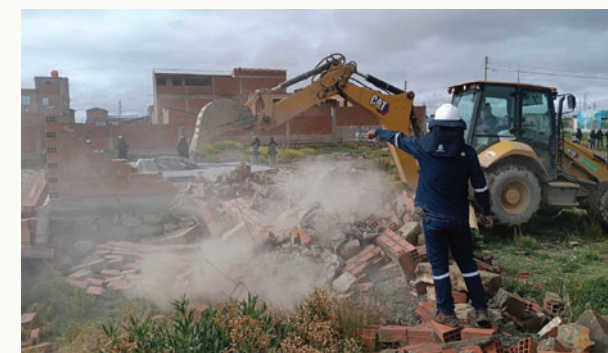
Construcciones clandestinas en la urbanización Ampliación San Isidro fueron demolidas

El objetivo es resguardar el patrimonio municipal en el marco del ordenamiento territorial y la planificación urbana de la ciudad.