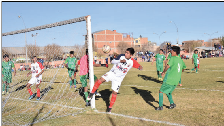
Varios equipos todavía tienen que regularizar su documentación

El certamen corresponde a la temporada 2025 y ofrece premios a los dos primeros lugares, con la clasificación a la Copa "Simón Bolívar" de este año. En representación de Oruro, ya se encuentran seis clubes clasificados desde el torneo de la AFO categoría Primera "A", lo que convierte al campeonato provincial en un paso clave para ampliar la representación departamental en el certamen nacional.