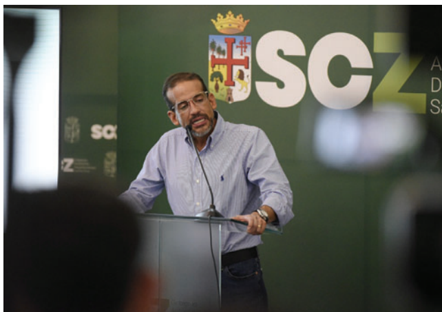
El gobernador cruceño en el encuentro de ayer

en pocas horas se comenzará a desalojar a los responsables de estos hechos. “Hay un compromiso, un plan claro y estratégico que va a permitir liberar a Santa Cruz”, indicó.