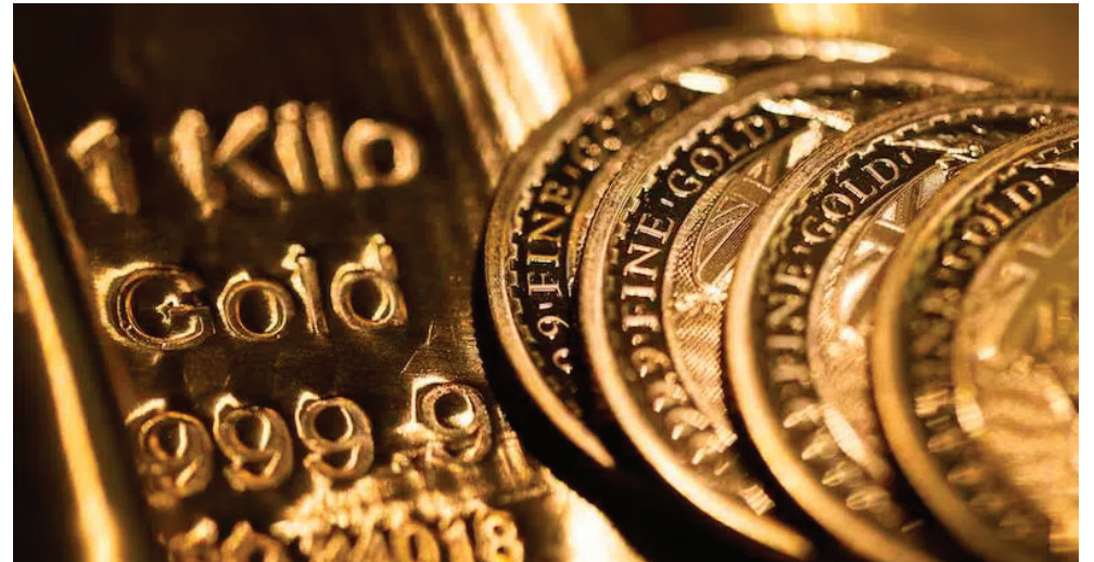
Pese al ajuste de corto plazo, las proyecciones se mantienen positivas. Analistas del mercado estiman que el oro podría superar los US$ 5.000 por onza

Según analistas del mercado, el retroceso responde al regreso del apetito por el riesgo y a una leve recuperación