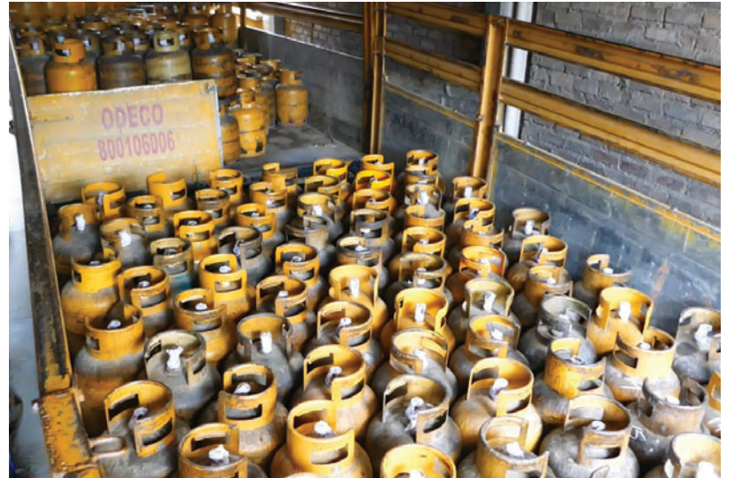
Garrafas de GLP

“Extremamos esfuerzos logísticos y operativos necesarios para que el GLP llegue a los hogares de las familias bolivianas. La apertura de nuestras plantas de recepción, almacenaje y despacho de GLP está garantizada, pues traba-