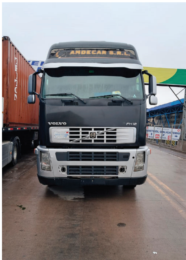
El tractocamión fue secuestrado como parte de las investigaciones preliminares