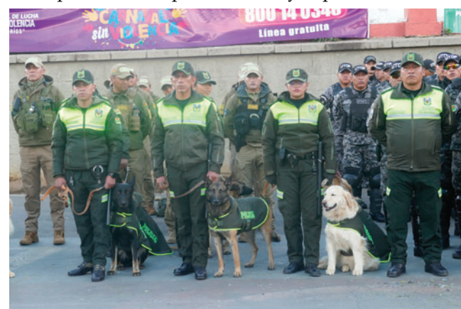
El operativo busca garantizar un ambiente de paz y seguridad

de Oruro, la Dirección de Igualdad de Oportunidades, la Cruz Roja Boliviana Filial Oruro y el Servicio Departamental de Salud.