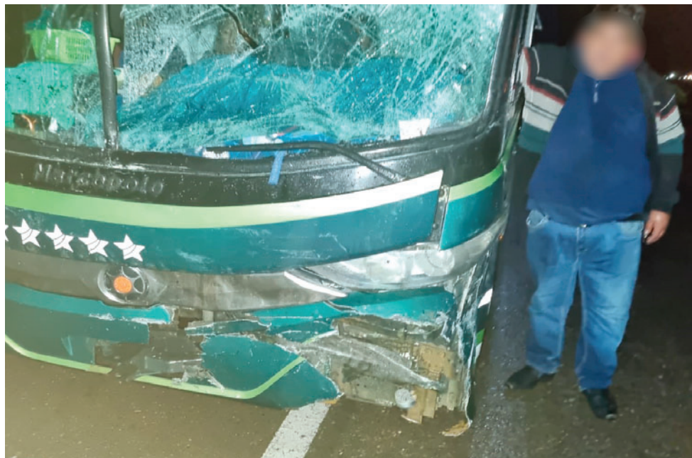
La colisión se registró en la carretera Oruro-La Paz