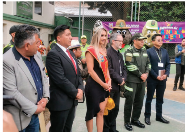
Presentación del Plan de Seguridad para el Carnaval de Oruro 2026

los principales ejes del plan se encuentran el control del orden público, la seguridad ciudadana, la regulación del consumo de bebidas alcohólicas, la atención médica oportuna y la organización del flujo vehicular y peatonal