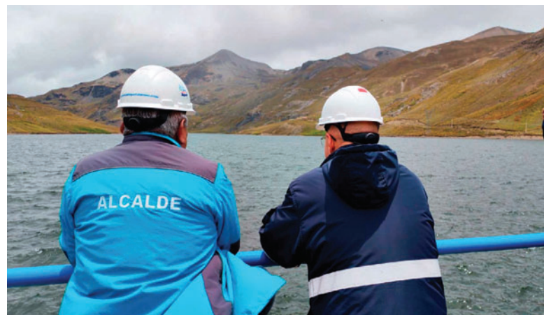
Las autoridades realizaron una inspección de las represas que proveen a la ciudad

Las autoridades también afirmaron que se están tomando previsiones ante posibles contingencias, como eventuales rebalses, con el fin de prevenir afectaciones y garantizar la seguridad del sistema de abastecimiento de agua potable en la ciudad.