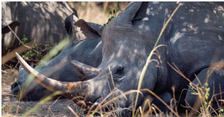
Los animales podrán vivir libres tras su reinsertión