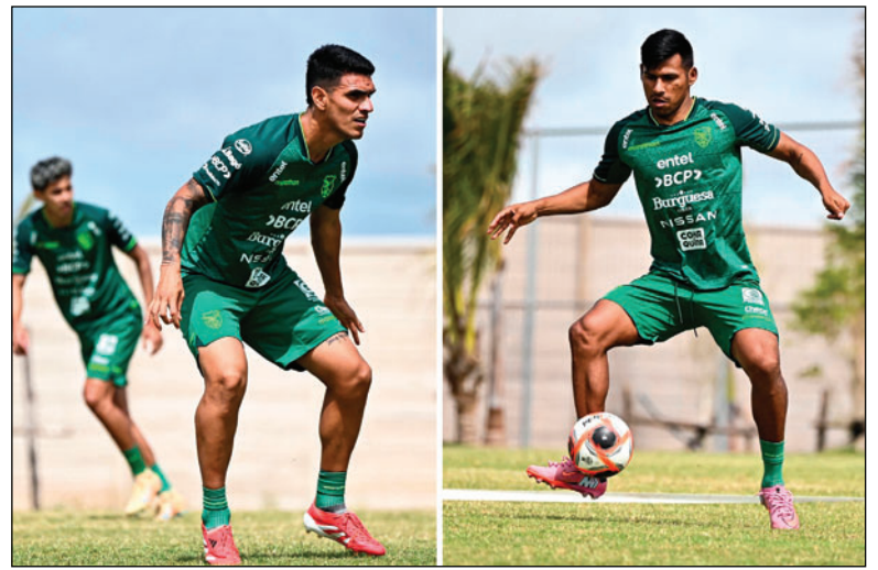
Los convocados demuestran sus condiciones en cada práctica