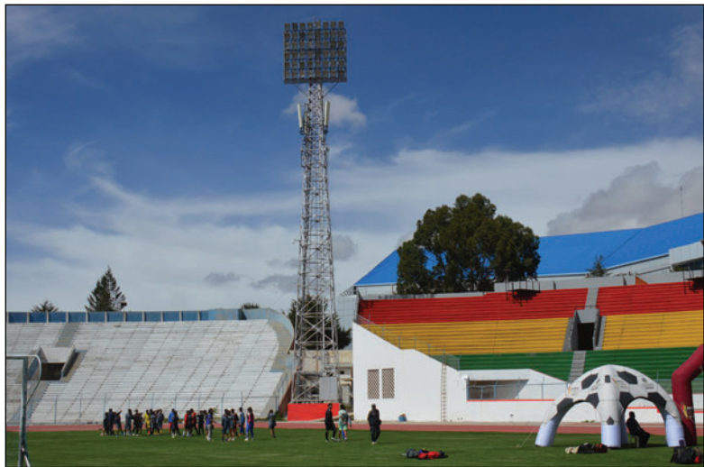
Las luminarias siguen siendo una cuenta pendiente en la Gobernación

Aseguró que el tema de las luminarias no está siendo descuidado y que se le da el seguimiento correspondiente, aunque reconoció que el cambio de Gobierno complicó el panorama. Paralelamente, el titular del Sedede explicó que se ejecutan otros trabajos de refacción en el estadio con recursos propios, en-