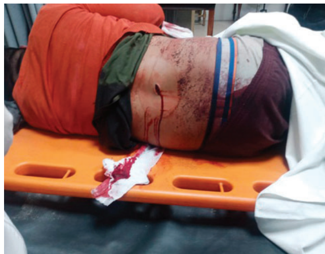
La víctima resultó herida tras ser apuñalado en la espalda

de manera conjunta en la agresión y posterior robo. "Uno lo apuñala, el otro lo hace caer, el otro le empieza a quitar sus pertenencias, el otro le empieza a patear la cabeza y parte del cuerpo", señaló.