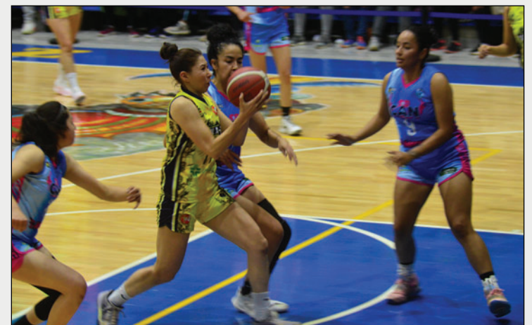
El clásico entre CAN y Carl A-Z destaca en esta séptima jornada

Finalmente, el domingo 18 de enero, el cuadro de Alemán recibirá a Universitario de Tarija en el mismo escenario deportivo. Las "germanas" intentarán frenar el invicto de las tarijeñas, quienes se han convertido en la gran revelación del certamen.