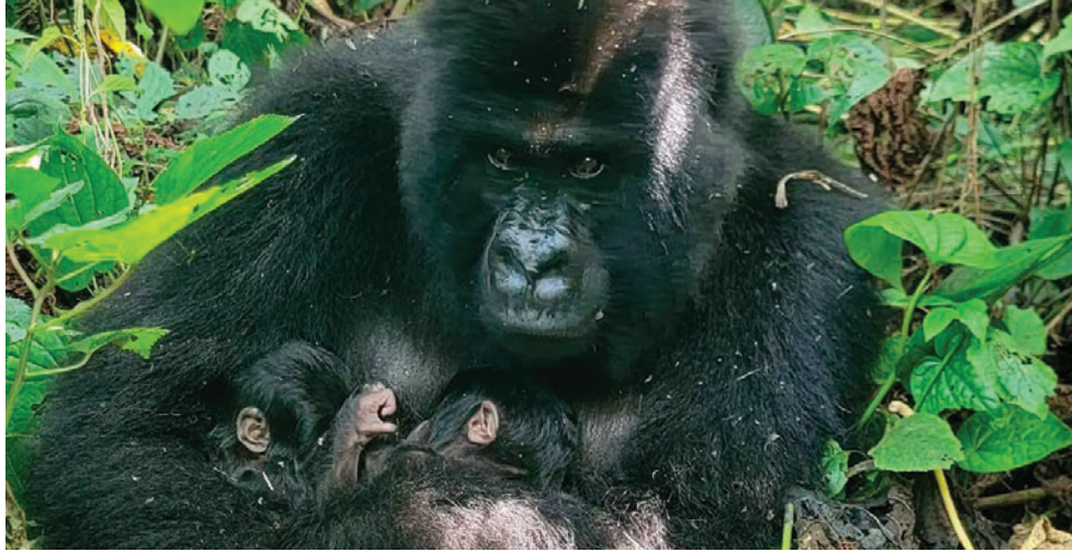
La población mundial de gorilas de montaña se estima en mil 63 ejemplares que viven en estado salvaje