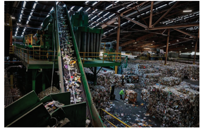
Las plantas de residuos en China ayudan a reducir vertederos, pero la disminución de desechos las pone en crisis operativa

China está transformando su gestión hacia un modelo circular y tecnológicamente avanzado, impulsado por políticas nacionales que buscan manejar la creciente generación urbana de desechos. La paradoja actual refleja tanto los avances en reciclaje como los desafíos derivados del enfoque masivo sin prever adecuadamente las necesidades sociales y del consumo.