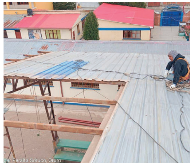
Desmontaje de la cubierta de la unidad educativa Ottawa /DIESD

Vilca indicó que estas acciones buscan prevenir filtraciones y goteras que afectan el desarrollo normal de las actividades educativas, especialmente durante la temporada de lluvias.