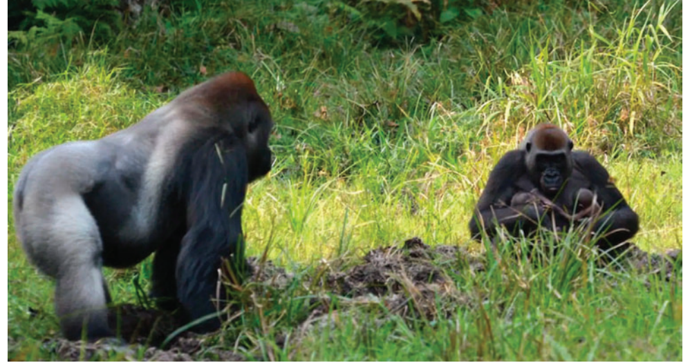
Los gorilas nacieron a inicios de año