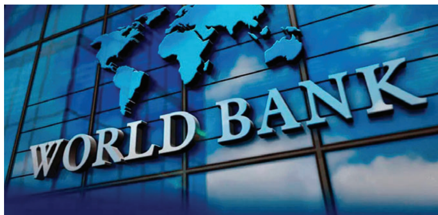
Logo del Banco Mundial /REFERENCIAL

El Canciller indicó que el anuncio oficial sobre el posible