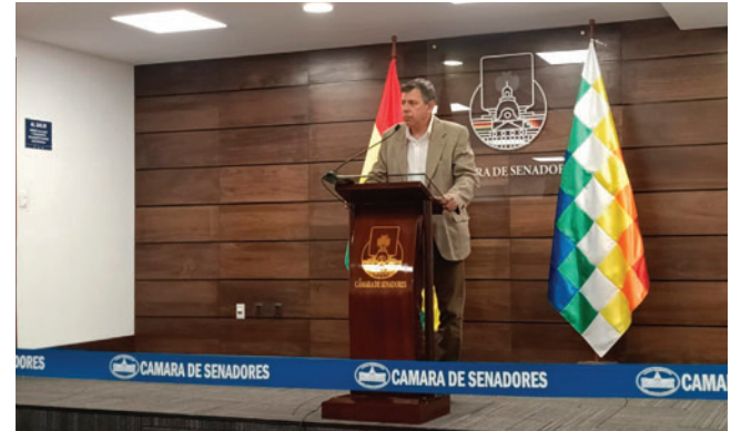
El presidente de la Cámara de Senadores, Diego Ávila

De acuerdo con datos del Gobierno, la deuda externa de Bolivia supera actualmente los 13 mil millones de dólares, de los cuales más de 4 mil millones corresponden al BID, que se constituye en el principal acreedor del país.