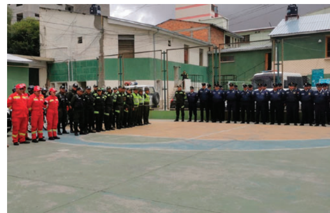
Personal policial y representantes institucionales realizarán inspecciones a la Ruta del Carnaval de Oruro 2026

“El mantenimiento de las luminarias y de las cámaras de seguridad ya se está realizando, por eso vamos a hacer una inspección más para identificar los