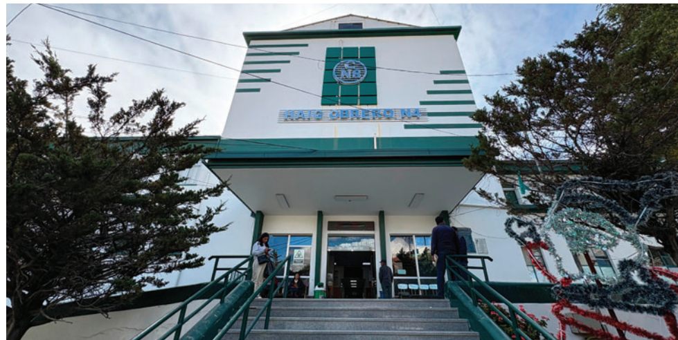
Hospital Obrero registró 3.864 cirugías

“La cantidad de cirugías realizadas refleja el trabajo intensivo de los especialistas”, afirmó. Sin embargo, advirtió que la infraestructura actual resulta insuficiente, detallando que el hospital cuenta con 155 camas, número