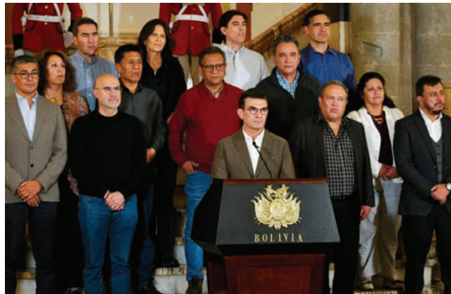
El Presidente Rodrigo Paz junto a sus ministros

Entre las disposiciones centrales, el decreto autoriza de forma excepcional y temporal la importación, venta y comercialización