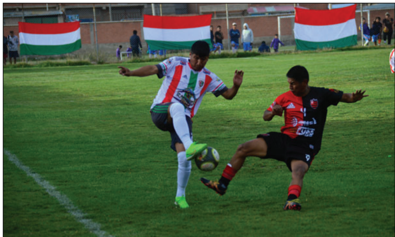
Piden que el certamen provincial tenga una mayor duración

Sin embargo, esta modalidad contrasta con lo señalado en la última reunión del Consejo de la División Aficionados, donde los presidentes de asociaciones se comprometieron a que los torneos provinciales tengan mayor extensión, buscando equilibrar las exigencias con los campeonatos oficiales de primera división. En los torneos de la Primera “A”, los clubes deben batallar casi todo el año para obtener una plaza para el torneo nacional, mientras que en el provincial, en algunos casos, el objetivo se logra en apenas dos meses, lo que genera cuestionamientos sobre la equidad del sistema.