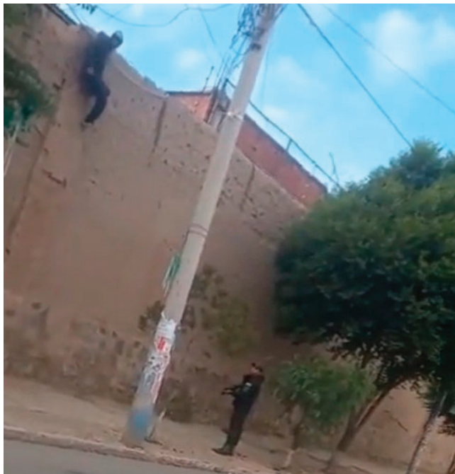
El interno a punto de saltar a la vía pública ante la vista de un agente de seguridad

Los uniformados rodearon la zona y lograron impedir que el recluso escapara. La escena fue