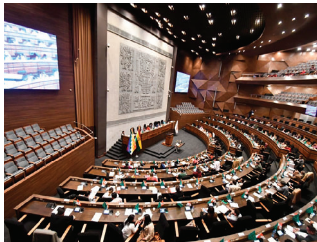
Hemiciclo de la Cámara de Diputados