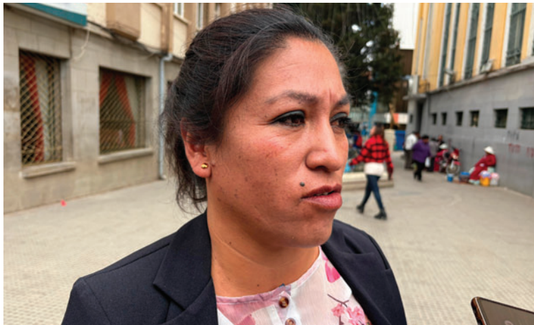
Diputada nacional Ximena Arispe

La diputada indicó que de esta mesa de trabajo podrían surgir propuestas para endurecer sanciones, modificar artículos de la Ley 700 o incluso incorporar nuevas disposiciones que beneficien a este sector vulnerable, las cuales serían planteadas posteriormente en la Asamblea Legislativa.