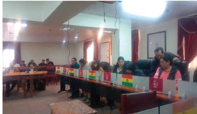
Diversas instituciones formaron parte de la reunión convocada para abordar la protección animal

Remarcó que los medios de comunicación cumplen una función fundamental al informar a la población sobre los hechos cotidianos, sean positivos o negativos.