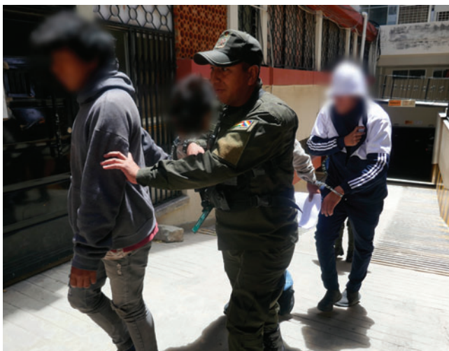
Los tres implicados son custodiados por un efectivo policial