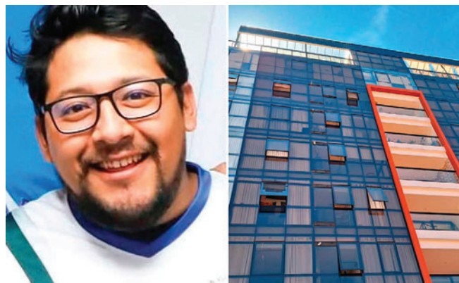
La propiedad está en la zona Obrajes de la ciudad de La Paz

está pidiendo la detención preventiva en base a todos los elementos, por el lapso de seis meses, en el penal de San Pedro", dijo Cardozo, según citó Unitel.