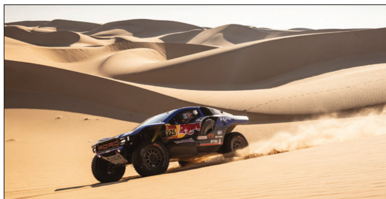
El catarí Nasser Al Attiyah a punto de coronarse en el Rally Dakar 2026

El español Tosha Schareina (Honda), ganador de la jornada de martes, y sexto el miércoles a doce minutos de Van Beveren, accede al tercer puesto en la general a 16'24" del argentino, mientras que Sanders, que completó la jornada a 27'50" minutos de la cabeza, pasa a la cuarta posición a 16'41", según los datos provisionales ofrecidos por la organización del rally.