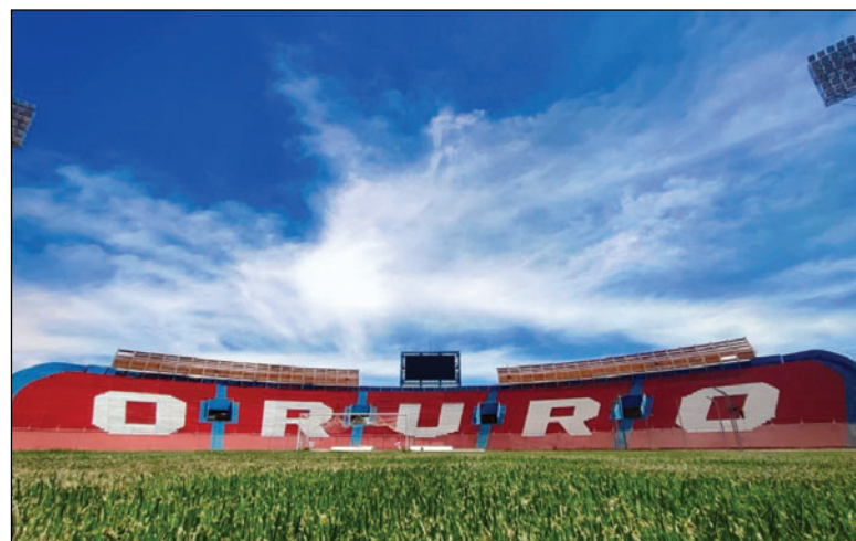
El estadio muestra una nueva cara con el pintado de las curvas