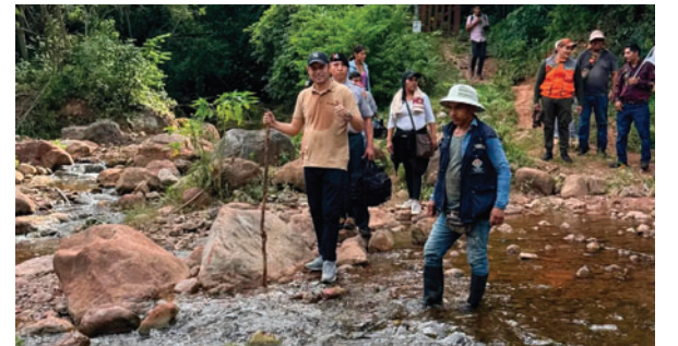
El vicepresidente Edmand Lara durante su visita en la reserva forestal de Tariquía