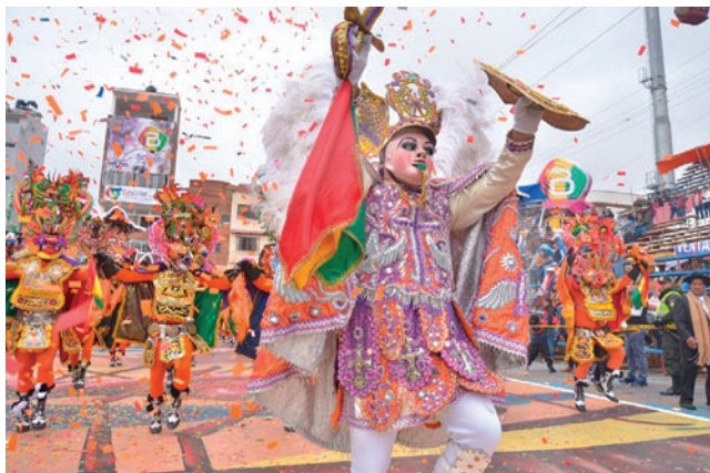
La transmisión completa será el Sábado de Peregrinación