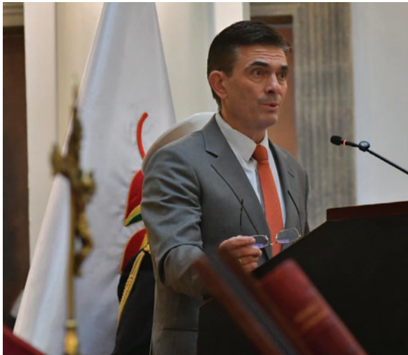
El Presidente de Bolivia, Rodrigo Paz