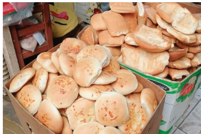
Posible aumento del precio del pan de batalla preocupa la población

En ese sentido, señaló que el municipio puede