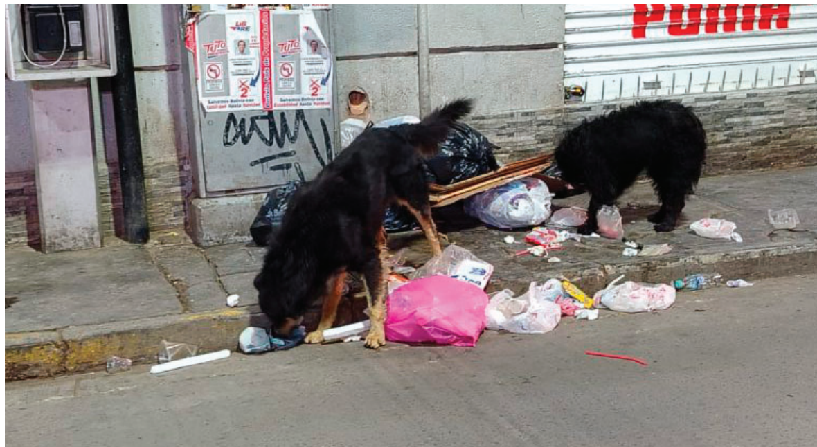
Existen muchos canes abandonados en las calles de Oruro