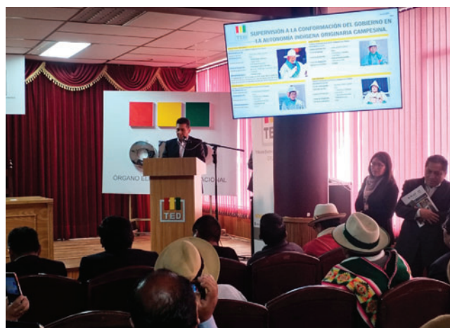
Desde el ente electoral informaron sobre las actividades desarrolladas el 2025 /TED ORURO

los cuales se ejecutaron Bs 1.042.792,57, alcanzando un 83,83% de ejecución. Estos recursos fueron destinados a la gestión institucional, administración de justicia electoral, fortalecimiento de la democracia intercultural y desarrollo de procesos electorales.