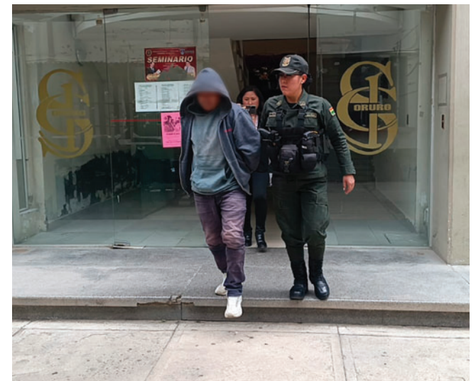
La justicia dispuso su reclusión por cuatro meses

El carbonato de sodio se encuentra dentro del anexo 1 del Decreto Supremo 3434 que a su vez se encuentra regulado en la Ley 913 y estable-