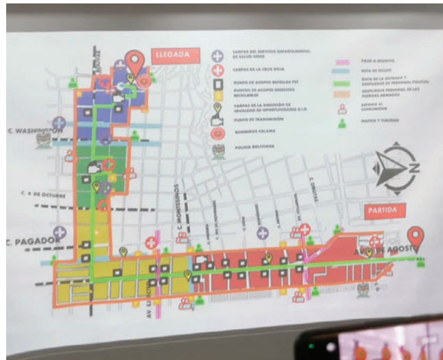
Ruta del Carnaval de Oruro 2026

El plan contempla una coordinación integral entre el Gobierno Autónomo Municipal de Oruro (GAMO), la Policía Boliviana, Bomberos, unidades de salud, Tránsito, personal de seguridad privada y otras entidades, con el