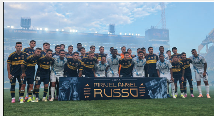
Jugadores de los equipos de Boca y Millonarios antes del inicio del partido

La misma imagen fue colocada para este partido en el pecho de la camiseta de los jugadores de Boca, cuyo presidente, Juan Román Riquelme, anunció que la Copa "Miguel Ángel Russo" se disputará todos los años en el mes de enero.