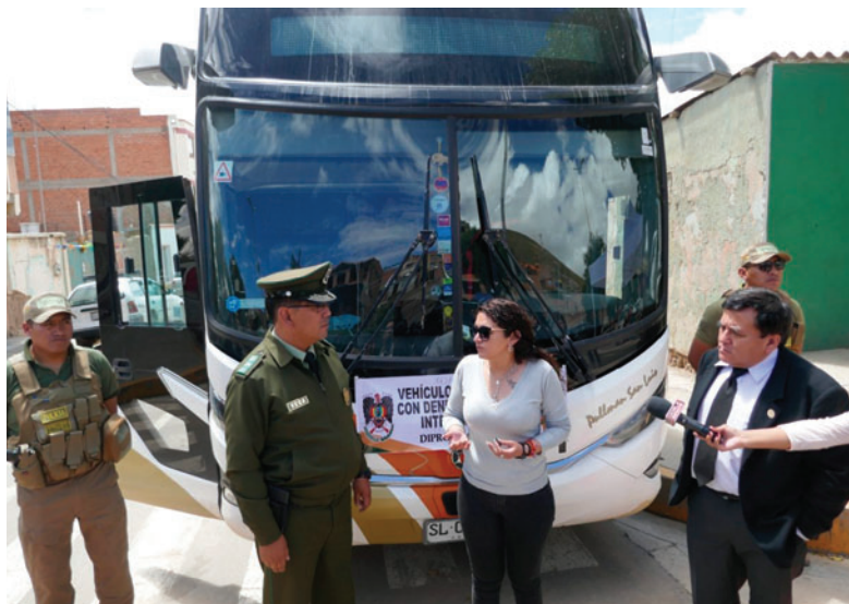
Autoridades de la Policía y Fiscalía devuelven un ómnibus a la víctima

En tanto, el 16 de marzo, la Policía se movilizó en Tambo Quemado para recuperar una camioneta robada a una familia dedicada a la venta de frutas en Arica, Chile. Lograron aprehender a un colombiano y un boliviano, por el delito de receptación, quienes afirmaron que compraron el coche a ciu-