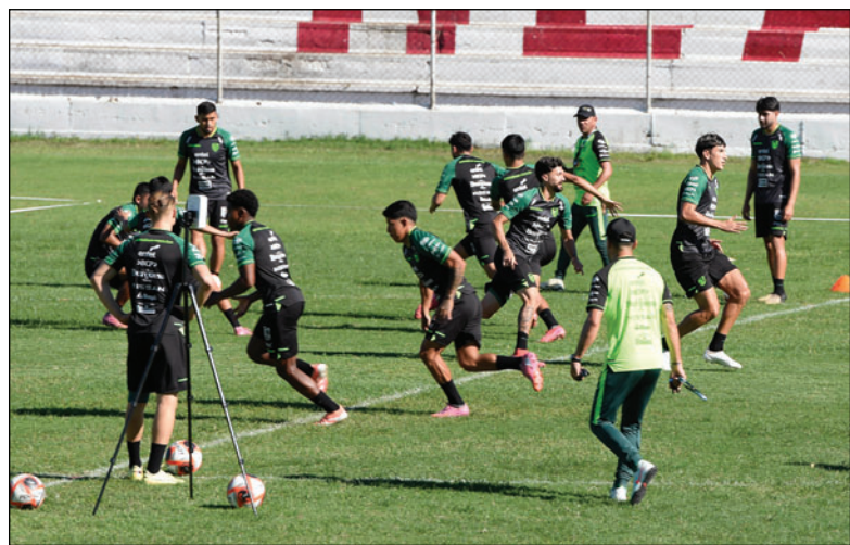
Los seleccionados entrenarán hasta el miércoles en Santa Cruz