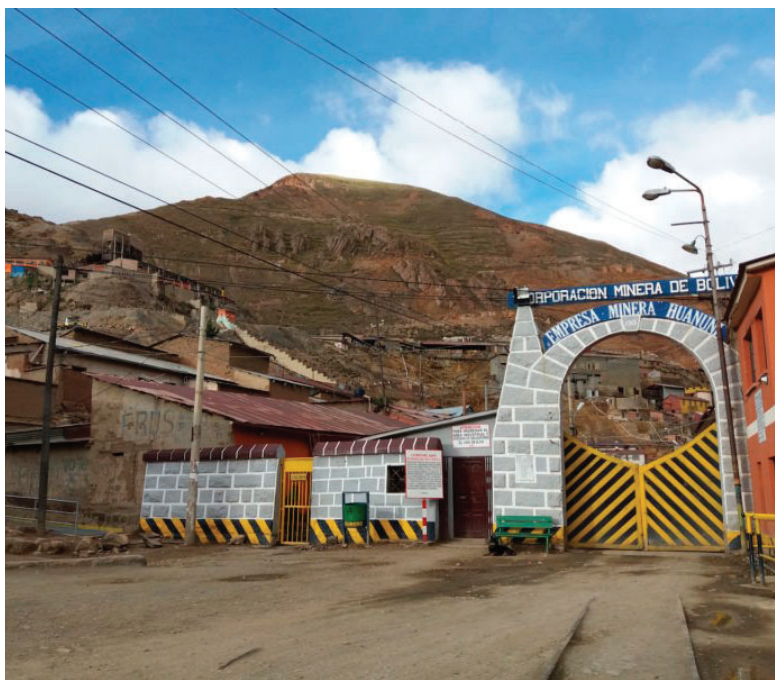
La Fiscalía mantiene procesos legales abiertos por robo a la EMH

aprehendidos e imputados por hurto de mineral.