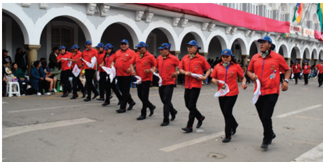
Los bloqueos ya afectaron ensayos de los conjuntos porque varios danzarines del interior no pueden llegar a Oruro