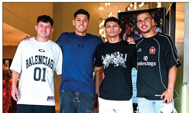
Los jugadores arribaron a Santa Cruz para sumarse a la concentración

ta alistarse de la mejor manera posible para encarar los partidos del repechaje para el Mundial 2026. En este mes de enero debía disputar tres partidos de preparación, al margen de Panamá y México estaba previsto jugar contra República Dominicana, cotejo que se canceló.