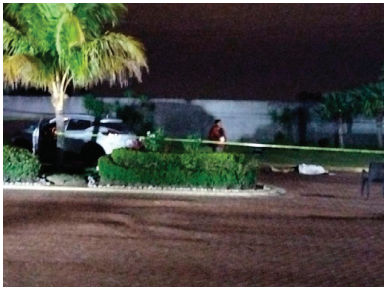
Asesinaron a un hombre en Santa Cruz en agosto: investigan posible ajuste de cuentas

Entre los casos más impactantes del año destaca el ocurrido el 10 de enero de 2025 en Entre Ríos (Cochabamba), cuando una familia fue atacada con extrema violencia al llegar a su domicilio. Una camioneta recibió 38 disparos, provocando la muerte de