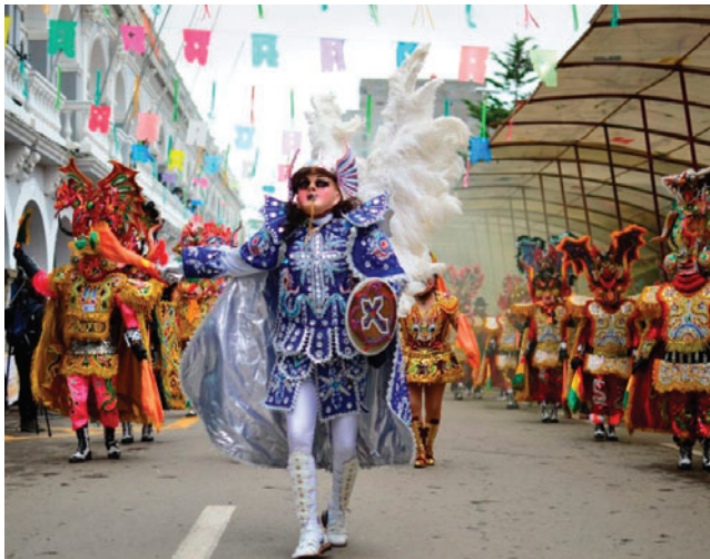
ACFO pide garantías para el Carnaval de Oruro

lidad. Según Arancibia, la logística se encuentra prácticamente definida, con acuerdos importantes en materia de seguridad, limpieza y orden, logrados en coordinación con la Policía. Uno de los aspectos aún en proceso es el ordenamiento de los servicios gastronómicos durante la festividad, trabajo que se realiza de manera conjunta con el sector y con el apoyo de capacitaciones impulsadas por el ministerio correspondiente.