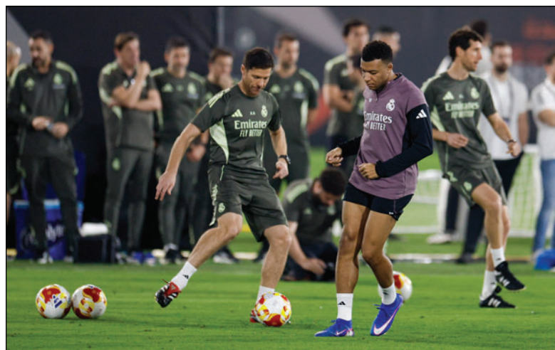
Mbappé fue parte del último entrenamiento del Real Madrid previo al partido

Eso sí, lo hicieron con una amplia lista de bajas. Y de importancia. Sin Joan García, Lewandowski, Dani Olmo, Raphinha... opciones limitadas tuvo el técnico para formar su once y para los cambios. Circunstancia que no se repetirá este domingo.