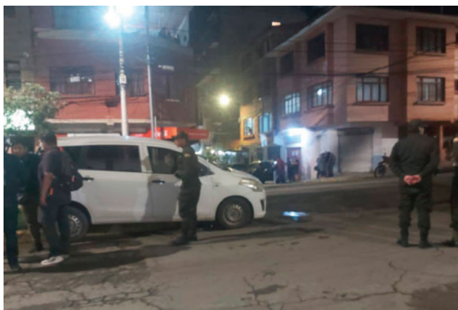
Escena del crimen en Tarija