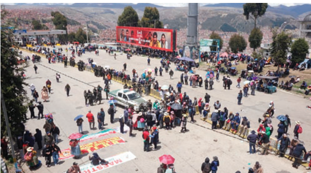
Existen más de 50 puntos de bloqueo en el país