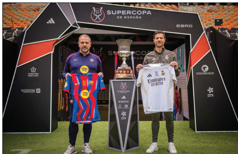
El alemán Hansi Flick, entrenador del Barcelona, junto al entrenador del Real Madrid, Xabi Alonso

Ambos portaron la camiseta de sus respectivos equipos, con un trofeo expuesto de fondo que ambos entrenadores tienen como gran objetivo para este inicio de 2026.