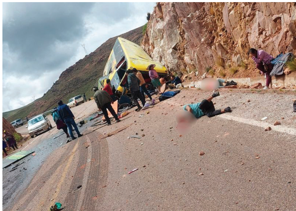
El bus impactó contra una peña