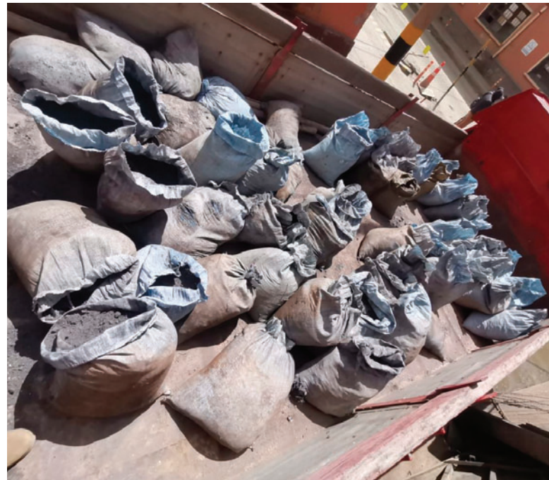
El juqueo deja pérdidas económicas significativas para el Estado

to de mineral y allanamiento de domicilio y/o sus dependencias por el robo de estaño a la EMH.