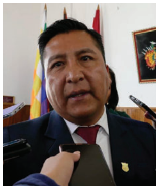
Alcalde Adhemar Wilcarani ratificará a su gabinete de secretarios