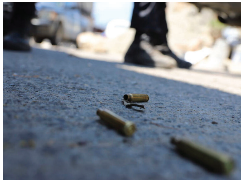
Una madre fue baleada en su hogar en Los Pozos, Tarija en abril

Posteriormente, el 1 de noviembre, un hombre de aproximadamente 30 años fue asesinado a balazos en el municipio de Entre Ríos, en el trópico de Cochabamba. La víctima recibió al menos 18 disparos en un ataque directo perpetrado por varios hombres