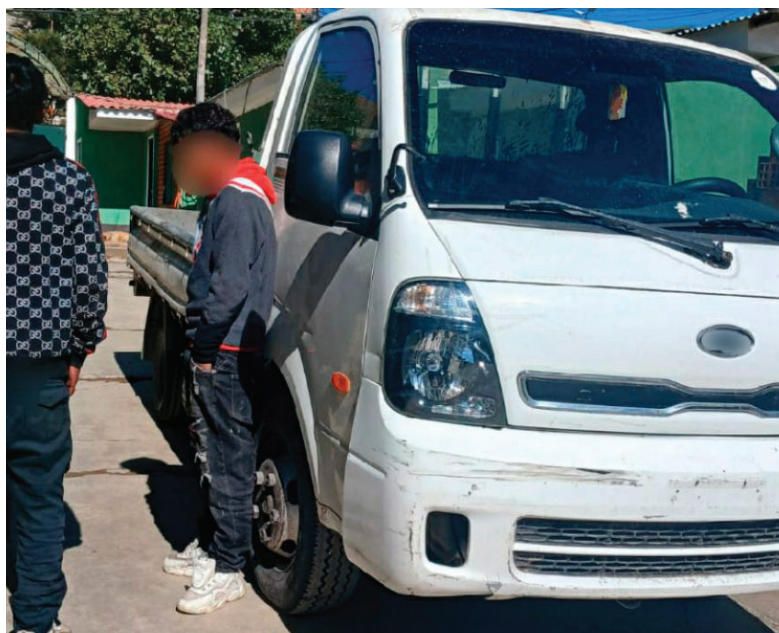
Las acciones policiales se ejecutaron principalmente en Challapata, Tambo Quemado y Oruro

dadanos chilenos en la frontera en calidad de indocumentado.