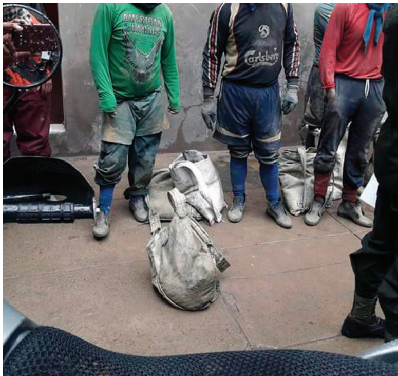
La Fiscalía logró sentenciar a más de 70 personas por juqueo

No obstante, no todos los detenidos fueron identificados como “jucus”, también reportaron algunos hechos donde se vieron involucrados funcionarios de la misma empresa. El 7 de febrero, dos trabajadores de la estatal fueron descubiertos con ocho kilos de estaño cada uno, por lo que, fueron