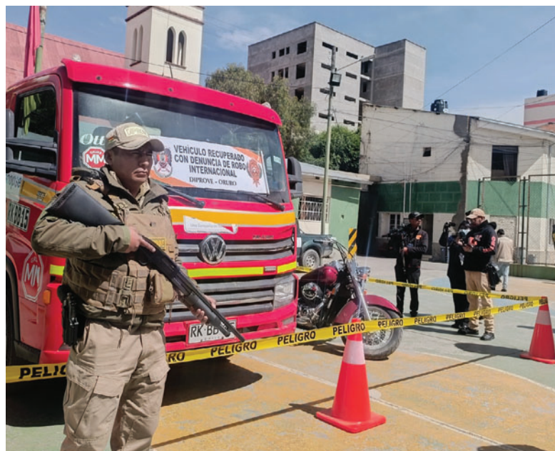
Autoridades bolivianas y chilenas concretaron convenios para luchar contra delitos transnacionales

coche con denuncia de robo en Antofagasta, Chile.