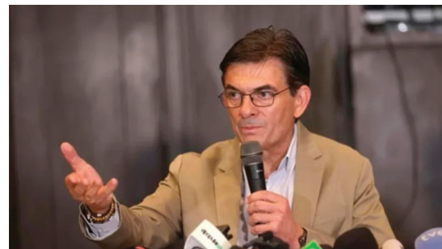
Presidente Paz anuncia la llegada del titular del BID “con miles y miles de millones de dólares”

“No solo la hemos estabilizado, sino ahora inyectamos platita para volver a empezar a reactivar nuestra economía”, aseveró.