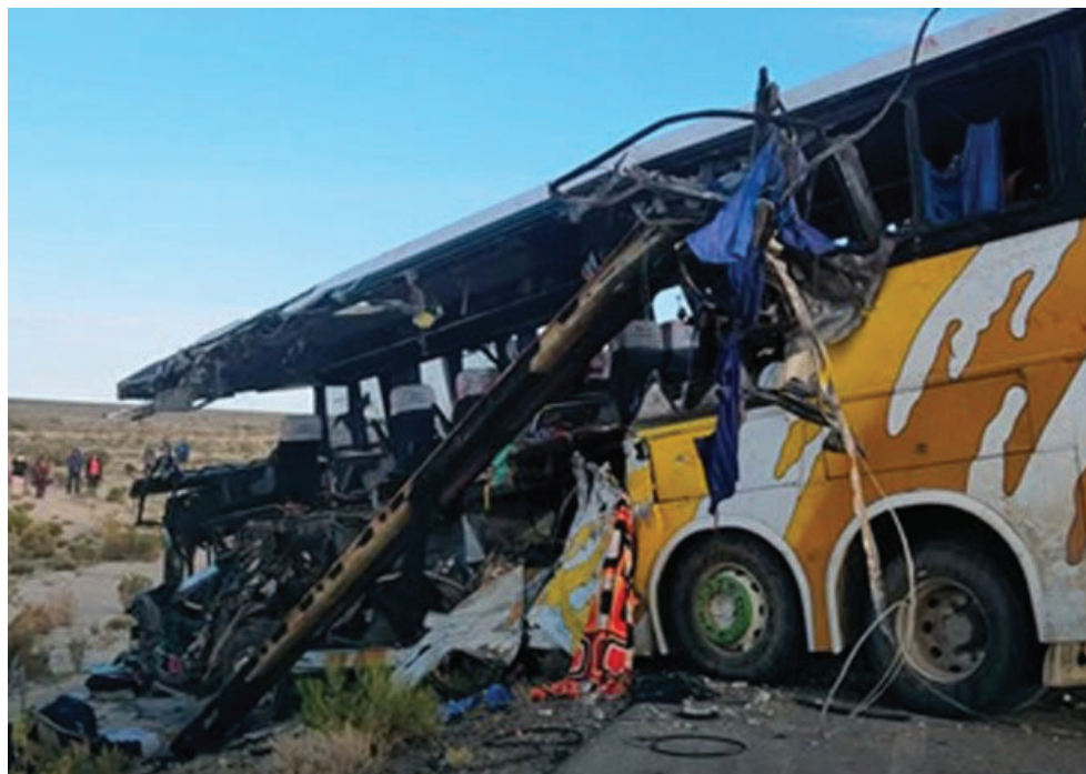
El choque que dejó 37 víctimas fatales antes de llegar a Uyuni