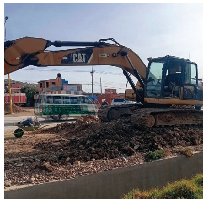
Proyecto del alcantarillado tiene un avance del 70%

Actualmente se construye el colector principal del sistema pluvial, que será derivado hacia un embovedado existente