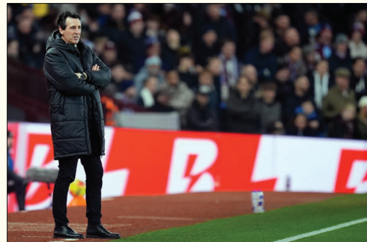
El entrenador español del Aston Villa, Unai Emery

En el resto de encuentros, el Bristol City goleó al Watford del español Javi Gracia (5-1), mientras que el Birmingham City eliminó al Cambridge United (2-3) y el Grimsby Town acabó con la aventura del Weston-super-Mare, equipo de la Sexta división.