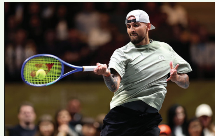
El tenista australiano Nick Kyrgios, uno de los favoritos, será el gran ausente

"Este torneo lo es todo para mí, pero prefiero ceder mi puesto a alguien que esté listo para aprovechar su momento. Todo es cuestión de construcción y volveré el año que viene con muchas ganas de competir. Nos vemos allí", añadió Kyrgios que recuerda que aún siente las consecuencias de las lesiones sufridas en la muñeca y en la rodilla y que ahora está situado en el puesto 670 del ranking ATP.