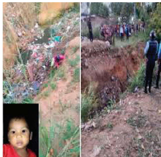
Hallazgo macabro: niña fue golpeada y asfixiada con cinturón

Según Díaz, se maneja la hipótesis de que la pequeña había sido víctima de estos vejámenes y agresiones en otro lugar; y que solo fueron a depositar su