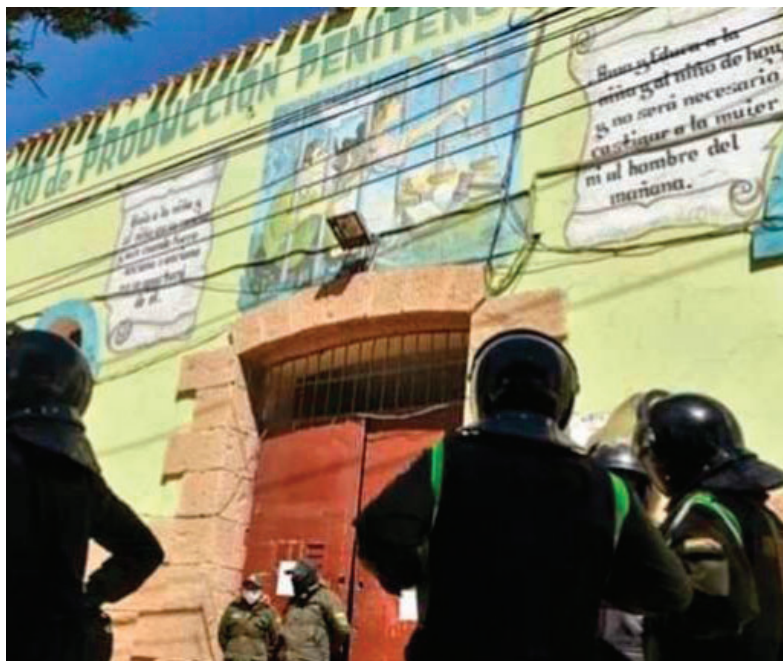
Acusados por crímenes sexuales fueron enviados a la cárcel de San Pedro/ LA PATRIA LA PATRIA

Cifras alarmantes arrojan que en Bolivia se registraron 41.647 casos relacionados a la Ley Integral para Garantizar a las Mujeres un Vida Libre de Violencia N° 348 desde el 1 de enero al 24 de noviembre de 2025, según datos de la Fiscalía General del Estado. En Oruro, la cuantificación de casos supera los 1.200.