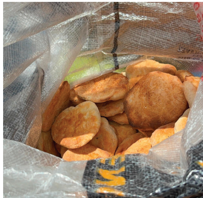
Precio del pan se mantiene en 0,50 centavos/ LA PATRIA

En ese marco, insistió en que la decisión final sobre el precio debería surgir del trabajo y la coordinación con las autoridades competentes, esperando que hasta el 10 de enero de 2026 o mañana se tenga una definición concreta.