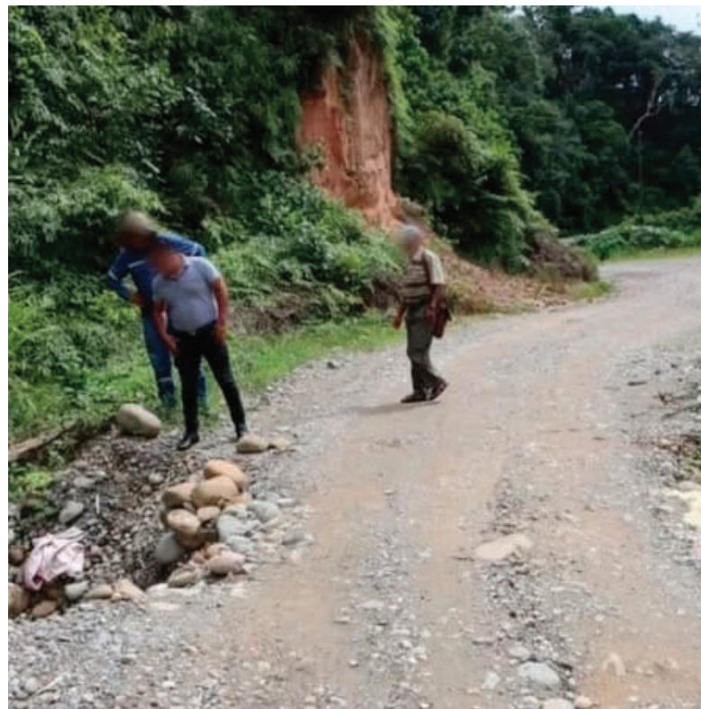
Padre e hijo fueron acibillados en Shinahota

armados que descendieron de un vehículo y abrieron fuego sin mediar palabra. La Policía presume que este crimen también estaría relacionado con un ajuste de cuentas vinculado al narcotráfico, debido a la violencia y modalidad del ataque.