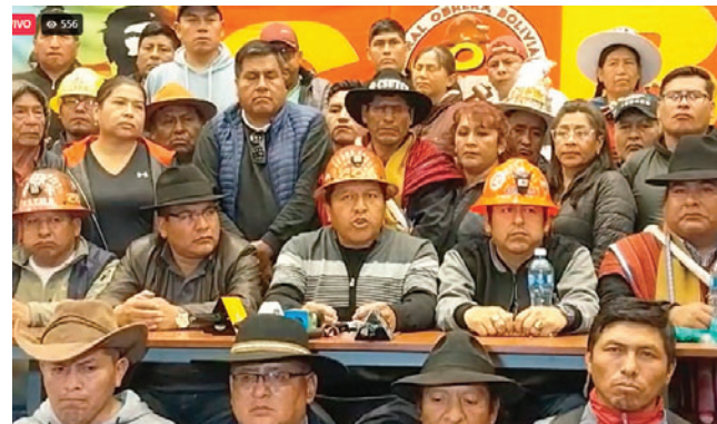
Conferencia de prensa del comité ejecutivo de la COB

En el ampliado también se exigió la renuncia inmediata del ministro de Trabajo, Edgar Morales, a quien acusan de emitir comunicados oficiales que promueven el despido de trabajadores movilizados y generan zozobra e incertidumbre laboral en