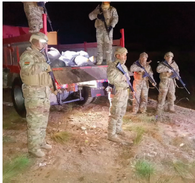
A pesar de los controles, los “jucus” se dan modos para robar mineral

Durante la gestión pasada, el Ministerio Público fue a juicio oral en 31 procesos, logrando que, 73 personas sean halladas culpables por los delitos de hur-