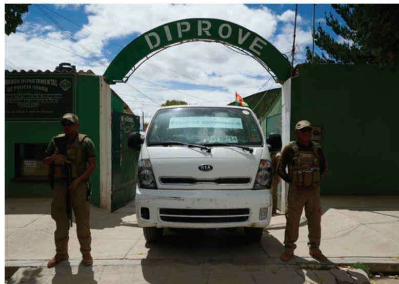
Distintos operativos permitieron recuperar al menos diez coches con denuncia de robo internacional

En uno de los operativos más importantes, fue el que se ejecutó el 19 de agosto en Challapata, tras identificar un