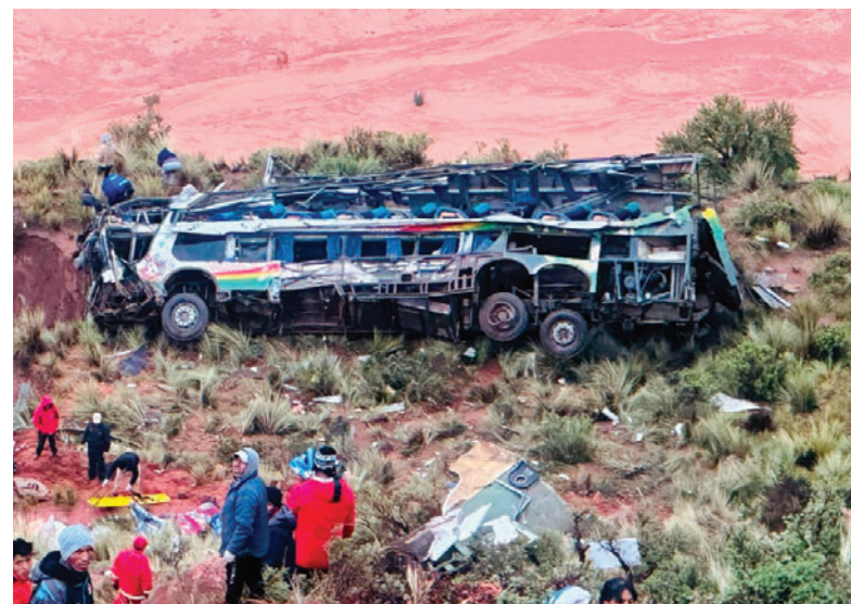
31 personas murieron en este accidente

La racha de muertes no dio tregua. El 12 de marzo, en la carretera Diagonal Jaime Mendoza, ruta Pocoata-Sucre, entre Soratariri y Tomaycuri, un bus de la empresa Flores que intentaba evitar un bloqueo en rutas principales tomó una vía alterna. En la zona de Soratariri, el exceso de velocidad