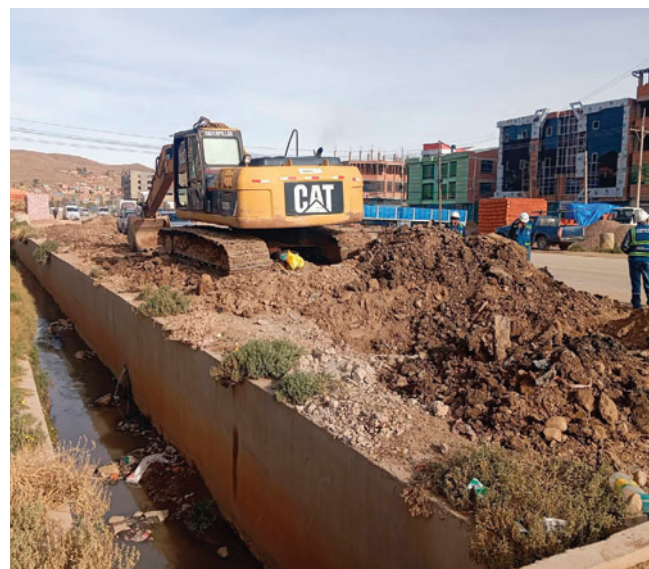
Proyecto presenta avances significativos en su ejecución/ GAMO

Con la conclusión del canal pluvial, se prevé reducir significativamente los problemas de inundación que afectan a la junta vecinal Madrid Integrada durante las precipitaciones.