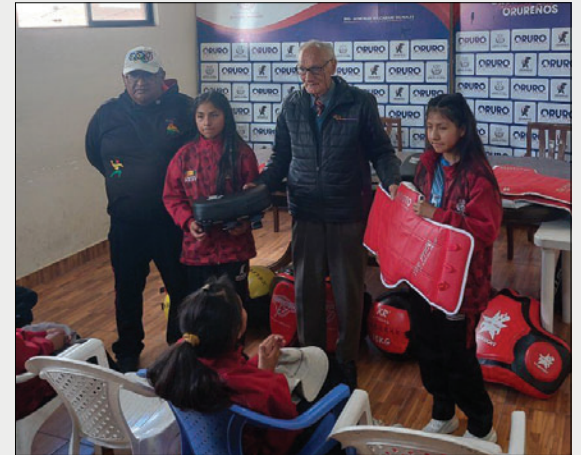
Este 2026 la demanda económica en favor de las asociaciones será mayor

Actualmente, la Unidad de Deportes se encuentra en receso administrativo, en los próximos días se dará a conocer el porcentaje de ejecución presupuestaria de los recursos destinados al deporte en 2025, así como las necesidades proyectadas para el 2026.