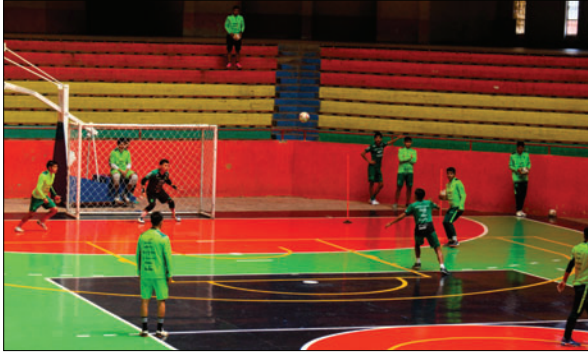
Algunos jugadores, particularmente los orureños, entrenan en Oruro

Pimentel explicó que los rivales serán de gran exigencia, ya que lleguen con más preparación. Colombia jugó amistosos con Francia, Brasil organizó un cuadrangular en su país y Chile enfrentó a Paraguay. "Son equipos complicados y duros de en-