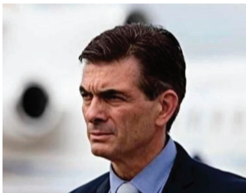
El Presidente Paz se pronunció tras días de rumores /REFERENCIAL

"Tariquía es un reservorio que está dentro de Tarija. Dicen que hubiéramos dado un permiso para que se desarrolle un pozo gasífero dentro del reservorio. Eso no es verdad y algunos políticos están usando temas medioambientales para hacer política. Eso no está bien", dijo el mandatario a través de