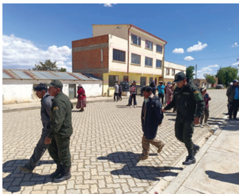
La Policía rescató a los tres hombres y los trasladó a instalaciones fiscales