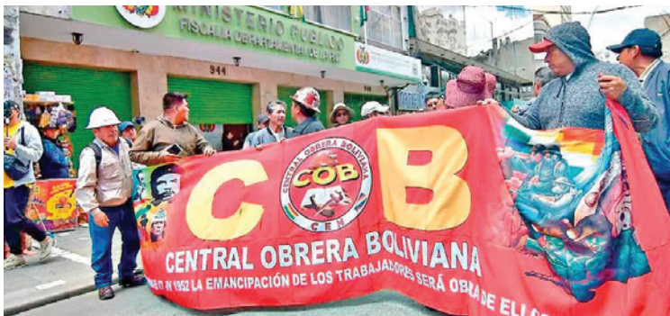
Dirigentes de los trabajadores marchando en La Paz, en una nueva jornada de protesta

rridos durante la protesta. Luego de las audiencias cautelares, la autoridad judicial dispuso que 11 de los detenidos enfrenten el proceso en libertad bajo medidas restrictivas, mientras que una persona recibió detención domiciliaria.