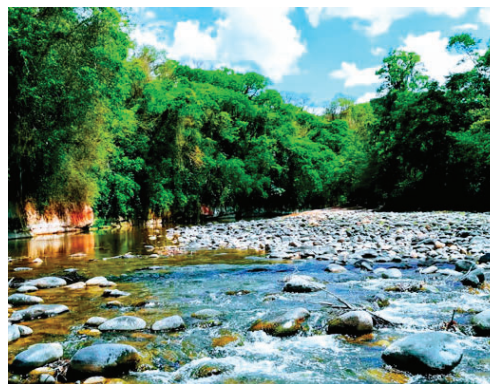
Tariquía es una reserva natural, por lo que no pueden hacerse exploraciones /REFERENCIAL

que se esté desarrollando, su gobierno va a "desarrollar muchos pozos en Bolivia" para que la economía salga adelante, pero