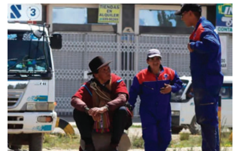
Desde la CNI piden no permitir el corte de tránsito en las rutas

Desde el sector industrial se reiteró la preocupación por los efectos económicos y sociales que generan los bloqueos, mientras se mantiene la expectativa de que las autoridades y los sectores movilizadas encuentren una salida que permita normalizar el tránsito y la actividad productiva en el país.