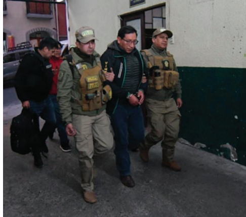
El exgerente de Epcoro al momento de su traslado

testigos del caso y habrían sido los que recibieron la presión para ejecutar los desembolsos.