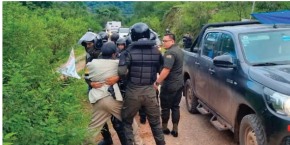
Ya hubo conflictos entre la Policía y habitantes que se oponen a la exploración petrolera en Tariquía

defensorial recordó que la institución realiza seguimiento a esta situación desde la gestión anterior, incluyendo su tratamiento ante instancias internacionales.