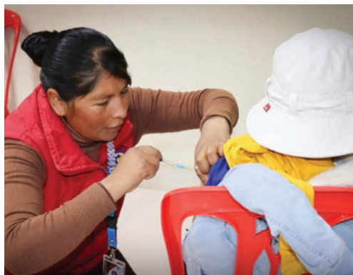
A mediados de enero se espera la llegada de un lote de vacunas contra la influenza

general, rinorrea u otros síntomas respiratorios acudan de inmediato a los centros de salud para recibir un diagnóstico y tratamiento oportunos. Esto tiene como objetivo evitar complicaciones y la propagación de enfermedades respiratorias en el departamento.