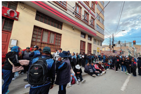
Maestros también se movilizan por su subsidio de zona

Pérez confirmó que la medida será indefinida y se mantendrá hasta que exista una respuesta favorable a sus demandas, en respaldo a la Central Obrera Boliviana (COB) y a la Central Obrera Departamental (COD).