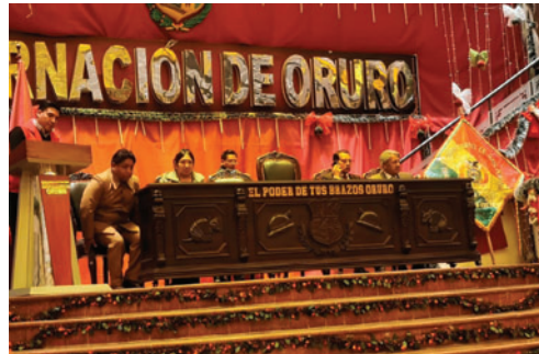
Acto de aniversario de la ABAN / LA PATRIA

En ese sentido, convocó a los danzarines a confiar en el trabajo de los bordadores tradicionales de