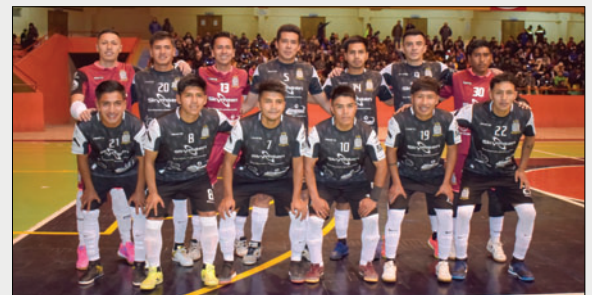
Fantasmas Morales Moralitos quiere seguir cosechando títulos

El cuadro de Fantasmas Morales Moralitos se prepara para una temporada exigente, con el objetivo de alcanzar el pentacampeonato y cumplir una destacada actuación