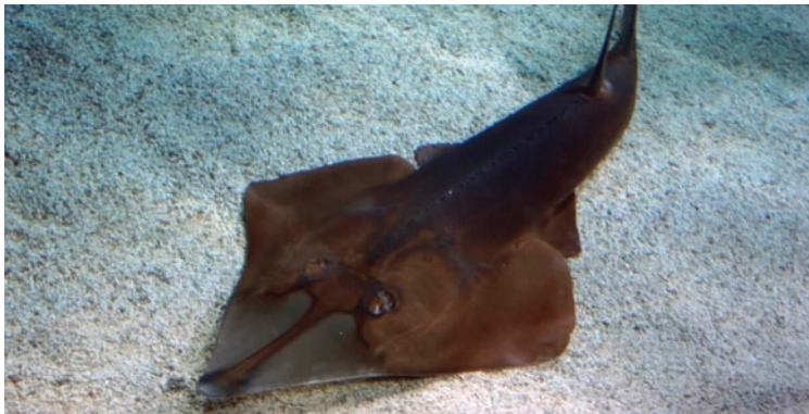
El pez guitarra de barbilla negra habita el Mediterráneo y el Atlántico oriental /REFERENCIAL

En este contexto global hacia 2026, muchas criaturas extraordinarias aún pueden salvarse si se logra una acción coordinada y sostenida para evitar que desaparezcan en silencio.