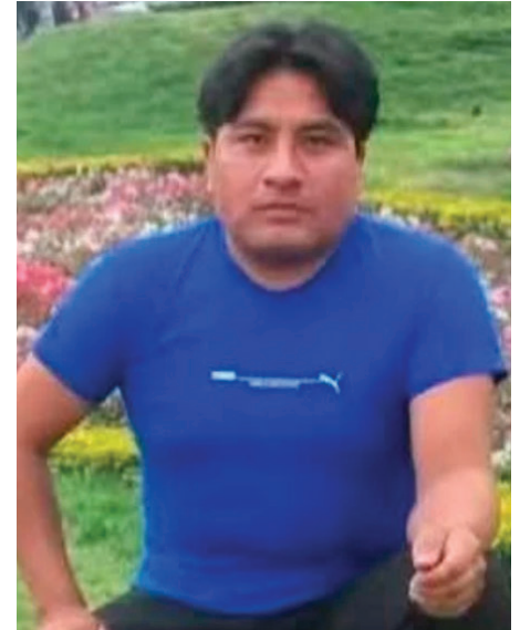
Joyoero desaparecido en Cochabamba