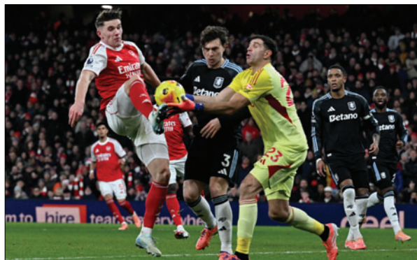
Emiliano Martínez en la actualidad defiende el arco del Aston Villa

En la rueda de prensa posterior al partido, Unai Emery, técnico español del conjunto de Birmingham confirmó que el arquero se ha hecho daño en el gemelo, pero no entró en más detalles sobre el problema.