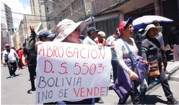
Persisten protestas contra el decreto 5503