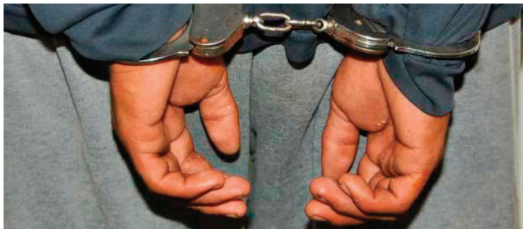
Dictan prisión preventiva para hombre acusado de faenar un perro /Referencial

Por su parte, el juez encargado del proceso determinó que el acusado permanezca cinco meses en detención preventiva mientras conti-