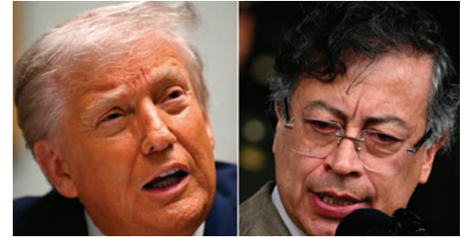
El presidente de Colombia, Gustavo Petro, y el mandatario de EE. UU., Donald Trump, enfrentan una crisis diplomática sin precedentes

Según dijo Petro en su discurso, "políticos que son responsables de tener relaciones con el narcotráfico y de haber hecho trizas la paz" de Colombia, "engañaron a Trump" al vincular al mandatario colombiano con mafias para ponerlo en su contra y provocar una crisis con Estados Unidos. "Pues esos mismos son los responsables de esta crisis, llamémosla diplomática por ahora, verbal, por ahora, que ha estallado entre Estados Unidos y Colombia",