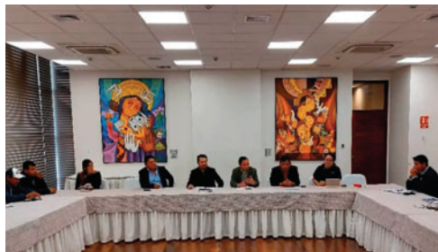
Municipios se declararon en emergencia y piden reunión con el Gobierno

Merlo explicó que la reducción presupuestaria compromete la capacidad de los municipios para atender las necesidades de la población y advirtió