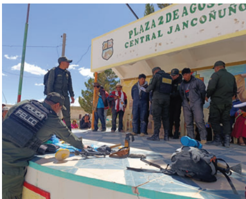
Los supuestos ladrones fueron retenidos en la plaza principal de la comunidad