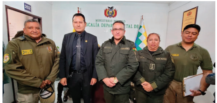
Las autoridades refirieron su compromiso con el medioambiente