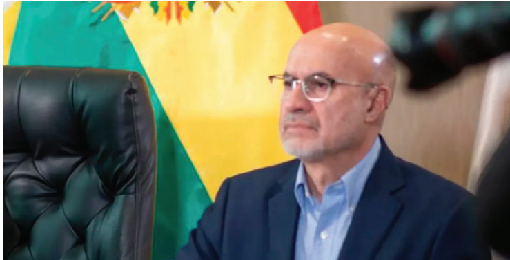
El ministro de la Presidencia, José Luis Lupo

Lupo indicó en una entrevista con Unitel este miércoles 7 de enero, que