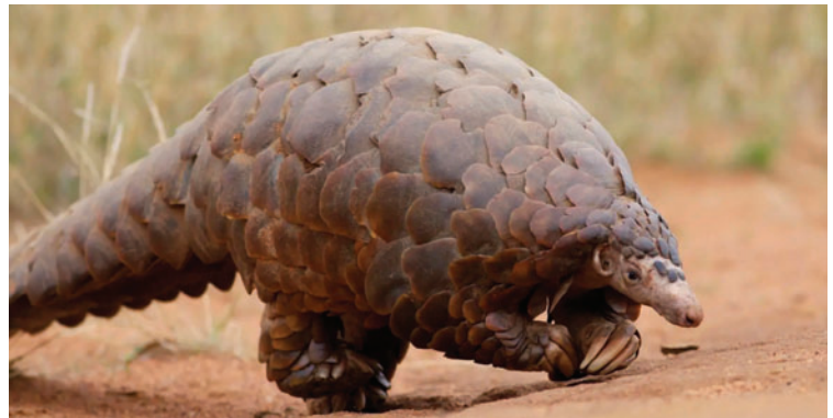
El pangolín de Temminck habita zonas áridas del continente africano /REFERENCIAL