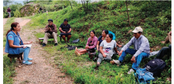
Un equipo de la Defensoría del Pueblo se constituyó en el municipio de Entre Ríos para verificar la situación de las personas que participaban en la vigilia instalada por el Comité de Defensa de Tariquía

Asimismo, alertó sobre el inicio de un proceso penal contra comunarios de la zona, bajo figuras como asociación delictuosa y atentado contra la libertad de trabajo. Recordó que anteriormente ya se procesó a defensores por estos delitos. Según la Defensoría, estas acciones contravienen estándares internacionales de protección a defensores de derechos humanos y ambientales.