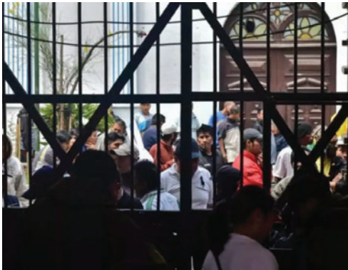
Un grupo de privados de libertad de la cárcel San Pedro de La Paz

La emisión de estos documentos se concretó luego de una reunión de coordinación interinstitucional realizada en Sucre entre el TSJ y la Dirección General de Régimen Pen-