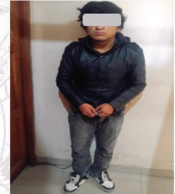
DENUENCIADO. E.E.S. de 28 años

Caso: VIOLACIÓN NIÑO, NIÑA Y ADOLESCENTE