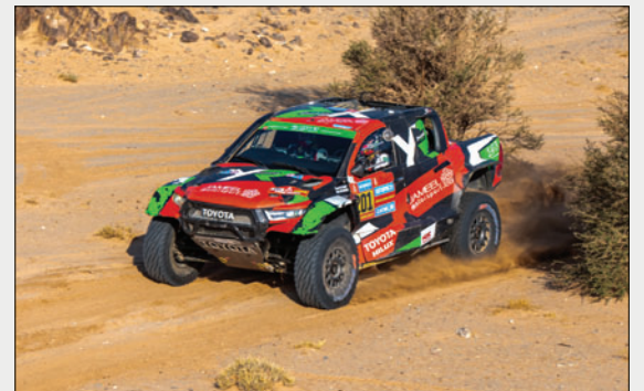
Yazeed Al-Rajhi, vigente campeón de coches abandonó la prueba