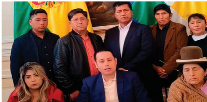
El vicepresidente Edmand Lara se pronunció junto a parlamentarios de su línea

"Nosotros, en el transcurso del día de mañana, presentaremos un proyecto de ley para poner un alto a esos decretos inconstitucionales. Y pedimos a todos los senadores y diputados del país ponerse la mano al pecho, pensar en el país porque la solución está en la Asamblea", dijo Lara, según citó Erbol.