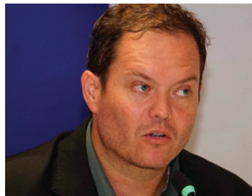
El expresidente de YPFB, Armin Dorgathen

De acuerdo con la Procuraduría, en el transcurso de la semana se prevé la fijación de una audiencia de medidas cautelares, además de la activación de otros mecanismos legales