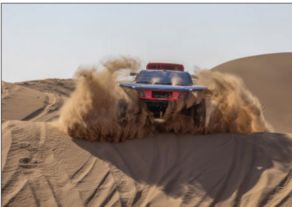
El piloto francés Stéphane Peterhansel marcha a paso firme en el Dakar 2026

La retirada pone fin de manera prematura a la defensa de la corona lograda en 2025, cuando Al-Rajhi hizo historia al convertirse en el primer piloto saudí en ganar el Dakar y el primer competidor local en conquistar la prueba en 47 años de historia.