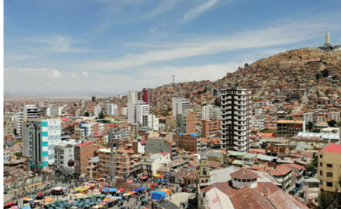
Alcaldía gestiona proyectos para Oruro ante la Brigada Parlamentaria