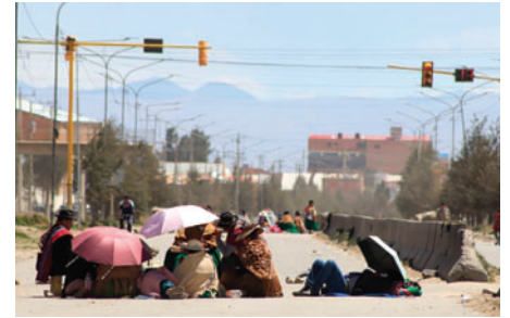
Un bloqueo en La Paz