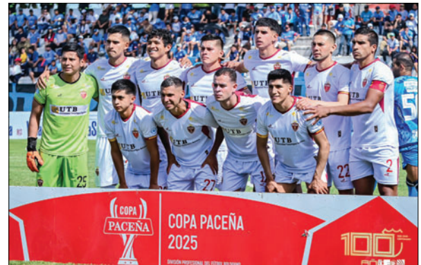
CDT Real Oruro sigue perdiendo a jugadores importantes

El posible traspaso a Bolívar no solo reforzaría a uno de los equipos más poderosos del país, sino que también dejaría a CDT Real Oruro en una situación complicada. Hasta el momento, el club orureño, no ha oficializado ningún refuerzo para la