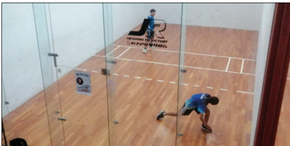
El selectivo comenzará el 20 de enero en distintas categorías

(AMRO), tomó la determinación de comenzar la temporada 2026, el próximo 20 de enero, con el desa-