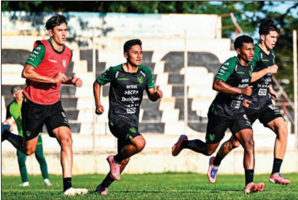
Los seleccionados se concentrarán desde el fin de semana en Tarija

Es así que Bolivia solo jugará contra Panamá, el 18 de enero (17:00), en el estadio IV Centenario de Tarija, y ante México, el 25 de enero (15:00), en el estadio "Ramón Aguilera Costas" de Santa Cruz. Cabe mencionar que estas fechas no corresponden a la ventana FIFA, por lo que los equipos de los convocados no están en la obligación de ceder a sus futbolistas.