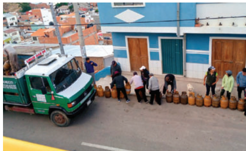
Sector de Alto Oruro se registró largas filas en busca de GLP

Desde tempranas horas, vecinos se concentraron en inmediaciones de la planta San Pedro de Yacimientos Petrolíferos Fiscales Bolivianos (YPFB), donde en algu-