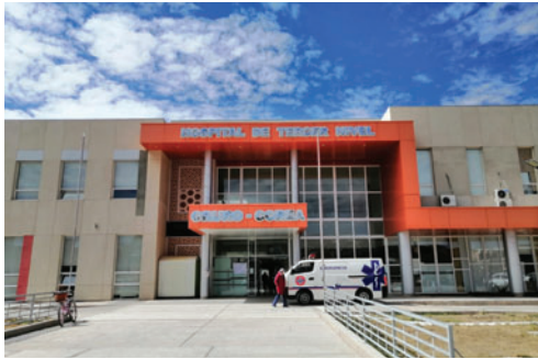
Resta la licitación del Proyecto de la Segunda Fase del Hospital Oruro-Corea / LA PATRIA

El gobernador indicó que ya se cuenta con la Ley Nacional de Traspaso del Proyecto a la Gobernación de Oruro; sin embargo, aún resta consolidar el derecho propie-