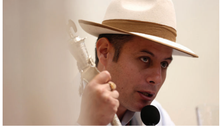
El vicepresidente Edmand Lara se sumó a las propuestas para abrogar el decreto

Por otro lado, también hay tres acciones de inconstitucionalidad abstracta presentadas ante el Tribunal Constitucional Plurinacional (TCP). Una de ellas fue interpuesta en diciembre por el presidente de la Asamblea Legislativa Departamental