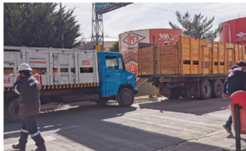
Algunos vecinos impidieron salida de camiones en pedido de atención

De manera paralela, se registraron largas filas en sectores donde los camiones sí ingresaron, como en la zona de Alto Oruro, donde vecinos denunciaron que, pese a formar extensas filas, muchos no lograron abastecerse del