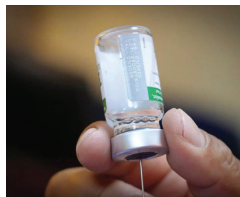
Oruro no tiene casos confirmados de la influenza A(H2N3) subclado K /SEDES

Añadió que se coordinará con los medios de comunicación para reforzar la difusión de la campaña de vacunación. La autoridad sanitaria