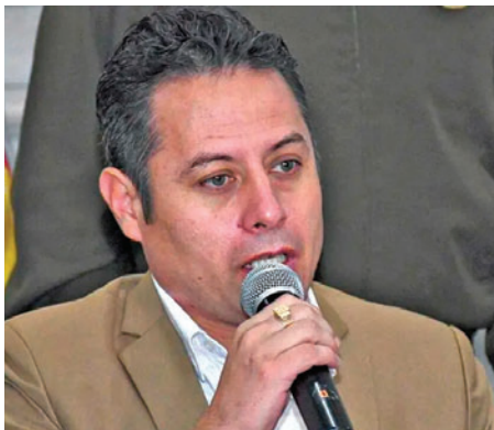
El vicepresidente Edmand Lara