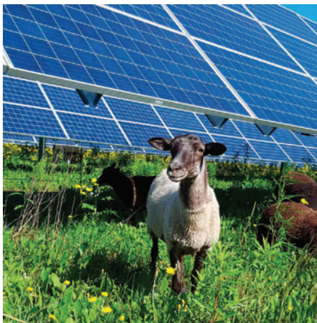
La agrivoltaica ofrece soluciones innovadoras: paneles solares que optimizan el uso del suelo /NOTICIAS AMBIENTALES

Aunque no se presenta como una solución universal, el estudio concluye que la implementación de paneles solares en la agricultura es una herramienta para mitigar los riesgos del calor extremo, cada vez más frecuentes en el contexto del cambio climático. La agrivoltaica combina la producción agrícola con la generación de energía solar en un mismo terreno, permitiendo que ambos sistemas funcionen simultáneamente sin competir por el uso del suelo.