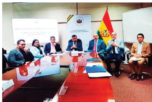
La Comisión de la Verdad se reunió en El Alto

YPFB realizó un préstamo de 80 millones de