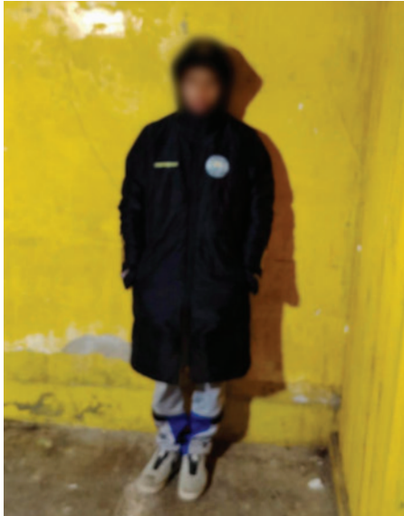
Es investigado por el delito de destrucción y deterioro de bienes del Estado/CEDIDA A LA PATRIA