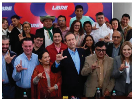
Alianza Libre ha expresado su preocupación por los decretos 5503 y 5515 /RRSS