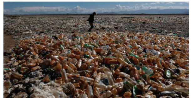
Botellas de plástico y basura en una zona seca del río Tagarete, que desemboca en el lago Uru Uru

La fitorremediación consiste en el uso de plantas para absorber y retener metales pesados presentes en suelos y cuerpos de agua contaminados. En el caso del lago Uru Uru, se utilizan balsas flotantes con plántulas de totora, una especie nativa de los lagos andinos, que entra en contacto directo con el agua sin hundirse. Según pruebas de laboratorio