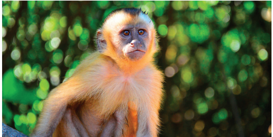
El gibón de Cao Vit es uno de los primates más raros del mundo /REFERENCIAL

Cambiar esta percepción social es fundamental para su conservación.