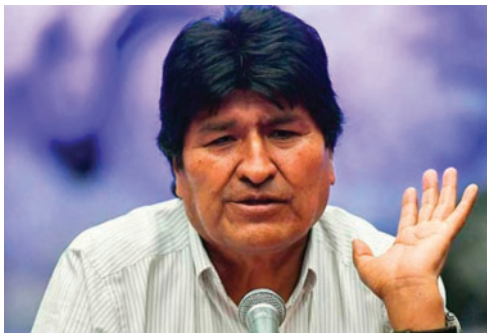
El expresidente Evo Morales

Una vez se subsanen las observaciones, el fiscal asignado al caso evaluará si acepta o no la denuncia.