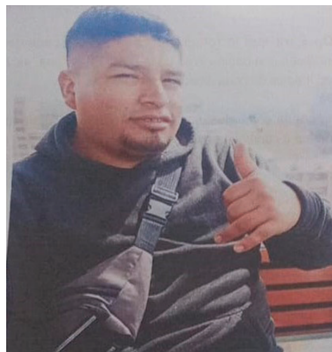
Vladimir Poma Gorostiaga /LA PATRIA

Se recuerda que la tenencia ilegal de personas está penada por ley.