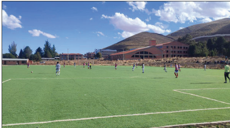
Los torneos que aún están en competencia finalizarán en febrero

En lo que concierne a la elaboración del calendario deportivo de la temporada 2026, será el Consejo Central el que determine la forma de ejecución, tomando en cuenta que este año también corresponde cumplir con la renovación del directorio de la AFO.