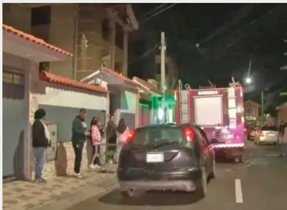
Personal de Bomberos llegó para sofocar el fuego