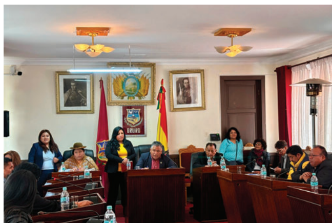
Concejo Municipal sesionó en medio de reclamos ciudadanos

aseguró que existen denuncias internas registradas en actas sobre concejales que habrían asistido a sesiones en estado de ebriedad, además de presuntos abusos de poder y uso indebido de influencias.