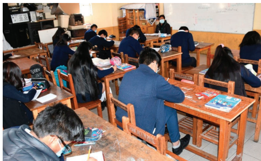
Gobierno analizará en abril la posibilidad de un incremento en las pensiones

En 2025 se definió congelar las pensiones escolares antes de las inscrip-