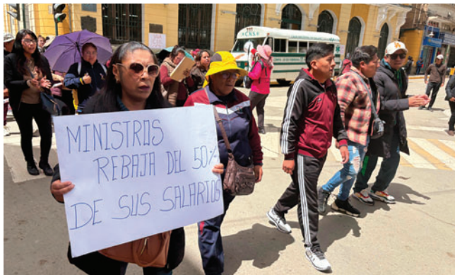
Maestros cuestionan decisiones del Gobierno

La Federación de Trabajadores en Educación Urbana de Oruro protagonizó el 4 de enero de 2026 una movilización por las principales calles de la ciudad en demanda de la abrogación del Decreto Supremo 5503, norma que, según el magisterio,