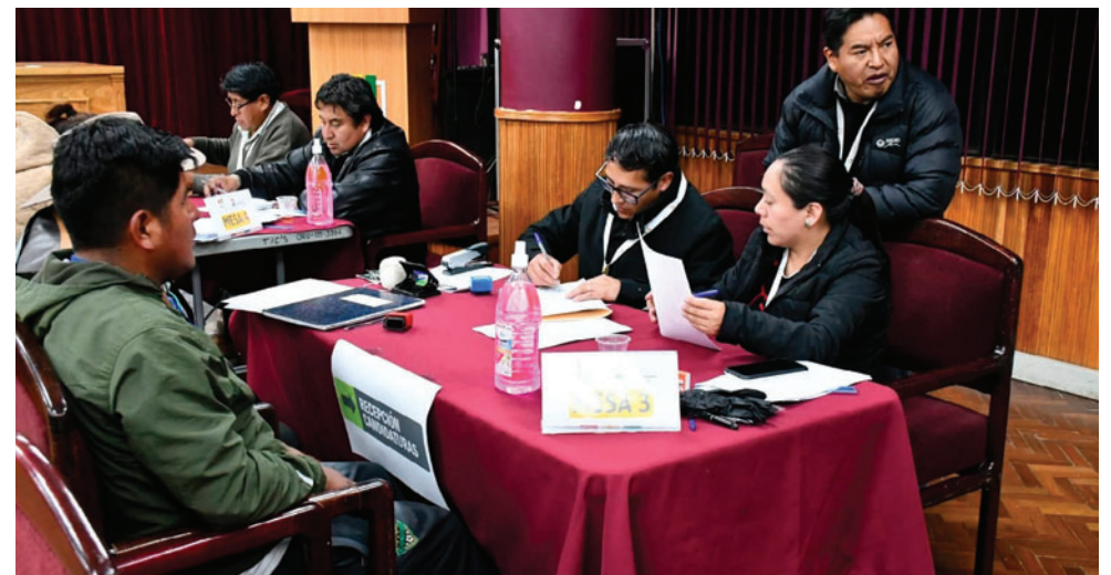
Muchos de los inscritos para candidatos no cumplieron todos los requisitos

Según la autoridad electoral, la mayor concentración de inhabilitaciones