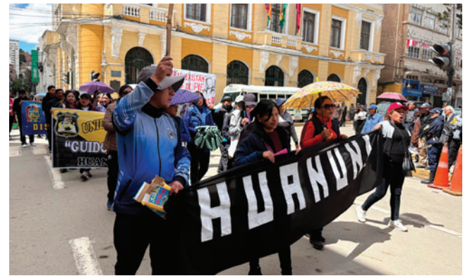
Maestros exigen la abrogación del Decreto Supremo 5503

Según el magisterio, este procedimiento representa un riesgo para las riquezas naturales del país y