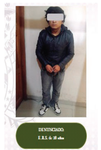
Es investigado por violación a infante, niña, niño y adolescente /POLICÍA

Asimismo, señaló que buscarán la pena de treinta años de presidio, la máxima según la legislación boliviana.