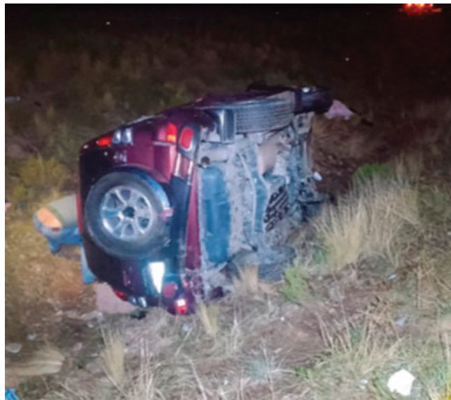
Dos ocupantes, entre ellos un menor de edad, fallecieron tras volcar

Según los trabajos de campo de la División