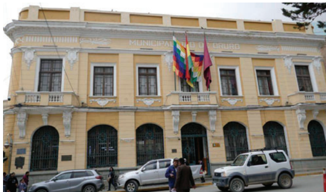
Oruro alcanzó una ejecución presupuestaria del 81%

Condarco indicó que el municipio cerró la gestión pasada con 216 millones de bolivianos ejecutados, superando la programa-