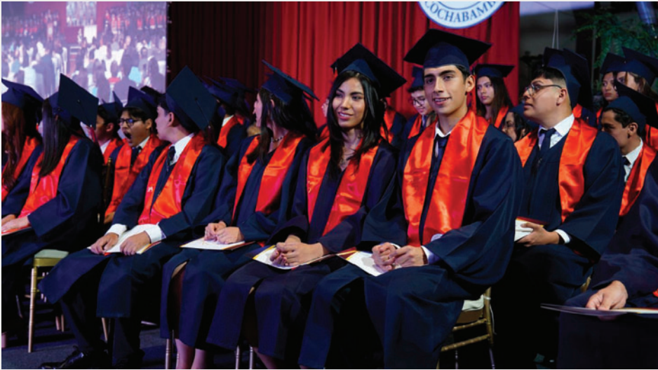
Imagen Referencial / COLEGIO SAN AGUSTÍN COCHABAMBA