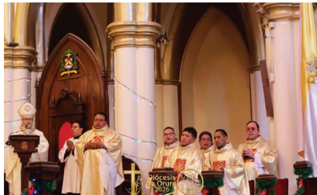
Diócesis de Oruro cerro el Año Jubilar

“Este año jubilar no lo hemos celebrado por nosotros mismos, ni por los sacerdotes ni por las religiosas, sino agradecidos a Dios por los 100 años de nuestra diócesis”, expresó Bialasik ante los feligreses.