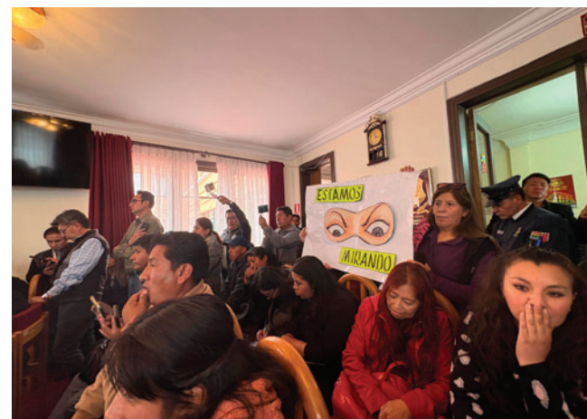
Directiva fue elegida en medio de la protesta de organizaciones de mujeres