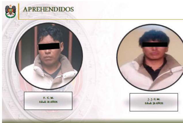
Dos hermanos fueron capturados por el crimen