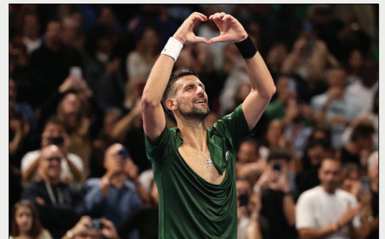
Novak Djokovic anunció su retirada del sindicato de jugadores

"Seguiré centrándome en mi tenis, mi familia y contribuyendo al deporte de maneras que reflejen mis principios e integridad. Les deseo a los jugadores y a todos los involucrados lo mejor en su futuro, pero para mí, este capítulo ya está cerrado", concluyó Djokovic.