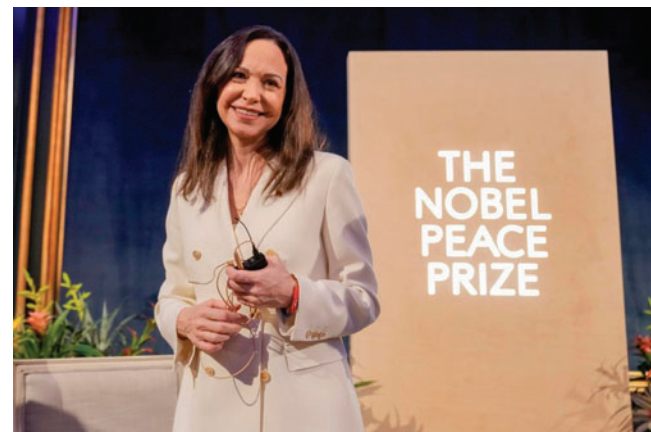
La líder opositora venezolana y Premio Nobel de Paz, María Corina Machado

El jefe de la diplomacia estadounidense también aclaró que su país gestio-