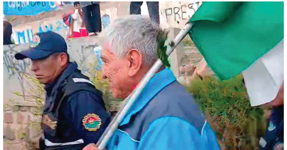
Momento en que lanzaron objetos al burgomaestre