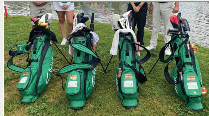
Este año los golfistas tendrán amplia actividad a nivel nacional / FBG

Bolivia también albergará dos torneos internacionales: el Bolivia Junior Open y el Sudamericano Sénior. El primero se desarrollará en el Country Club Cochabamba (20-24 de mayo). Mientras que el segundo se llevará a cabo en Santa Cruz (19-24 de octubre).