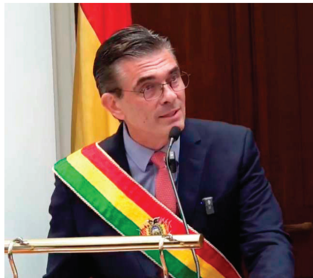
El mandatario se pronunció en la inauguración del año judicial en Sucre

Cuestionó cómo un grupo sindicalizado pueda mover en su bolsillo más de 18 millones de dólares al año, cuando es una cifra