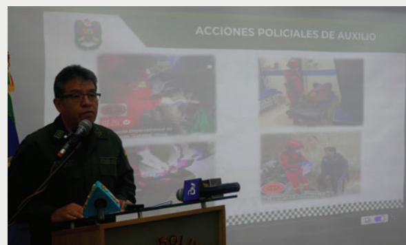
El comandante Alemán destacó las medidas preventivas para reducir hechos durante las fiestas de fin de año