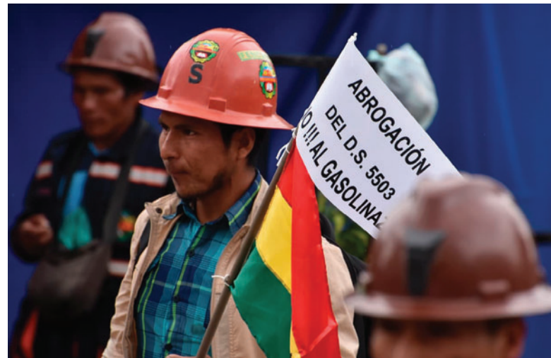
El sector espera la abrogación total del Decreto Supremo 5503

Mientras la dirigencia se encontraba en el Palacio, las calles del centro paceño se convirtieron en un campo de batalla. Efectivos de la Policía Boliviana utilizaron agentes químicos para