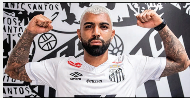
Gabriel Barbosa jugará este año en el Santos junto a Neymar

El antiguo goleador del Flamengo, club con el que ganó dos Copas Libertadores (2019 y 2022), confesó que está “muy ansioso” ante su próximo debut con el Santos y aseguró estar en plena forma.