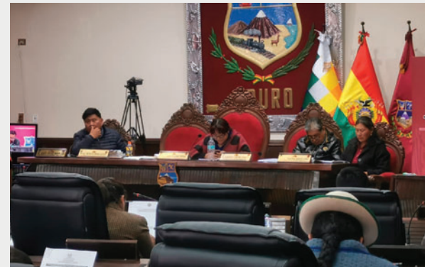
En la sesión extraordinaria pendiente de 2025 se eligió a los postulantes para vocales del TED