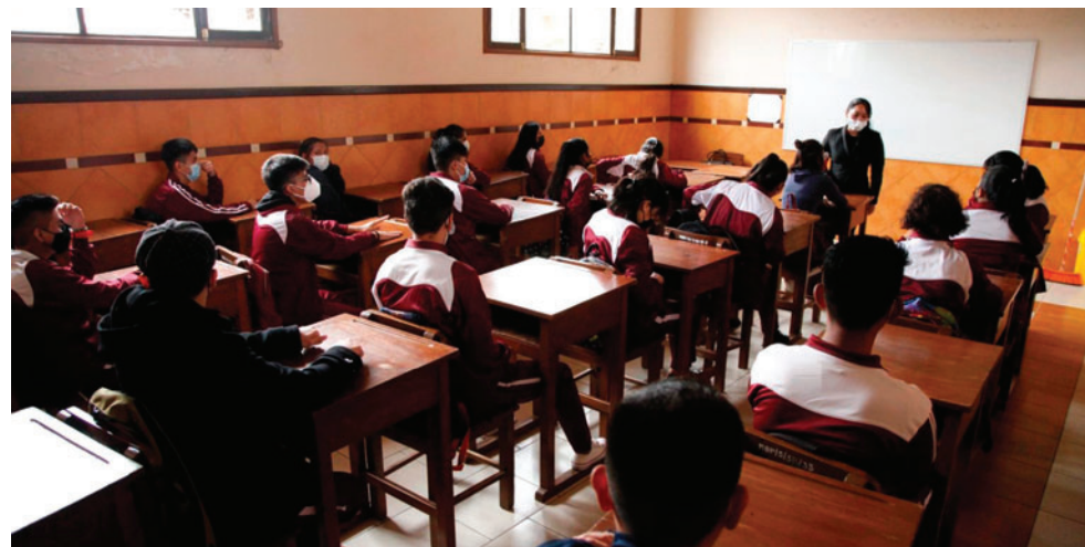
Las clases comenzarán el 2 de febrero

De acuerdo con la planificación educativa establecida para esta nueva gestión, hasta el 16 de enero se desarrollará la etapa de planificación y organización a nivel distrital. La normativa dispone que las unidades educativas, así como las direcciones distritales y departamentales de educación, deberán cumplir