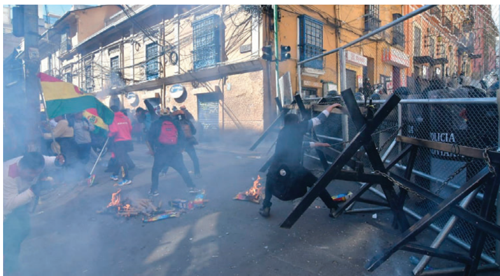
La situación en Plaza Murillo se volvió crítica