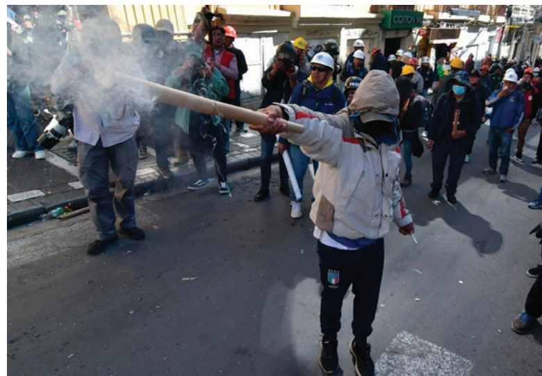
La confrontación alcanzó niveles de peligro

La densa humareda y las constantes detonaciones provocaron el cierre inmediato de comercios y la paralización total del transporte en el centro de la ciudad.