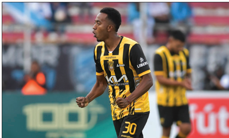
Los “atigrados” quieren comenzar bien, Arrascaita renovó su contrato

A su vez, Terrazas agregó que, en el transcurso de esta semana, se completará el pago de los montos restantes de los casos de Rolando Blackburn, Leonel López y los demás demandantes para liberar al club de la prohibición de habilitación de nuevos jugadores.