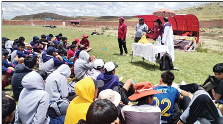
Una Misa de Acción de Gracias dio inicio a las actividades de este año

En cuanto al primer plantel, se confirmó que el inicio de labores está previsto para el lunes 12 de enero, fecha en la que se realizará la evaluación médica a los jugadores que