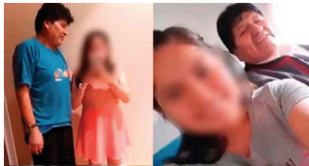
Imágenes de los encuentros entre Evo Morales y Noemí

De acuerdo con el memorial presentado por Marcelo Alcázar, exdirector del Servicio Plurinacional de Asistencia a la Víctima (Sepdavi), el caso revela el funcionamiento