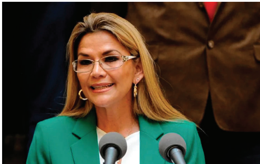
La expresidenta interina Jeanine Áñez

narcoterrorista y el inicio de la restitución del Estado de Derecho continúa su camino imparable hasta que asuma el verdadero presidente electo”. Por su parte, Luis Fernando Camacho escribió que la captura de Maduro “demuestra que las dictaduras no son eternas” y afirmó que Maduro impuso una dictadura mediante el fraude electoral.