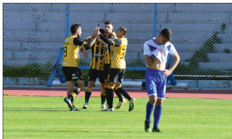
GV San José no pudo clasificar a un torneo internacional este 2025

GV San José deberá afrontar el 2026 sin colchón económico. No tendrá participación internacional. La premisa será reestructurar el equipo. El objetivo es volver a ser protagonista a nivel nacional.