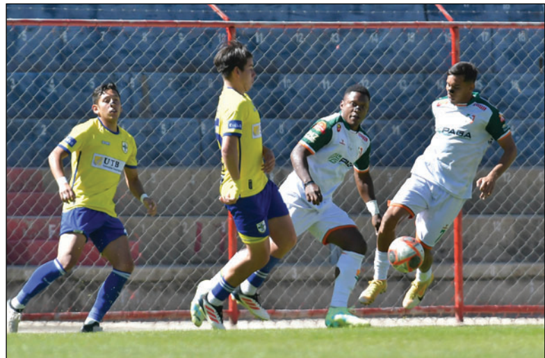
San Juan FC quedó segundo y no pudo ganar la llave por el ascenso indirecto

tavos de final, después los cuartos de final, las semifinales y la final. San Juan FC, en su condición de subcampeón, encaró el partido por el ascenso indirecto, jugando contra ABB, tras ganar de local 3-1, no pudo en El Alto, perdió 2-0 y en la tanda de penales, fue ABB el que venció 5-3, de manera que el equipo cruceño que también fue una de las revelaciones en el torneo nacional, quedó en el camino, en su afán de subir a la División Profesional.