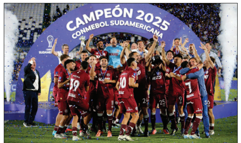
Lanús celebró el título de la Copa Sudamericana el 2025

En el caso de GV San José, no pudo jugar de local en el estadio "Jesús Bermúdez" ya que no pudo ser habilitado por la Conmebol, de manera que hizo de local en el "Hermandad Siles" de La Paz, donde en su debut empató con Unión Española de Chile 1-1, perdió contra Once Caldas (3-2) y ganó a Fluminense 1-0; en sus partidos de visita, per-