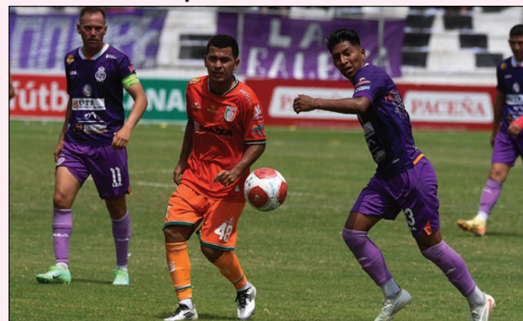
Real Potosí es el nuevo elenco que fortalece la zona occidental