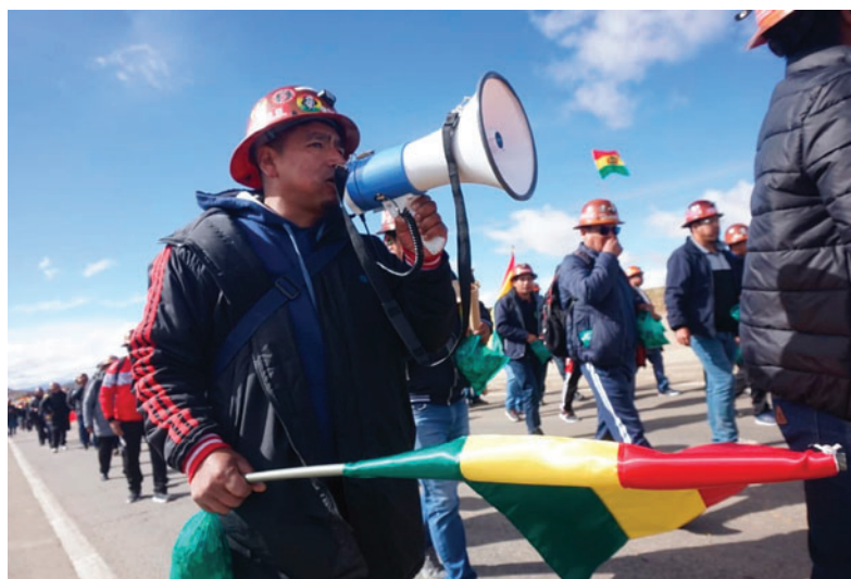
Se tiene previsto que la marcha llegue a La Paz el lunes

tado por iniciar una huelga de hambre como medida extrema para intensificar la presión.