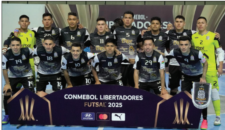
El cuadro orureño tuvo una participación notable en Copa Libertadores de Futsal/CONMEBOL