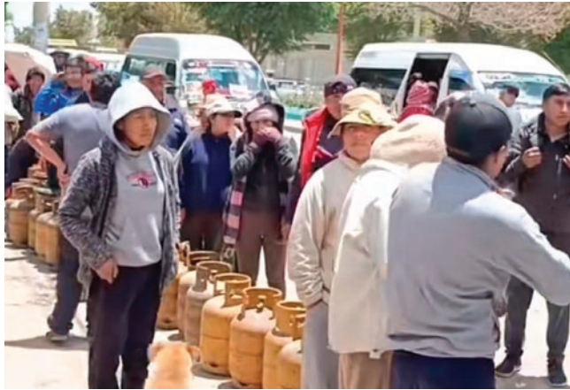
Largas filas se registran por GLP