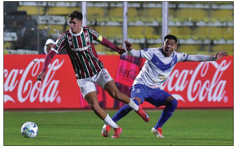
El triunfo de GV San José ante Fluminense (1-0) una grata emoción del 2025

En el torneo por series, el panorama fue distinto. GV San José