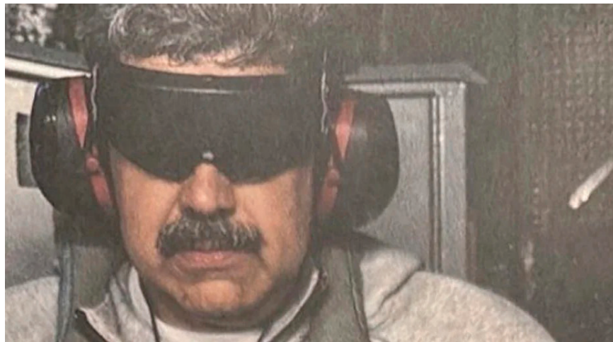
Nicolás Maduro siendo trasladado en un avión a Estados Unidos

Fox News, la operación militar nocturna estadounidense implicó un gran despliegue de helicópteros “Chinook” y otros activos de las fuerzas especiales Delta Force para capturar a Maduro, que habría sido sacado del país en una de estas aeronaves.