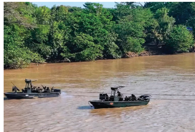
Ministro de Defensa colombiano confirmó militarización frontera con Venezuela

Según el ministro, “se alertaron y activaron todas las capacidades de la Fuerza Pública para anticipar y neutralizar cualquier intento de ataque terrorista por parte del cartel del ELN o de otros grupos armados