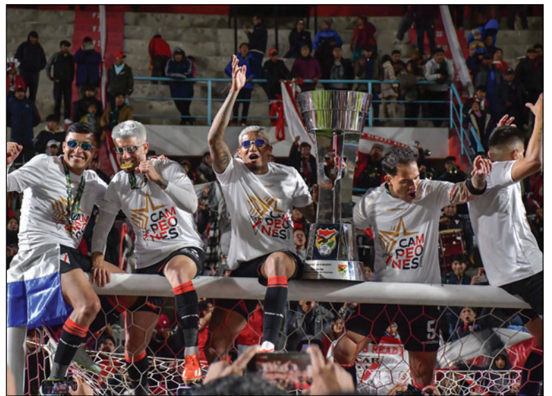
Always Ready a pesar de las críticas se consagró campeón

De este torneo también salieron los implicados en el descenso, muchos ya se hicieron la idea que Au-