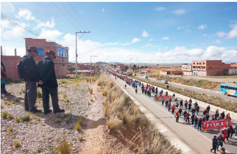
La marcha en su paso por la carretera que conecta Oruro con La Paz

incorporando más sectores hasta el arribo a la ciudad de La Paz, previsto para el lunes.