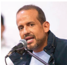
El gobernador de Santa Cruz, Luis Fernando Camacho

En Estados Unidos, legisladores del Partido Demócrata pusieron en duda la legalidad de la operación al advertir que no habría contado con la autorización del Congreso. Esto abrió un nuevo debate político interno sobre las acciones militares en Venezuela.