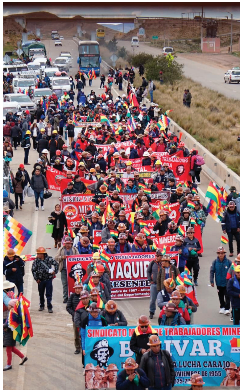
Distintos sectores participan de la marcha convocada por la COB