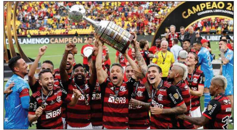
Flamengo se consagró campeón de Copa Libertadores

Los equipos bolivianos no tuvieron una buena campaña como se esperaba. Blooming en primera fase quedó eliminado por El Nacional de Ecuador en los penales 4-3 luego de ganar 3-2 en Santa Cruz y perder 2-1 en la revancha.