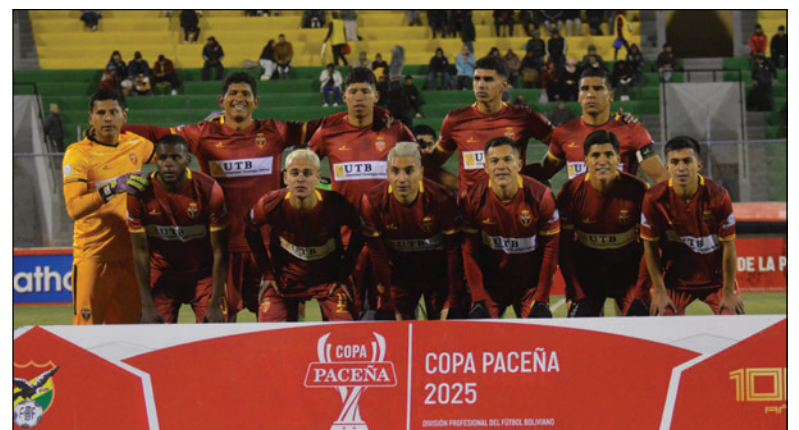
CDT Real Oruro tuvo su mejor presentación en el torneo por series