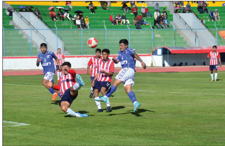
Ingenieros y CD Guadalajara realizaron buena labor en la Copa “Simón Bolívar”

CD Guadalajara vivió una historia similar. En Challapata dio el batacazo venciendo 2-0 a Real Potosí. Ese resultado hizo soñar a la afición con una clasificación. Pero