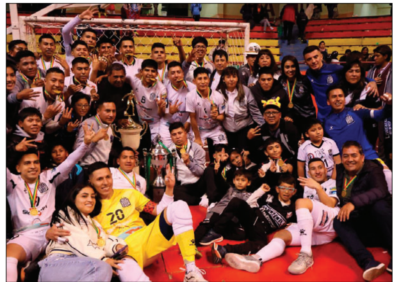
Fantasmas Morales Moralitos tetracampeón nacional/LA PATRIA

club, demostró que Oruro puede ser epicentro del futsal boliviano y protagonista en Sudamérica.