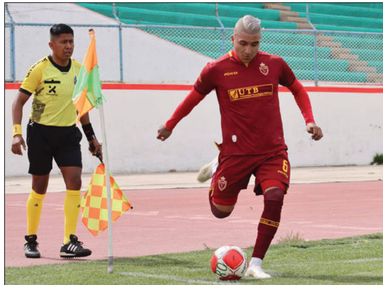
Thomas oficializó su incorporación a Real Potosí/RRSS