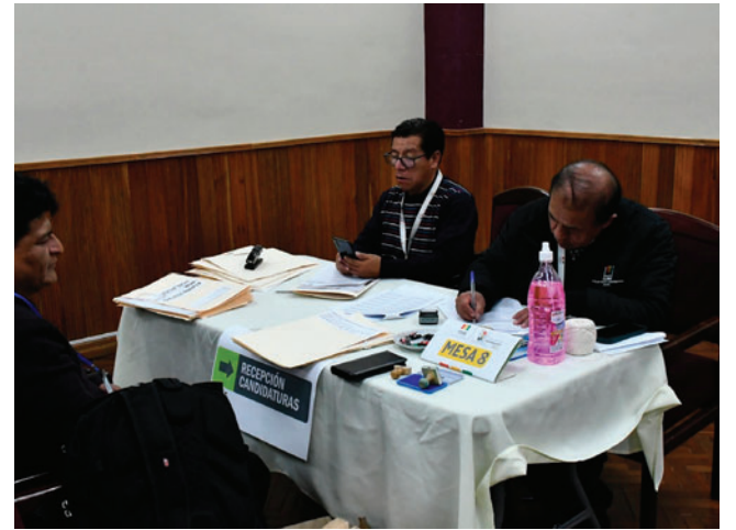
El municipio de Oruro concentra la mayor cantidad de postulantes a la Alcaldía a nivel departamental

En el ámbito departamental, el TED recibió la inscripción de 14 aspirantes a la Gobernación de Oruro, además de 752 postulantes a la Asamblea Legislativa Departamen-