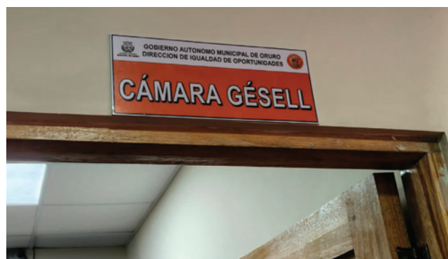
La Cámara Gesell funcionará en ambientes de la DIO en la Presidente Montes y Ayacucho

“Vamos a poder atender a nuestras víctimas que sufren algún tipo de violencia, evitando la revictimización”, enfatizó Gutiérrez. Este nuevo edificio ha sido remodelado para adecuarse a las necesidades de atención de la DIO. Está ubicada en la esquina de la Presidente Montes y