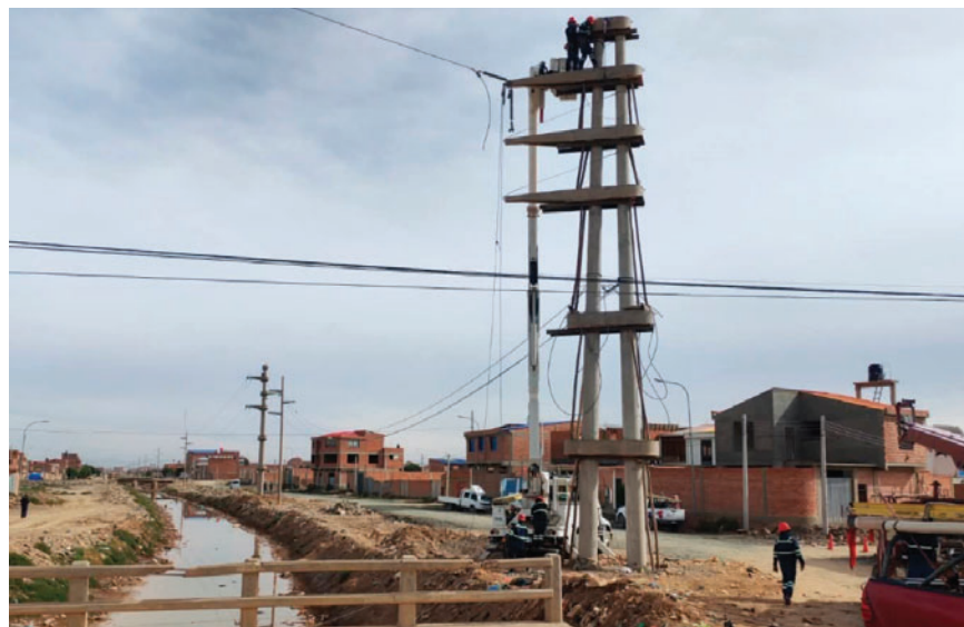
Con los cortes programados se pretende encarar trabajos para mejorar la red eléctrica

Para el martes 6 de enero, ENDE DeOruro programó la interrupción del servicio eléctrico también de 09:00 a 14:00 horas en la zona Sur, sector Magallanes. Los límites establecidos son: al Sur la avenida América, al Norte Tomás Frías, al Este la avenida Circunvalación y al Oeste la avenida Antofagasta.