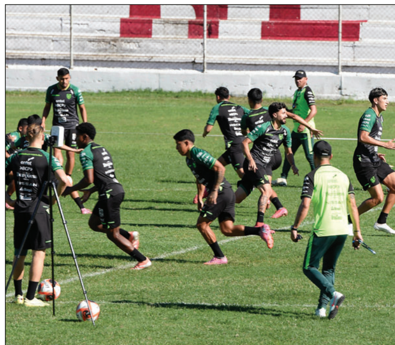
El plantel boliviano tiene un objetivo claro de cara al repechaje

dólares el tercer puesto recibirá 29 millones de dólares el subcampeón también tendrá como recompensa 29 millones de dólares y finalmente el campeón del mundo se llevará 50 millones de dólares consolidando así un récord histórico en la distribución de premios económicos en la máxima cita del fútbol mundial.