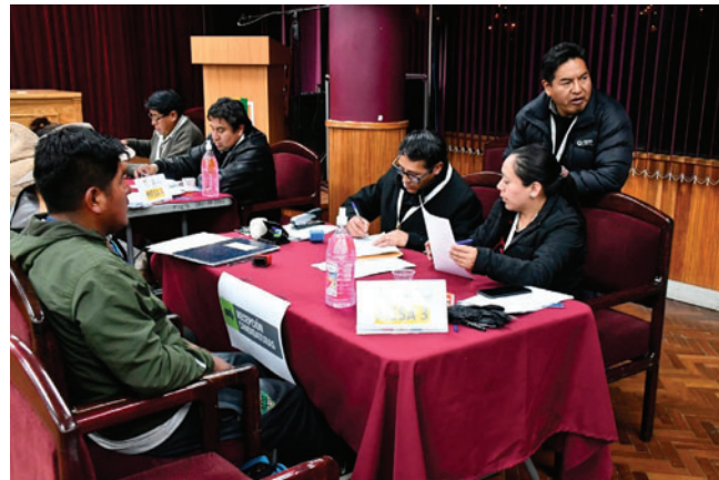
La lista de candidatos oficiales se conocerá incluso hasta febrero cuando se haga sustituciones

Desde el TED Oruro se informó que la lista oficial de candidaturas habilitadas será publicada en los próximos días del mes de enero, lo que permitirá dar inicio a la siguiente fase del proceso electoral subnacional 2026 en el departamento.