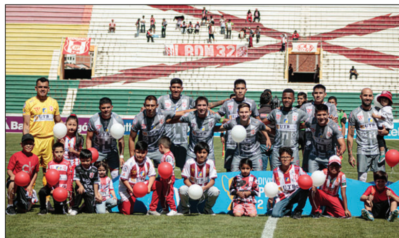
Independiente es el elenco con más demandas de jugadores

El fichaje no pasa desapercibido en el ámbito mediático debido a su parentesco con el presidente de Bolivia Rodrigo Paz lo que añade un componente institucional y de atención pública alrededor de su llegada al club altoño.