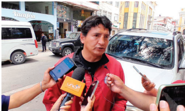
Padres de familia piden a la justicia definir responsabilidades de la fiesta escolar

vo que la experiencia del SarachoFest deja al descubierto la necesidad de ordenar responsabilidades, roles y mecanismos de autorización en las actividades escolares, y reiteró que será la investigación la que determine si hubo manipulación, negligencia o errores compartidos entre las partes involucradas.