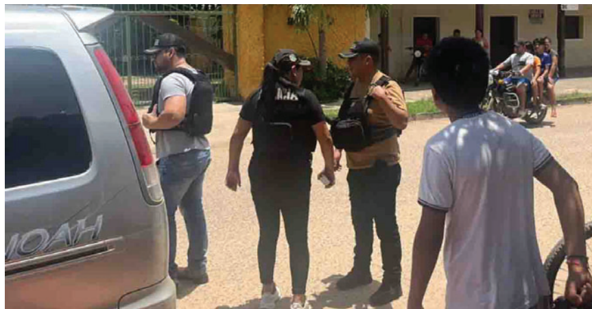
Conmoción en Saavedra por el doble crimen de una madre y su hijo