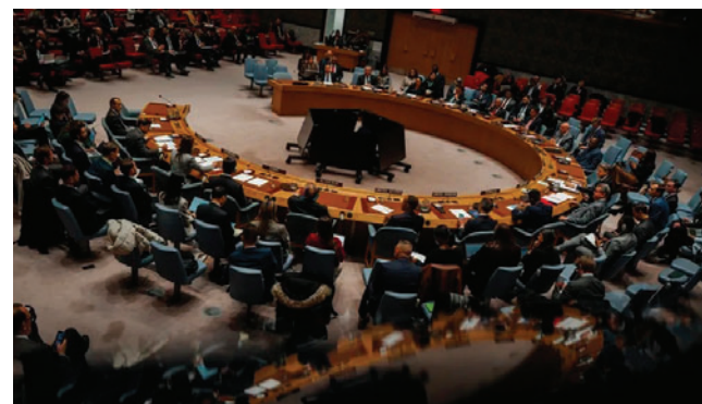
El Consejo de Seguridad de las Naciones Unidas en Nueva York, Estados Unidos

Guterres también subrayó “la importancia del pleno respeto —por parte de todos— del derecho internacional, incluida la Carta de las Naciones Unidas” y pidió a las partes “entablar un diálogo inclusivo, con pleno respeto a los derechos humanos y al Estado de derecho”.