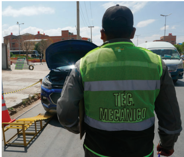
El operativo develó irregularidades en un puesto de ITV

Tres policías fueron aprehendidos en un punto de Inspección Técnica Vehicular (ITV)