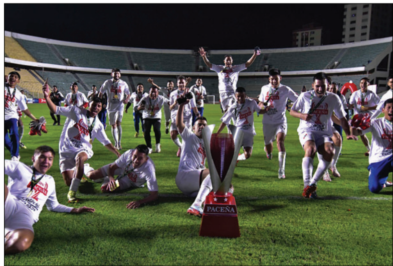
Nacional Potosí salvó el año conquistando el primer lugar en el torneo por series/APG