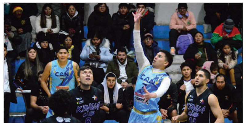
CAN no pudo realizar una buena campaña en la Libobásquet

CAN vivió un año aún más complicado. El cambio de entrenadores afectó la estabilidad. La salida de jugadores clave debilitó al plantel. La pausa del torneo por conflictos sociales también influyó. Los “cani-