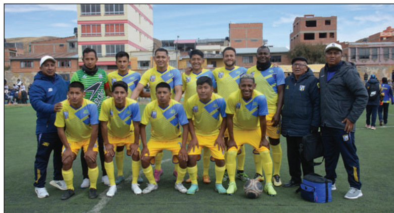
EM Huanuni se consagró campeón de la temporada 2025 en la Primera “A”

La otra cara fue San José. El club “santo” arrastra problemas desde su caída de la División Profesional. Las deudas continúan sin solución. El sistema Comet bloqueó la inscripción de nuevos jugadores. La crisis institucional se agudizó con un presidente cuestionado y decisiones erráticas en la elección de entre-