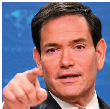
El secretario de Estado de EE.UU., Marco Rubio

“Me ha informado de que Nicolás Maduro ha sido arrestado por personal estadounidense para enfrentarse a un juicio por cargos penales en los Estados Unidos y que las acciones militares que vimos esta noche fueron para proteger y defender a aquellos que ejecutaban la orden de arresto”, indicó en X el