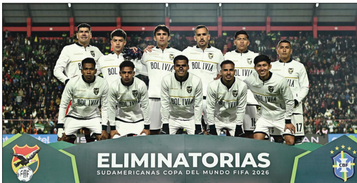
Bolivia después de 32 años tiene la posibilidad de clasificar al Mundial