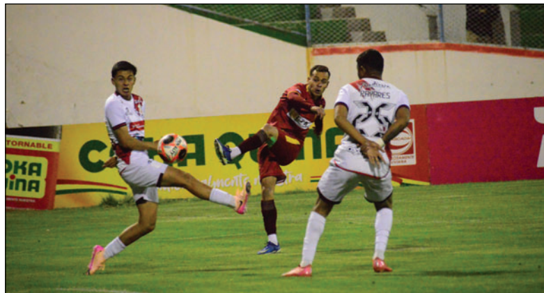
El equipo realista no pudo ganar algunos partidos considerados "clave"

La hinchada, fiel y apasionada, acompañó cada paso, consciente de que el camino recién comienza. La primera temporada en la División Profesional quedará en la memoria como un año de contrastes, de ilusión y tropiezos, de oportunidades perdidas y de lecciones que deberán ser capitalizadas para que el club pueda consolidarse en el futuro.