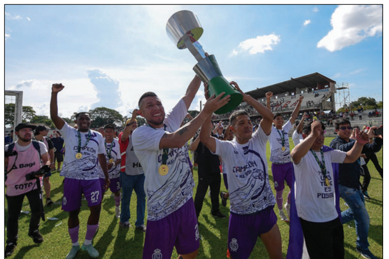
Real Potosí vuelve al profesionalismo después de cuatro años

Este campeonato, comenzó jugándose por series, de manera regionalizada, luego en la segunda fase, también se armaron grupos de donde los mejores clasificaron a los oc-