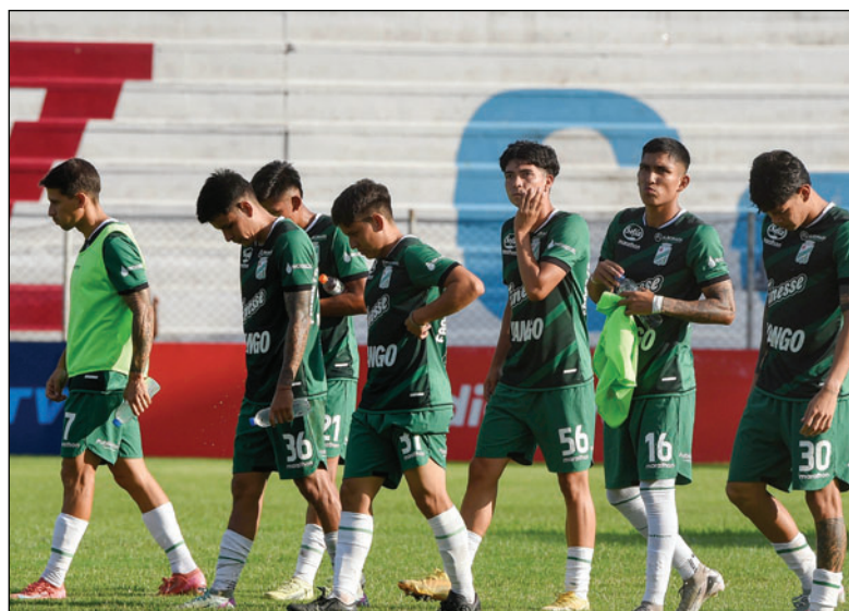
Oriente Petrolero es otro de los elencos que está complicado en el tema de demandas/APG

Wilstermann, plantel que descendió de categoría, se marchó del profesionalismo, con ocho demandas, de las cuales dos están sancio-