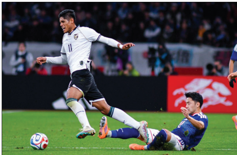
Los partidos amistosos a pesar de los malos resultados sirvieron para mejorar el rendimiento

La alegría del fútbol boliviano llegó por doble partida en esta temporada, porque junto al objeti-