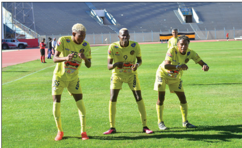
Deportivo Shalon fue el que más lejos llegó en el torneo nacional

La Copa “Simón Bolívar” 2025, marcó un punto de inflexión para la participación orureña. Tras la consagración de GV San José como campeón en 2023 y la histórica, aunque controvertida, clasificación de CDT Real Oruro en 2024, muchos soñaban con la posibilidad de ver a un tercer equipo en la División Profesional. Sin embargo, en los momentos clave del torneo, los representantes orureños no lograron dar talla.