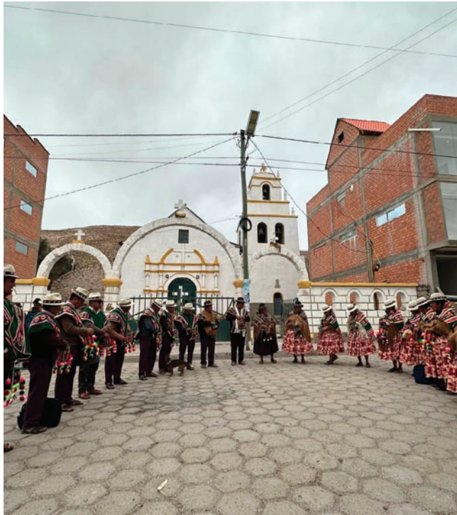
Las autoridades originarias de Turco comenzaron su gestión con ritual