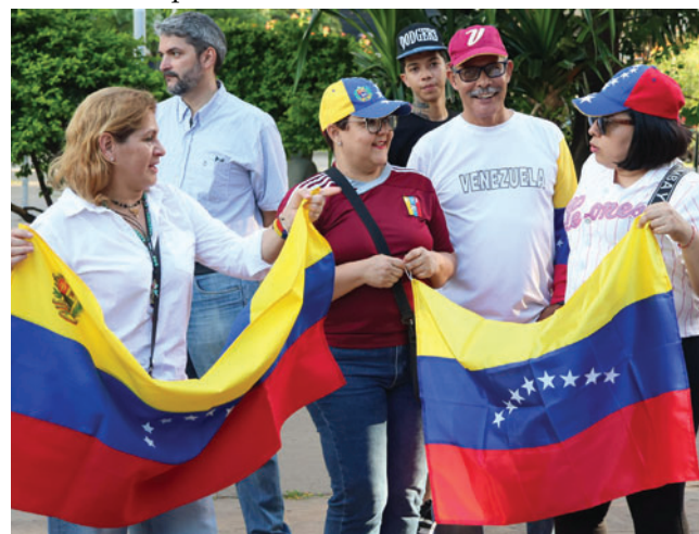
Ciudadanos venezolanos celebran durante una manifestación el 3 de enero de 2026, en Santa Cruz

Tras ser elegido presidente, Paz se alejó de los Gobiernos de Cuba, Nicaragua y Venezuela. Esta decisión le valió ser suspendido del bloque bolivariano ALBA. Evo Morales y Luis Arce, exgobernantes aliados políticos de Maduro, condenaron por separado la acción estadounidense en Venezuela.