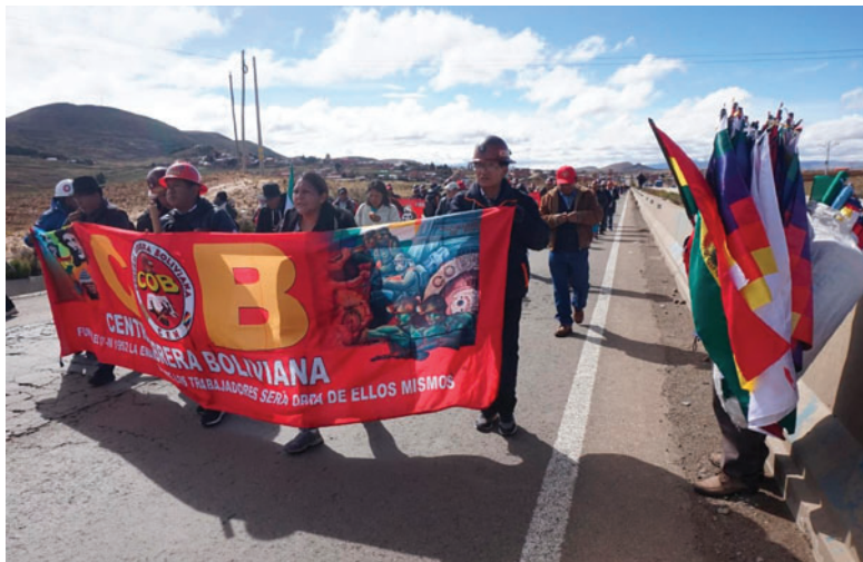
La marcha partió en horas de la mañana del sábado