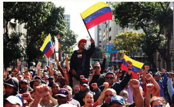
Chavistas salieron a las calles del centro de Caracas para exigir que “devuelvan” a Nicolás Maduro