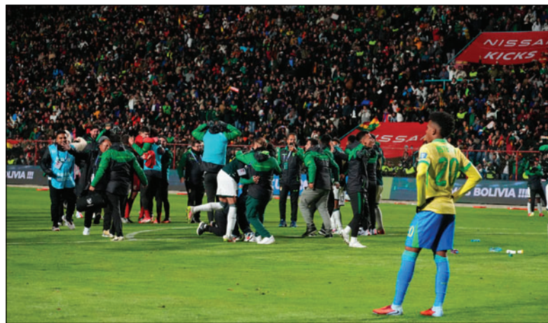
Ganar a Brasil en la última fecha (1-0) le dio el boleto al repechaje

La FIFA, organizador del mundial de fútbol, ya realizó el sorteo correspondiente, y si es que todo sale bien y se logra el objetivo de clasificar al Mundial 2026, Bolivia se enfrentaría a las selecciones de Francia, Senegal y Noruega, sin duda un grupo muy complicado, pero lo bueno es que, al