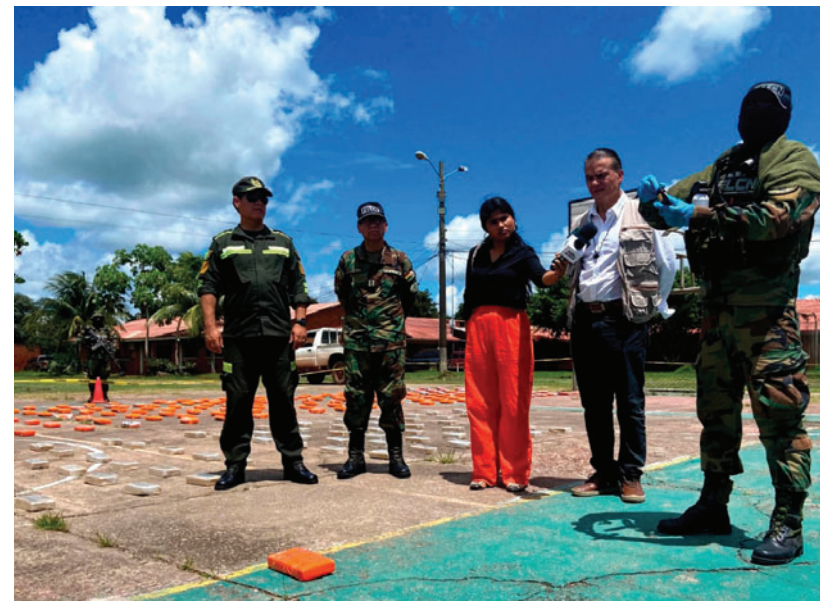
Autoridades de Gobierno afirmaron que la afectación al narcotráfico supera los 1,3 millones de dólares

cial y Sustancias Controladas, sostuvo que “este resultado demuestra el trabajo de inteligencia y la acción oportuna contra estructuras dedicadas al acopio y tráfico de drogas en el país”.