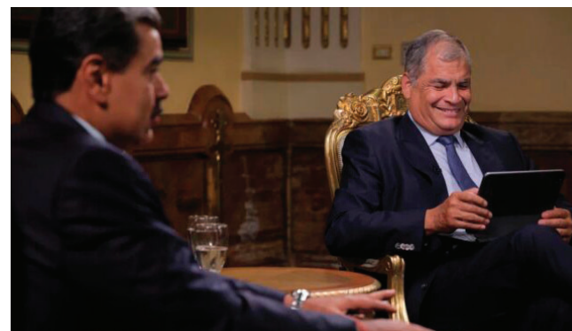
Correa entrevistando a Nicolás Maduro en el programa “Conversando con Correa”

Revolución Ciudadana recordó que “el atroz ataque de Estados Unidos a Venezuela constituye una grave violación del derecho internacional, en particular de los derechos fundamentales consagrados en la carta de las Naciones Unidas”. El