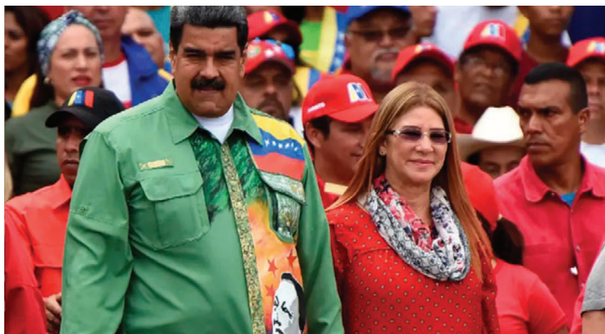
Nicolás Maduro y su esposa, hoy capturados por el gobierno de Estados Unidos

“Existe una plena articulación militar, popular y policial para garantizar la defensa integral de la nación”, sostuvo Rodríguez. Asimismo, condenó lo