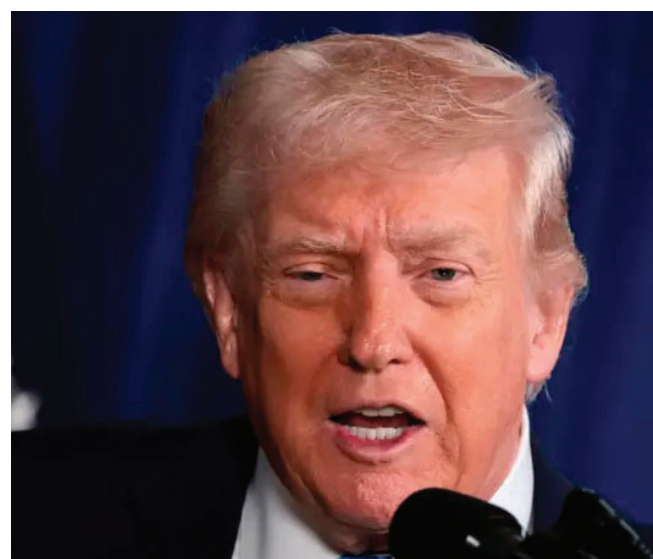
El presidente de Estados Unidos, Donald Trump

El presidente acusó al régimen de Maduro por el envío de pandillas criminales a Estados Unidos, particularmente al Tren de Aragua, al que responsabilizó de asesinatos y