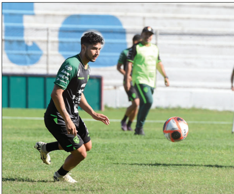
El cuadro de Villegas tendrá un mes de enero bastante agitado/APG

La FIFA estableció además que los premios económicos se repartirán de la siguiente manera en la fase de grupos cada equipo recibirá 9 millones de dólares por su participación en los dieciseisavos de final la cifra ascenderá a 11 millones de dólares mientras que en los octavos de final el monto será de 15 millones de dólares en los cuartos de final comprendidos entre el quinto y octavo puesto la bonificación alcanzará los 19 millones de dólares el cuarto lugar obtendrá 27 millones de