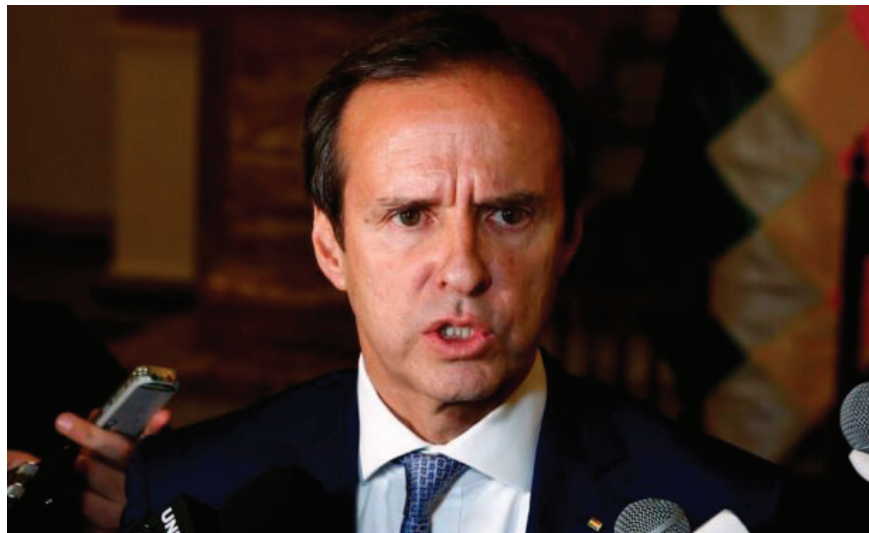
El exmandatario Jorge Tuto Quiroga

El Gobierno del centrista Rodrigo Paz apoyó antes al “pueblo venezolano” en lo que consideró el inicio de un camino de “recuperación de su democracia” y consideró “ineludible” que haya una “transición democrática real” en Venezuela.