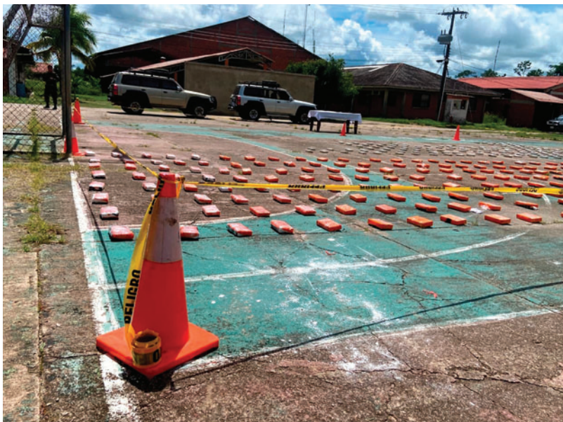
Incautaron más de 580 kilos de cocaína en un operativo en San Ramon

La intervención se llevó a cabo tras información procesada por inteligencia antidrogas. Efectivos de la Felcn ingresaron a un inmueble con consentimiento voluntario de una mujer, donde hallaron 15 bolsas de yute con paquetes tipo ladrillo que dieron positivo a cocaína en la prueba de campo. En total, se encontraron 400 paquetes de clorhidrato de cocaína y 149 paquetes de pasta base, con un peso total de 431,650 gramos de clorhidrato y 152,450 gramos de pasta base.