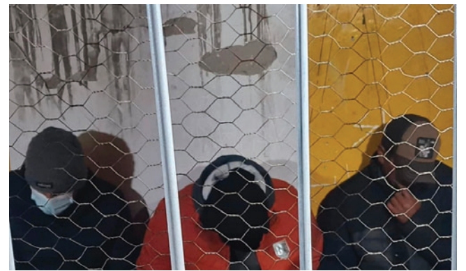
Los tres uniformados en la carcelita del Ministerio Público

De acuerdo con la investigación, a partir de una denuncia y verificación realizada por personal de la Inspectoría del Comando Departamental de Policía de Oruro, con apoyo de efectivos de la División Anticorrupción y del Laboratorio de la Fuerza Especial de Lucha Contra el Crimen (Felcc), y en presencia del fiscal