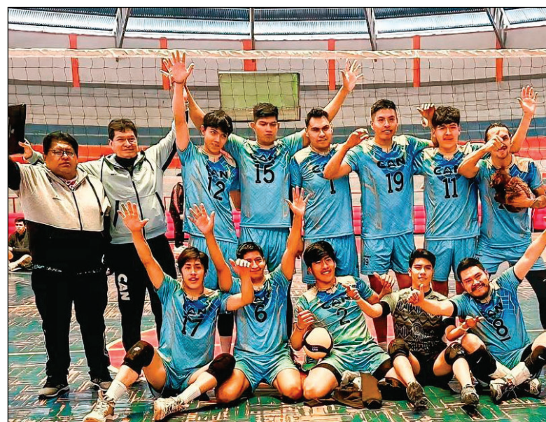
CAN logró volver a la Liga Superior, pero no le fue bien y descendió

La alegría llegó en noviembre con el Club 10 de Febrero. El elenco orureño se proclamó campeón del Nacional de Clubes Menores 2025.