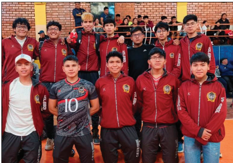
10 de Febrero fue la grata sorpresa del año en el voleibol

Este logro refuerza el crecimiento del voleibol en Oruro. El contraste entre el descenso de CAN y la consagración juvenil refleja un 2025 de emociones. La región reafirma su condición de epicentro del voleibol boliviano. El desafío ahora es consolidar procesos y mantener protagonismo en todas las categorías.