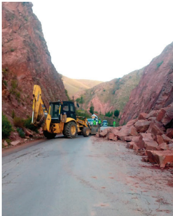
Maquinaria pesada despejó el camino

El incidente ocurrió cuando material rocoso cayó sobre la vía. La ABC desplazó maquinaria especializada y personal de emergencia para atender la situación. Gracias a esta intervención, se logró habilitar un carril de circulación, restableciendo parcialmente el tránsito vehicular en el sector afectado.