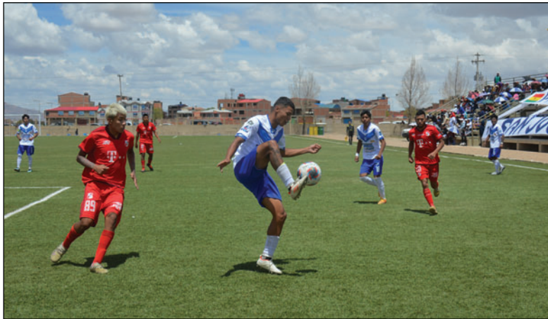
San José entre la incertidumbre y la agonía por mantenerse en la Primera “A” / LA PATRIA

nadores. Un reducido grupo de futbolistas mantiene vivo al plantel, aunque con limitaciones evidentes.