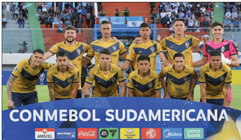
GV San José tuvo su primera participación internacional el 2025

Bolívar que provenía de Copa Libertadores, venció en el playoff a Palestino y clasificó a octavos de final, etapa en la que se enfrentó a Cienciano de Perú, ganó 2-0 en La Paz y también ganó 2-0 en Cusco. En cuartos de final, empató 2-2 con Atlético Mineiro en La Paz y perdió 1-0 en Brasil. Así finalizó la participación de los cuadros bolivianos, en esta competencia internacional.