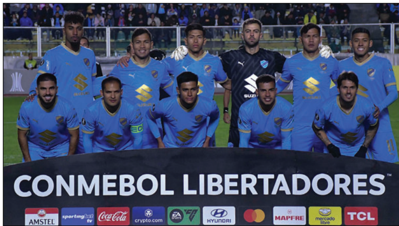
Bolívar no pudo clasificar a octavos, pasó a Copa Sudamericana donde llegó hasta cuartos

En cambio, Bolívar superó esta fase dejando en el camino a Palestino, ganó los dos partidos por 3-0 en La Paz y en Santiago. En octavos, rivalizó contra Cienciano equipo al que venció con un doble 2-0 en La Paz y en Cusco. Pero en cuarto de final, se topó con el Atlético Mineiro, resultó eliminado tras el 2-2 en La Paz y la derrota de 1-0 en la revancha.