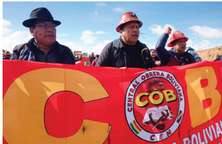
La COB aseguró que más organizaciones se sumarán a su marcha

La movilización marca el inicio de una nueva ola de