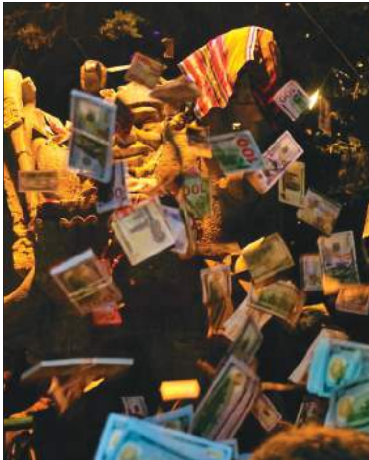
VÍSPERA. Anoche se realizó la ceremonia de agradecimiento.

Para este 24 de enero, los actos oficiales comenzarán a las 11.00