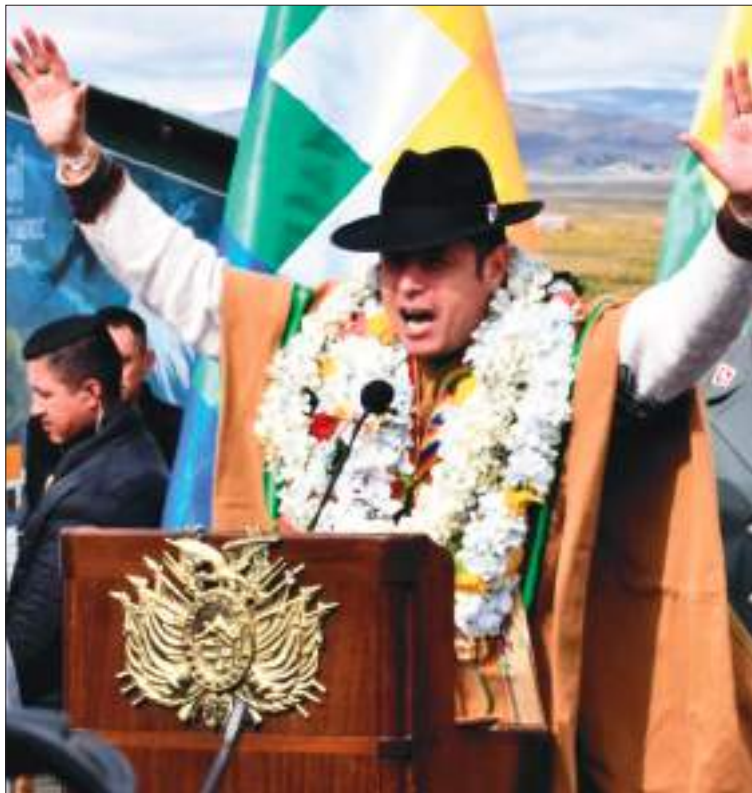
VICEPRESIDENTE. Edmand Lara en la Apacheta el jueves.

“También exhorto a las autoridades del Tribunal Supremo Electoral a que lleven adelante