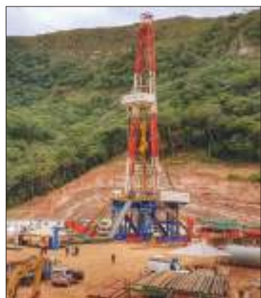
Un pozo petrolero de YPFB.

En nueve meses de 2025, los ingresos llegaron a $us 760 millones