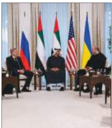
El inicio del encuentro tripartito.

El avance es lento y hoy se realizará la segunda ronda del encuentro