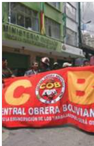
Una marcha de la COB.

ENCUENTRO. El encuentro se realizará en miércoles 28 en la ciudad de Sucre