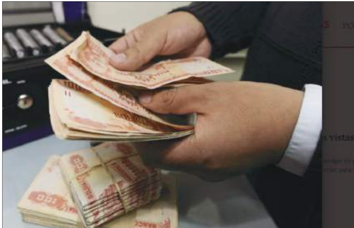
ECONOMÍA. Una persona cuenta dinero en bolivianos.

“Las empresas ya enfrentan la disminución sostenida de la demanda interna, el efecto de los conflictos sociales recientes, las