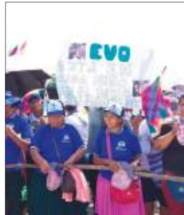
Evistas con máscaras de su líder.

Desde hace más de dos semanas, Morales dejó de aparecer en actos públicos.