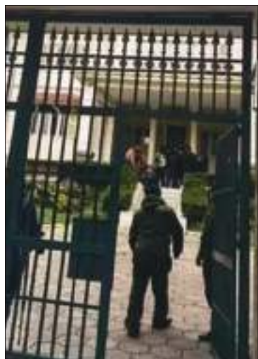
Ingreso al edificio del TSE.

La no presentación de estados financieros arriesgan la personería