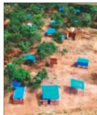
Un predio avasallado.

Asimismo, explicó que la coordinación institucional ingresará predio por predio para ejecutar los desalojos cuando corresponda, aplicando el debido proceso "sin que ello implique vulneración a los derechos humanos".