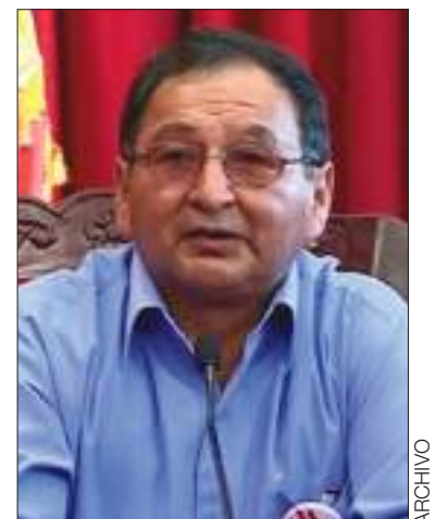
El exgobernador Lino Condori.

El fiscal señaló que se verificó el traslado y el ingreso del sentenciado.