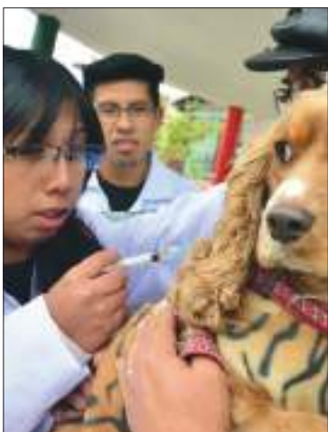
Vacunación de mascotas.

En Santa Cruz de la Sierra, el 16 de enero Zoonosis confirmó un nuevo caso de rabia canina tras más de dos años del último. Las autoridades municipales declararon la alerta sanitaria. Se trataba de un cachorro que falleció el 14 de enero y cuya muerte fue por rabia canina, confirmada con estudios de laboratorio.