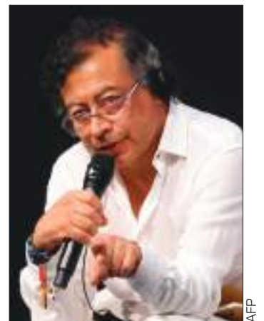
Petro fue amenazado por Trump.

"Se confirmó que al señor presidente Petro se le proveerán todas las garantías propias de una visita de un jefe de Estado", ha hecho saber el Gobierno colombiano tras la conversación mantenida ayer entre la ministra de Exteriores, Rosa Yolanda Villavicencio Mapy, con el secretario de Estado estadounidense, Marco Rubio. Además, se confirmó la fecha del encuentro.