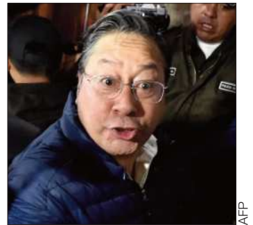
El expresidente Luis Arce.

Con la declaratoria de rebeldía, el Ministerio Público activará nuevas medidas para dar con su ubicación y avanzar en el proceso penal.