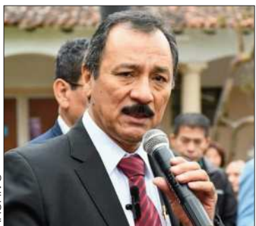
El exrector de la UAGRM.

La decisión, según el exrector de la UAGRM, es por problemas de salud