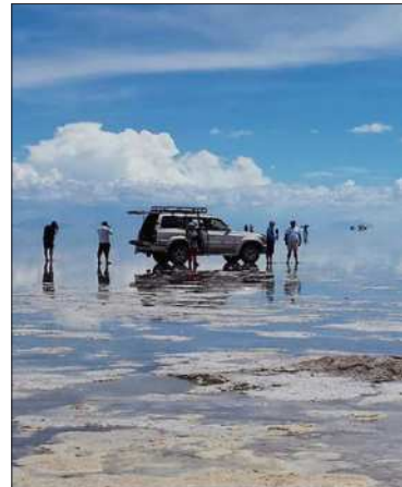
Salar de Uyuni, un ansiado destino

Las agencias de viaje activaron ofertas para distintos presupuestos y perfiles de viajeros. Entre los destinos más demandados figuran el lago Titicaca, las rutas de trekking al Illimani y al Nido de Cóndores, las cascadas de Hampaturi, los Yungas paceños y el Chapare cochabambino para deportes de aventura. También destacan el Parque Nacional Sajama y el salar de Uyuni.