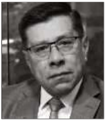
Walker San Miguel es abogado y fue ministro de Estado