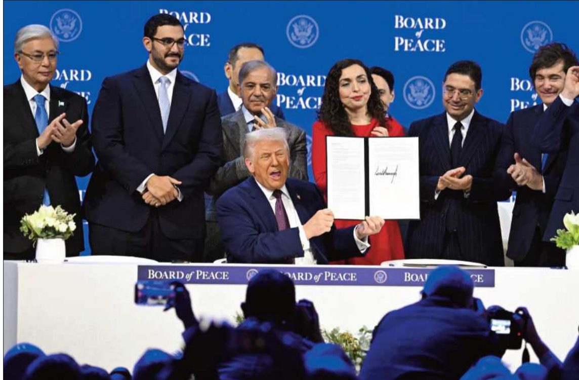
PRESENTACIÓN. La firma del documento fundador del Consejo de Paz en el foro económico de Davos.