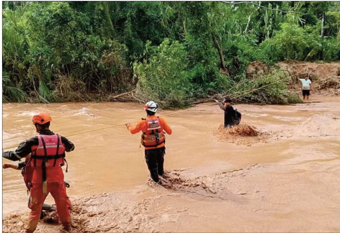
ASISTENCIA. Labores de evacuación a familias afectadas por las inundaciones en el municipio de El Torno.

Indicó que, hasta el momento, el Servicio Nacional de Meteorología e Hidrología (Senamhi) no