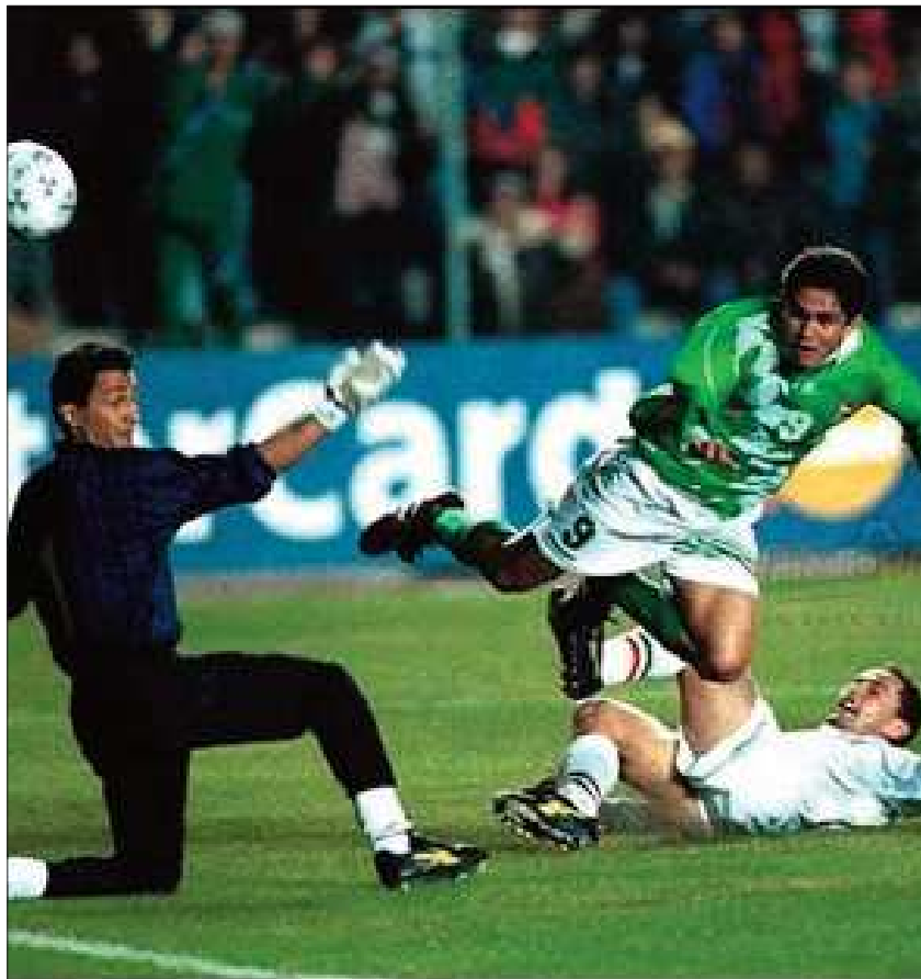
GOL. Jaime Moreno anota el tercer gol a México, fue el 25 de junio de 1997.

viano perdió 1-0 ante los norteamericanos, que es potencia de Concacaf.