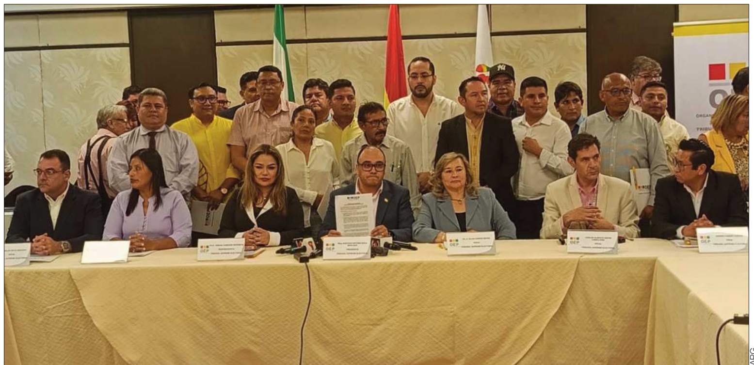
REUNIÓN. El Tribunal Supremo Electoral (TSE) y representantes de organizaciones políticas de todo el país firmaron un acuerdo.

Otro punto central del acuerdo es la lucha contra la desinformación. Las organizaciones políticas