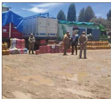
MINISTERIO DE DEFENSA