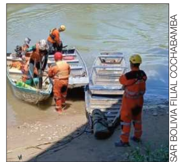
Rescatistas hallaron el cuerpo.

El operativo de rescate estuvo conformado por al menos 20 rescatistas. Participaron el SAR-Bolivia, además del personal de la Unidad de Gestión de Riesgos (UGR). Ellos intensificaron los operativos hasta dar con el paradero del menor.