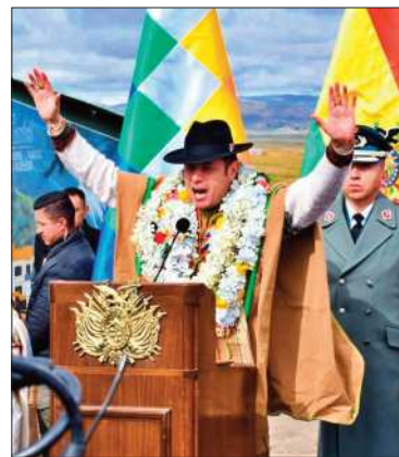
El vicepresidente recordó la fecha.

La fecha se celebra en recuerdo de la asunción al poder de Evo Morales el 22 de enero de 2006.