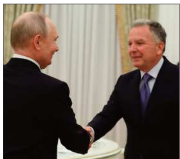
El saludo entre Putin y Witkoff.

La reunión tuvo lugar tras la entrevista de Zelenski con Trump en Suiza