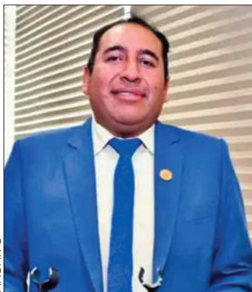
Viceministro Santamaría dio el dato

Al menos 30 procesos se encuentran demorados, incluido uno contra Evo