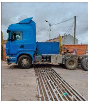
Bloqueo en la estación de Potosí

Un grupo de camiones de transporte pesado se interpuso en las vías.