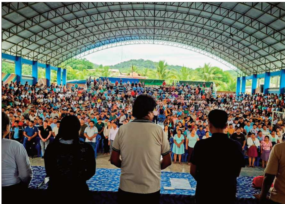
AMPLIADO. Evo Morales fue visto públicamente por última vez el 30 de diciembre de 2025 en Lauca Ñ.

Las autoridades reiteraron que actuarán conforme a la ley y a los