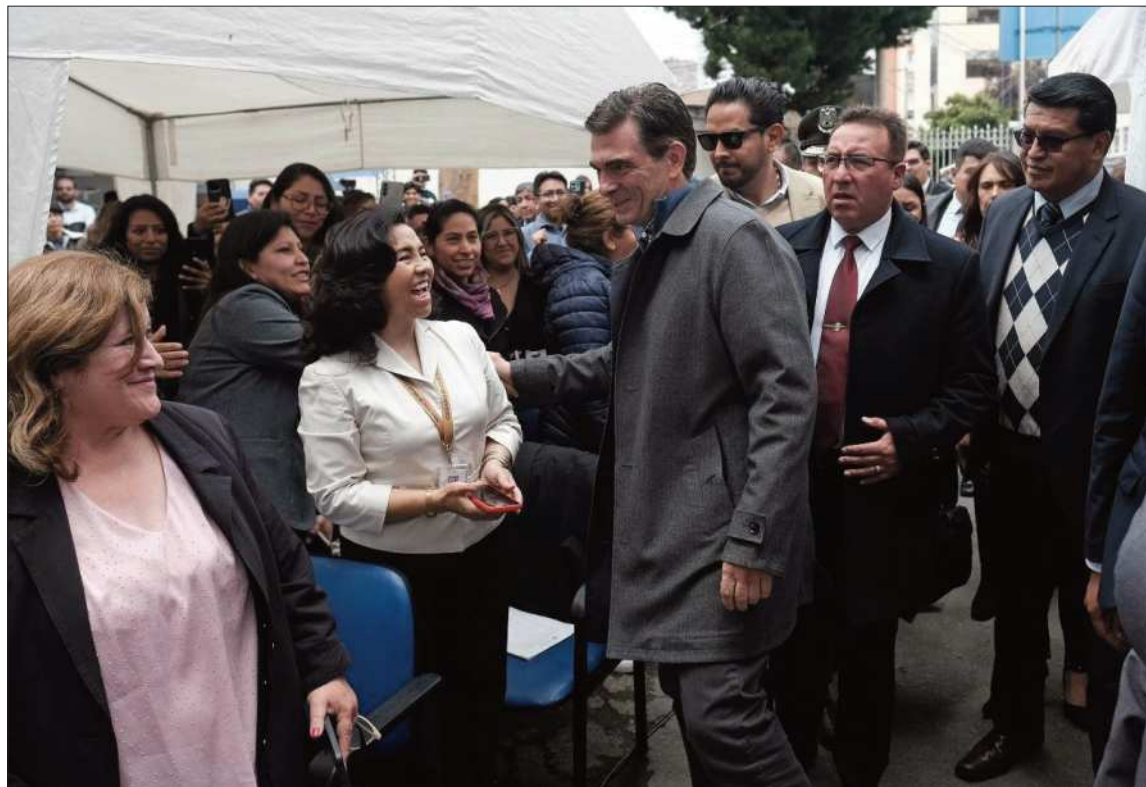
DEUDA. El presidente del Estado Plurinacional, Rodrigo Paz Pereira, defiende el uso de la deuda externa

"Si la deuda va a ser para producir, si la deuda va a ser para reactivarnos y aquellos que no son a fondo perdido en salud y educación ¿por qué no? No seas acomplejado, no es un problema de imperialismo, es un problema