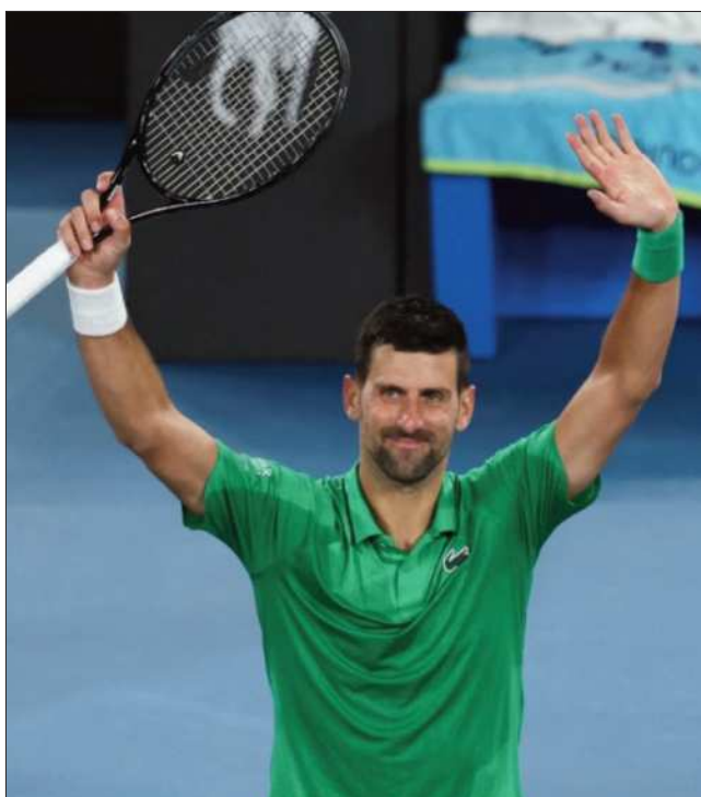
FIGURAS. El serbio Novak Djokovic y la polaca Iga Swiatek.

Ticona tuvo una impecable actuación, pues se impuso en siete partidas, empató en una y solo perdió una vez.