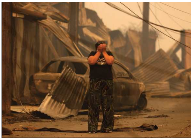
CONCEPCIÓN. Un residente en medio de casas carbonizadas.

El mandatario chileno advirtió, no obstante, que se registran "nuevos focos en la región de la Araucanía y eso implica necesari-