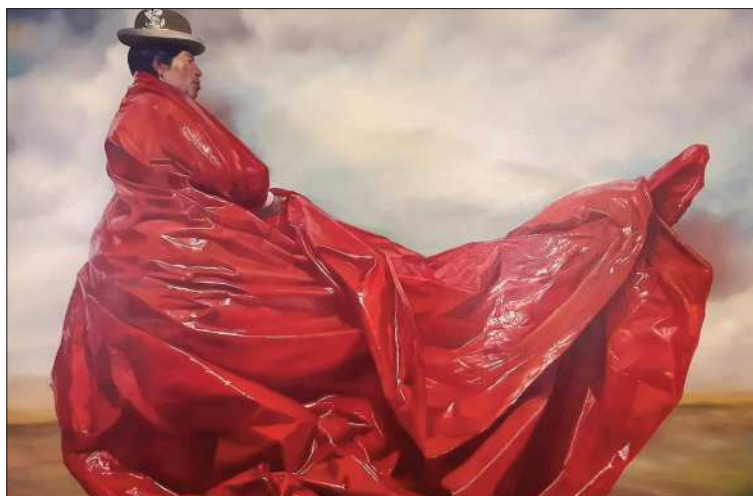
TRABAJOS. Una de las obras que se exhibirán en México.