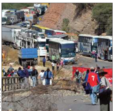
Faltan cuatro TED que definirse

Los tribunales de La Paz, Oruro, Cochabamba y Potosí siguen acéfalos.