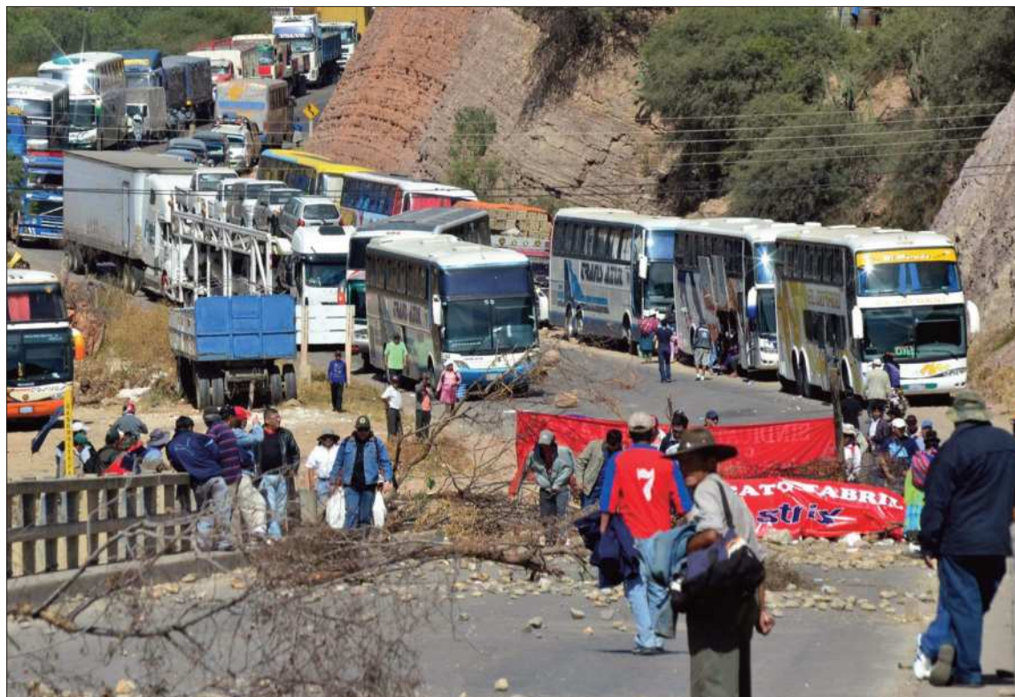
MEDIDA. Las últimas protestas en el país motivaron a la clase política a tratar de frenar los bloqueos.

PROCESO. Actualmente, en la Asamblea Legislativa hay al menos tres proyectos que buscan impedir los bloqueos. El más avan-