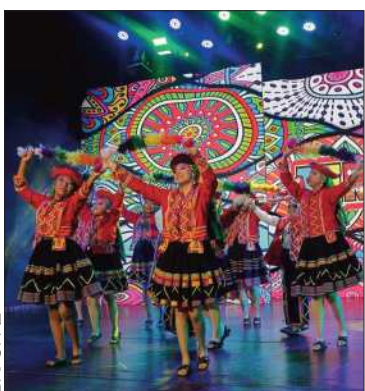
Integrantes del ballet folklórico.

El ballet ofrecerá a su público un espectáculo con bailes avanzados