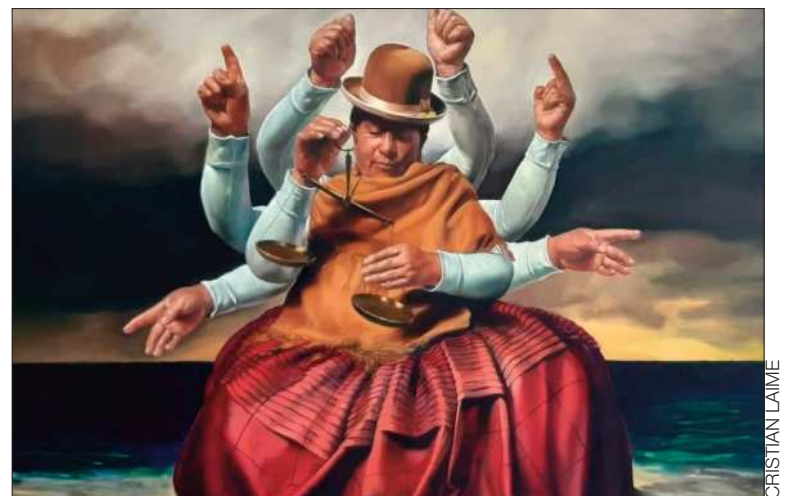
MUESTRA. La narrativa reflexiona sobre la identidad y la memoria.