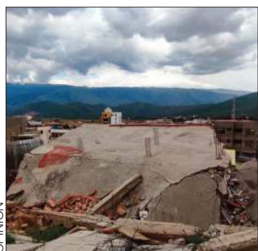
Una vivienda desplomada.

Varias familias perdieron la mayoría de sus pertenencias