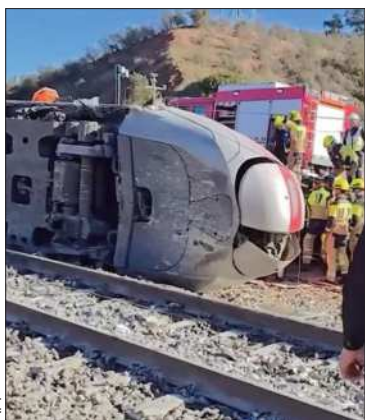
La escena del accidente.

Pedro Sánchez prometió 'transparencia' sobre las causas del accidente