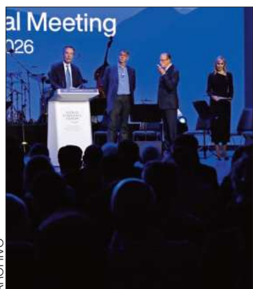
Imagen de un foro anterior.

El canciller Fernando Aramayo participa en un foro económico en Suiza