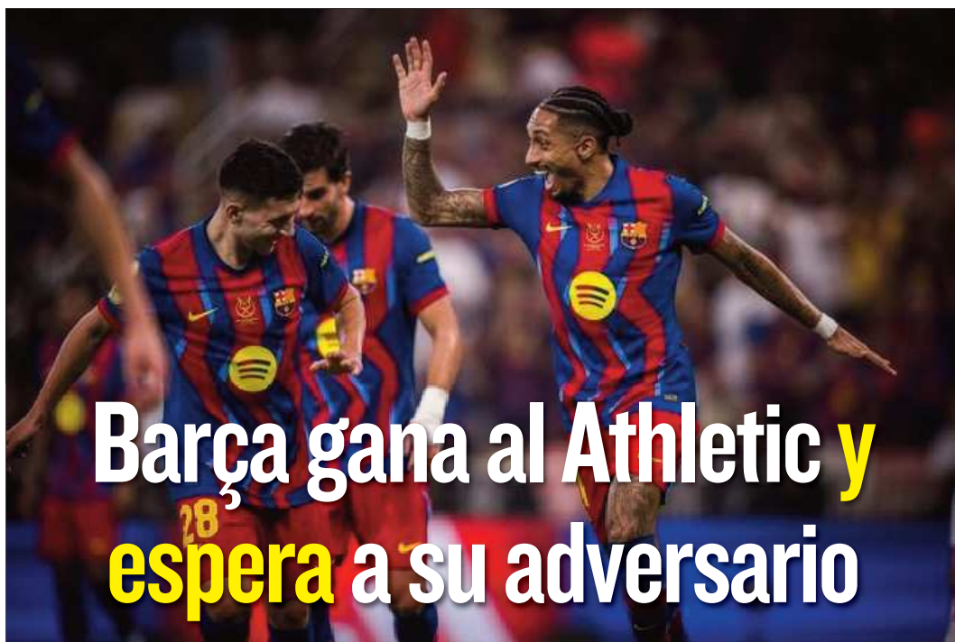
CELEBRACIÓN. Los jugadores del Barcelona festejan uno de los cinco goles ante el Athletic.