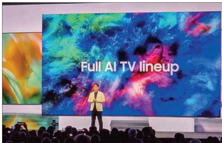
Samsung está construyendo una experiencia más unificada y personal.