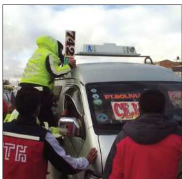
Funcionarios realizan control.

Ayer empezaron las asambleas distritales para abordar el tema transporte