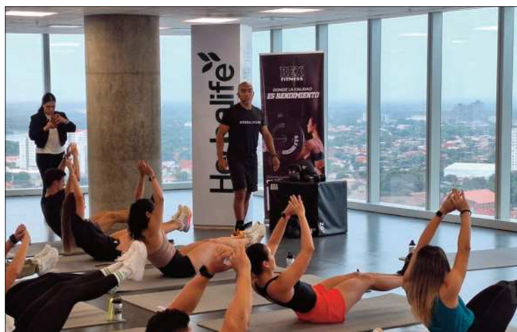
La fórmula especial de Liftoff incluye ingredientes clave como Panax ginseng.