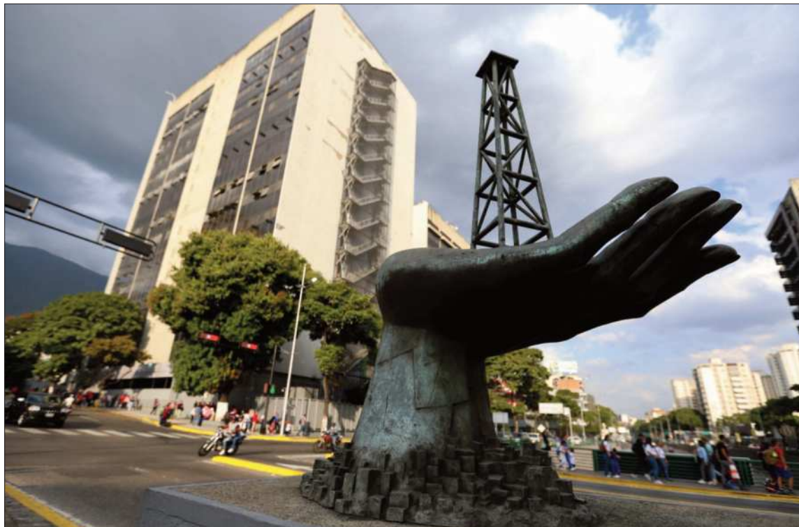
VENEZUELA. Una escultura de una mano que sostiene una plataforma petrolera en la estatal PDVSA.

Las decisiones de Venezuela serán "dictadas" por Washington, aseguró ayer la portavoz de la Casa Blanca, Karoline Leavitt, una declaración de gran calado político que por ahora es rechazada por la presidenta interina del país