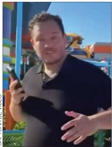
CAPTURA DE VIDEO