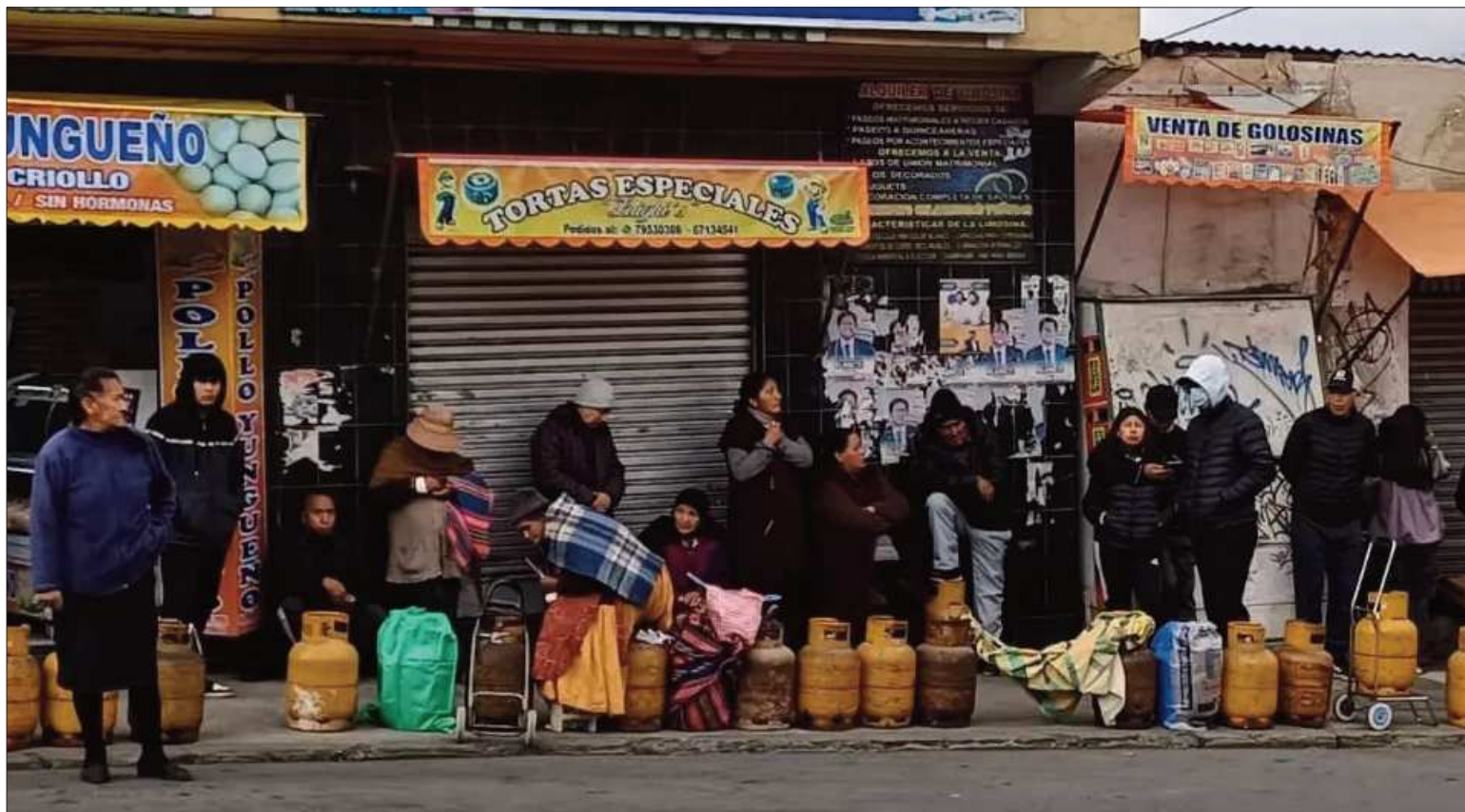
DEMANDA. Largas filas en La Paz para conseguir una garrafa de gas. El gobierno promete normalizar su distribución en todo el país.

En La Paz también hay largas filas en algunas zonas donde realizan bloqueos hasta la llegada de los camiones. La mañana de este miércoles, el llamado Cruce de Vi-