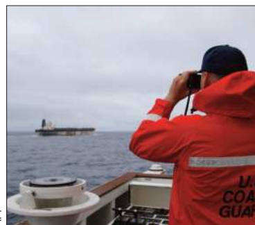
Un buque en el Atlántico.

Washington dice que petrolero capturado en el Atlántico es 'apátrida'