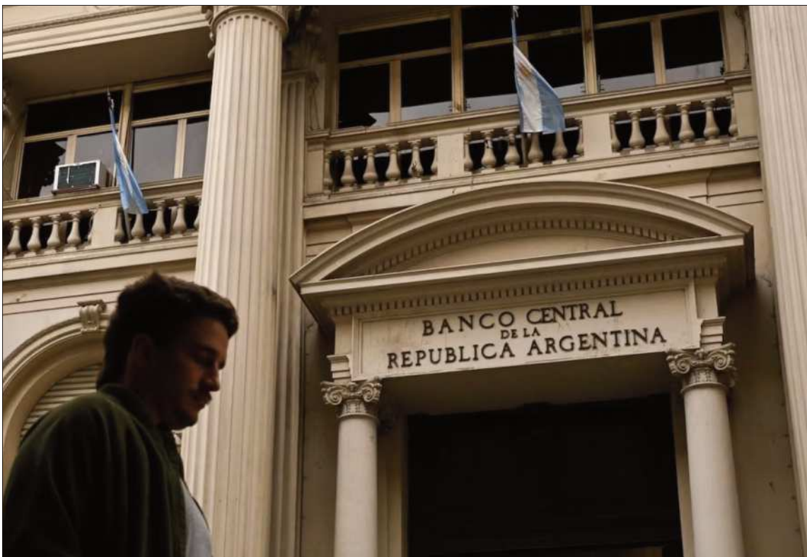
ENTIDAD Frontis del edificio principal del Banco Central de Argentina en la capital del país.

Según la declaración final de intenciones firmada por el primer ministro de Reino Unido, Keir Starmer, y el presidente francés, ambas potencias mundiales se comprometen a "desplegar a sus unidades" militares, junto a otros contingentes de los países que contribuyan a la eventual Fuerza Multinacional en territorio ucraniano "para apoyar las capacidades de Ucrania de disuadir a terceros países de llevar a cabo nuevos ataques contra su territorio".