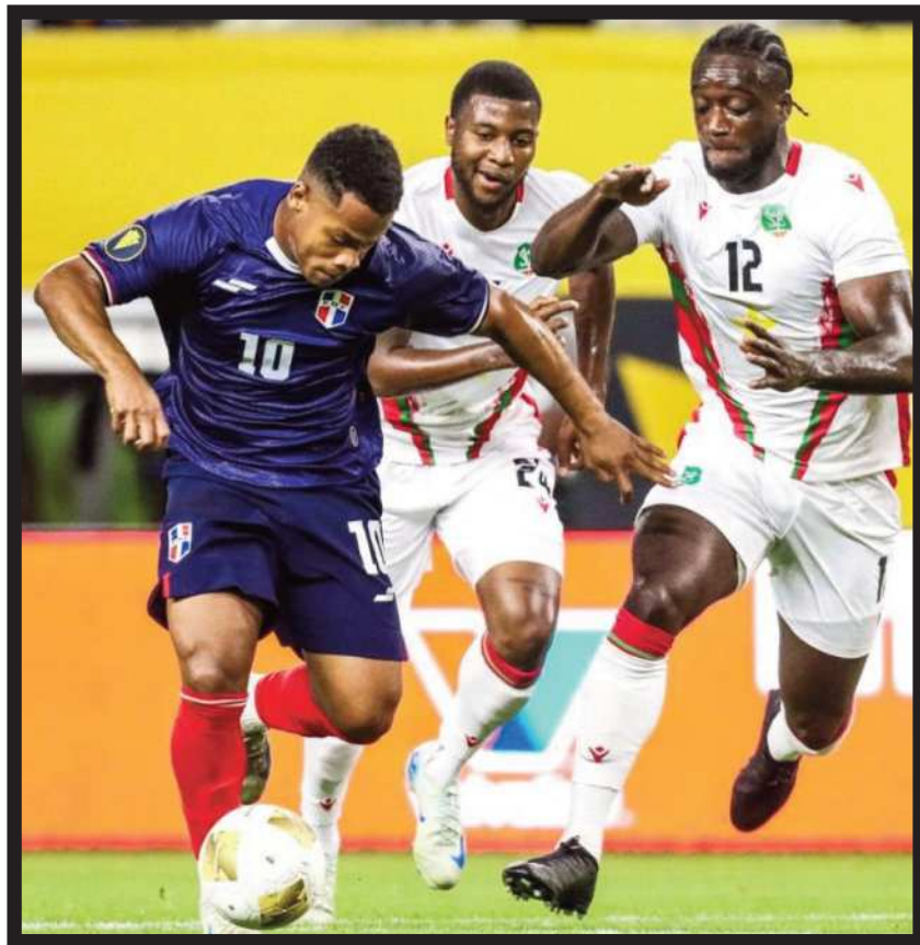
ANTECEDENTE. Acción de un partido entre Dominicana y Surinam el 2025.

El segundo se jugará el 25 frente a México en la reapertura del estadio