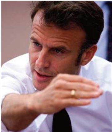
El presidente Emmanuel Macron.

Reino Unido y Francia de comprometieron a liderar el despliegue de soldados