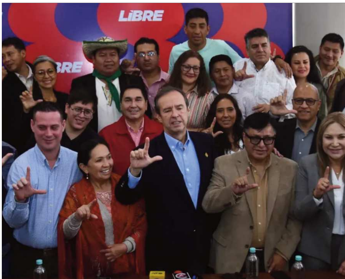
OPOSICIÓN. La bancada de la alianza Libre en una toma junto con el expresidente Jorge Quiroga.

Ante este escenario, la alianza política insta al Órgano Ejecutivo a adoptar soluciones urgentes. El objetivo declarado es "evitar mayores perjuicios a la estabilidad económica y social de Bolivia".