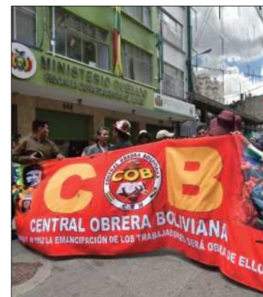
Marcha de la COB en La Paz.