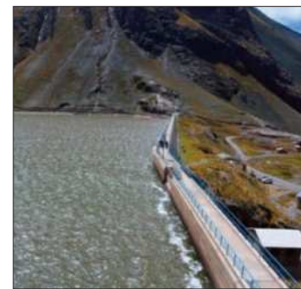
Una represa en La Paz.

Asimismo, ambas autoridades se reunieron para coordinar trabajos de prevención ante la época de lluvias.