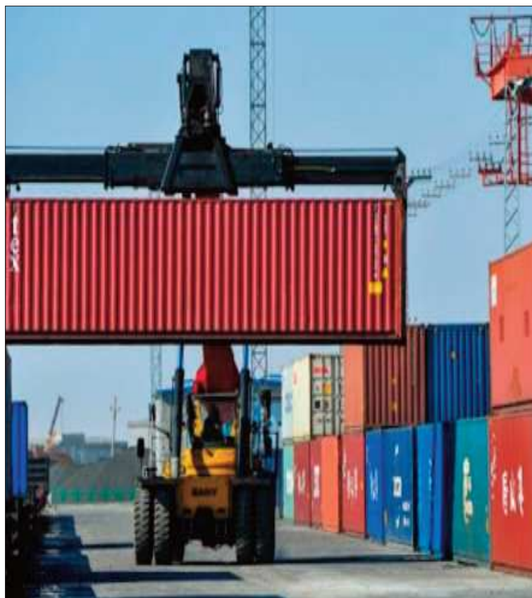
COMERCIO. La norma introduce facilidades para el comercio externo.