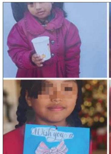
Dos de las cuatro fallecidas.