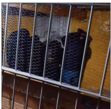
Los policías en celdas policiales.

En una requisa, la Policía halló dinero y secuestró seis teléfonos celulares