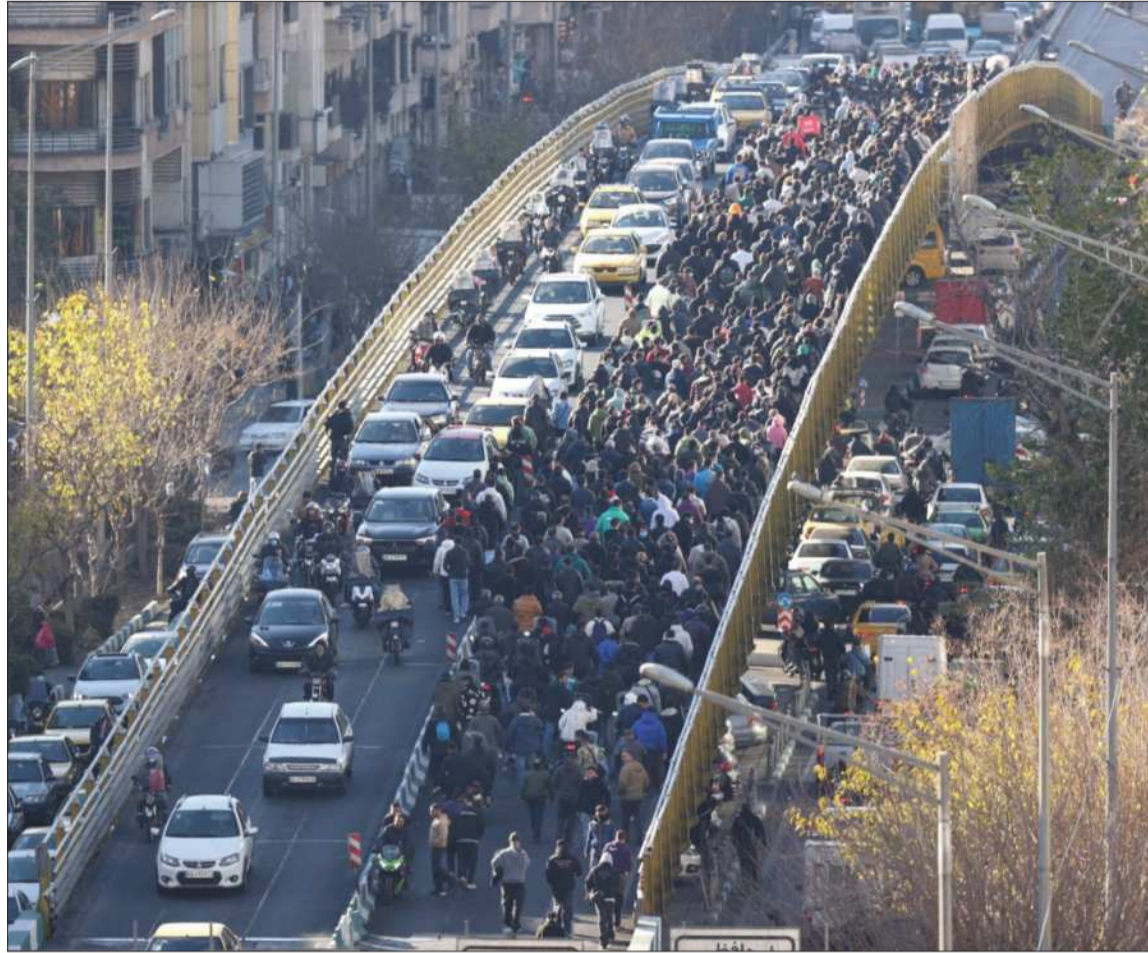
MOVILIZACIONES. Una protesta contra las condiciones económicas y la moneda iraní en Teherán.

Política. Al menos seis personas ya murieron en las protestas del oeste