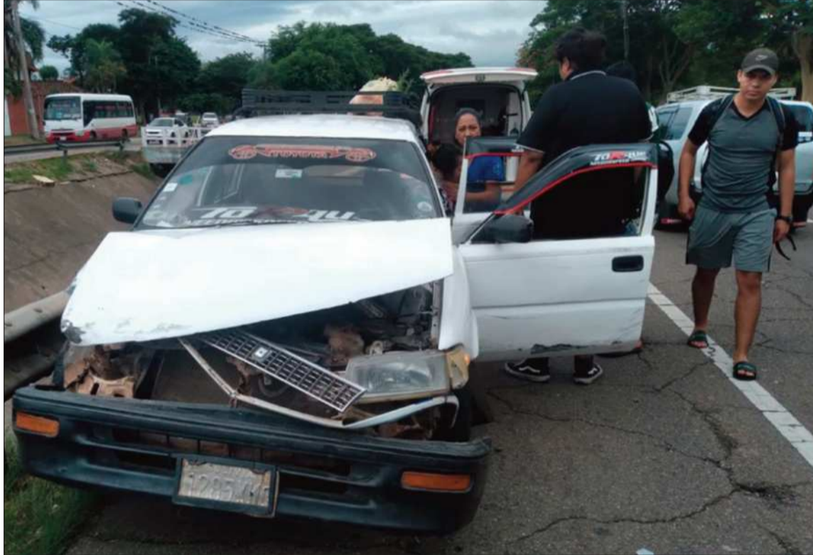
SINIESTRO. Imagen referencial de un accidente de tránsito ocurrido en la ciudad de Santa Cruz.

En Santa Cruz, como resultado de los incidentes, las autoridades procedieron a la aprehensión de 19 personas, quienes ya fueron remitidas al Ministerio Público para que se determine su situación jurídica. Asimismo, se