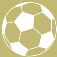
Figura. El mediocampista purgó ocho meses de suspensión por dar positivo en control dopaje. Los cumplió y se entrena desde diciembre y se alista para su regreso.