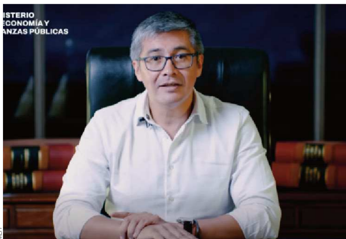
DECRETO. El ministro Gabriel Espinoza aclaró una serie de dudas respecto al Decreto Supremo 5503.