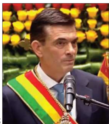
El presidente Rodrigo Paz.

La norma autoriza al presidente a ejercer sus funciones fuera del país