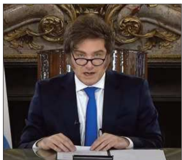
El presidente Javier Milei.

La ley reduce los plazos de prescripción para los delitos financieros