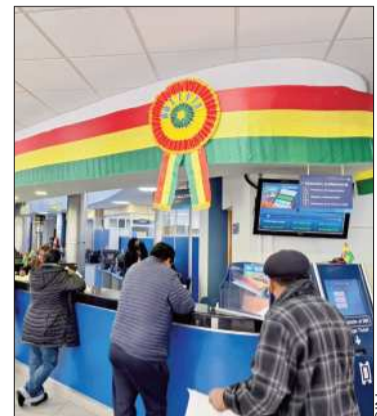
Contribuyentes realizan pagos.