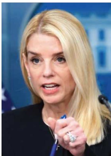
La fiscal general Pam Bondi.

Pam Bondi, fiscal general estadounidense, lo anunció en las redes