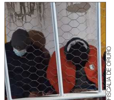
Los uniformados tras las rejas.

En la revisión, los investigadores hallaron folders que contenían documentación de vehículos, boletas de depósitos bancarios y billetes en cortes de Bs 10, 20, 50 y 100.