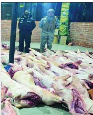
Los cerdos incautados.

Se estima que la carne y los animales vivos están valuados en Bs 440.000