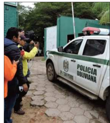
Vehículo de la Policía de Saavedra.

De acuerdo con el relato de los vecinos, en el barrio cruceño se vivieron momentos de pánico y terror al escuchar los gritos y quejidos de las víctimas.