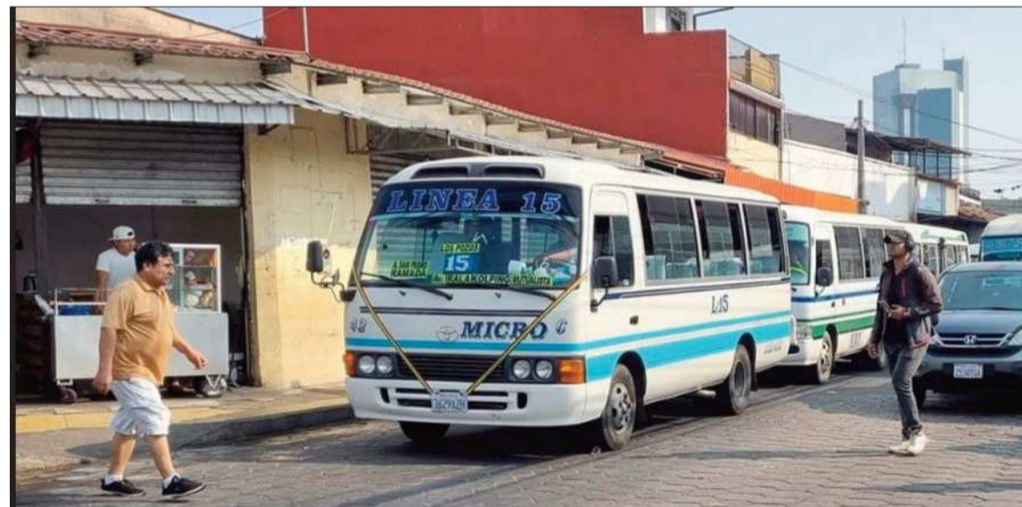
SERVICIO. El transporte público en la ciudad de Santa Cruz demanda una tarifa de Bs 4 por el servicio.

“Siempre hemos estado predispuestos a escuchar al Concejo para que exista un pasaje solidario. Pero nosotros hemos presentado un estudio de costos de Bs 4,