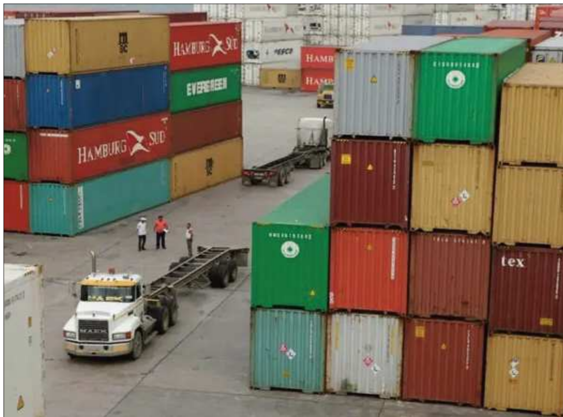
ARANCEL. El documento es una guía para los sectores dedicados a la importación de productos.

El Arancel Aduanero de Importaciones 2026 incorpora de manera expresa las disposiciones del Decreto Supremo 5503 en materia aduanera. En ese marco,