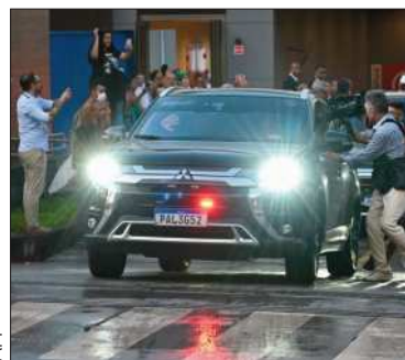
Salida de Jair Bolsonaro.

El juez dijo que la salud de Jair Bolsonaro no sufrió un empeoramiento