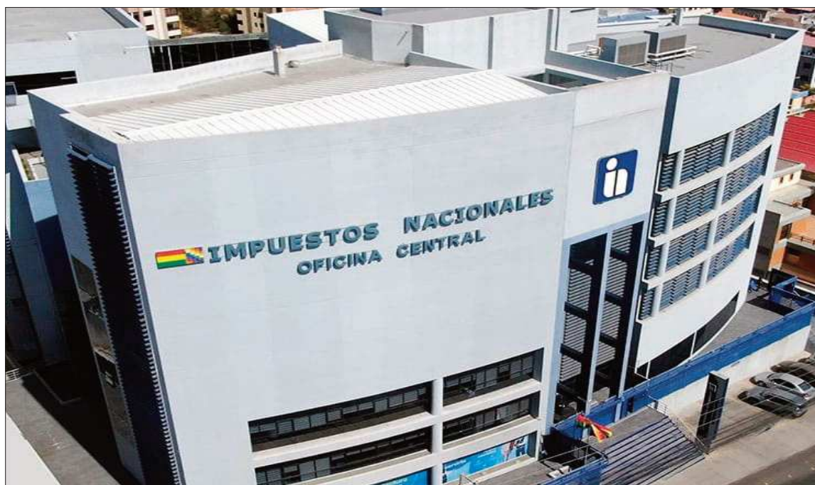
IMPUESTOS. Las oficinas del SIN, encargado del cobro de impuestos y de aspectos tributarios.