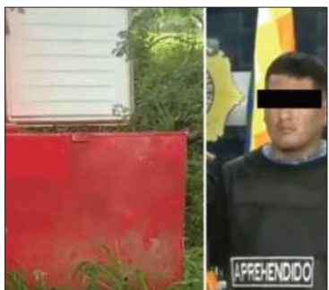
Aprehendido el autor del crimen.

La víctima fue asesinada por una disputa vinculada al microtráfico de drogas