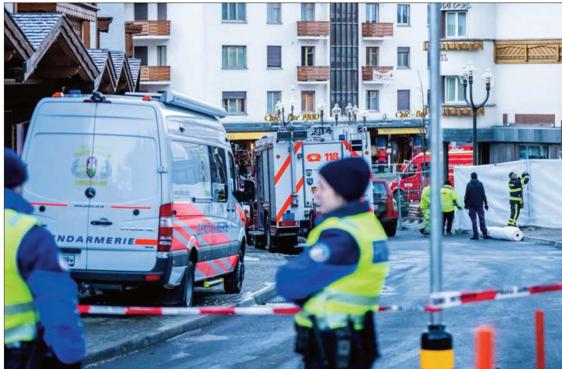
INCENDIO. Agentes de policía vigilan el lugar del incendio que arrasó el bar Le Constellation.