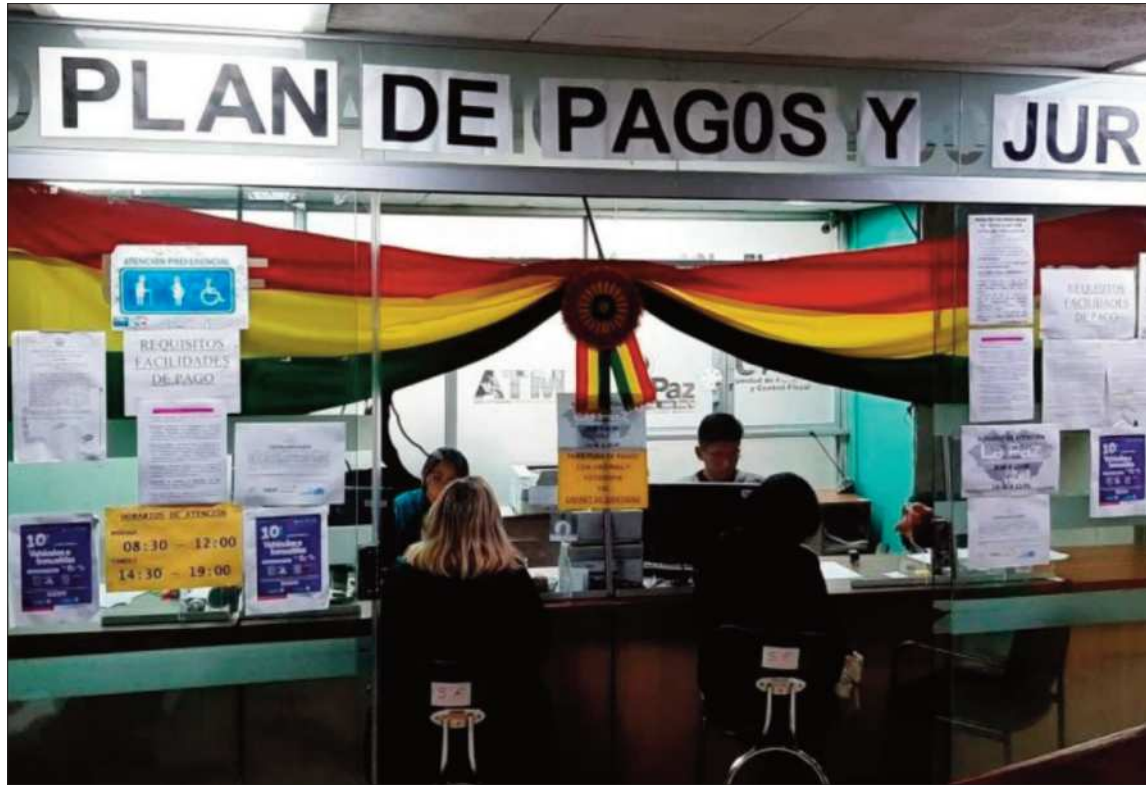
PAGO. Contribuyentes realizan el pago de sus impuestos en las oficinas de la ATM, en La Paz.

La funcionaria recordó que la ATM cuenta con diversos canales