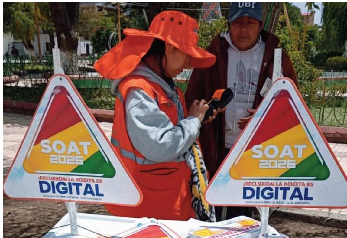
VENTA. Uno de los puntos para adquirir el Seguro Obligatorio de Accidentes de Tránsito (SOAT).