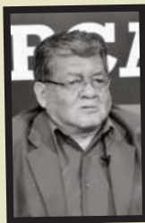
Por: Ernesto Murillo

► Aprendí con este episodio futbolero que nada es eterno en la vida, aunque el cariño por una divisa dura hasta que la parca marque el destino