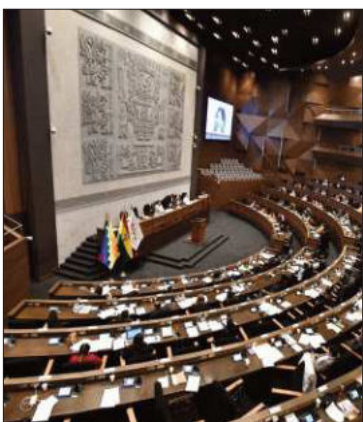
Los diputados sesionaron ayer.

El préstamo del BID es para la construcción del Parque Lineal.