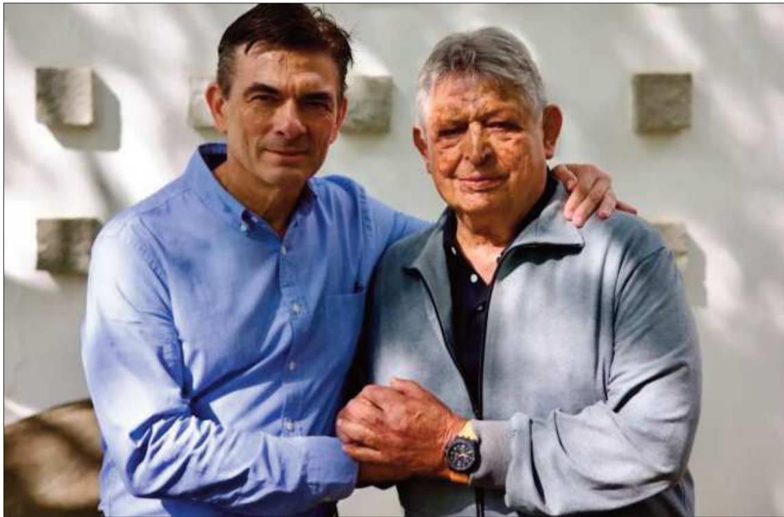
UNIDAD. El presidente Rodrigo Paz aparece junto a su padre, el exmandatario Jaime Paz Zamora.

La inscripción de Patria en La Paz se da en paralelo a la confor-