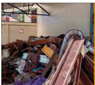
Residuos en el cementerio paceño.

El legislador evidenció el mal manejo de residuos en la sala de reducciones