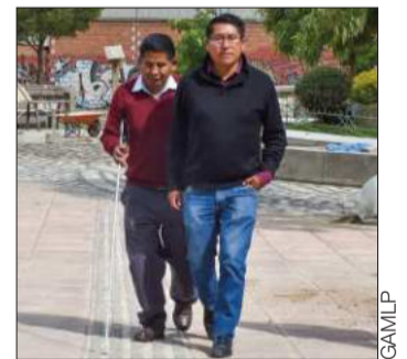
Se colocaron lozas pododáctiles.

La autoridad municipal aseguró que lo que se busca es que este espacio sea más inclusivo; por eso, todas las esquinas contarán con rampas para que las personas que usen sillas de ruedas tengan un acceso de acuerdo a estándares internacionales.