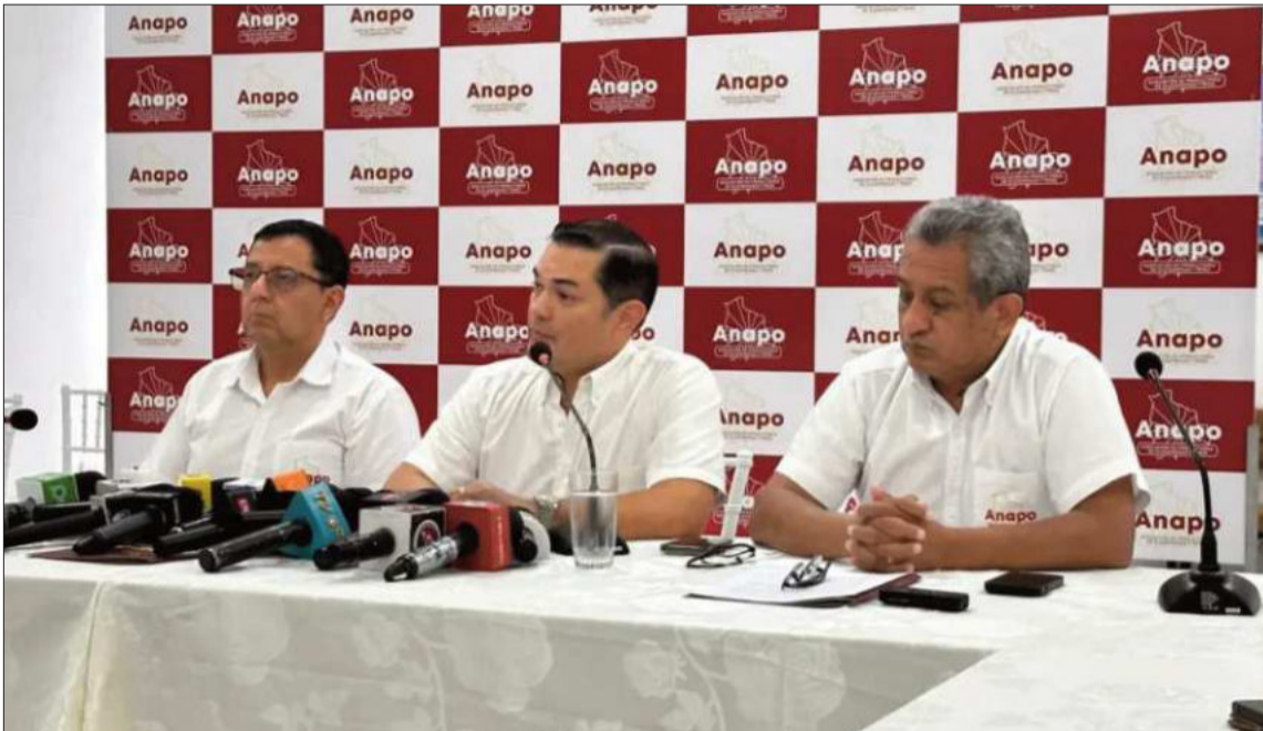
INFORME. Los directivos de Anapo durante la conferencia de prensa.