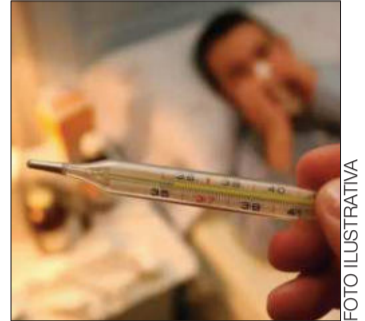
Alerta por gripe AH3N2.

Galván resaltó que los objetos entregados se encuentran bendecidos por el papa León XIV.