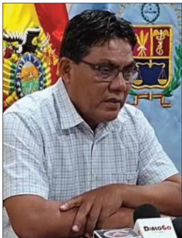
El exdiputado Héctor Arce.

El viernes, el exdiputado fue proclamado por el expresidente Evo Morales