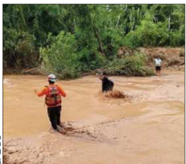
Buscan a personas desaparecidas.

Los desastres causaron el deceso de 20 personas y hay 22 desaparecidos