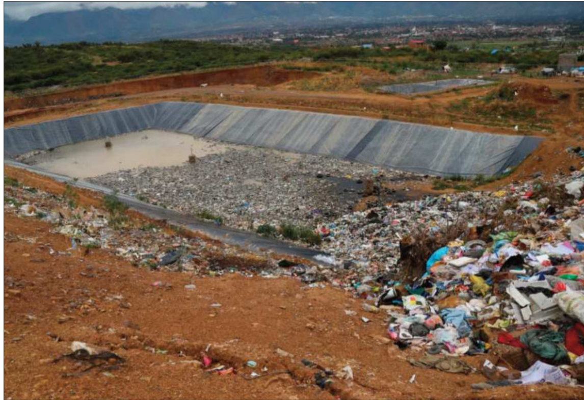
RESIDUOS. Una de las celdas en el botadero de Cotapachi evidencia la actual situación del botadero.

El funcionario agregó que durante la inspección en la que participaron autoridades y técnicos de la Gobernación, la Brigada Parlamentaria, los municipios mencionados y de otras instituciones, se verificó también la presencia de un tercer botadero no autorizado, que corresponde a la empresa Complejo Industrial Cochabamba Tunqui Ltda. donde se depositaban desechos del municipio de Cercado.