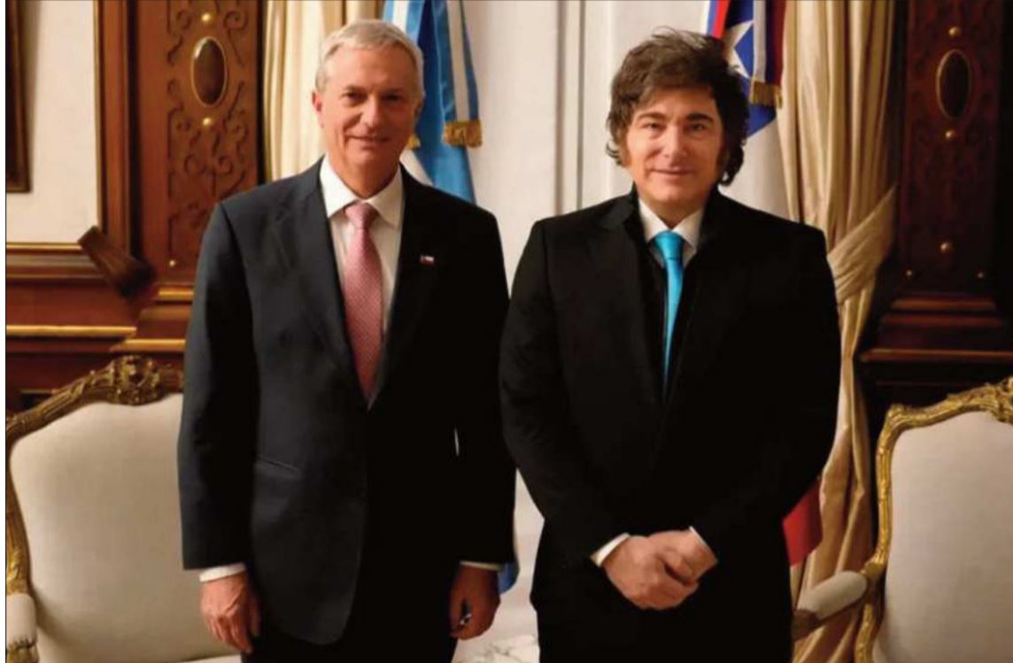
ENCUENTRO. Javier Milei recibió al presidente electo de Chile, José Antonio Kast, en la Casa Rosada.

“Yo apoyo cualquier situación que termine con una dictadura, una narco-dictadura. Nosotros claramente no podemos intervenir en eso porque somos un país pequeño, pero somos víctimas del terror que implica tener una dictadura”, dijo en alusión a las operaciones de Estados Unidos contra narcolanchas en el Caribe y a la posible intervención de Washington en territorio venezolano.