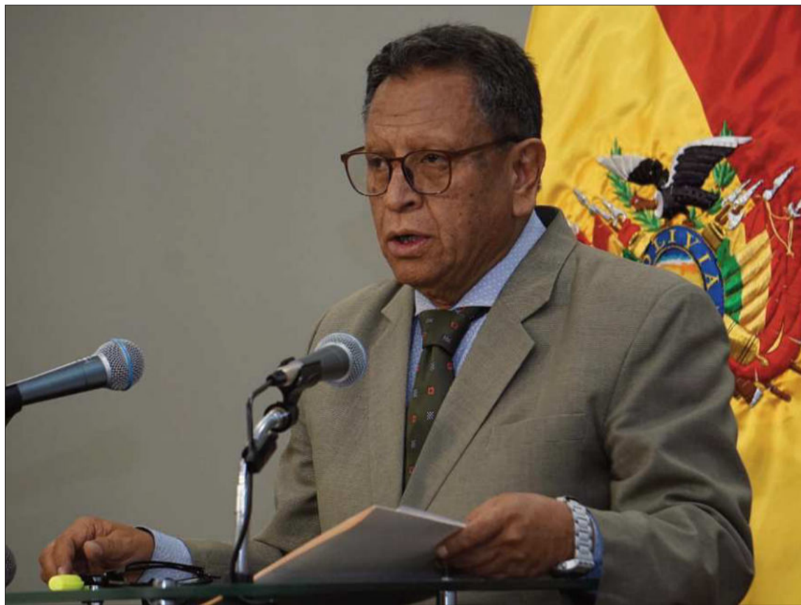
DECLARACIONES. El ministro de Gobierno, Antonio Oviedo, mantiene comunicación con Estados Unidos.

Oviedo cuestionó la política exterior del anterior Gobierno en materia de seguridad, al considerar que existió una desconexión con organismos internacionales.