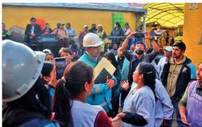
CONTROLES. Los guardias municipales estarán en las calles.