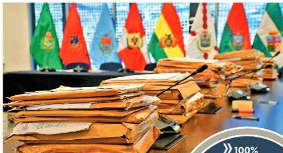
DTAO. Hay en puerta 140 denuncias en fase de admisión.

El senador Freddy Castillo, del PDC, recordó que aunque la citada ley no establece un "mecanismo de habilitación", especifica un puntaje de habilitación para participar de la fase final. El lunes, concluyó la fase de