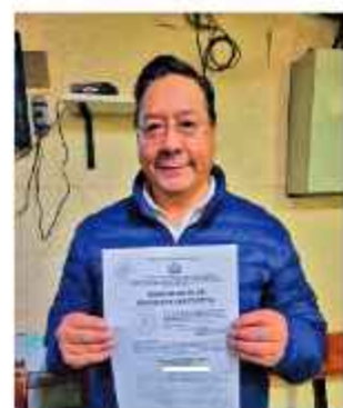
EXPRESIDENTE. Luis Arce.

Las redes sociales del expresidente, Luis Arce serán administradas por terceros, mientras dure la etapa de detención preventiva, de cinco meses, en la cárcel de San Pedro, de La Paz.