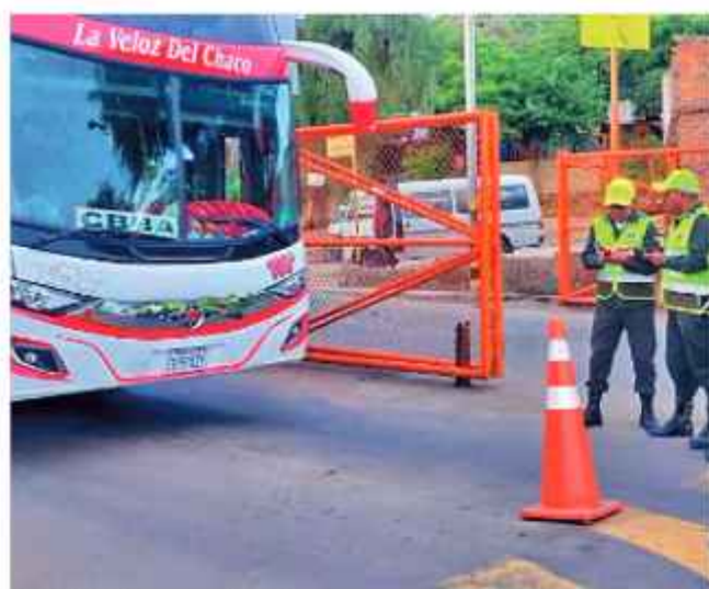
CONTROL. Personal realiza inspección en buses