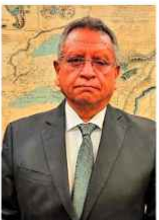
AUTORIDAD. El ministro de gobierno, Oviedo.

El ministro de Gobierno, Marco Antonio Oviedo, confirmó ayer que desde enero de 2026 el país retomará una agenda de trabajo intenso con Estados Unidos. Esta colaboración se enfocará en el combate al narcotráfico, el terrorismo y el control de flujos migratorios, bajo una visión de una intensa cooperación internacional.