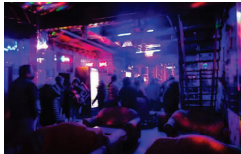
Traslado de los lenocinios genera tensión ciudadana