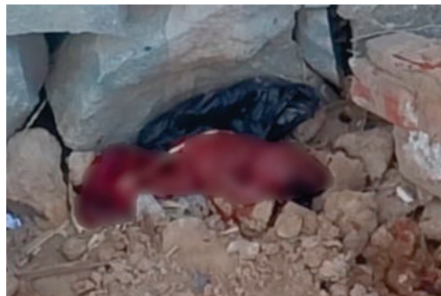
Buscan a sospechosos tras la muerte violenta de una recién nacida /POLICÍA

La recién nacida fue encontrada sin signos vitales, posiblemente con su cor-