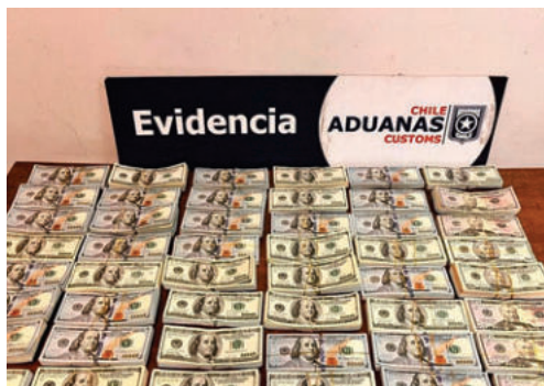
Hallaron 482.900 dólares ocultos en un bus proveniente de Bolivia

Funcionarios de la Aduana Regional de Arica se percataron de que tras