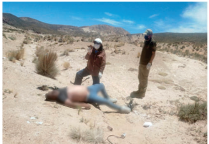
El adulto fue encontrado sin vida en Iroco; investigan las circunstancias

men externo del cadáver no se encontró ningún signo de violencia. Posteriormente, se realizó la autopsia que reveló que el fallecimiento fue por asfixia.