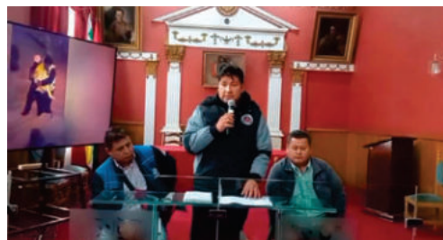
Zoonosis aclara situación de can herido en un mercado

Posteriormente, cerca del mediodía, Pofoma presentó a un can de color café, el cual fue evaluado por veterinarios de Zoonosis, constatándose una lesión en