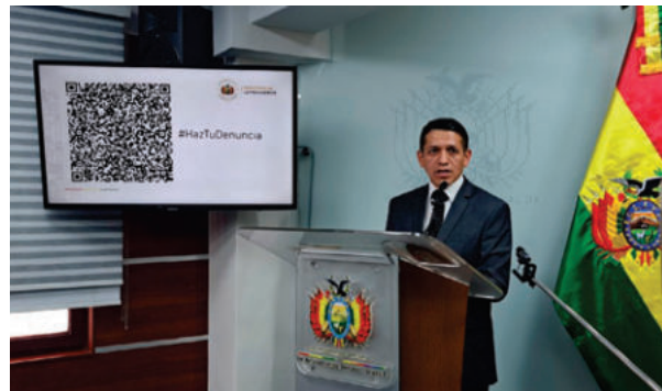
Marcelo García, viceministro de Transparencia, Seguridad Jurídica y Derechos Humanos

"El QR no se limita solamente a hidrocarburos o al Fondo Indígena. La corrupción es una tarea que tenemos nosotros como gobierno; todas las de-