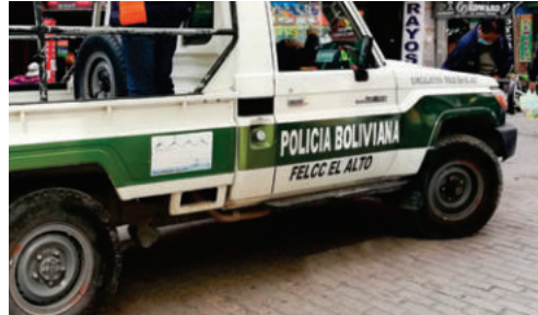
Un miembro de la Felcn ha sido detenido tras la pérdida de dinero incautado en un operativo antidrogas