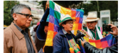
Miembros de la Csutcb pidieron respeto a la Wiphala en la plaza 10 de Febrero

La convocatoria es liderada por la Csutcb junto al Pacto de Unidad y sectores afines al denominado “evismo”, que anunciaron