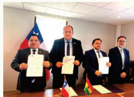
Las Fiscalías de Bolivia y Chile crean equipo conjunto contra delitos transnacionales /FEE