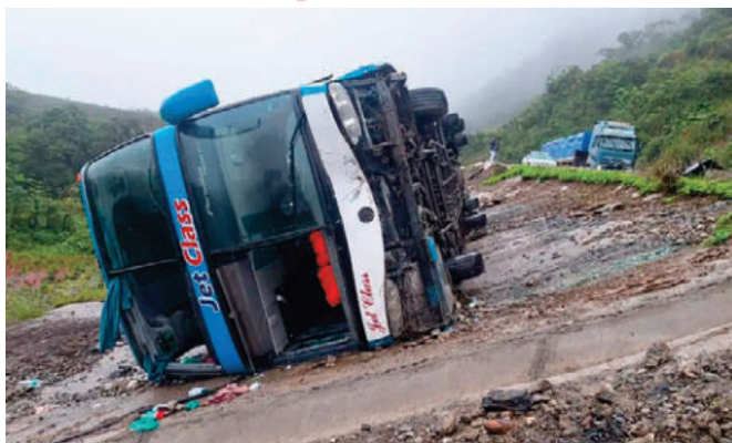
El bus quedó volcado a un lado de la carretera

cunstancias en las que se registró el accidente de tránsito; sin embargo, algunos reportes señalan que fueron los factores climatológicos los que provocaron que el conductor tuviera poca visibilidad de la vía, lo que aparentemente provocó que chocara con otro vehículo, perdiera el control y terminara volcando.