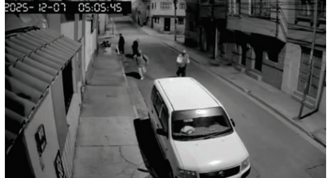
Un joven, implicado en homicidios y dos atracos, fue aprehendido por las autoridades /CAPTURA DE VIDEO Juvenil.

El adolescente será imputado de manera provisional por el delito de homicidio y se espera que un juez de la Niñez y Adolescencia defina su situación jurídica. Desde el Ministerio Público pedirán su detención preventiva en un centro de menores, según establece la Justicia Penal