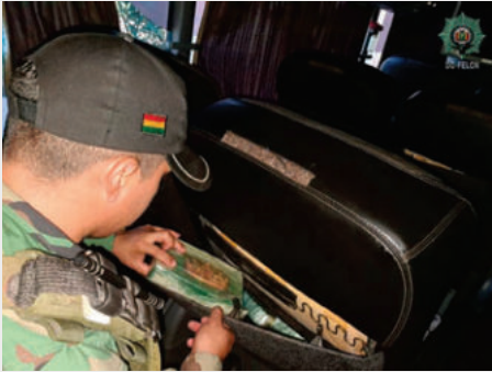
La Felcn secuestra 25 paquetes de droga en un bus con destino a Paraguay