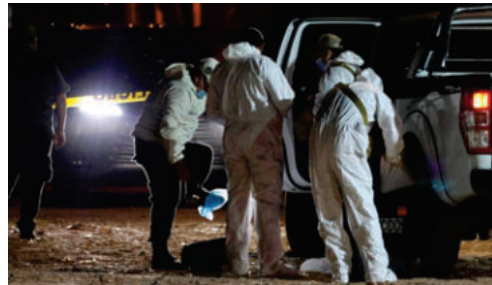
La Policía de Santa Cruz aprehendió a un hombre vinculado al asesinato de una familia y su empleado en la estancia San Jorge

en el patio de la estancia San Jorge, una propiedad privada ubicada a 190 kilómetros de la capital cruceña. Un vecino alertó a las autoridades al encontrar la macabra escena, iniciando una investigación que reveló la brutalidad del ataque.