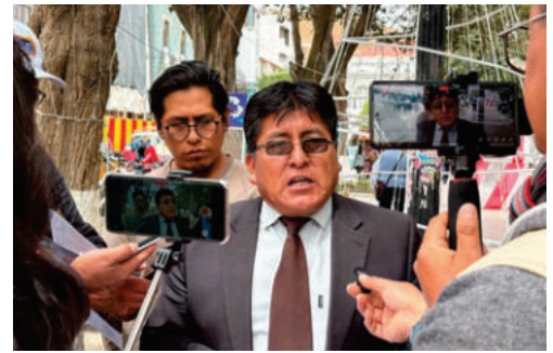
Vecinos de la zona del Casco apoyan proyecto de ley para trasladar las casas de tolerancia a otro sector