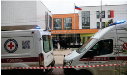
Muere un niño de diez años en ataque de un adolescente

Según el canal de Telegram Baza, el adolescente,