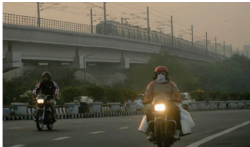
Un grave accidente ocurrió en la autopista Delhi-Agra, dejando 13 muertos y más de 70 heridos

“Un accidente muy desafortunado ocurrió esta mañana alrededor de las 4:30 horas (hora local). Aproximadamente 70 personas resultaron heridas y fueron trasladadas a varios hospitales (...) Aquí en la morgue, hemos recibido información sobre la muerte prematura de 13 perso-