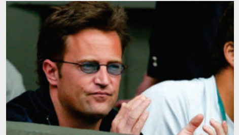
El caso involucra a otros cuatro acusados relacionados con la muerte del actor Matthew Perry