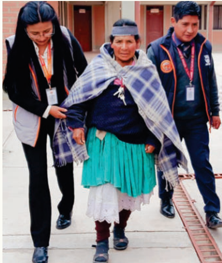
La mujer fue acogida en el Centro Integral de Descanso del Adulto Mayor "Wasiy" /DIO LA PATRIA

Una mujer de aproximadamente 60 años fue encontrada la madrugada del martes 16 de diciembre de 2025 en inmediaciones del mercado Simón Bolívar en Oruro. La Dirección de Igualdad de Oportunidades (DIO) del Gobierno Autónomo Municipal de Oruro (GAMO) la acogió en el Centro Integral de Descanso del Adulto Mayor "Wasiy" debido a su frágil estado de salud, mientras se busca a sus familiares para autorizar una intervención quirúrgica necesaria.