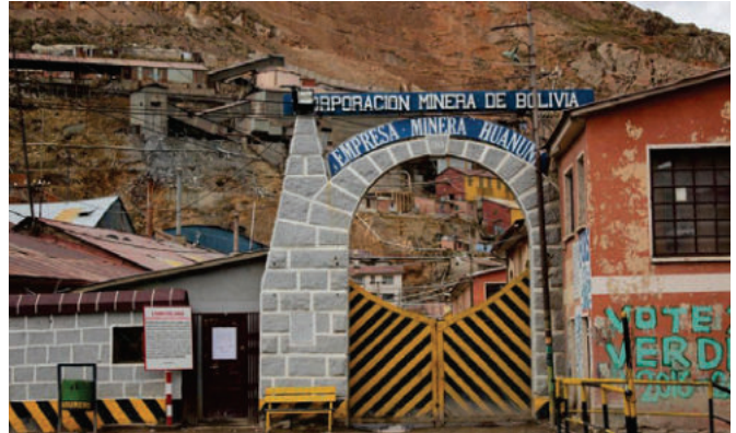
La Policía aprehendió a 4 "jucus" adolescentes por tratar de robar mineral de la estatal /REFERENCIAL

Según se conoció, dos adolescentes tienen 16 años, otro 14 y el restante 17, quienes serán imputados en la vía ordinaria por el hurto de mineral a la estatal.