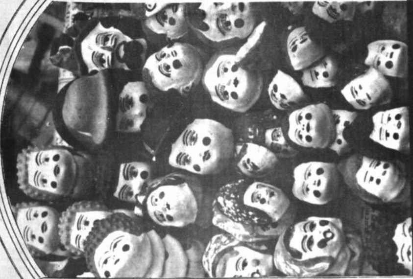
PROXIMA EXPOSICION. Detalle de una de las fotografías del artista plástico Mamani Mamani que presentará sus trabajos en la Galería Estudio a partir del jueves próximo bajo el título de "La obra de La Paz". Es un homenaje a los 150 años de la fotografía a nivel mundial.