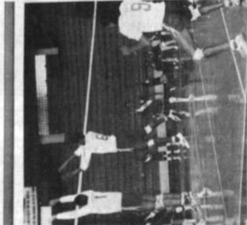
Nueva victoria. El seleccionado masculino de Perú derrotó por 3 sets a 1 al conjunto de Paraguay en el primer partido de la final por el título de la Copa Libertadores de América de Voleibol de Menores, en la ciudad de La Paz.

Las fallas tácticas del equipo paraguayo, determinaron su caída. Jugó con mucho puntador para equilibrar las acciones, tratando de volar las preferencias a su favor, pero no tuvo éxito. El equipo peruano, que en su desarrollo se pudo advertir los grandes deseos de buscar el triunfo, habiendo finalizado a favor de Perú por 16-14, tras una intensa lucha. El equipo masculino de Perú, logró su segunda victoria en el campeonato y se mantiene a la expectativa para alcanzar el tercer puesto, aspiración que también corresponde a Venezuela.