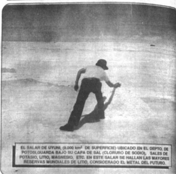
EL SALAR DE UYUNI, (9.000 km 2 DE SUPERFICIE) UBICADO EN EL DEPTO. DE POTOSI, GUARDA BAJO SU CAPA DE SAL (CLORURO DE SODIO), SALES DE POTASIO, LITIO, MAGNESIO, ETC. EN ESTE SALAR SE HALLAN LAS MAYORES RESERVAS MUNDIALES DE LITIO, CONSIDERADO EL METAL DEL FUTURO.