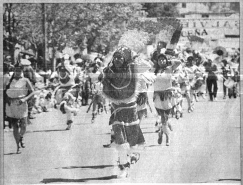
Folclore y colorido

Asimismo, como parte de las medidas de ajuste, se deberá incentivar, vía tasas de interés, el ahorro en moneda nacional, con el objeto de remonetizar la economía.