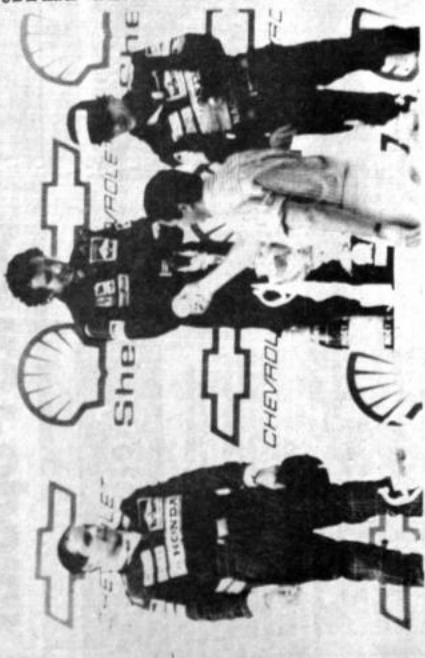
El presidente brasileño helicita a Prost. El actual presidente del Brasil, Fernando Collor de Mello felicita al ganador de la prueba, Alain Prost. La competencia de Interlagos, puso al francés en la superioridad del francés en el autódromo de Interlagos. Senna, Judd y el tercero.

Prost ganó deteniendo durante los minutos en boxes mientras los mecánicos de McLaren reemplazaban la trompa y el alerón trasero.