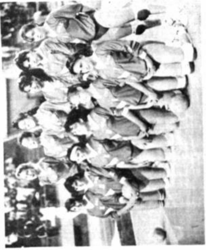
Selección femenina de Chile, un importante antecesor en el VII Campeonato Sudamericano de Voleibol de Menores.

El equipo venezolano, también demostró algunos progresos en comparación con el debut frente a Brasil. El resultado de ese partido afectó psicológicamente a sus jugadores.