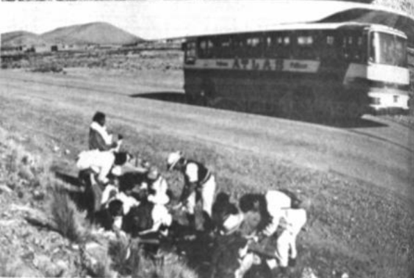
Marchistas de Cotagaita

El grupo de 24 jóvenes estudiantes, universitarios y ciudadanos de la localidad de Cotagaita, Provincia Nor Chichas posiblemente llegará a la sede del gobierno el lunes. Los marchistas son portadores de un pliego de peticiones que será entregado al presidente Zamora. Según se informó, los pobladores de Cotagaita y localidades aledañas, durante años han atraído la atención de autoridades departamentales y nacionales. En la composición gráfica, dos escenas cuando los marchistas curaban sus heridas y repa- raron el último tramo Oruro-La Paz.