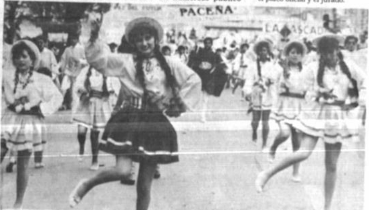
Alegría. Miles de estudiantes participaron ayer de la tercera versión de la entrada folclórica universitaria que auspicia la UMSA.

que se instaló en las calles. Esta tercera versión de la entrada universitaria contó con la presencia de una mayor cantidad de conjuntos que llegaron también de las universidades de Oruro y Cochabamba. La Universidad Católica de La Paz estuvo representada por alumnos de la ciudad y de los centros de enseñanza universitaria del altiplano. El colorido de los trajes, las sonrisas de las bellas muchachas, la alegría de los jóvenes y la participación del público hicieron vivir ayer a la población de La Paz una jornada distinta. Una crítica: el espacio de tiempo entre conjunto y conjunto fue demasiado, especialmente en horas de la mañana y las primeras de la tarde, lo que ocasionó una demora en la conclusión de la fiesta. También se estableció poco control policial en el sector donde se ubicaron el palco oficial y el jurado.