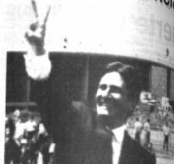
Collor de Mello

Lejos del corazón industrial de Brasil, la serbia amazónica, el Plan Collor también está repercutiendo en la vida de la gente.