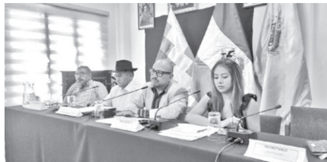
La presentación del Fondo el Agua. LT

Coordinación. El presidente de la institución destacó la información y el plan presentado por el Gobernador