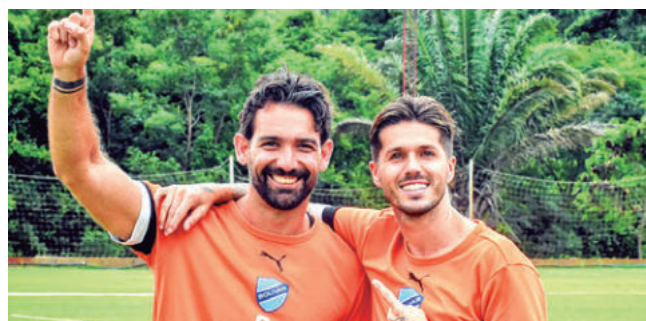
Jugadores del plantel de Bolívar. CLUB BOLÍVAR

Culminación. El torneo se acerca a usu final con equipos que buscarán ganar; pero, también una diferencia de goles