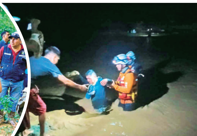
Rescatistas se desplazan en las zonas afectadas. GADSC