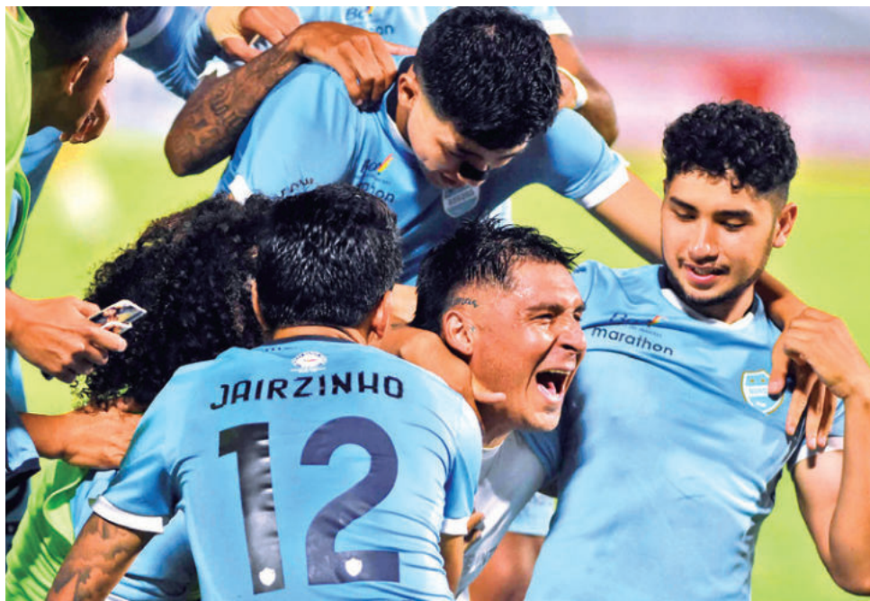
Aurora festeja su último triunfo en un partido en el torneo profesional. JOSE ROCHA

El partido en su primer tiempo tuvo a un Aurora que buscó desde el primer minuto el gol, apuntalado por la experiencia y habilidad de Jair To-