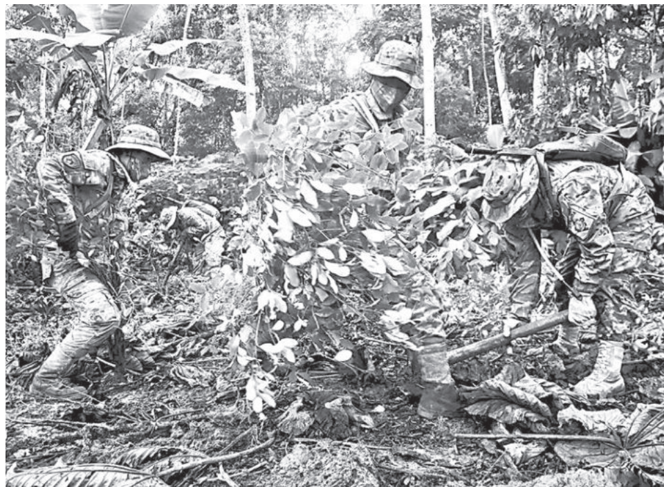
Tareas de erradicación en el trópico de Cochabamba. JOSE ROCHA

La Unodc recomendó al Gobierno de Rodrigo Paz continuar fortaleciendo las estrategias de control de cultivos de hoja de coca, sobre todo en las áreas protegidas, y considerar la realización de estudios para actualizar la información sobre la de-