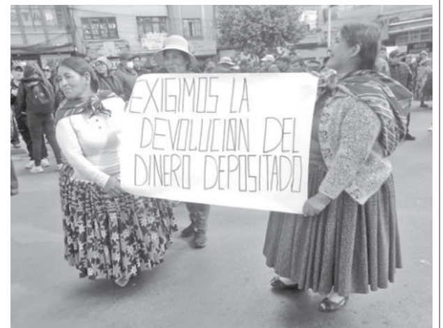
Panificadores protestan por sus saldos.. ERBOL

Los panificadores protestaron ayer exigiendo la devolución de los saldos que depositaron en el Banco Unión para recibir harina subvencionada. Sin embargo, ahora ya no cuentan con este beneficio y pide devolución.