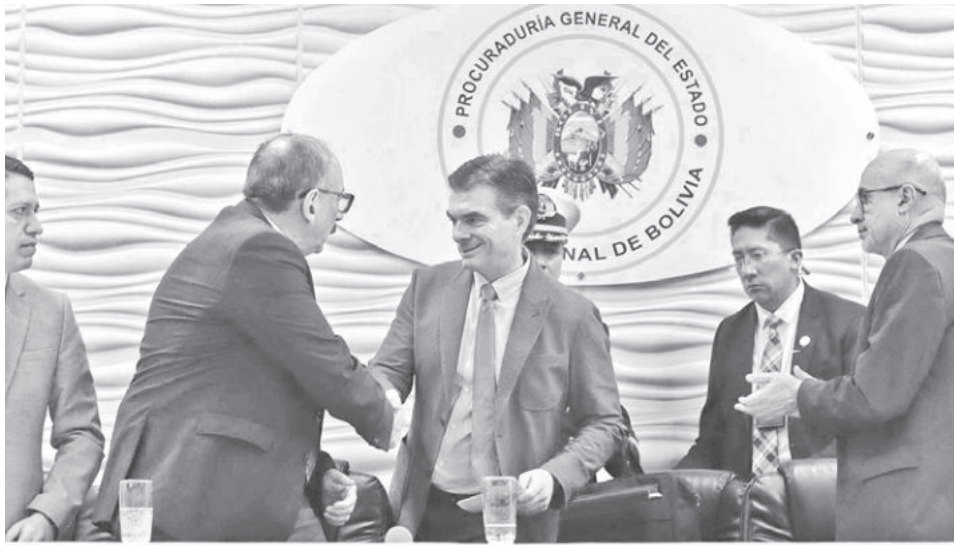
La presentación de la denominada Comisión de la Verdad en Hidrocarburos.

“Esta es la primera de las comisiones para encontrar la verdad. Y si la platita (que se han robado) las han depo-