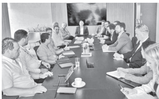
Representantes de EEUU en Santa Cruz. EMBAJADA EEUU

a agencias de financiación y desarrollo del gobierno de los Estados Unidos, como la Corporación Financiera de Desarrollo Internacional (DFC), el Banco de Exportación e Importación (Exim), la Agencia de Comercio y Desarrollo (Ustda), el Departamento de Comercio, y el Departamento de Estado.