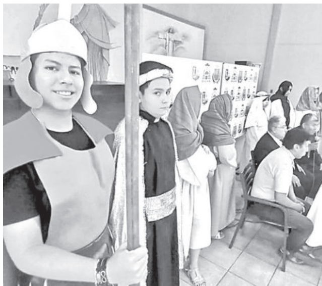
La obra religiosa que resalta el espíritu navideño.

será destinado al Centro de Acogida San Martín de Porres (Cadepis), institución que brinda atención a personas con discapacidad que han sido abandonadas.