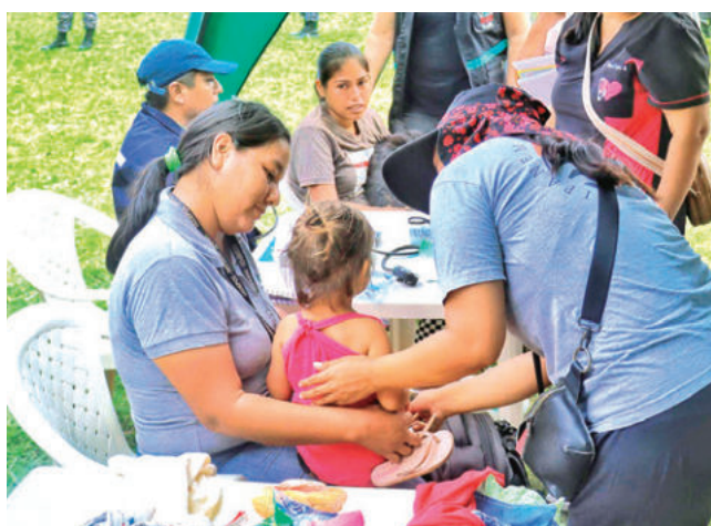
Atención en salud a damnificados. GADSC

Tragedia. El Senamhi mantiene advertencias hidrológicas por posibles nuevos desbordes, Santa Cruz mientras sigue la búsqueda de las personas desaparecidas