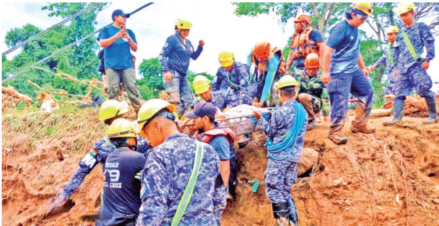
Militares y rescatistas trasladan en una camilla a una de las víctimas atrapadas en el lodo en El Torno, ayer. La escena se repite constantemente.

Daño. La pesadilla que viven los afectados de las inundaciones en Santa Cruz no tiene fin. Las familias lo perdieron todo, los rescates aéreos y en botes continúan. Pág. 6