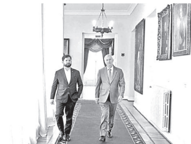
Gabriel Boric (izq.) y José Antonio Kast.

Abundó que Boric “ha dado la voluntad de poder colaborar con todo lo posible, una vez que ya se vayan conociendo quiénes podrían ser parte del equipo del próximo Go-