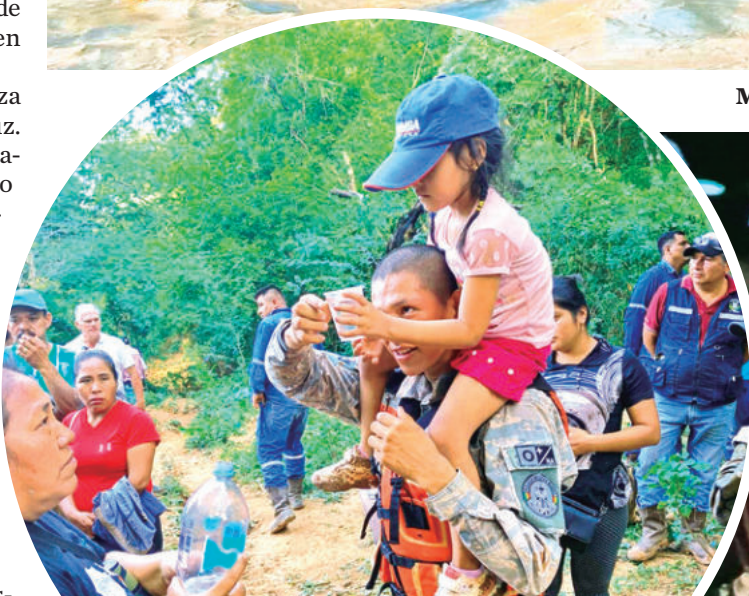
Soldados rescatan en hombros a niños de comunidades de El Torno. GADSC