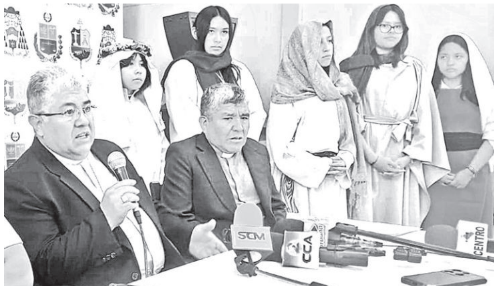
La obra el "Belén Viviente" que se presentará en el Seminario San José.