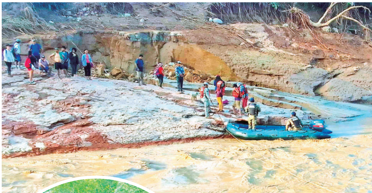
Militares rescata a damnificadas en botes.

Las familias de barrios ribereños en Porongo, Warnes y Sagrado Corazón también viven momentos de desesperación. Vecinos relatan cómo