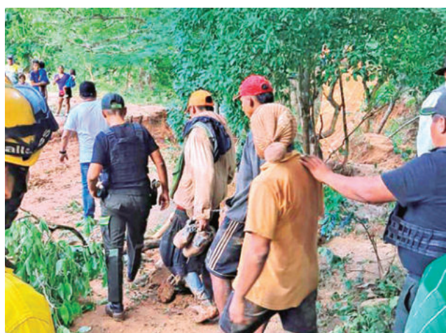
Traslado de jóvenes infractores. GADSC

el agua arrastró pertenencias, animales domésticos y recuerdos familiares, mientras muchos debieron refugiarse en casas de vecinos o centros comunitarios improvisados.