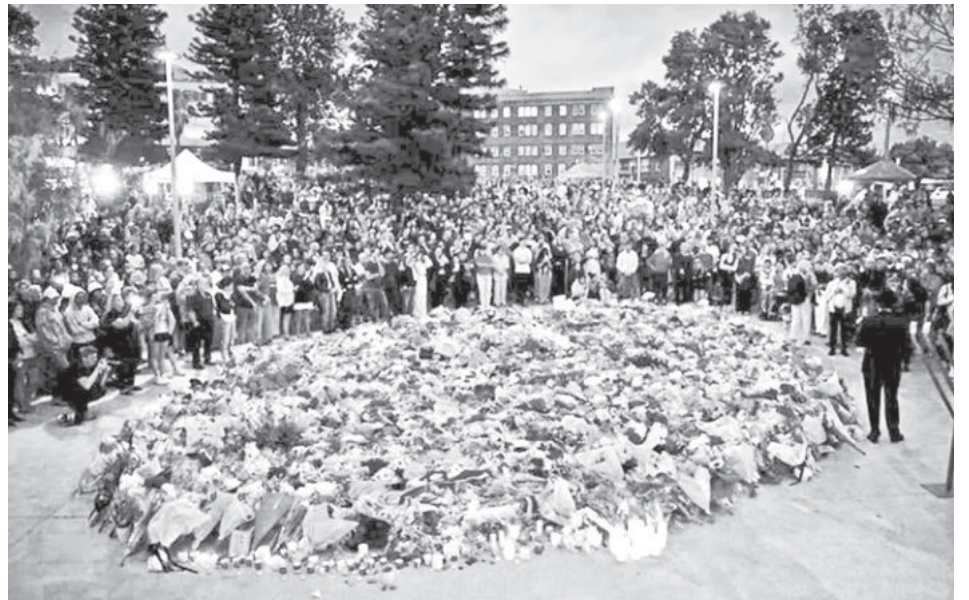
Los dolientes asisten a una vigilia en un monumento conmemorativo en Bondi Beach, Sídney.

El primer ministro australiano, Anthony Albanese, afirmó que los atacantes actuaban solos y no formaban parte de una célula extremista más amplia. “No hay pruebas de connivencia”, dijo, pero estaban “claramente motivados por la ideología extremista”.