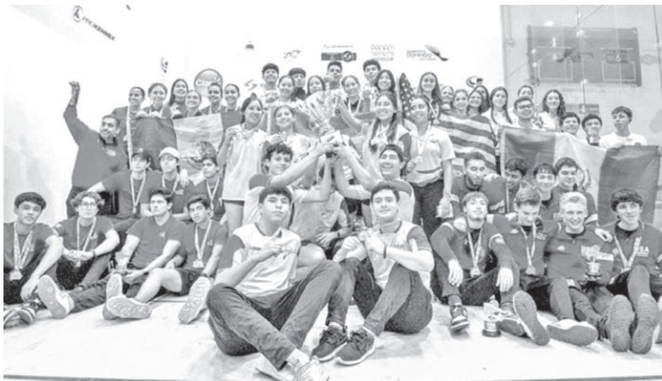
La delegación de ráquetbol en el torneo de Santo Domingo.

En el Campeonato Mundial, los bolivianos lograron 14 victorias, en las distintas categorías y modalidades, lo que les permitió subir a lo más alto del podio, la segunda ubicación fue para México y la tercera fue de Estados Unidos, según los registros del Comité