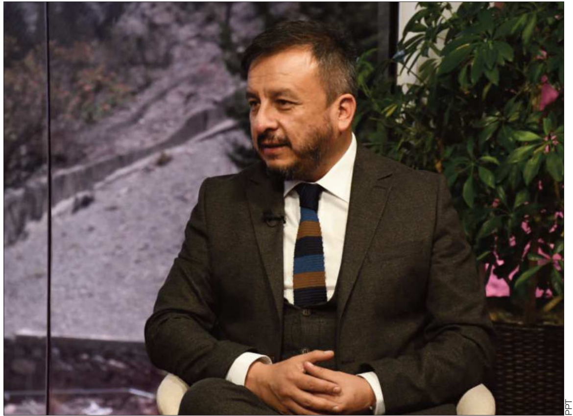
ENTREVISTA. El ministro de Hidrocarburos y Energías, Mauricio Medinaceli, en Piedra, Papel y Tinta.

Aseguró que el Ejecutivo alista una reconfiguración del esquema de subvención a los carburantes y un rediseño integral del sector energético que incluye nuevas leyes para hidrocarburos, electricidad, energías verdes y litio, con el