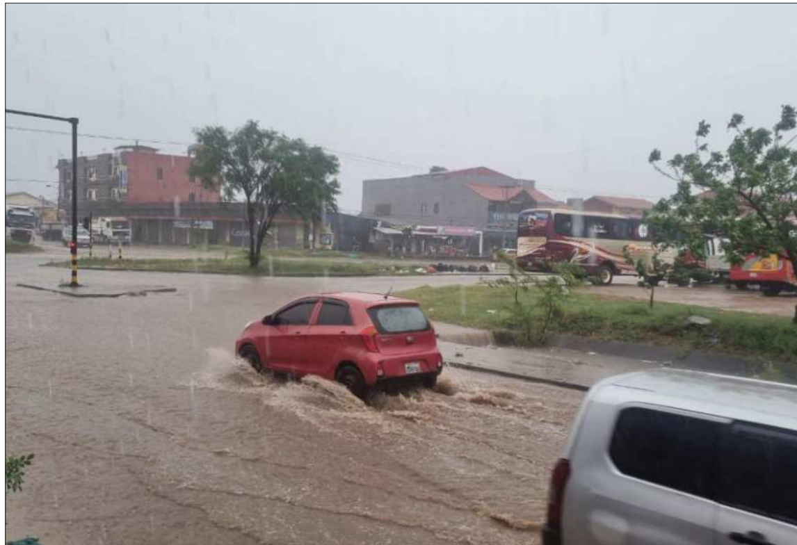
ALERTA. El Senamhi y el Searpi prevén que las lluvias persistirán en el departamento de Santa Cruz.

Asimismo, el funcionario informó que las afectaciones causadas por las intensas lluvias se registran en comunidades cruceñas de El Torno, Porongo, Warnes, Colpa Bélgica, Montero, San Pedro, Sagrado Corazón y Cuatro Ojos.