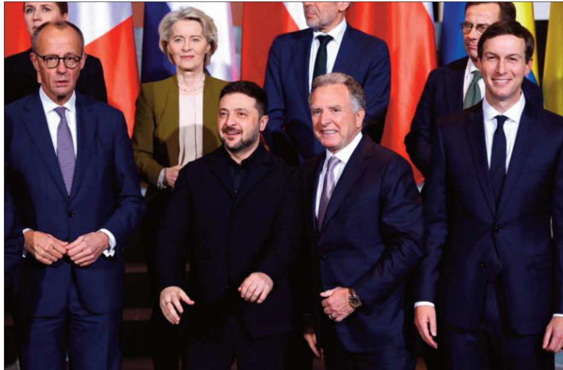
AVANCE. El mandatario Volodimir Zelenski dialoga con el delegado estadounidense, Steve Witkoff.

Trump incrementó la presión sobre Kiev desde que presentó en noviembre un plan de 28 puntos para poner fin a la guerra, iniciada en febrero de 2022 con la invasión rusa de Ucrania. El proyecto, sin