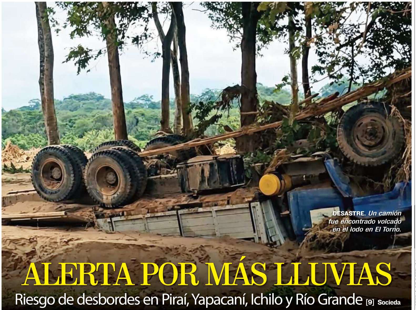
DESASTRE. Un camión fue encontrado volcado en el lodo en El Torno.