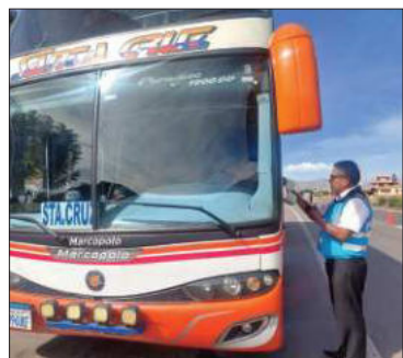
Personal de la ATT realiza control.

Las quejas se reportaron en terminales terrestres y aéreas de varias regiones