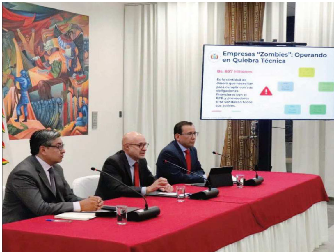
DENUNCIA. El Ministerio de la Presidencia denunció el complicado estado de las empresas públicas.

El ministro también identificó empresas “zombies”, como la Empresa Boliviana de Industrialización de Hidrocarburos (EBIH), Yacimientos de Litio Bolivianos (YLB), Quipus, Yacana y la Empresa Azucarera San Buenaventura (Easba), las cuales siguen operando, pero están en quiebra técnica. Para cerrarlas, el Estado requeriría de un monto de casi Bs 700 millones. “Están operando en quiebra técnica, cuyos patrimonios son negativos. En