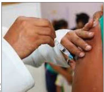
Vacunación contra la influenza.

La circulación del subclado K creció en Europa y varios países de Asia