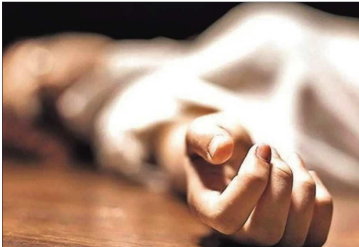
CRÍMENES. Entre el 1 de enero y el 12 de diciembre de este año, 77 mujeres fueron víctimas de feminicidio.

El fiscal superior de Vida y Personas de la Fiscalía General del Es-