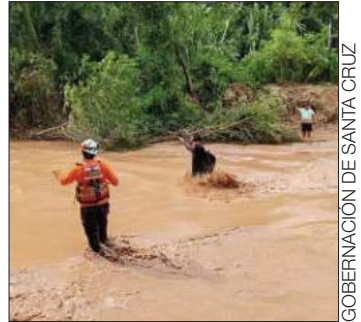
Búsqueda de desaparecidos.

En Santa Cruz, los ríos que conforman la cuenca río Pirai también están bajo alertar. En Beni se prevén emergencias en el río Maniqui y afluentes secundarios con ascensos de ríos.