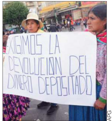
Los panificadores se movizaron.

Esa cartera confirmó que en un plazo máximo de 30 días hábiles se devolverán los montos anticipados para hacer una conciliación de cierre del acuerdo.