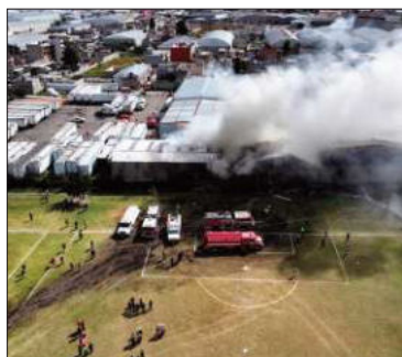
La avioneta que se incendió.

La aeronave al final terminó estrellándose contra un galpón