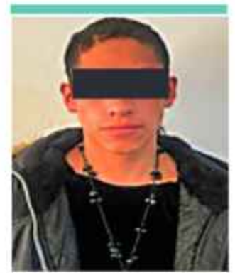
ASESINATO. Uno de los sospechosos del crimen.

El Parque Nacional Carrasco tiene 268 ha de cultivos de coca, el Área Natural de Manejo Integrado Nacional Apolobamba 76 ha, el Parque Nacional y Área Natural de Manejo Integrado Copapata 74 ha, los Parques Nacionales y Áreas Naturales de Manejo Integrado Madidi y Amoró 48 y 24 ha, respectivamente. Y el Parque Nacional y Territorio Indígena Isiboro Séure presenta 25 ha.