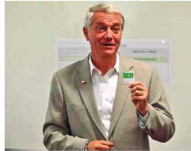
ULTRADERECHISTA. José Antonio Kast, presidente electo de Chile, tras un contundente triunfo electoral.

"Quiero darle las gracias a mi familia, a mis hijos y nietos, a mi familia extendida, a mis cuñados, hermanos y suegros, y especialmente a la mujer de mi vida que me ha acompaña-