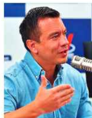
PRESIDENTE. Daniel Noboa, de Ecuador.

El gobierno de Ecuador informó AYER que el Salario Básico Unificado (SBU) para 2026 será de 482 dólares, es decir, subirá 12 dólares respecto a la remuneración mínima estipulada.