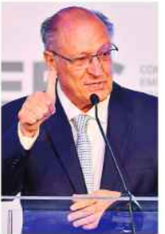
VICEPRESIDENTE. Geraldo Alckmin, de Brasil

"Vamos a batir récord este año, incluso con el mundo en menor crecimiento y con precios menores", dijo el Vicepresidente, acompañado por el mandatario Luiz Inácio Lula da Silva, durante un acto en Brasilia por la inauguración de la nueva sede de la Agencia Brasileña de Promoción de Exportaciones e Inversiones (ApexBrasil).