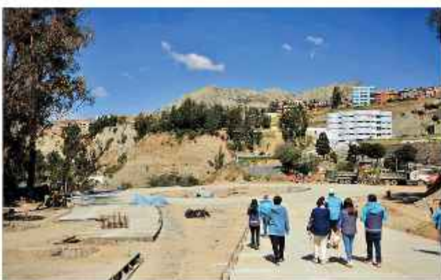
TRABAJOS. Los obreros municipales inspeccionan el lugar.

LAS OBRAS ESTÁN EN LA FASE FINAL DE SU CONSTRUCCIÓN