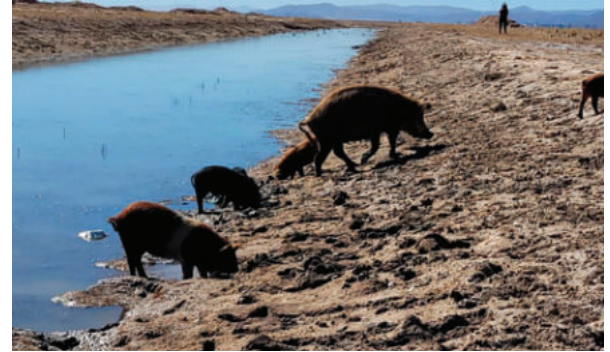
En el Ayllu San Agustín de Puñaca se confirmó contaminación en el agua

Durante la gestión pasada, la Gobernación sancionó al menos 16 operaciones mineras, incluida la reversión de una concesión en el sector de Challapata, y este año las acciones se intensificaron ante