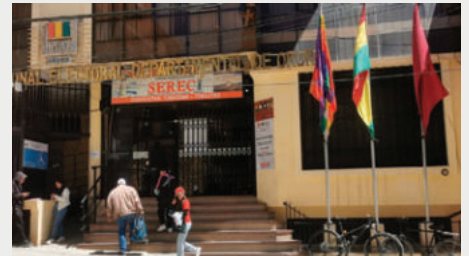
Los partidos y agrupaciones comunicaron ante el TED Oruro su participación de los comicios