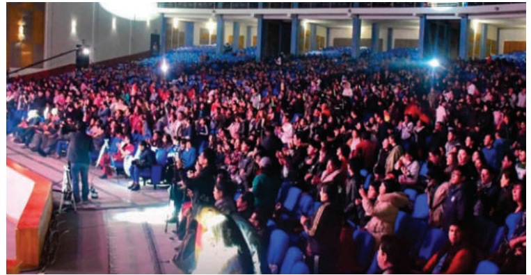
Kalimba no se presentó ante el público orureño

La autoridad reiteró que la cancelación de la llegada del artista no es responsabilidad de la Gobernación, sino de la empresa boliviana Actúa Pro, organizadora del arribo del cantante, que habría incumplido con los requerimientos técnicos, logísticos, de producción y económicos exigidos por la re-