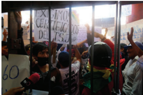
Internos se pronunciaron desde la cárcel de San Pedro

La mañana de este lunes 15 de diciembre de