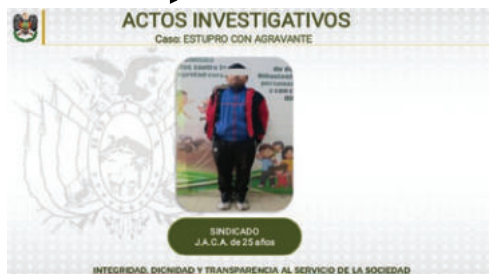
El sujeto de 25 años fue encarcelado por 30 días vía procedimiento inmediato

dencia los riesgos asociados al uso indebido de las redes sociales y las vulnerabilidades que enfrentan los adolescentes en entor-