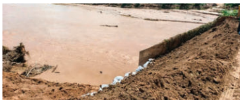
El puente de Colpa Bélgica cayó tras la riada

“Nos hemos encontrado con que el ‘Plan Lluvias’ no tiene recursos, son una serie de contratos de conservación vial que terminan en diciembre.