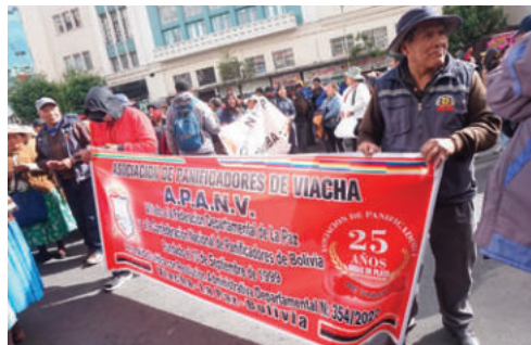
Panificadores federados se movizaron en La Paz

La Confederación Nacional de Panificadores de Bolivia (Conapabol) indicó que Emapa no ha ofrecido una solución concreta al sector. "Lo que estamos pidiendo es que nos devuelvan nuestros aportes de agosto y de septiembre que nos adeudan. Ya no venimos a pedir subvención, no queremos subvención, queremos nuestra devolución