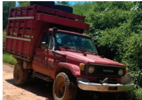
Camioneta de los dueños de la propiedad que fueron asesinados