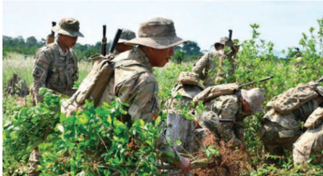
Erradicación de cultivos de coca ilegal

En el documento de 2023 se había registrado una superficie de 31 mil hectáreas de la hoja, lo que