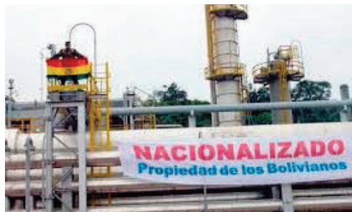
La comisión busca esclarecer la situación de los hidrocarburos en Bolivia

La comisión no tendrá un límite de tiempo para realizar la investigación, pero los primeros resultados se conocerán en 30 días, ya que, según mencionó Paz, son varios años de gestión que serán investigados, y que la instancia tendrá dos tipos de acciones: una será en el ámbito penal y la segunda será para poder recuperar los recursos supuestamente robados.