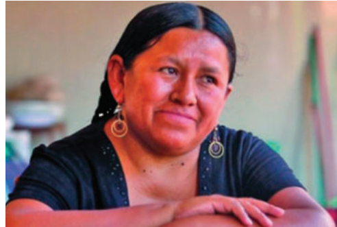
La exministra Nemesia Achacollo será convocada por la Fiscalía en el caso Fondo Indígena

“Se le va a citar a Achacollo en principio en calidad de testigo. Posterior a las investigaciones y a la documentación que está llegando al Ministerio Público, se va a determinar su situación jurídica”, dijo el fiscal Miguel Cardozo.