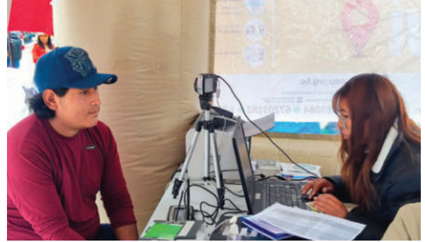
Se atenderá hoy hasta el último de la fila / LA PATRIA

El empadronamiento está dirigido a personas mayores de 18 años que aún no figuran en el padrón electoral, así como a quienes cumplirán esa edad hasta el mismo día de la votación, el 22 de marzo de 2026. Según ratificó Cucho, el objetivo institucional es garantizar un padrón depurado antes de ingresar a la fase de habilitación de candidaturas.