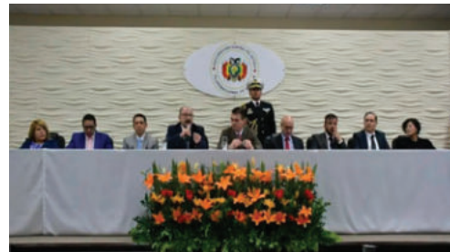
Varias autoridades e instancias serán parte de la comisión

Asimismo, el presidente del Estado, Rodrigo Paz, convocó a los medios de comunicación a otorgar cualquier información que llegue sobre la temática de