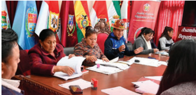
La Comisión Mixta de la ALDO ya tendrá resultados para hoy/LA PATRIA

De acuerdo con el procedimiento establecido, el Pleno de la Asamblea Legislativa Departamental