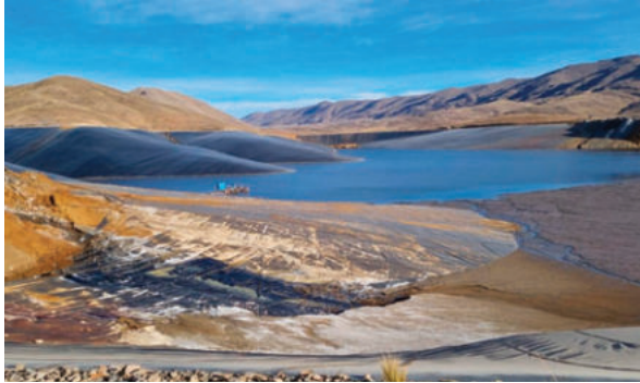
Los procesos a más de 80 actividades mineras deben seguir el curso de la justicia para una sentencia

Los procesos se originaron tras inspecciones técnicas conjuntas en las subcuencas de los ríos Desaguadero, Huanuni, Antequera y Poopó, donde se identificaron descargas de aguas ácidas, residuos mineros y aguas residuales sin tratamiento adecuado, provenientes tanto de operaciones mineras como de centros urbanos.