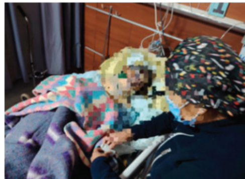
Tras ser socorrida, la mujer de 92 años falleció en el nosocomio

Tránsito, mediante la División Accidentes, atendió durante la última semana 17 casos, con cuatro heridos, 20 fallecidos y 26 vehículos afectados; por su parte, la División Especiales registró seis casos, con dos personas fallecidas, una herida y seis coches afectados.