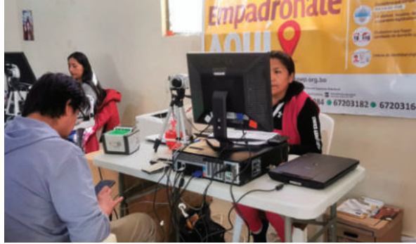
Hoy es el último día para el empadronamiento

“El empadronamiento debe realizarse en el lugar donde se ejercerá el voto. La restricción busca evitar distorsiones en