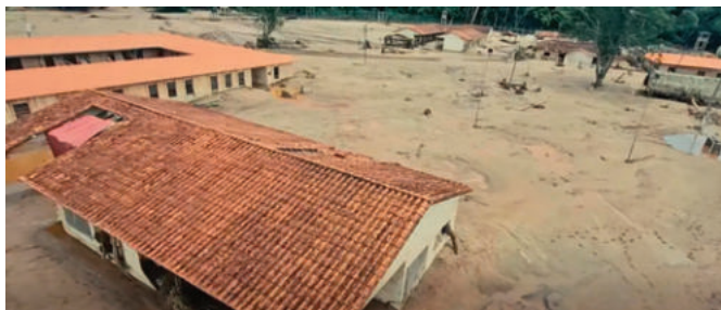
Viviendas que fueron afectadas por las inundaciones en El Torno

En este contexto de emergencia, la entidad reiteró el llamado urgente a priorizar la protección de la vida humana y a desalojar las áreas cercanas a los caudales. “Exhortamos a los