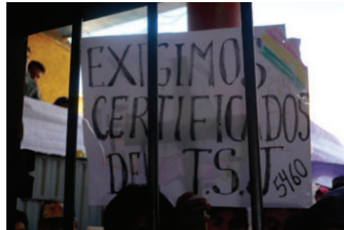
Exigen que el TSJ emita los certificados que les permitirá tramitar el indulto