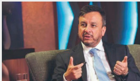
El ministro de Hidrocarburos y Energía, Mauricio Medinaceli