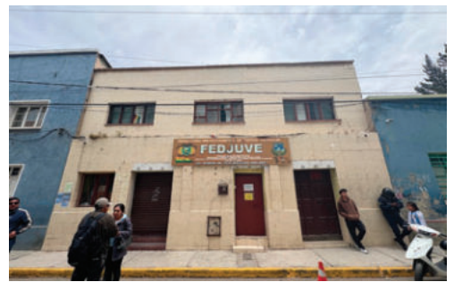
Sede de la Fedjuve fue precintada

Respecto al funcionamiento de la Fedjuve, el