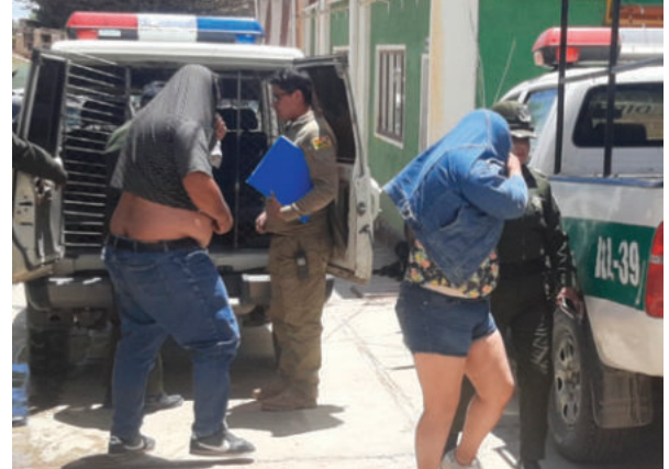
Dos varones y una dama fueron arrestados para fines investigativos

del motorizado y denunció el robo del coche. Indicó que en el motorizado iban tres personas que refirieron ser contratadas para transportar el coche, lo que aumentó la sospecha de un presunto robo y la versión del denunciante. “Estaba sien-