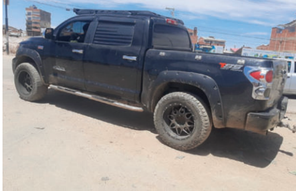
La camioneta fue trasladada hasta Diprove luego de ser recuperada

Según se conoció, el mecánico era cercano al dueño del motorizado, quien le contó sobre el robo de la camioneta a las 03:00 horas del lunes en la ciudad de