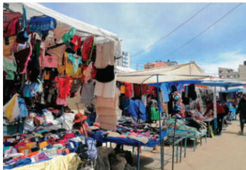
Comercio informal invade vías/LA PATRIA

Aseguró que el sector gremial está dispuesto a acompañar este proceso, siempre que se aplique de manera equitativa y transparente, para evitar nuevos conflictos y garantizar un orden justo en la actividad comercial de Oruro.