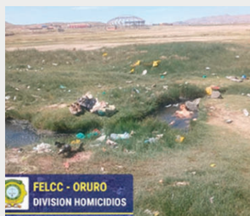
El adulto mayor fue encontrado flotando en el riachuelo cerca de Capachos

Una primera revisión realizada por un médico forense determinó que no existían signos de violencia, lo que fue confirmada en autopsia de ley y determinó que la causa de muerte fue asfixia por sumersión. El arroyo está ubicado a unos 300 metros al Norte del balneario mencionado.