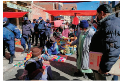
Comerciantes minoristas consideran necesario realizar un censo/LA PATRIA

El dirigente cuestionó la facilidad con la que, según dijo, algunos comerciantes acceden a carpetas y formularios para nuevos asentamientos, pese a que el trámite formal requiere autorizaciones específicas de instancias municipales. Indicó que se ha detectado