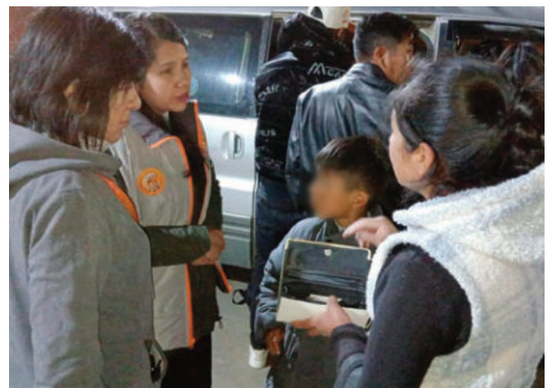
Controles buscan resguardar la seguridad de menores de edad

Las autorizaciones pueden tramitarse en las oficinas descentralizadas de la DIO. Una parte importante de la población cumple con la normativa y presenta las autorizaciones al momento de viajar.