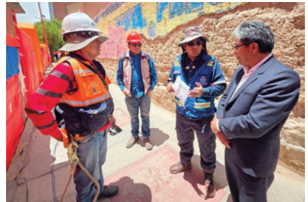
Autoridades supervisan trabajos en la ruta del Carnaval

De acuerdo con el relevamiento técnico, actualmente se trabaja en la rehabilitación de 29 cámaras distribuidas a lo largo de todo el recorrido, las cuales ya están siendo puestas nuevamente en funcionamiento. El objetivo, según explicó el técnico, es que para el Carnaval 2026 el siste-