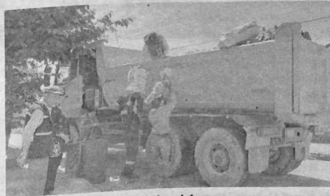
El recojo de basura en Colcapirhua.

Técnica, junto al equipo de Gestión de Residuos Sólidos, desplegó maquinaria y brigadas ambientales para iniciar la limpieza urgente de las zonas más críticas, priorizando avenidas, mercados y unidades vecinales.