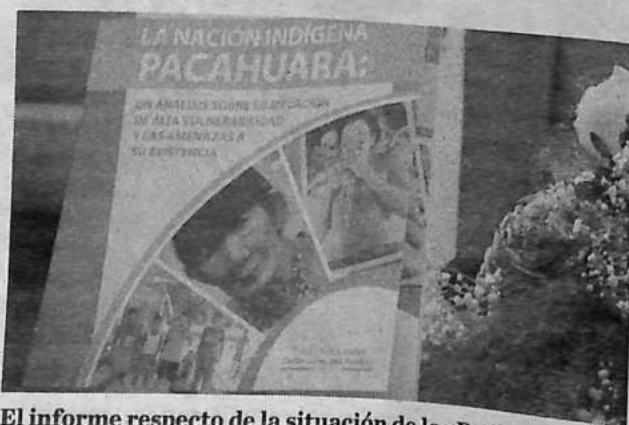
El informe respecto de la situación de los Pacahuara.

"Si un pueblo indígena como el Pacahuara desaparece, se fracturaría la esencia mis-