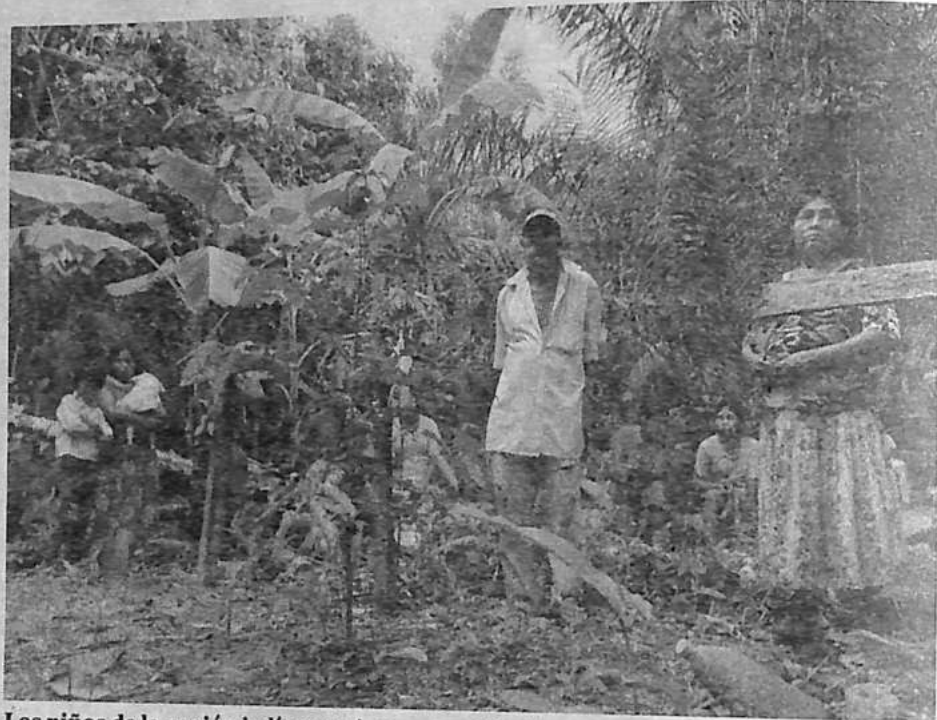
Los niños de la nación indígena tsimane, en el Beni.

Luego añade que sus nietos necesitan algo más: escribir, leer, defender sus derechos. Necesitan maestros que hablen su idioma. Necesitan un Estado que aparezca.