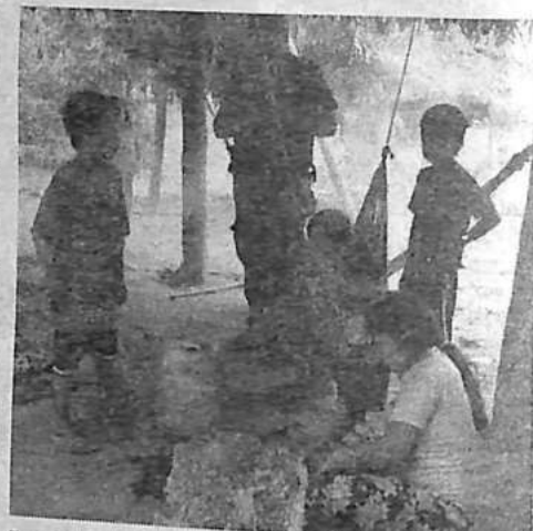
Los niños con dificultades para acceder a la educación. ESTACIÓN BIOLÓGICA DEL BENI