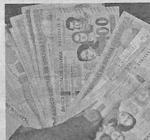
El dinero en moneda en bolivianos. C. LÓPEZ