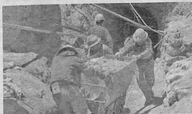
Un sector minero en Potosí. EL POTOSÍ

Especial de Lucha Contra el Crimen (Felcc), 104 de los fallecidos son varones y cinco mujeres, entre ellos seis menores de edad que también perdieron la vida en operaciones mineras. El caso más reciente ocu-