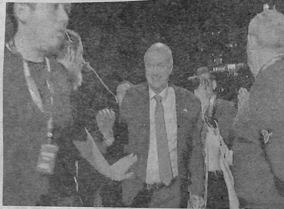
El presidente electo de Chile, José Antonio Kast, anoche en el centro de Santiago.

El abogado y exdiputado ultratratólico José Antonio Kast se sumó este domingo a la ola de líderes de extrema derecha que gobierna en parte del mundo y se convirtió, en el primer pinochetista desde el retorno a la democracia en