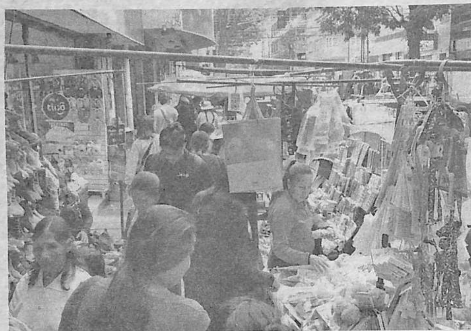
El comercio informal, una actividad que se intenta formalizar. DANIEL JAMES

Los representantes de la ABAV consideran que por más pequeñas que sean estas empresas, la obligación es trabajar con ellas y de esta forma volverlas transparentes y formales. Sin embargo, las condiciones no parecen ser apropiadas para que este tipo de empresas puedan formalizarse.