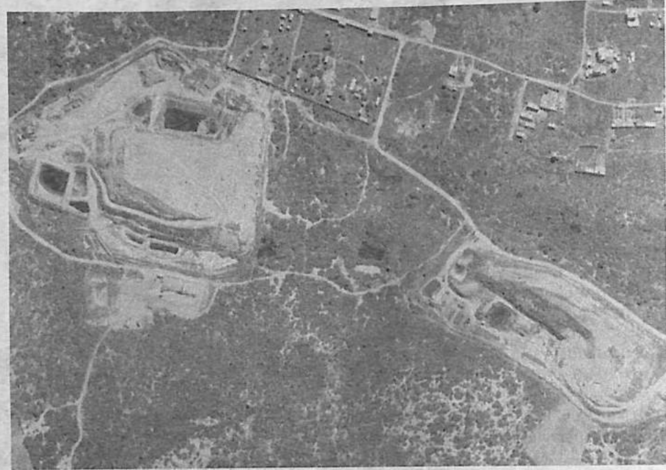
Una vista satelital de los dos botaderos de Colcapirhua y Quillacollo, lado a lado.

Aunque el acuerdo calmó la situación de forma temporal, el conflicto mostró que Cotapachi va más allá de un límite territorial: intereses económicos, control del territorio y la gestión de la basura.