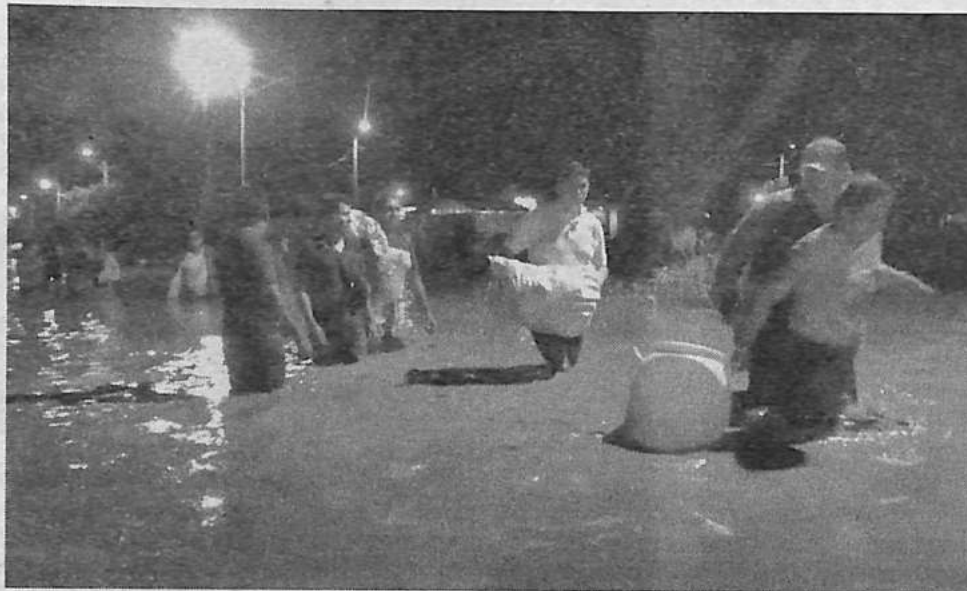
Afectados por el turbión son evacuados por personal de la Alcaldía de Montero.

Vecinos de esa ciudad denunciaron que entre 400 y 500 viviendas quedaron inundadas en la zona de Sidral y cuestionaron la falta de obras preventivas. "Todos los años sufrimos lo mismo. ¿Por qué esperamos a que llegue la lluvia para recién actuar?", reclamó un afectado, mientras el agua le llegaba hasta la cintura, informó El Deber .