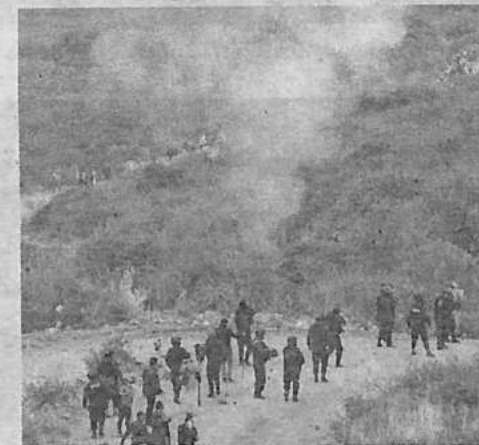
El conflicto entre comunarios de Cotapachi y policías. DAVID FLORES