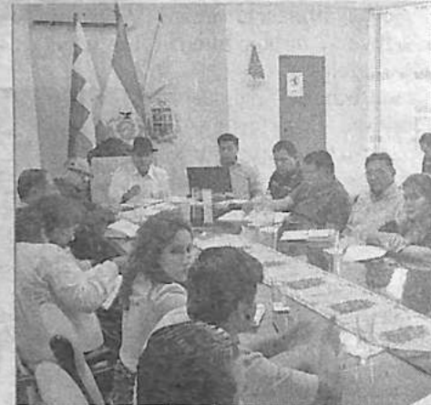
La firma del acuerdo entre Quillacollo y Colcapirhua, el jueves. GADC