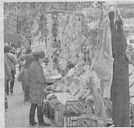
La actividad económica ninfomal. D. JAMES