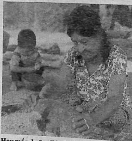
Hay más de 2 mil habitantes de la nación tsimani.