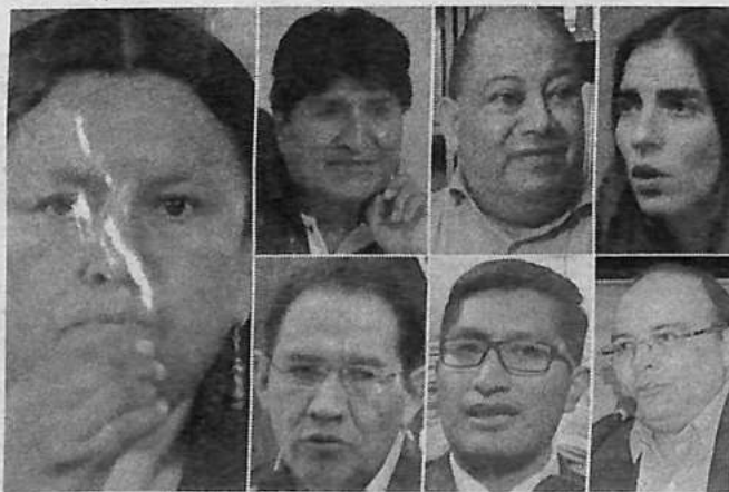
Exautoridades mencionadas por el exfiscal Saravia.

Explicó que cuando decidió citarla a declarar y luego ordenar la aprehensión, con base en pruebas suficientes que te-