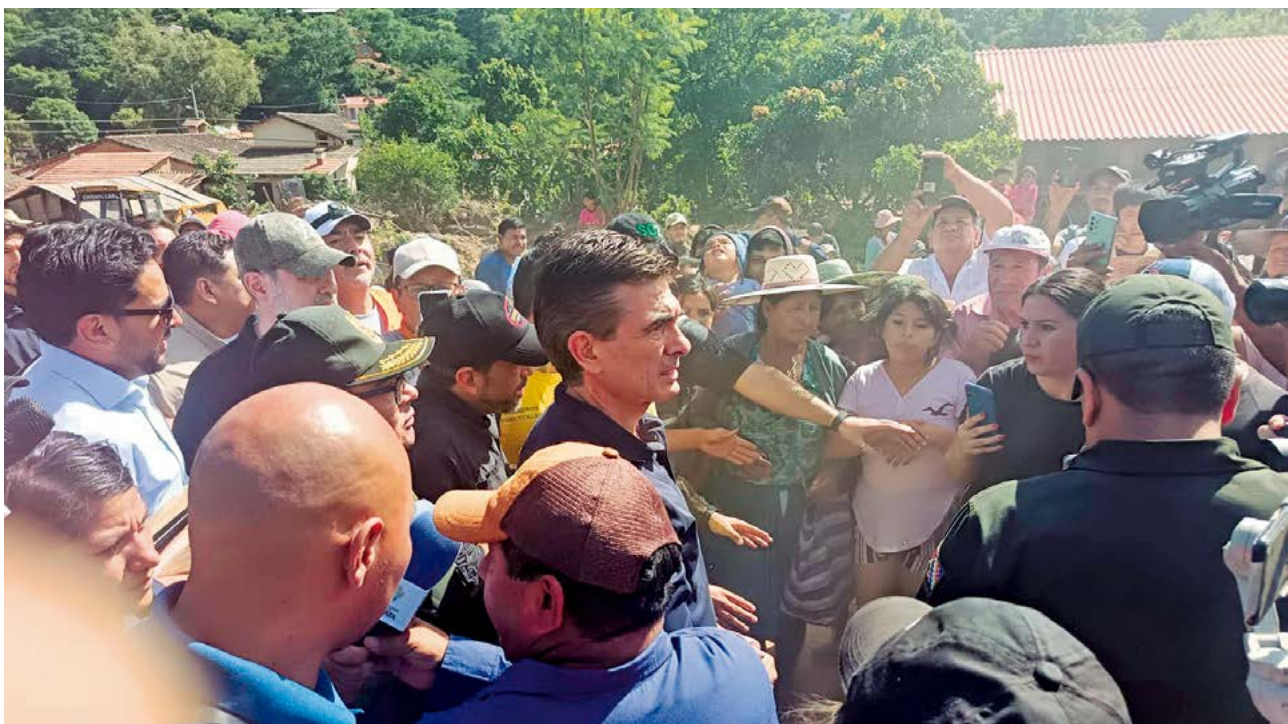
El presidente Rodrigo Paz llega a Achira a evaluar el desastre ocasionado por la riada.