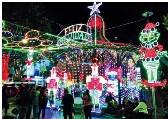
El Prado se llena de luces y espíritu navideño.