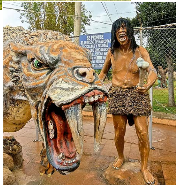
Las imágenes que recrean la prehistoria.

nicipales son de acceso gratuito y que ninguna persona está autorizada a cobrar por su uso. Con esta reapertura se garantiza que los espacios públicos continúen cumpliendo su función de promover la recreación, la integración social y el disfrute seguro de todas las familias cochabambinas.