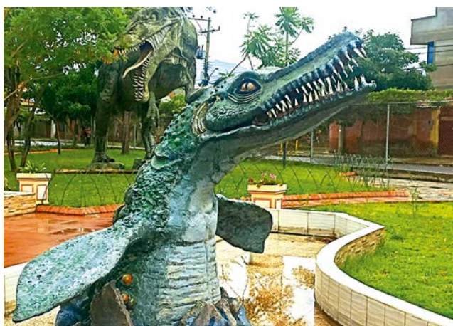
Figuras de dinosaurios que sorprenden a los visitantes.

Los horarios son de lunes a viernes, de 8:00 a 16:30, y fines de semana, de 8:00 a 20:00, garantizando seguridad y comodidad para todos los visitantes. Además, el polifuncio-