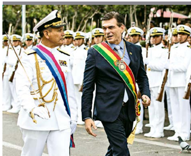
El presidente Rodrigo Paz en la parada militar.

de confianza ciudadana. Sin embargo, advierten que ese respaldo puede debilitarse si las promesas no se convierten en resultados visibles.