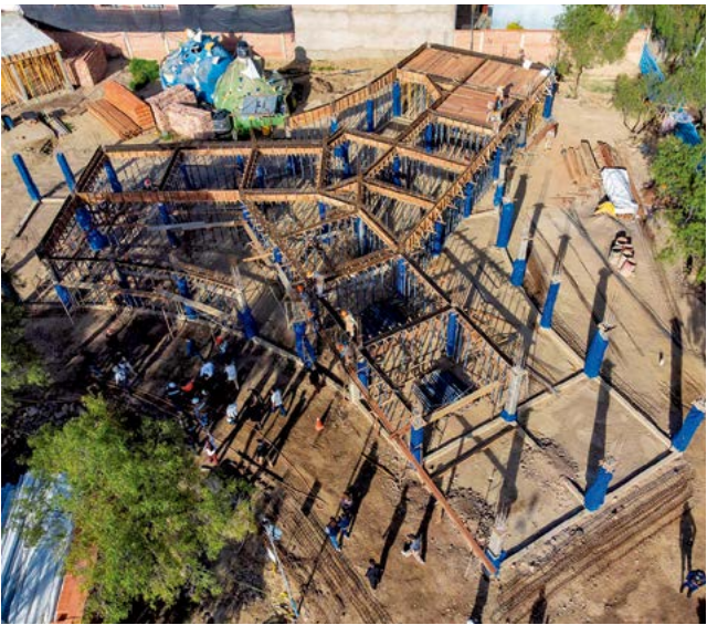
La construcción del atractivo turístico. GAMC