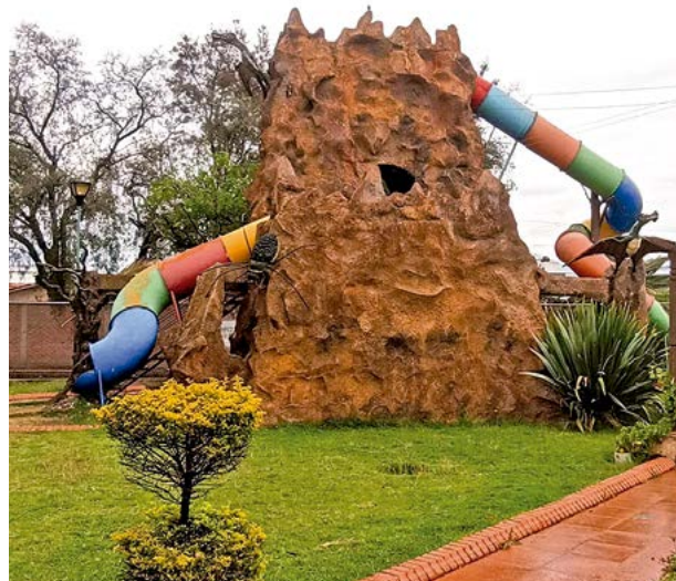
El parque ofrece juegos inspirados en el mundo prehistórico.