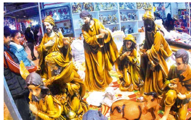
La Feria Navideña en la Fexco, en Alalay.