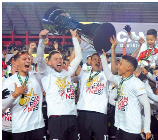
Always Ready festeja su título de campeón.

La propuesta de apelar a los jugadores jóvenes, también fue otro de los puntos a favor, según Baldivieso. “Para mí es algo muy lindo haber confiado