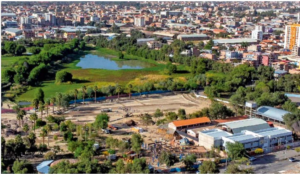
Las obras de Playa Turquesa, en Coña Coña, fueron inspeccionadas. GAMC