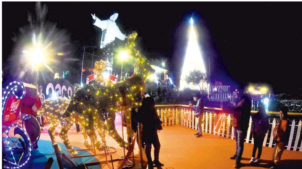
El Cristo de la Concordia y el árbol más grande, un espectáculo de luz en Navidad.