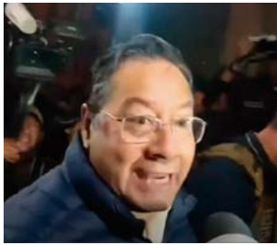
Luis Arce Catacora. RSSS

El expresidente Luis Arce, pasó su primera noche en la cárcel de San Pedro de La Paz bajo condiciones de aislamiento preventivo, luego de que fue internado para cumplir cinco meses de detención preventi-