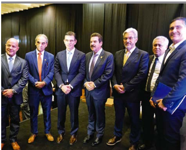
El presidente Rodrigo Paz se reúne con el empresariado cochabambino.