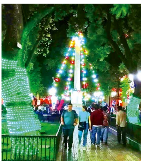
El corazón de la ciudad se ilumina: la plaza principal 14 de Septiembre.