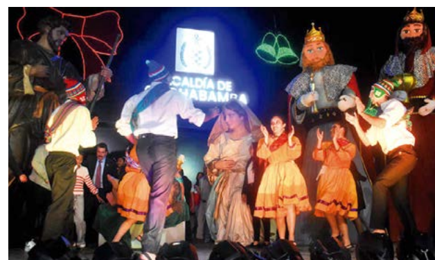
Pesebre más grande de Bolivia.