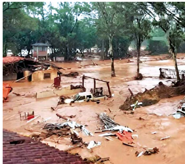
El lodo arrastrado por la riada cubre un vehículo. RRSS

Anoche dos cadáveres arrastrados por las aguas fueron recogidos por la Policía del canal Isuto, entre el cuarto y quinto anillos de la ciudad de Santa Cruz de la Sierra.