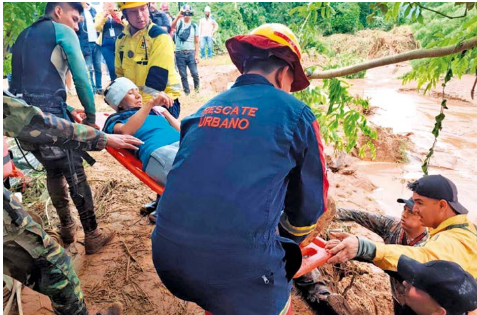
Rescatistas evacúan a una mujer lastimada, ayer en el municipio de El Torno.