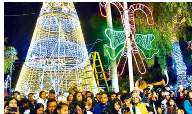
35 metros de luz y color en el árbol de la Av. Suecia.