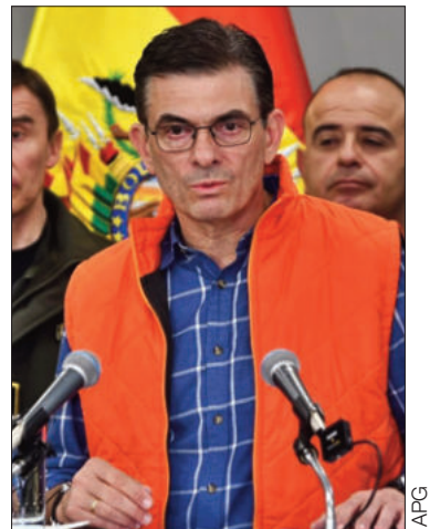
El presidente Rodrigo Paz.

Paz destacó que al menos 300 efectivos han sido desplegados en las zonas afectadas. Hasta el momento, se reportan siete fallecidos en Santa Cruz a consecuencia de los desastres naturales, además hay 20 desaparecidos.