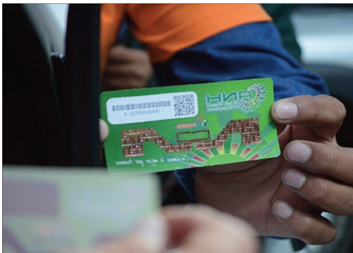
CONTROL. Una persona coloca el B-Sisa en un vehículo para controlar la compra de combustibles.

"Estamos buscando soluciones a los problemas reales, no solo de los productores, sino de toda la población. Y en todos estos problemas estamos partiendo exactamente de lo mismo, combusti-