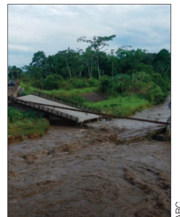
Así quedó el puente antiguo.

"Es importante aclarar que este incidente no afecta la transitabilidad en la zona", remarcó la ABC. Luego del incidente, la entidad realizó una evaluación de la infraestructura nueva, identificando únicamente una falla ligera en una junta de dilatación, sin que esto comprometa la estructura del tablero ni los apoyos. El paso es seguro, aunque se recomienda precaución.