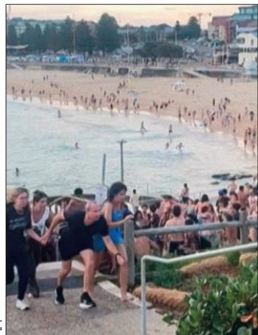
Las personas huyen del ataque.

Dos hombres atacaron a los asistentes a una fiesta judía en una playa