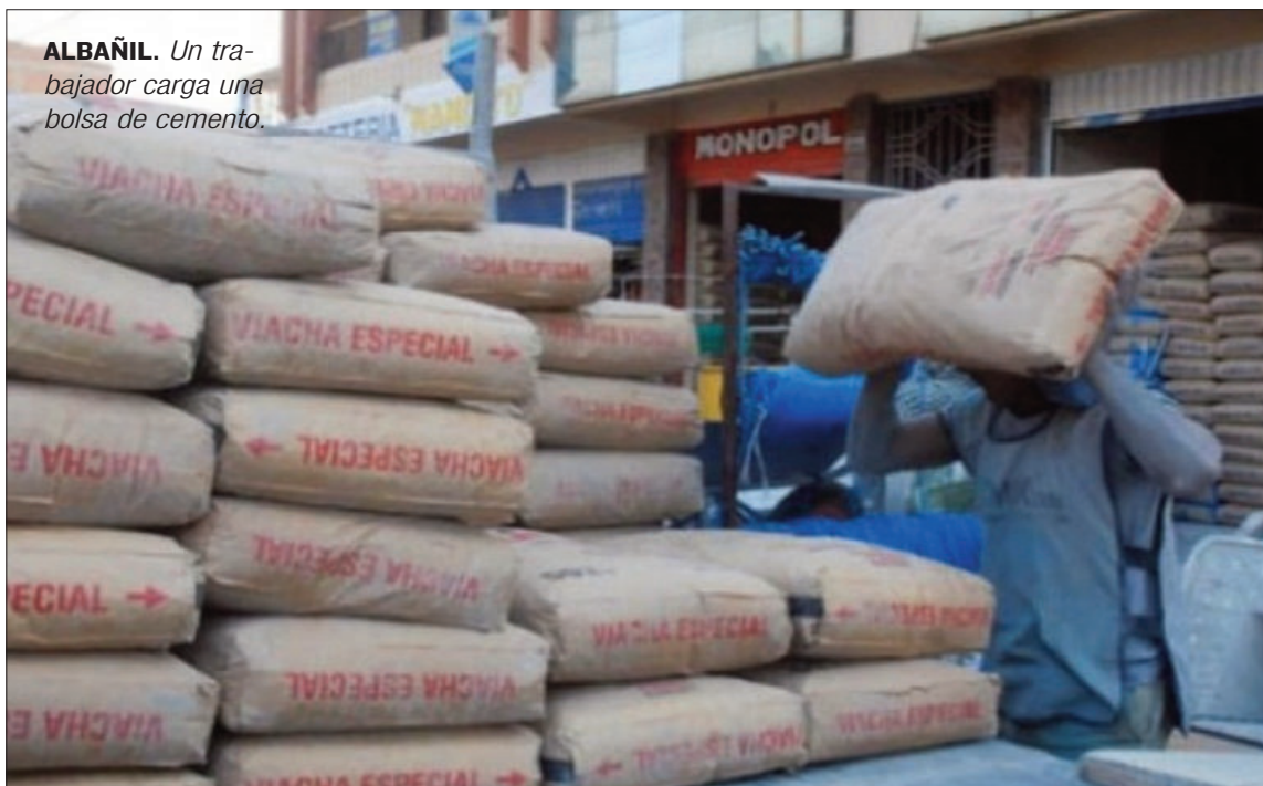
ALBAÑIL. Un trabajador carga una bolsa de cemento.

Además, el canciller aseguró que comparte la preocupación de Estados Unidos de que China utilice sus inversiones en Latinoamérica para obtener influencia. "Queremos diversificar nuestra cartera y queremos inversores serios", acotó según el reporte.