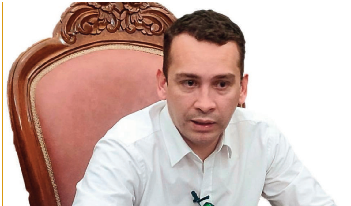
DENUNCIA. El presidente del Tribunal Supremo de Justicia, Romer Saucedo, en conferencia de prensa.

Saucedo expresó su preocupación por el impacto del hecho en sus hijos y cuestionó la falta de acción de las autoridades brasileñas. A través de sus redes sociales, señaló que la criminalidad no reconoce fronteras y lamentó que, pese a la existencia de cámaras de seguridad, no haya una respuesta oficial.