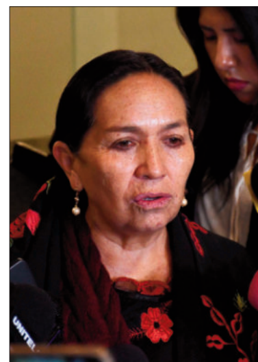
Tomasa Yarhui, senadora de Libre.

Los vocales que emerjan de este proceso tendrá su primera “tarea fuerte” el llevar las elecciones subnacionales fijadas para el 22 de marzo de 2026.