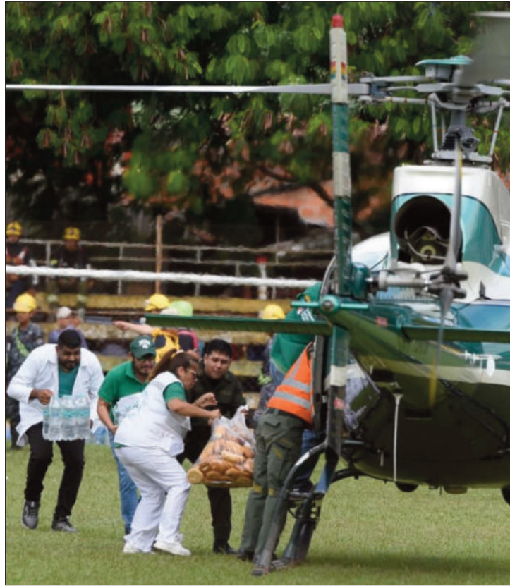
DESASTRE. Las lluvias generaron desastres en el oriente del país.

Justamente ayer, el Senamhi ha activado tres alertas, una de ellas, de prioridad naranja, por lluvias y tormentas eléctricas. En tanto que, de las otras dos, una es de prioridad roja y la otra naranja, debido a los riesgos de desbordes de varios ríos del país.