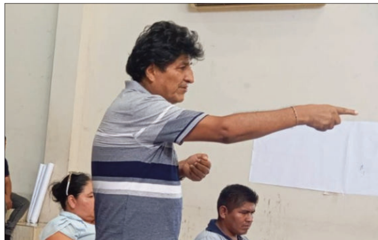
El expresidente Evo Morales.

En su descargo, dijo que su gobierno enfrentó el caso en 2015 junto con la Contraloría Generales del Estado y recordó que dos ministras de su gobierno, Nemesia Achacollo y Julia Ramos, fueron encarceladas por su presunta implicación en el expediente.