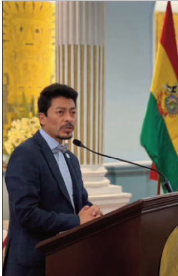
El canciller Fernando Aramayo.

NEGOCIOS. Según el canciller, buscan romper el monopolio con China