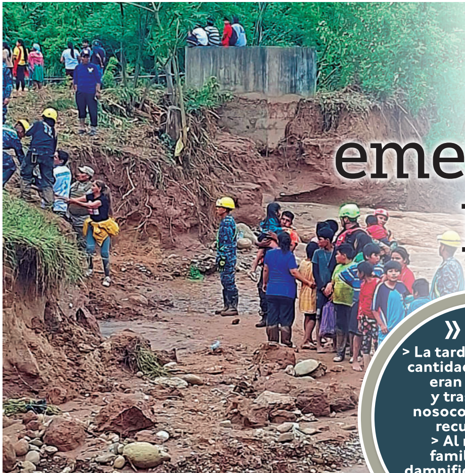
TRAGEDIA. Los ríos Pirá y Espejos se llevaron todo a su paso.