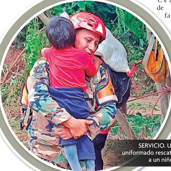
SERVICIO. Un uniformado rescata a un niño.