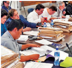
TRABAJO. Integrantes de la Comisión Mixta.

de manera individual y técnica a los habilitados. Este proceso contempla criterios de formación académica, experiencia profesional y probidad. Se busca la transparencia en esta elección y se aplicarán los puntajes establecidos. Hoy, la comisión continuará el proceso de selección de los vocales.