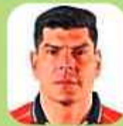
Carlos Lampe Bolívar