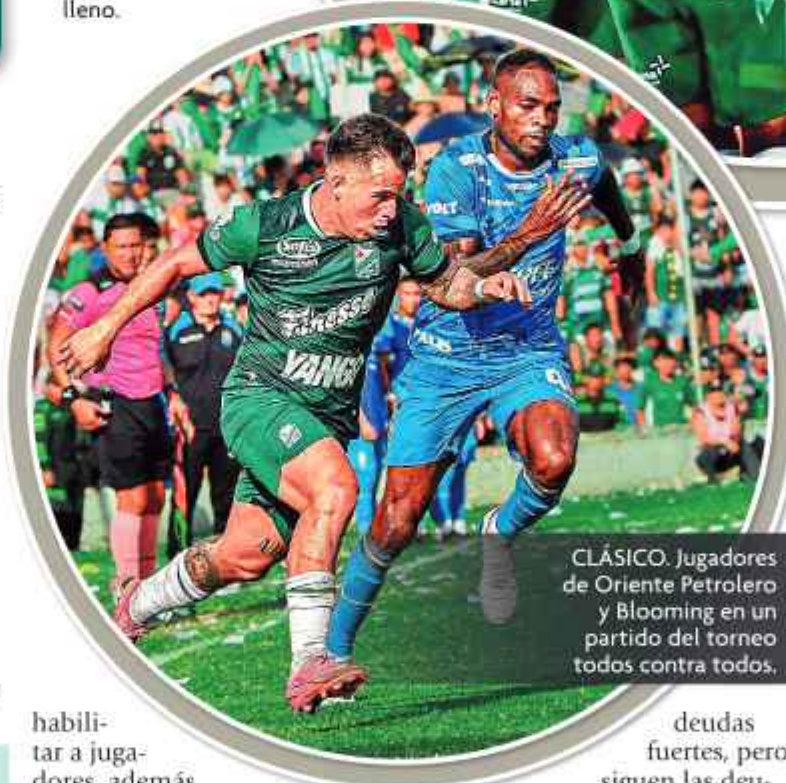
CLÁSICO. Jugadores de Oriente Petrolero y Blooming en un partido del torneo todos contra todos.

HINCHADA. Los partidos entre Oriente Petrolero y Blooming se juegan a estadio lleno.