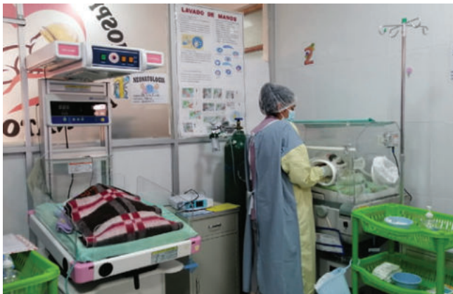
La Alcaldía administra aproximadamente el 57% del recurso humano que presta servicios en los 22 establecimientos de salud

El Gobierno Autónomo Municipal de Oruro (GAMO) anunció la continuidad del personal de salud en los establecimientos médicos del municipio hasta marzo de 2026, en respuesta a preocupaciones sobre la estabilidad laboral y la ca-