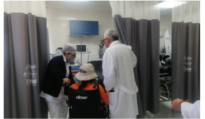
Se garantiza el personal de salud en los establecimientos

Indicó que desde hace uno o dos años, el crecimiento poblacional del municipio no ha sido