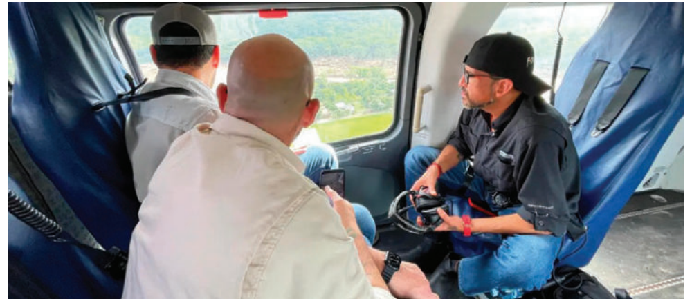
El gobernador Luis Fernando Camacho realizó un sobrevuelo en El Torno

Señaló que el Presidente Rodrigo Paz ya está