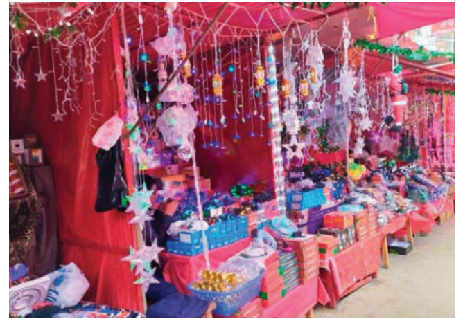
Más de mil comerciantes se asentarán en la Feria Navideña / LA PATRIA

Indicó que los comerciantes realizaron sondeos tanto en Oruro como