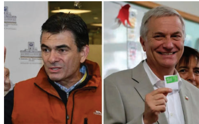
El Presidente de Bolivia Rodrigo Paz y José Antonio Kast, nuevo mandatario de Chile

Jara, quien postuló por la coalición Unidad por Chile, se comunicó con su oponente para felicitarlo.