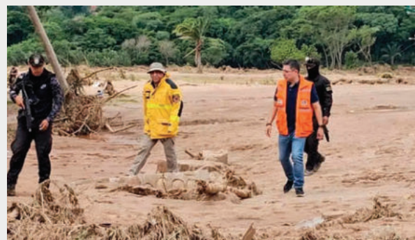
Una de las zonas afectadas por la riada

El municipio de El Torno declaró duelo municipal de siete días. Al menos 11 comunidades quedaron bajo el agua.