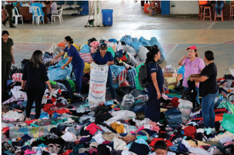
Personas clasifican objetos de ayuda humanitaria en un coliseo habilitado como albergue este domingo, en El Torno

Troche se declaró “muy consternado” por el estado de las comunidades afectadas, donde la “situación es lamentable” y “crítica” e informó que se buscan los recursos para intensificar las tareas de rescate y asistencia a los damnificados.