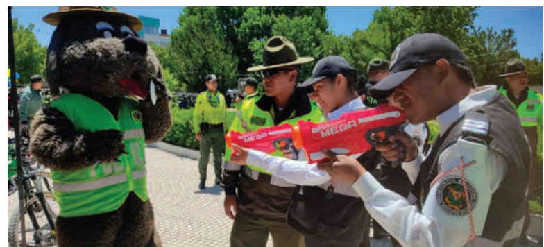
Demostración e información se vio en la feria policial

Desde el Comando Departamental se informó que este tipo de ferias se replican a nivel nacional, organizadas por los