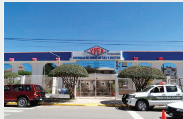
Las oficinas de Redes de Gas fueron intervenidas el pasado viernes

La decisión del juez fue apelada por el Ministerio Público, que pidió la detención preventiva del imputado.