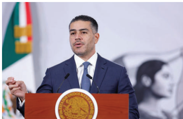
El secretario de Seguridad y Protección Ciudadana, Omar García Harfuch

García Harfuch detalló que los veinticinco reos estaban internados en pena-