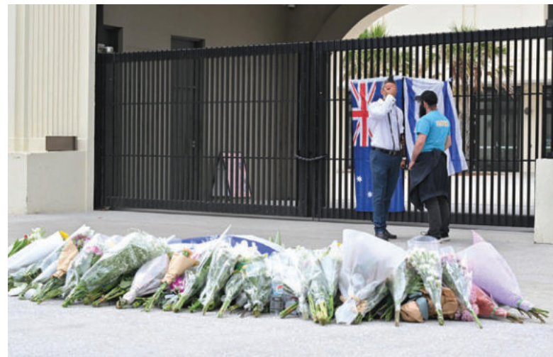
Las banderas de Australia e Israel, junto a decenas de ramos de flores, en recuerdo de las víctimas del atentado en la playa de Bondi

La misma fuente dijo hoy a ABC que el segundo presunto