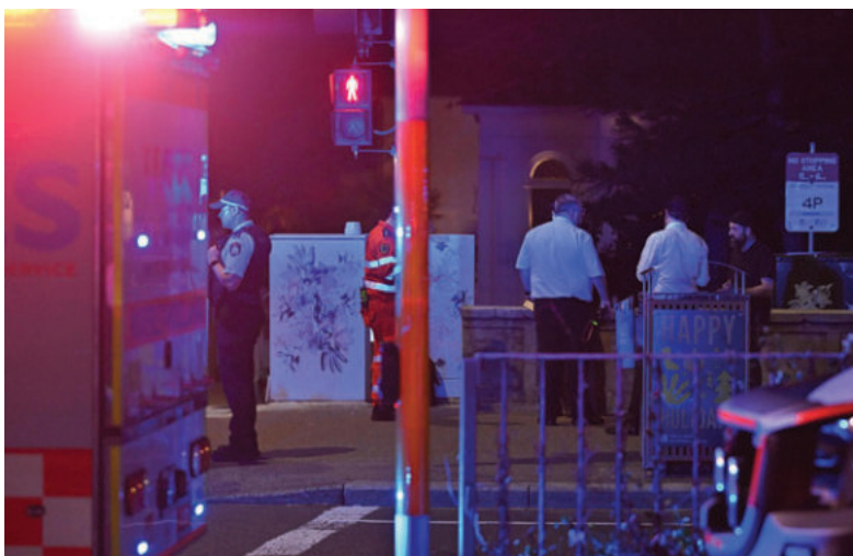
Policía tras el atentado

Catorce personas murieron en el lugar de los hechos y otras dos, incluida una niña de diez años y un hombre de cuarenta, fallecieron posteriormente en el hospital.