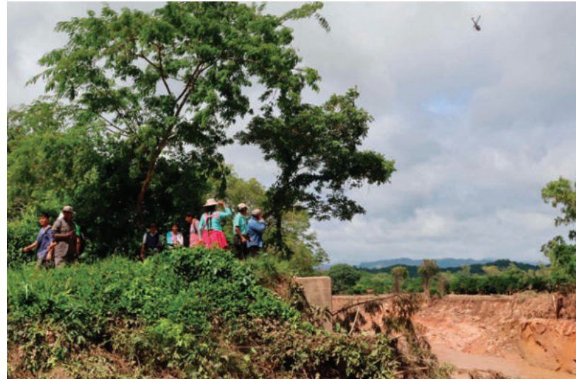
Personas observan una zona afectada por el desbordamiento del río este domingo, en El Torno

Hace un mes, las lluvias ocasionaron emergencias en el municipio de Samaipata, también en Santa Cruz.