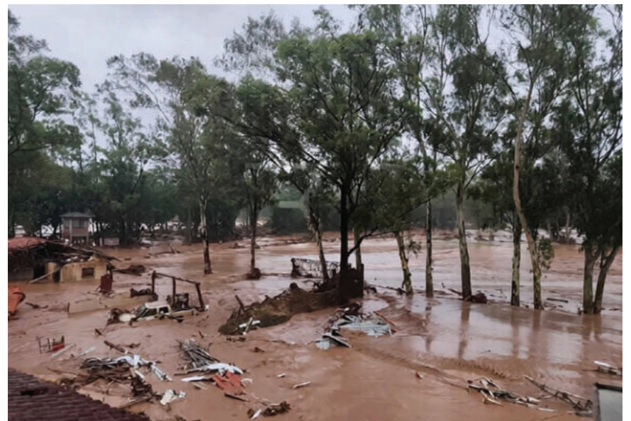
La inundación en El Torno

Dijo que hay al menos dieciséis o dieciocho helicópteros parados por falta de mantenimiento o repuestos y que se están movilizando recursos extraordinarios para habilitar estos aparatos en los próximos días. Paz señaló que, por reportes de países