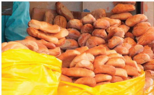
La venta de pan atraviesa incertidumbre /REFERENCIAL

Baltazar consideró que el Gobierno está dilatando la solución y, en ese proceso, “está haciendo quedar mal al sector panificador