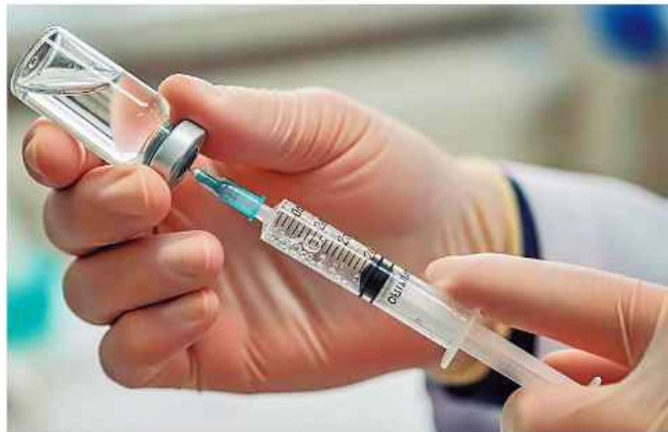
PREVENCIÓN. La vacuna antigripal es la principal arma contra esta cepa de la gripe.

Si bien aún no se han registrado casos en América Latina, los expertos destacan la necesidad de an-