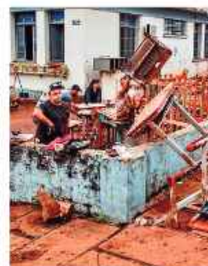
CICLÓN. Personas reparan los desastres en Brasil.

Los fuertes vientos derribaron decenas de árboles y obligaron al cierre de parques, entre ellos el emblemático Ibirapuera, sede de la Bienal de Arte de Sao Paulo hasta el 11 de enero. RUSSIA TODAY