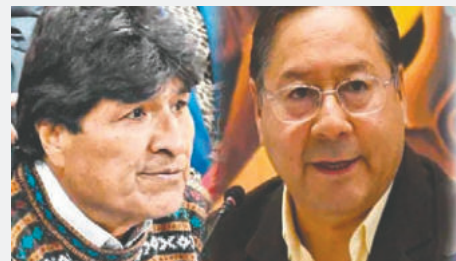
Los expresidentes Evo Morales y Luis Arce Catacora