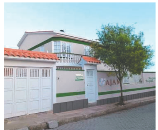
La AJAM presentó querrela contra cinco personas quienes fueron condenadas por explotación ilegal de mineral

ridad Minera anunció que continuará impulsando todas las acciones legales necesarias para sancionar la explotación ilegal de recursos minerales.