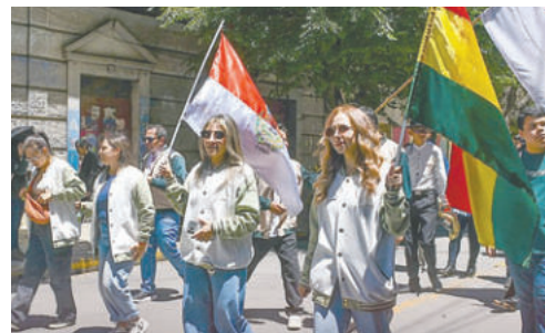
Artistas recorrieron las calles de Oruro