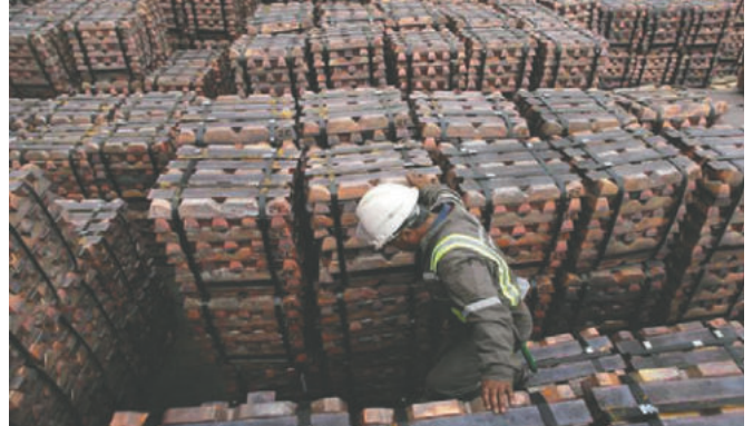
Cochilco resaltó la entrada de nueve iniciativas nuevas o que avanzaron en sus planes durante este año

Cochilco resaltó la entrada de estas iniciativas nuevas o que avanzaron en sus planes durante este año. Entre los proyectos destacan nuevas concentradoras en las minas Collahuasi, una asociación entre Anglo American y Glencore, y en Escondida de BHP. La cartera 2024-2033 estimaba 83.181 millones de dólares.