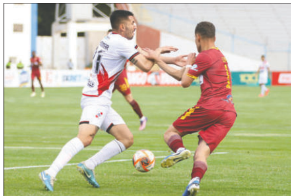
El cuadro realista no pudo evitar las arremetidas de los visitantes