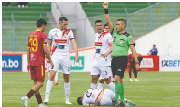
El equipo orureño apeló al juego brusco y no le sirvió de nada

Torres, Javier Guerra, Dubán Palacio, Martín Payares y Daniel Mancilla; D.T. Leonardo Egüez; expulsado: Jhojan Arce 18'; goles: Diego Hoyos 15' y Maximiliano Núñez 49' (penal).