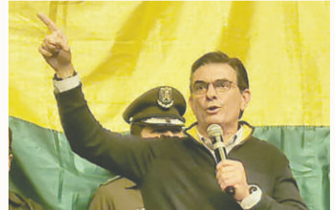
El Presidente Paz, que fue candidato por el PDC, durante su visita a Oruro