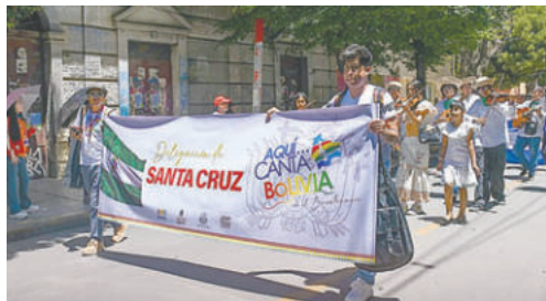
Delegaciones del interior también están en el festival

Las delegaciones participantes expresaron su emoción por estar en Oruro, una ciudad donde la música y la tradición convergen de manera única.