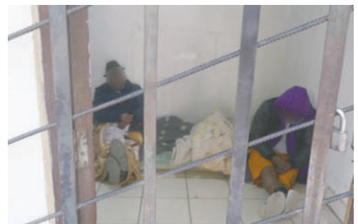
Ambos sujetos fueron remitidos a la cárcel de San Pedro

plicado de la tercera edad fue aprehendido por agentes del “verde olivo”. Am-