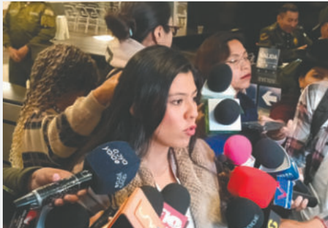
Diputada Natali Solares, en contacto con los medios de comunicación