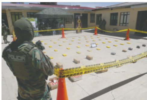
Incautaron más de 64 kilos de cocaína que pretendían ser traficados a Chile

La incautación total fue de 64 kilos con 650 gramos de clorhidrato de cocaína, y junto al secues-