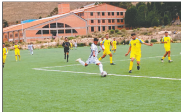
Ingenieros no tuvo problemas para derrotar a FC VHSR Oruro