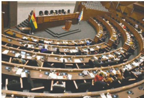
El pleno de la Cámara de Diputados en sesión

La aprobación se concretó con 61 votos a favor frente a 51 en contra, de un total de 112 votos emitidos. Tras el proceso de votación, la vicepresidente de Diputados,