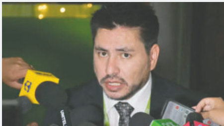
Fiscal Miguel Cardozo