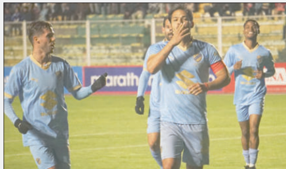
Jugadores de Bolívar celebran el triunfo y la clasificación a Copa Libertadores