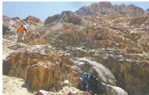
Trabajos de exploración minera en Mendoza, Argentina

«Los proyectos de exploración en el Distrito Minero de Malargüe Oeste continúan recibiendo una abrumadora aprobación por parte de la Legislatura Provincial de Mendoza». Además, mencionó que «en la sesión del Senado de Mendoza celebrada el 9 de diciembre de 2025, donde se aprobaron por ley las Declaraciones de Impacto Ambiental (DIA) de los 27 proyectos adicionales, también se discutió y aprobó por ley la Declaración de Impacto Ambiental (DIA) del Pro-