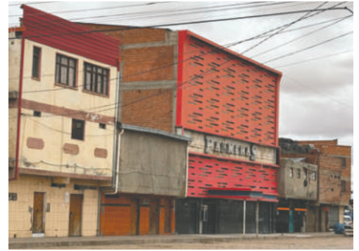
Proyecto de ley de traslado de casas de tolerancia genera tensión en Oruro

El sector identificado para la reubicación está en intermediaciones de la urbaniza-