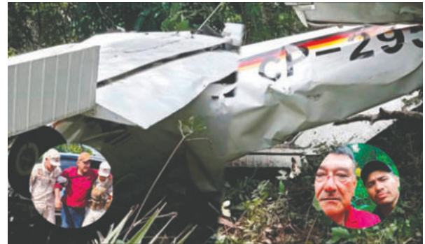
Un piloto y su pasajero fueron hallados con vida después de que su Cessna 172 se estrellara en una zona boscosa

La Dirección General de Aeronáutica Civil (DGAC) lanzó un comunicado informando