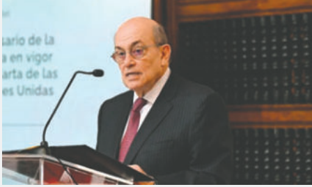
El canciller peruano brindó la información