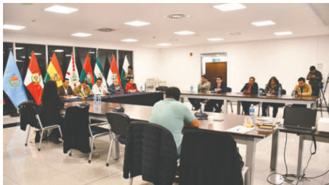
La Comisión Mixta continúa con las diferentes etapas de la elección de vocales para el TSE