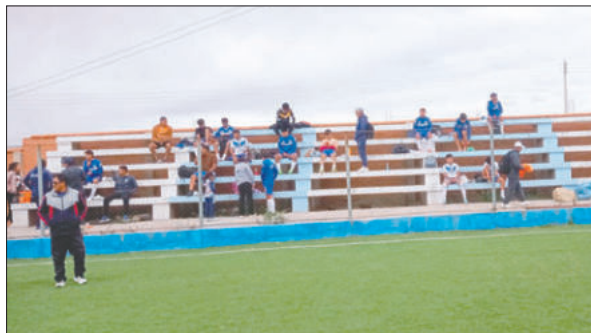
Jugadores de San José luego de que el partido se suspendiera

El director técnico del plantel orureño, José Ferrufino, manifestó que su equipo mostró una mejora en el juego pese a las adversidades y que el objetivo inmediato es sumar en la última fecha para mantener la categoría. Indicó que solo lleva dos días al mando del plantel, pero que los jugadores están comprometidos en buscar un resultado positivo en el cierre del torneo.