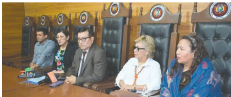
Por un periodo de casi dos años, cinco magistrados del Tribunal Constitucional prorrogaron su mandato

El monto cuestionado representa una parte significativa del presupuesto total del TCP para este año, que asciende a cerca de 76 millones de bolivianos. Prudencio lamentó que es-