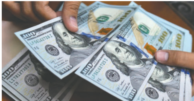
Billetes de cien dólares