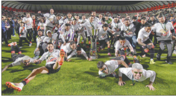
Always Ready se consagró faltando una fecha para el final del torneo

GUABIRÁ (0): Manuel Ferrel, Gustavo Olguin, Sebastián Ibáñez, Mauro Barro, Milciades Portillo,