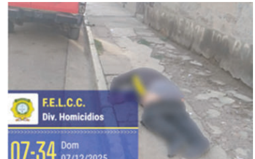
Buscan a otros tres sujetos que participaron en los crímenes

gica frontal, policontuso y un edema cerebral difuso.