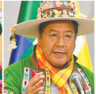
Los aprehendidos por el caso Fondo Indígena

producción de tomates en favor de ocho comunidades, además de enfrentar un segundo proceso vinculado a la producción de miel.