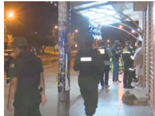
Agentes del orden acordonaron la zona

La Policía activó una investigación para dar con los autores del hecho. Se espera que las indagaciones permitan esclarecer lo sucedido y determinar los motivos detrás del ataque.