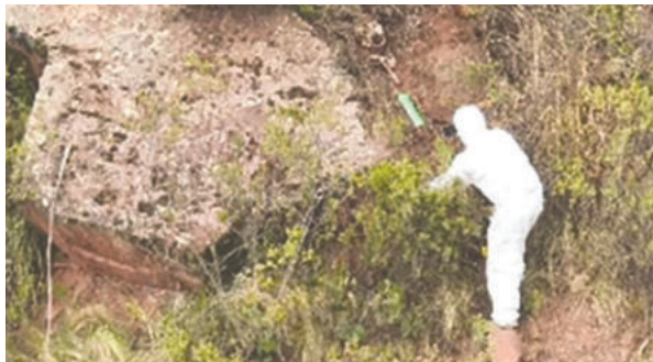
El cadáver de la víctima fue encontrado en una localidad del departamento de La Paz

Ahora, la Fiscalía Especializada en Delitos Contra la Vida se hará cargo de las investigaciones posteriores.