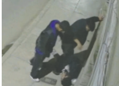
Cámaras grabaron el momento de la golpiza a un joven de 21 años

Las investigaciones establecieron el modus operandi de la banda de atracadores. Tras reunirse en un boliche y consumir bebidas alcohólicas, aproximadamente a las 02:00 horas, salen y empiezan a buscar víctimas en estado de ebriedad y luego de robarles, les propinan una brutal golpiza.