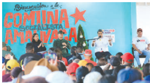
El presidente de Venezuela, Nicolás Maduro

Maduro afirmó que Machado "salió aplaudiendo y apoyando el secuestro armado del barco petrolero que llevaba petróleo venezolano". En su discurso, también mencionó que la opositora hizo el "ridículo" tras regresar a la capital noruega después de once meses en la clandestinidad en Venezuela.