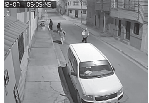
El médico falleció tras ser brutalmente golpeado

El joven fue diagnosticado con traumatismo encefalo craneal (tec), contusión hemorrá-