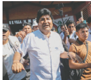
Morales es protegido por una guardia civil en el Chapare

"Sentimos que con el Gobierno de Paz se viene una cacería de los dirigentes, particularmente de campesinos. Por supuesto, los que tienen responsabilidades tienen que pagar ante la justicia, no nos oponemos, tiene que haber una investigación profunda en cualquier denuncia", señaló.