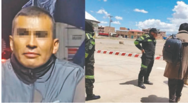
El hombre fue aprehendido