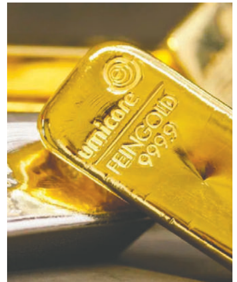
Lingotes de oro sobre barra de plata

En otros metales preciosos, el platino ganaba un 0,8%, a 1.669,73 dólares, y el paladio subía un 0,3%, a 1.480,03 dólares.