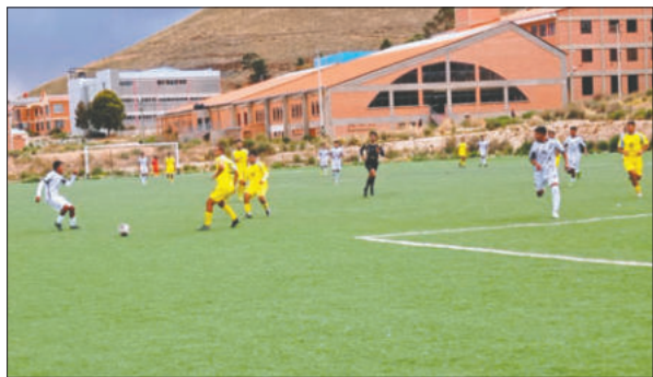
El "chivato" finalizará el torneo como subcampeón de este año

Los tres partidos completaron una fecha con alto ritmo competitivo dentro del torneo oficial 2025, que avanza hacia su recta final.