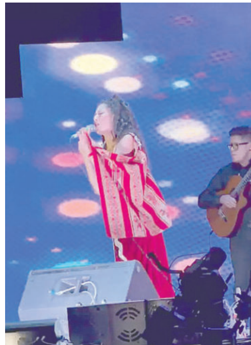
El festival mostró talento en el escenario