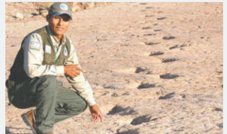
Se pretende proteger de la erosión a las huellas de dinosaurio