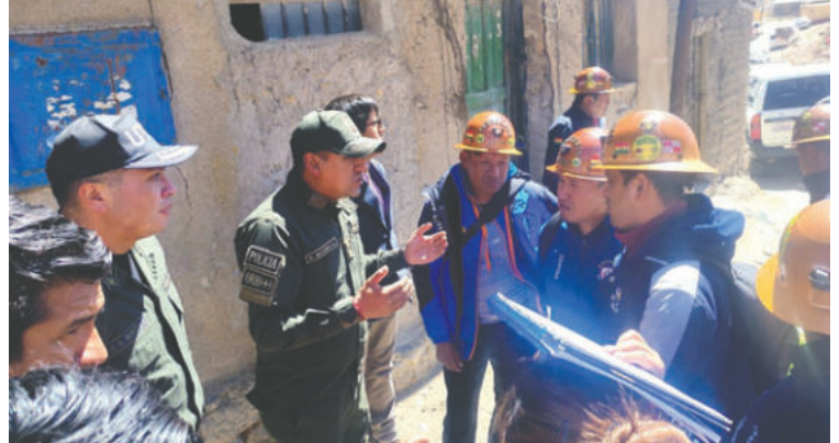
Las acciones buscan brindar seguridad a los trabajadores del Cerro Rico y combatir el "juqueo"