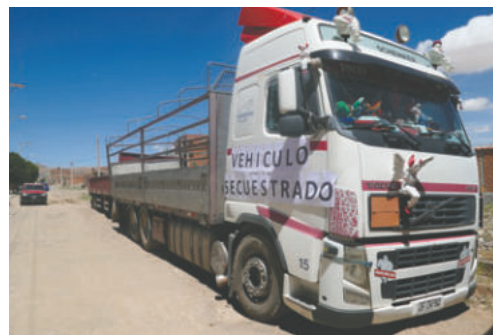
Descubrieron un compartimiento secreto que ocultaba la droga en el tractocamión

El director general de la Felcn, coronel William Cabrera, precisó que la carga con droga tenía que ser internada al vecino país de Chile.