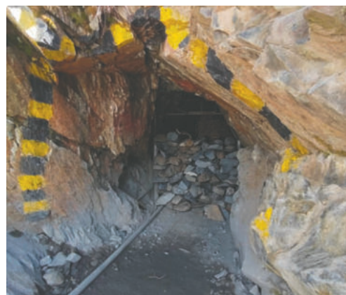
Identificaron trabajos ilegales en la comunidad San Silvestre, Tupiza, departamento de Potosí

ción y comercialización ilegal de minerales. Era quien recibía, liquidaba y efectuaba los pagos, simulando que el mineral provenía de la denominada "Mina Italia".