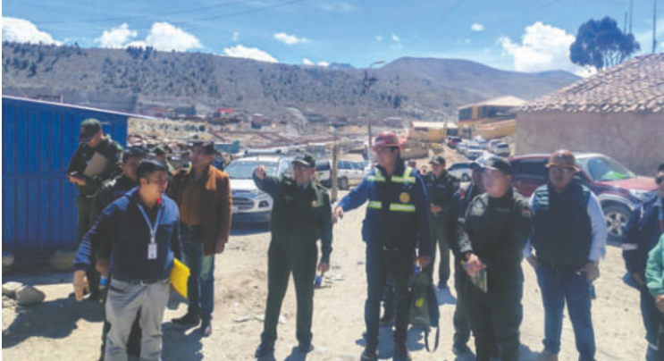
Inspeccionan el sector en el que será emplazado el módulo policial