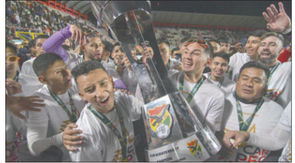
Jugadores del "millonario" celebran con el trofeo de campeón