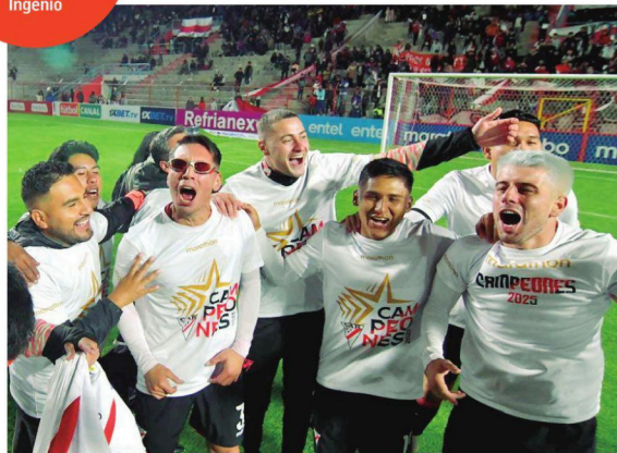
Los jugadores del campeón celebraron con una polera especial diseñada para el festejo

Lo más bonito que hice este año fue disfrutar de mi vida y aportar a Always. Me siento dueño de este equipo"