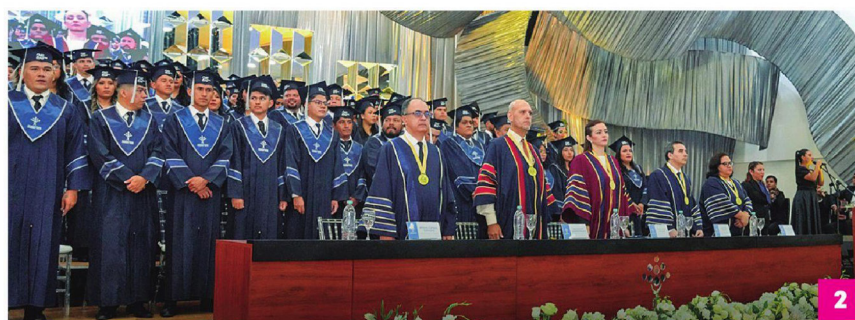
2. Las autoridades de la UPDS en la testera