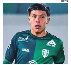
Cuiza hizo el gol para los chapacos.

Sin embargo, Bolívar consiguió aumentar el marcador a los 71' luego de una excelente definición del goleador Martín Cauteruccio. John Velásquez puso el quinto (82') y selló la paliza al plantel cochabambino.