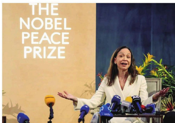
La opositora venezolana Corina Machado en la conferencia en Oslo

No quiso especular, sin embargo, sobre la estrategia de Washington y otros países en la defensa de su seguridad nacional, en la que