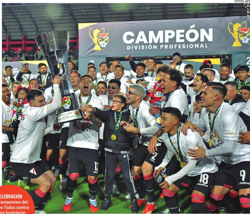
CELEBRACIÓN Los campeones del torneo Todos contra Todos festejaron con la Copa en Villa Ingenio

Tras el pitazo final del árbitro Gery Vargas, los jugadores se abrazaron, los suplentes corrieron al campo de juego y el director técnico se hincó y levantó los brazos al cielo agradeciendo al divino creador por un nuevo título en el fútbol boliviano. El primero lo consiguió en el banco de Aurora en el 2008. En el cierre del torneo, Always jugará como campeón. Será este domingo ante Independiente.