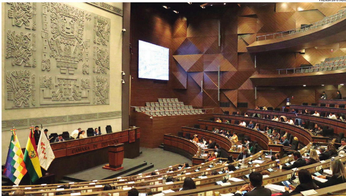
La Cámara de Diputados aprobó por mayoría el proyecto de ley que autoriza el préstamo japonés

TIENE UN PLAZO DE 15 AÑOS DE PAGO Y UN INTERES DE 0,01%