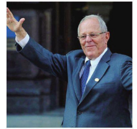
El expresidente peruano

Hace cuatro años llegó a decir que, si el general Augusto Pinochet estuviera vivo, votaría por él. Cuando le han preguntado en debates o entrevistas, se ha limitado a decir que tiene "las mismas convicciones", pero que "hoy los chilenos tienen otras urgencias".