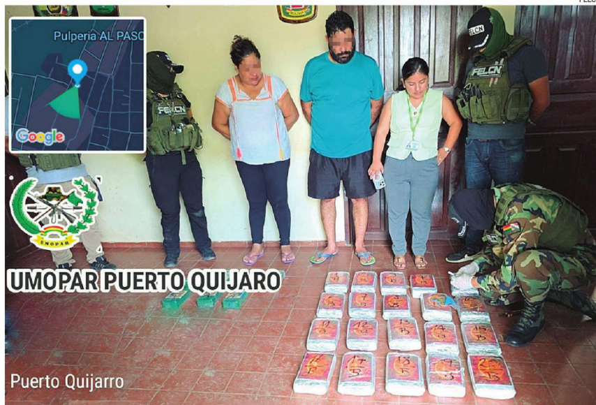
La titular del Concejo Municipal y su pareja aparecen junto a agentes de la Felcn y de la Fiscalía

En el inmueble se encontraba solo un hombre que estaba como