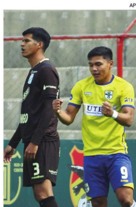
El equipo refinero cayó en su visita frente al plantel de ABB en Villa Ingenio.

Con este resultado, ABB suma 26 puntos y se mantiene en la antepenúltima posición. Oriente es décimo, con 33 puntos.