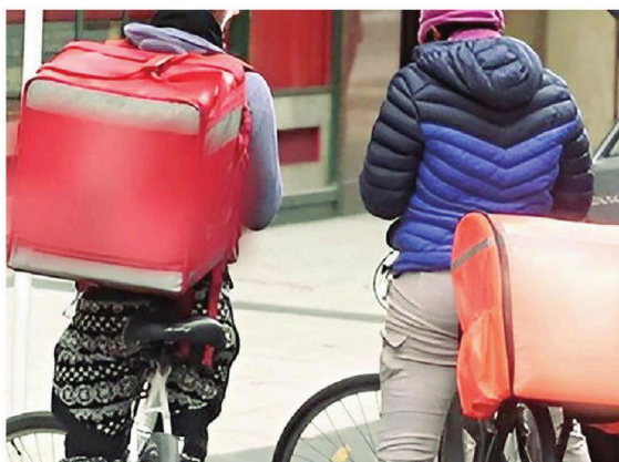
En la Urbanización Cotoca atacaron a dos repartidores 'delivery'

De acuerdo con el reporte policial, los jóvenes realizaban sus labores cuando fueron interceptados y baleados. Los disparos alarmaron a los vecinos, quienes