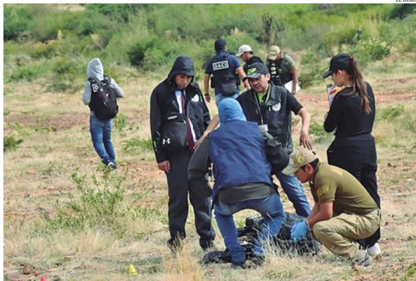
Tras los enfrentamientos, se realizaron inspecciones minuciosas en el lugar de los hechos

El ministro aclaró que los videos registrados muestran los antecedentes del caso. "Los delincuentes decían que había ido la Policía, que los habían agredido sin motivo y que ellos estaban pacíficamente. El abogado miente al afirmar que se habían vulnerado los derechos humanos y constitu-