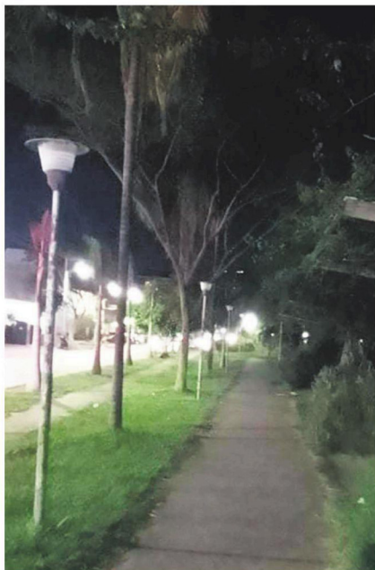
Varias luminarias están con los focos quemados y el pasto requiere de poda, dicen los vecinos