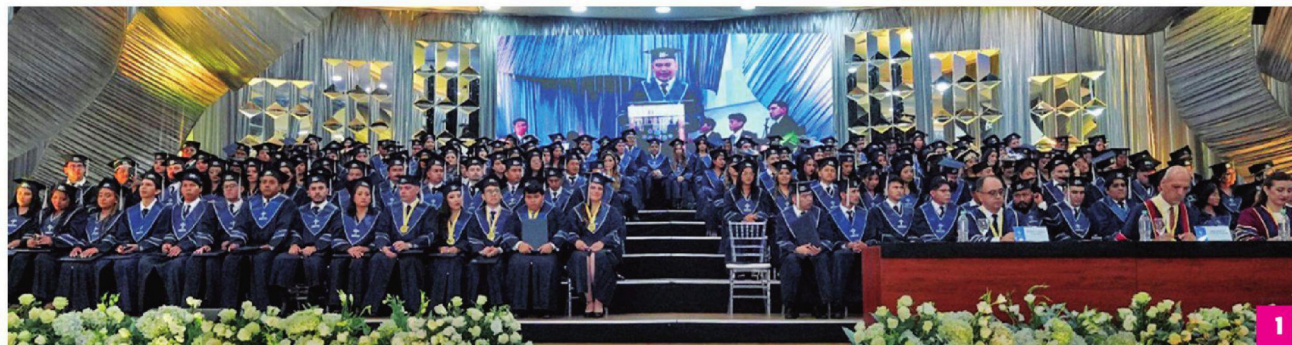
1. Los flamantes graduados en plena ceremonia