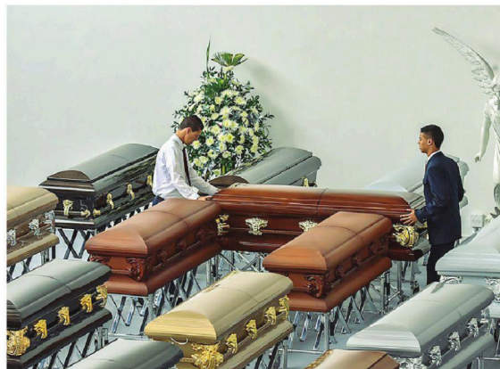
Ataúdes de las víctimas cuando llegaron a Brasil en medio del dolor