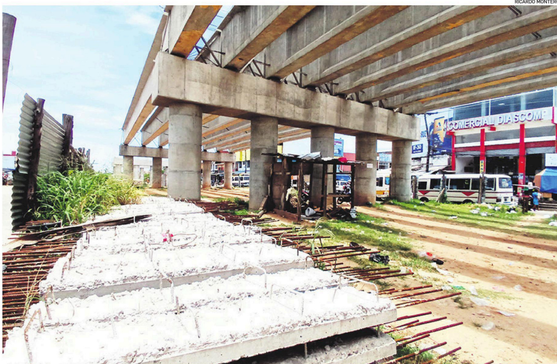
El viaducto del Plan Tres Mil es una de las obras que se encuentra paralizada. Lleva más de dos años sin mostrar avances

Fernández indicó que la Alcaldía se dedicará hasta fin de mes a utilizar cada ingreso en aliviar la situación de los distintos proveedores y contratistas. Precisó que la deuda municipal es variable, ya que diariamente se efectúan pagos a empresas constructoras, firmas de servicios y proveedores