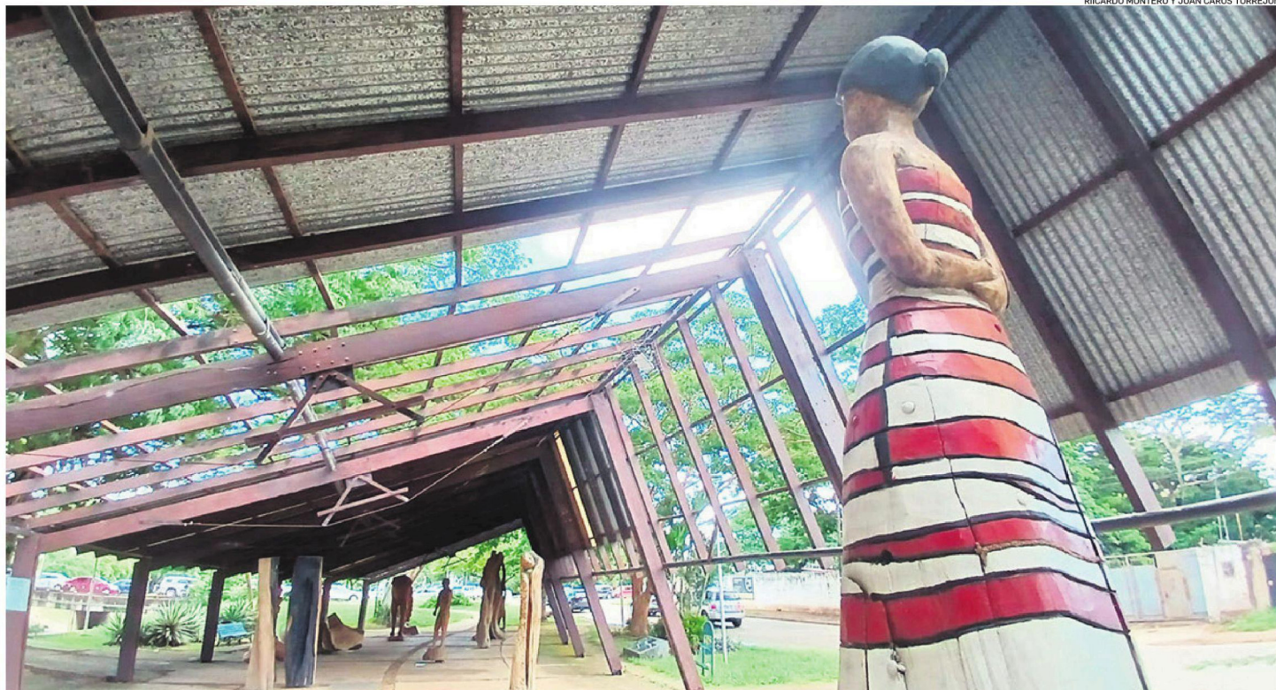
El Paseo del Bosque Certificado presenta serios daños en su infraestructura, ya que el techo tiene grandes huecos. Está ubicado por la avenida La Salle y tercer anillo