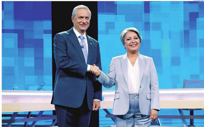
Los dos candidatos sostuvieron el martes un debate, que según los entendidos fue dominado por Kast

El presidente que salga de las urnas tendrá que lidiar a partir del 11 de marzo con un Legislativo sin fuerzas mayoritarias, donde el