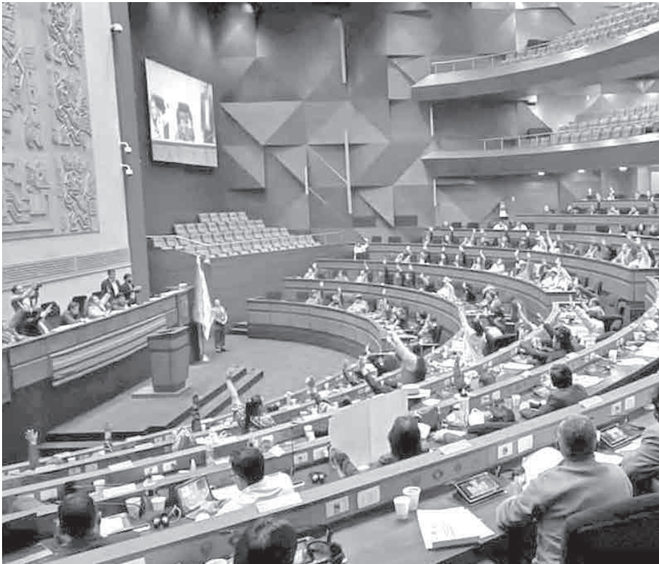
El pleno de la Cámara de Diputados.