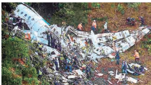
El accidente del avión del equipo de Chapecoense.

vegación Aérea y Aeropuertos Bolivianos), en el marco de una demanda civil que supera los $us 220 millones por el accidente del vuelo 2933 de LaMia, ocurrido en noviembre de 2016 que dejó 71 fallecidos. Hubo seis sobrevivientes,