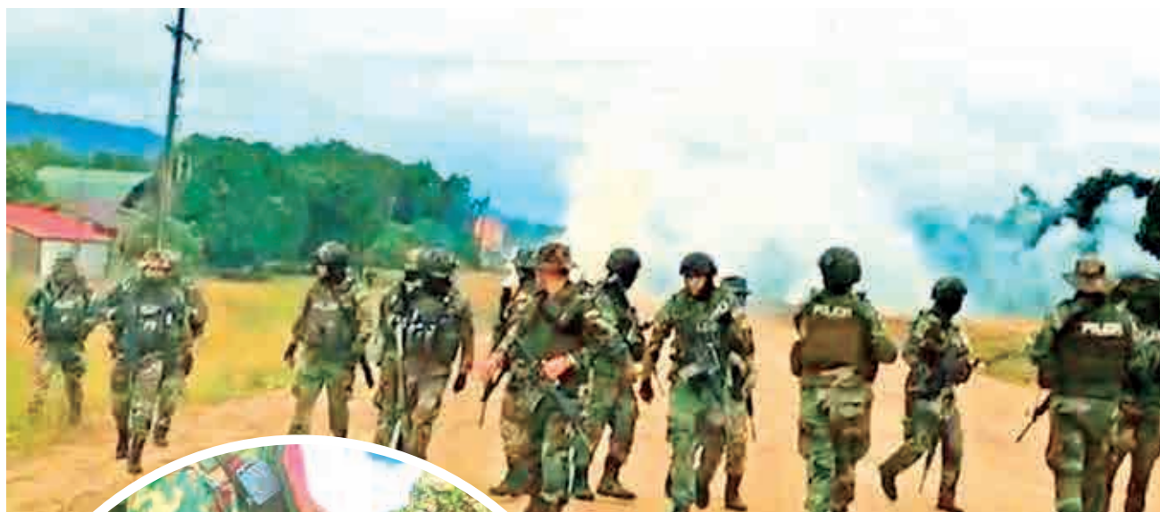
Policías emboscados en el Chapare.

Reacción. El zar antidroga Ernesto Justiniano aseveró que “no habrá zonas liberadas ni convivencia con el narcotráfico” a tiempo de denunciar que el ataque fue promovido por el crimen organizado