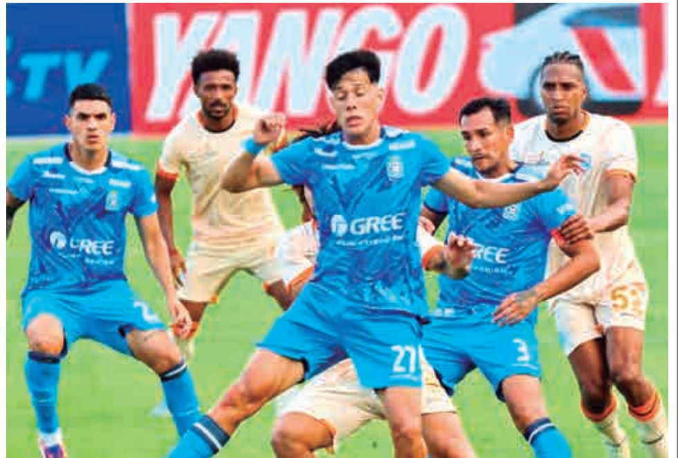
Jugadores de Aurora en un partido del torneo.