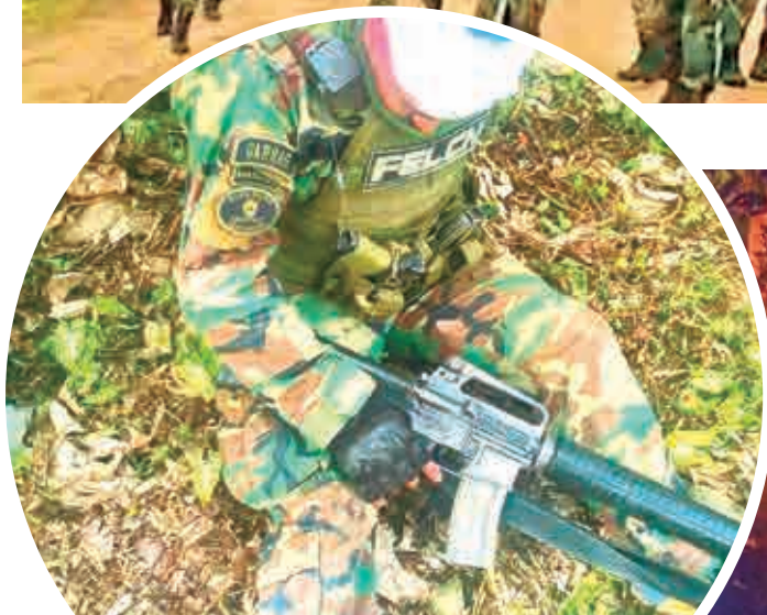
Un policía de Umopar herido en la emboscada.