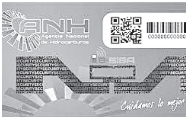
El uso de las tarjetas B-Sisa para carguío.

hay carnets de identidad que no le pertenecen a nadie, porque ni siquiera tienen una numeración general. Entonces son irregularidades que se pueden identificar a simple vista”, indicó.