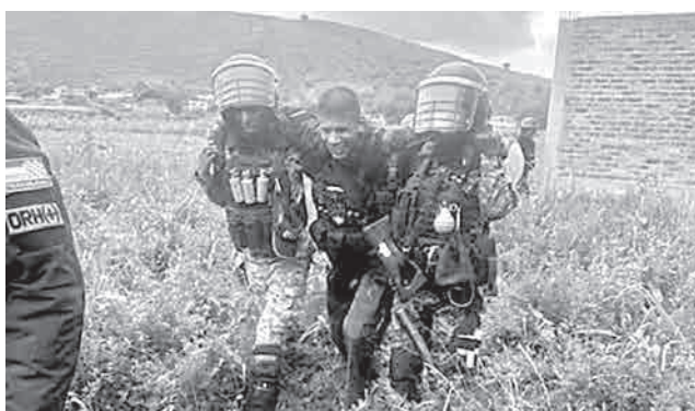
Policías auxilian al subteniente herido.

“totalmente acorralados” por al menos un centenar de comunarios durante el operativo. Asegura que, pese a los intentos de diálogo y al uso previo de agentes químicos que ya se habían agotado, fueron arrastrados colina abajo