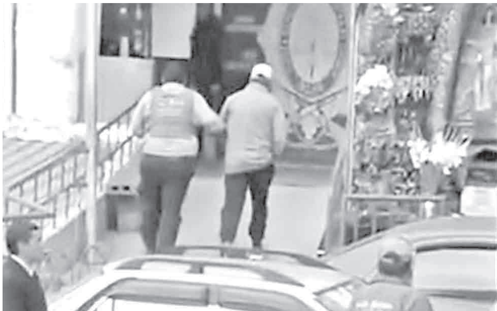
El expresidente Luis Arce fue detenido ayer. RRSS

El ministro precisó que en este caso concreto, el daño económico presumiblemente es de 360 millones de bolivianos, pero que hay otros “casos conexos” y que se estima que el “daño” total por malos manejos en el Fondioc “alcanzaría la suma de 700 millones de dólares o algo más”.