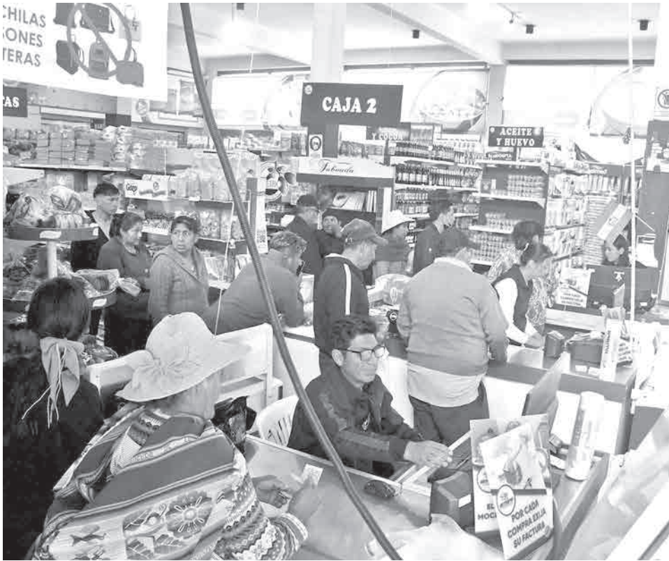
La atención en una de las sucursales de Emapa.