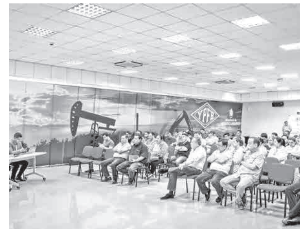
La reunión de YPFB con los cisterneros. RRSS

Los pagos permitirán además agilizar el suministro para atender la demanda en diferentes departamentos del país.