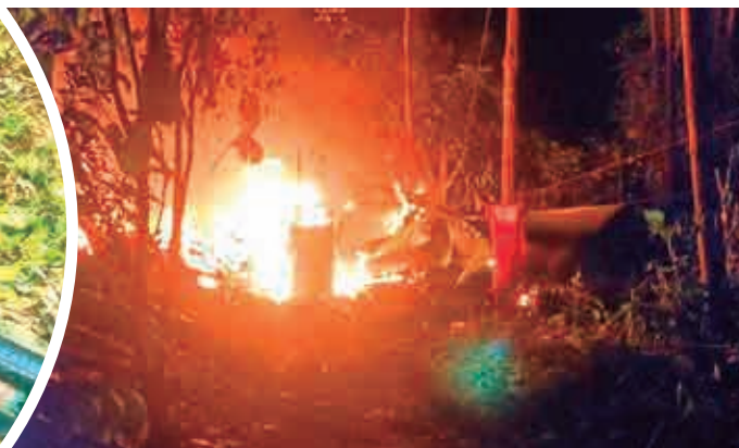
La destrucción de las fábricas móviles. FELCN

Según el jefe policial, los efectivos fueron retenidos por un lapso de dos horas en el sector la comunidad de Nueva Roma de Villa Tunari, donde fueron agredidos por los comunarios que fueron convocados por los narcos para recuperar los precursores y la liberación de los detenidos.