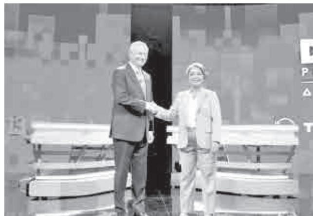
José Antonio Kast y Jeannette Jara.