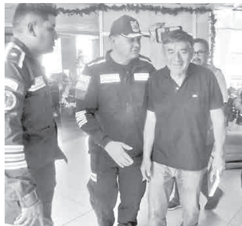
La reunión en la Gobernación. ROCHA