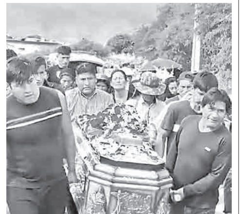
Las víctimas de Cotapachi. GCBAM