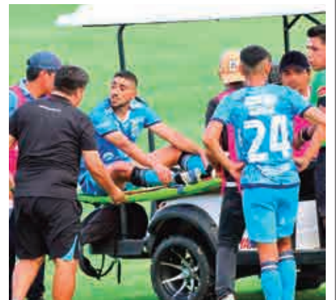
Auxilian a un jugador lesionado.