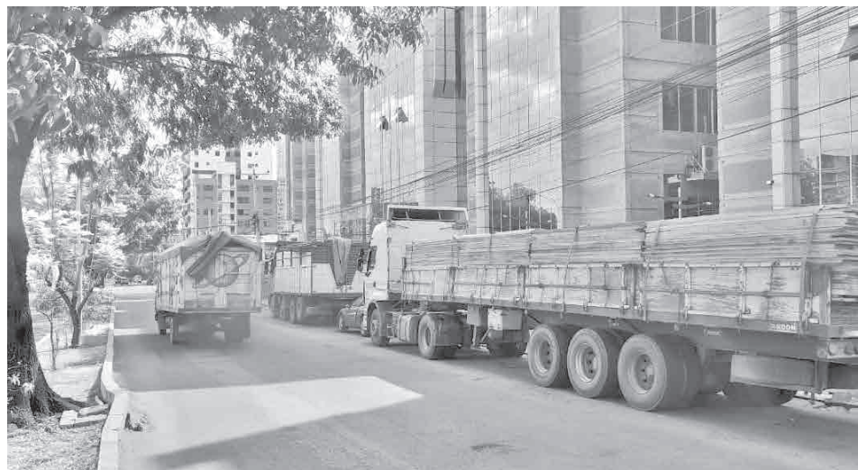
Las filas de motorizados por el suministro de combustible. DANIEL JAMES

“Ustedes han sufrido dos años de largas filas y ahora veo que el miércoles parece que ha habido un problema con el diésel ya me estaban haciendo bloqueo. Dos años han hecho filas, pero ahora