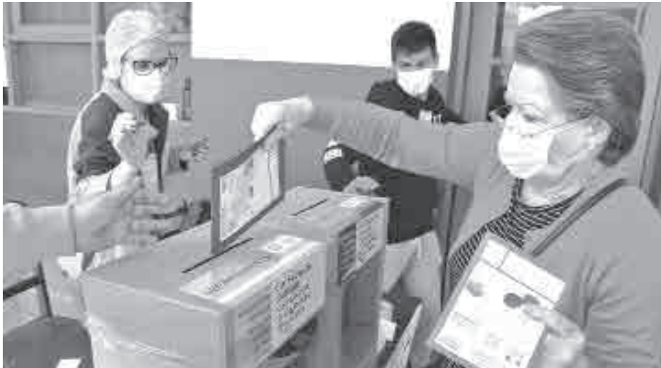
Ciudadanos en las elecciones subnacionales del 2021. CARLOS LÓPEZ

Ávila garantizó que los recursos económicos para el proceso electoral están asegurados, tanto para cerrar pendientes del proceso anterior como para financiar el empadronamiento en curso. Asimismo, informó que el TSE ya trabaja en la incorporación de recomendaciones de la Unión Europea, entre las que se incluyen mejoras en la