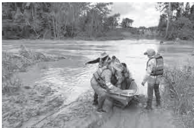
Crecida de rios en Santa Cruz. GAMY

Según el Senamhi, las lluvias podrían provocar ascensos repentinos y progresivos en ríos de cuencas críticas como Yapacaní, Abuná, San