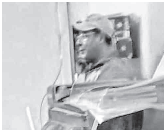
Arce en la Felcc de La Paz.

El mandamiento de aprehensión emitido por la Fiscalía lo instruye por la presunta