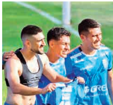
Un festejo del Equipo del Pueblo. EL DEBER