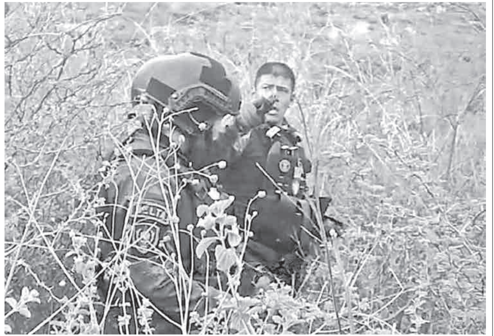
El policía identificado con el arma en la emboscada en Cotapachi.