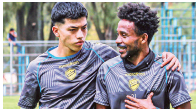
El entrenamiento del Equipo del Pueblo. CLUB AURORA

Always Ready con un empate se consagrará campeón del “todos contra todos” y podrá festejar con sus aficionados la conquista del título.