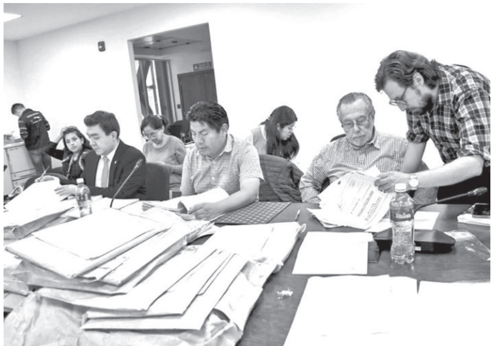
Comisión revisa documentos de postuantes, ayer.