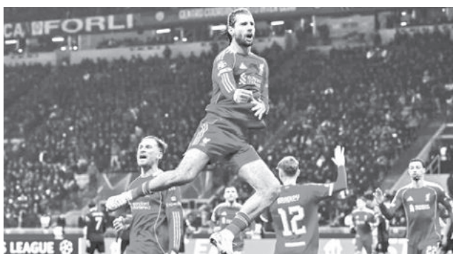
Liverpool vence al Inter de Milán en San Siro. LIVERPOOL

victoria para descomprimir el caldeado momento y despejar las malas energías, y vaya si lo han logrado. En un ambiente nada sencillo como lo es el del Giuseppe Meazza, vencieron por la mínima al 'Nerazzurro' y respiraron profundo.