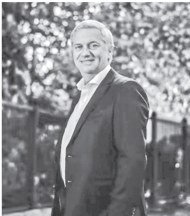
El candidato republicano José Antonio Kast. LA TERCERA

La expectativa de un triunfo del republicano ha impulsado al mercado desde abril. El premio —o spread— que los inversionistas exigen para mantener deuda chilena frente a la estadounidense cayó en octubre a su nivel más bajo en 18 años. Pero desde la primera vuelta del 16 de noviembre, el diferencial comenzó a ampliarse nuevamente, luego de que la derecha no lograra una mayoría en