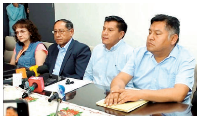
La reunión de alcaldes en la Gobernación, ayer.

tigaciones por la muerte de dos personas y más de una decena de heridos durante los enfrentamientos en el ingreso al botadero de Cotapachi. En el encuentro participaron los alcaldes de ambos municipios, además de téc-