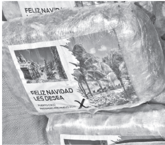
Los paquetes con el mensaje navideño.

Decomiso. La Fuerza Especial de Lucha Contra el Narcotráfico (Felcn) decomisó dos toneladas de sustancias controladas envueltas en bolsas de yute con 2.270 paquetes tipo ladrillo