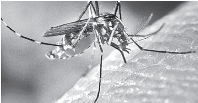
El mosquito que transmite la chikungunya. RRSS

Alcance. En la última semana se registraron 100 casos en los municipios de Villa Tunari, Entre Ríos y Puerto Villarroel