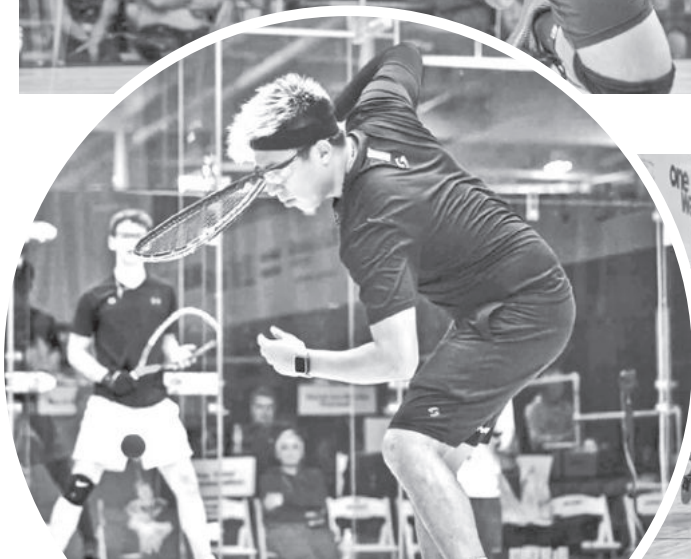
Una jugada del campeón.