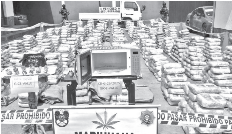
La marihuana incautada en el camino a Misicuni.