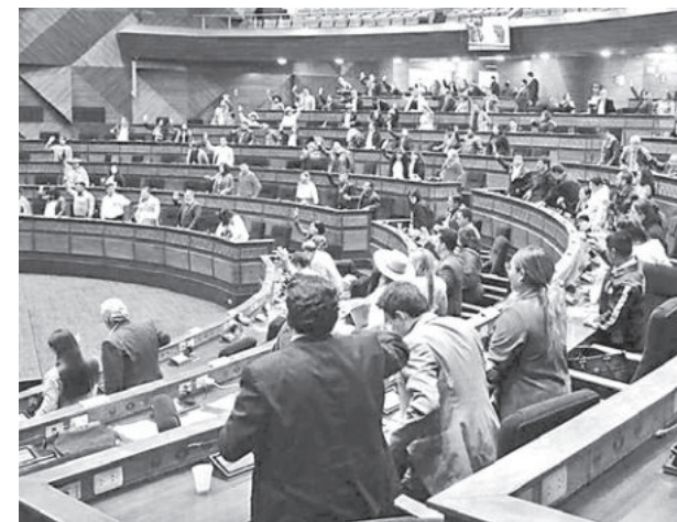
La Asamblea Legislativa Plurinacional. CAMARA DIPUTADOS

Ormachea observó también que, en una situación de crisis anterior como de mediados de los ochenta, Víctor Paz Estenssoro ya había emitido el Decreto 21060 a estas alturas del Gobierno.