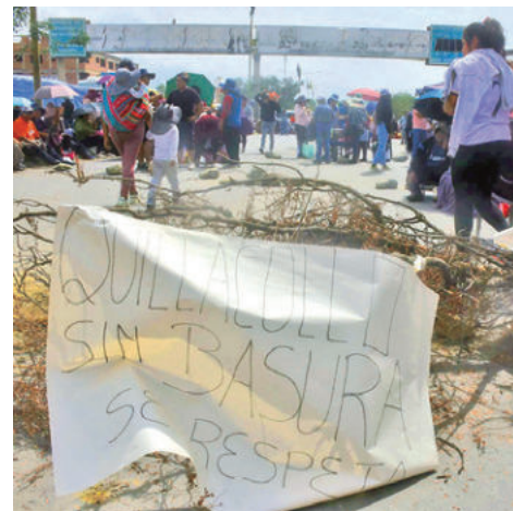
El bloque en Quillacollo, ayer. JOSE ROCHA