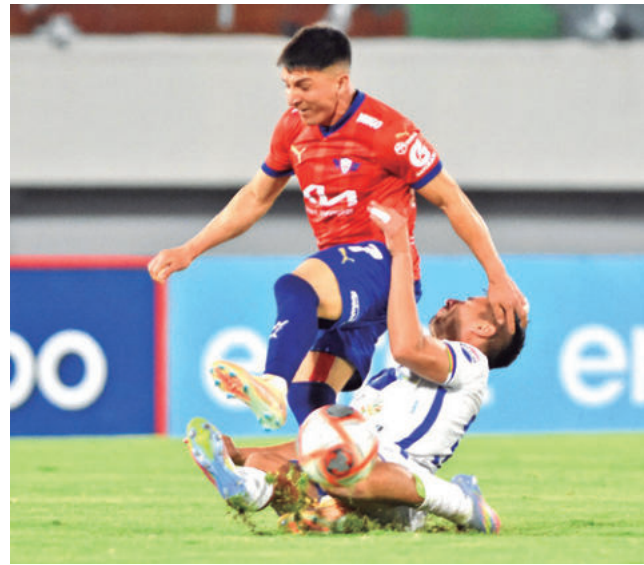
El Rojo empata ante GV San José.

Empate. El cuadro Aviador no pudo aprovechar la diferencia numérica y logró un magro empate que le obliga a jugar con San Juan el partido por el descenso indirecto