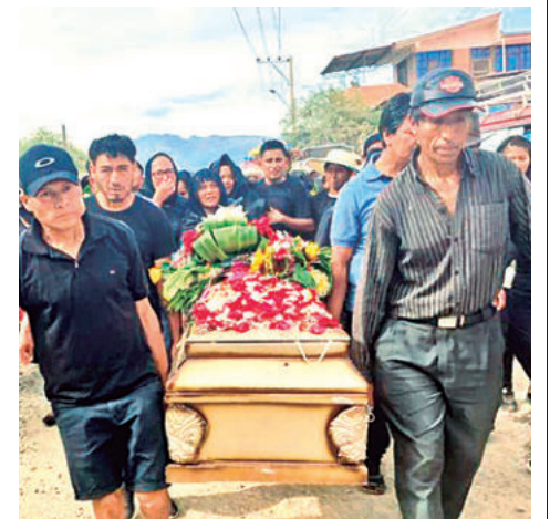
El entierro de las víctimas, ayer.