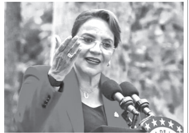
Xiomara Castro, presidenta de Honduras.

“Hay que mirar más allá de la coyuntura electoral”, sostuvo Ariel Nachari, estratega de SURA Investments. “Estructuralmente, estamos recomendando invertir en renta fija de mediano plazo —entre 3 y 5 años—, lo que permitirá capturar un premio relevante respecto de las tasas más cortas”.