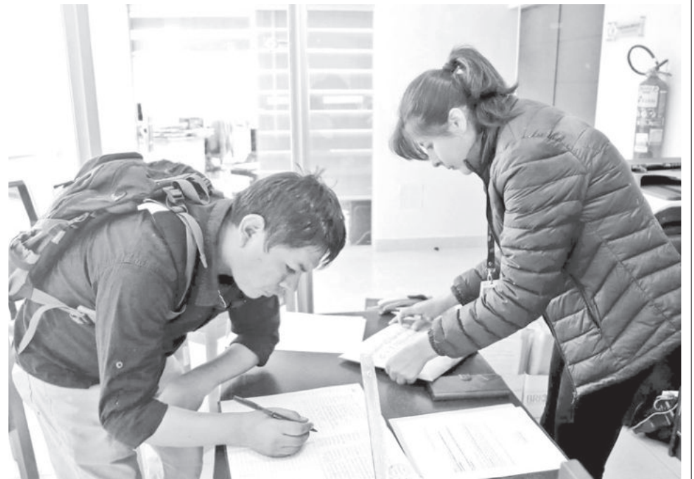
Presentan documentos para vocales del TED.