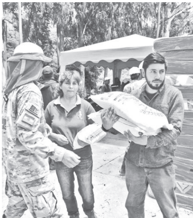
Entregan ayuda en Achira, ayer. GAMS

En tanto, en Sucre, las lluvias también generan preocupación. Hasta el 8 de diciembre se registraron 32 milímetros por metro cuadrado, un tercio de la media histórica de 105 mm/m² para el mes. Las precipitaciones del último fin de semana dejaron nueve casos de emergencia, mientras que el Senamhi recomendó tomar precauciones ante pronósticos de aguaceros hasta este jueves, algunos con tormentas eléctricas. El responsable de la Dirección Municipal de Gestión de