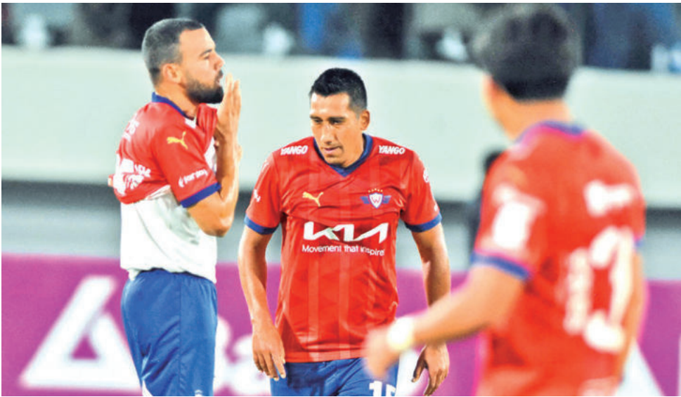
El partido Wilstermann y GV San José en el Capriles.