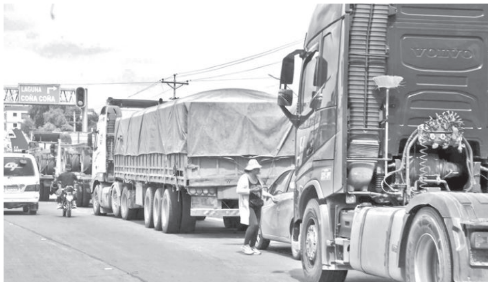
Continúan las filas por combustible en los surtidores. HERNAN ANDIA

La subvención ha generado polémica en el país, puesto