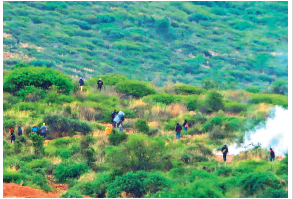
El momento de la emboscada a los policías en Cotapachi.