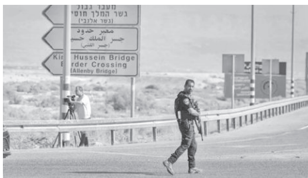
El cruce de Allenby, entre Jordania y Cisjordania. ISRAEL NOTICIAS

“A partir de mañana (miércoles) se autorizará el traslado de mercancías y ayuda desde Jordania hacia la zona de Judea y Samaria y la Franja de Gaza a través del paso de Allenby”, declaró un funcionario israelí en un comunicado, usando