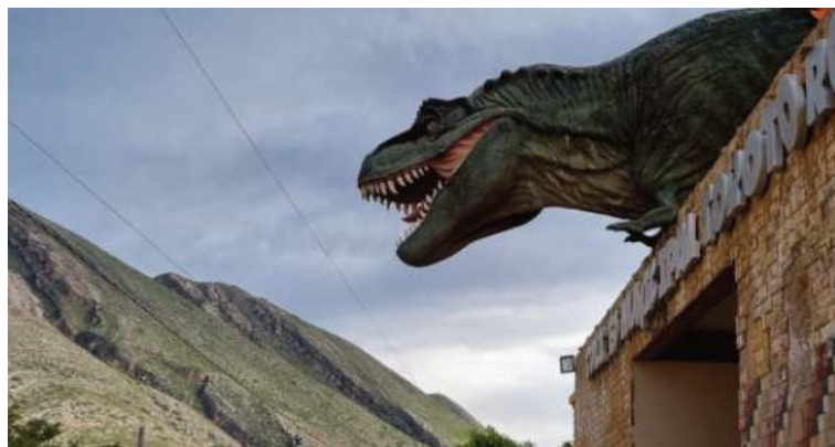
IDENTIDAD. Torotoro muestra a dinosaurios en sus edificios y obras.

el portal argentino Infobae informó del hallazgo de 16.600 huellas, además de 1.378 rastros de nado de dinosaurios, en la comunidad de Carreras Pampa, también Torotoro.