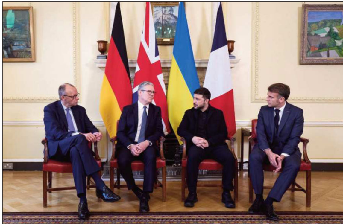
LONDRES. La reunión de Zelenski con Merz, Starmer y Macron para resolver el conflicto en Ucrania.

Un alto funcionario indicó a AFP que la cuestión territorial sigue siendo "la más problemática" para poner fin a la guerra, que empezó hace casi cuatro años