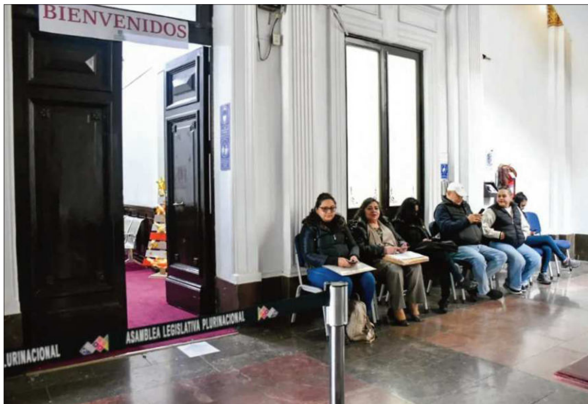
PLAZO. A las 18.00 de ayer se cerró la recepción de postulaciones en el edificio de la Asamblea.

A las 18.00 de ayer se cerró la recepción de postulaciones en el antiguo edificio de la Asamblea Legislativa Plurinacional. Sin embargo, según los miembros de la Comisión Mixta, aún había alre-