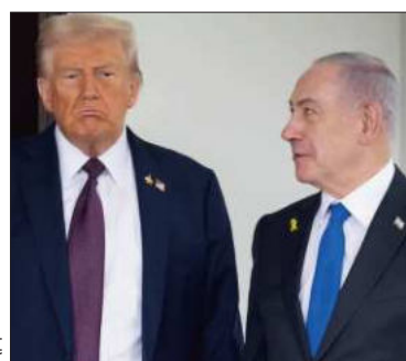
Ambos líderes en una reunión.

El acuerdo se enfrenta a un momento crucial ante las denuncias de Hamás