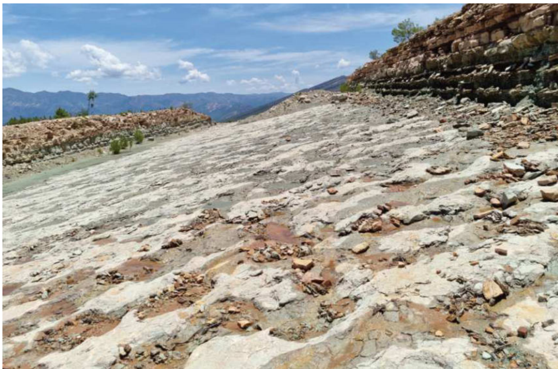
EVIDENCIA. Las huellas esparcidas en una especie de avenida inclinada y de un largo de 10 metros.

A partir del río hacia Torotoro —que era un camino de ripio y unos 15 kilómetros de empedrado— no solo