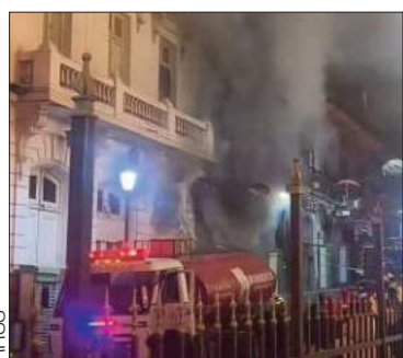
El incendio en la calle Sagárnaga.

Al menos 15 galerías con mercadería fueron consumidas por el fuego