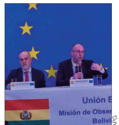
La Misión Electoral de la UE.

El documento contiene 19 recomendaciones dirigidas al Tribunal Supremo Electoral (TSE), la Asamblea Legislativa, el Ejecutivo, organizaciones políticas, la sociedad civil y medios de comunicación.