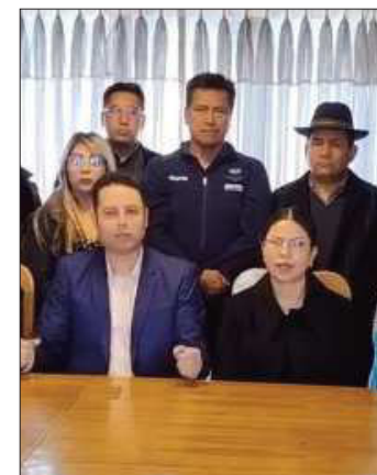
El Vicepresidente y su bancada.

El presidente nato de la Asamblea Legislativa mostró particular recelo por el crédito de $us 550 millones con el Banco de Desarrollo de América Latina y el Caribe-CAF, el cual es de libre disponibilidad. Lara considera que los legisladores deben analizar la capacidad de endeudamiento del país antes de aprobar el proyecto.