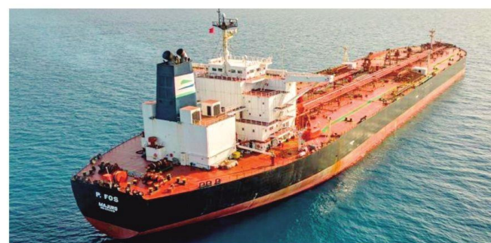
El buque Kairos fue atacado por Ucrania en el estrecho de Bósforo

"Durante las primeras horas, la tripulación no contactó a las autoridades búlgaras. Sin embargo, más tarde comenzó a responder, indicando que había 10 personas a bordo y que deseaban ser evacuados", explicó Zlatanov.