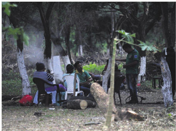
Los toma tierras generan incertidumbre en los predios privados