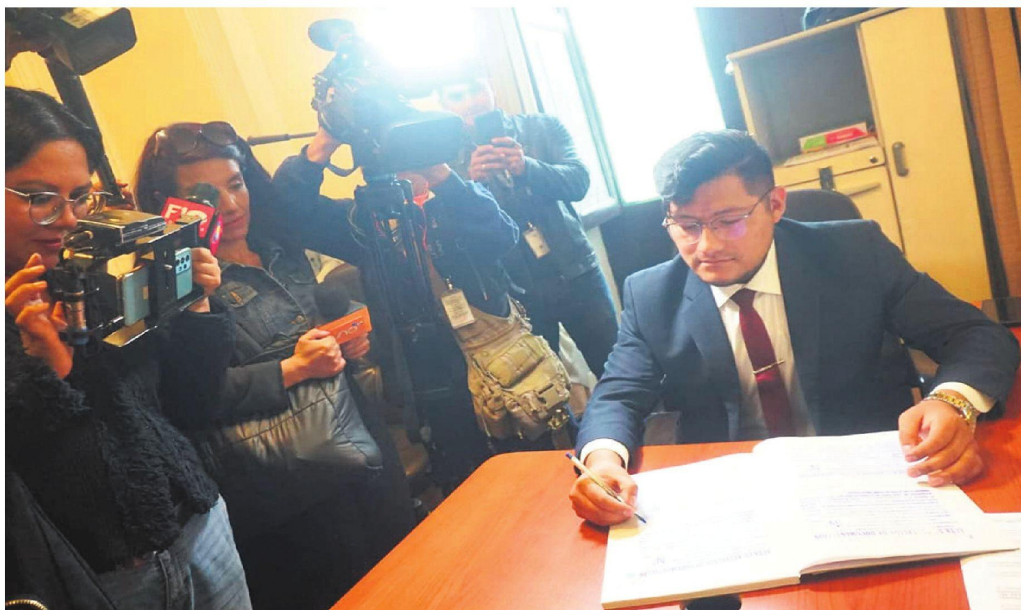
La Comisión de Constitución del Parlamento continúa recibiendo la documentación de postulantes a las vocalías del TSE.

El plazo final de recepción de documentos finaliza el lunes a las 18:00