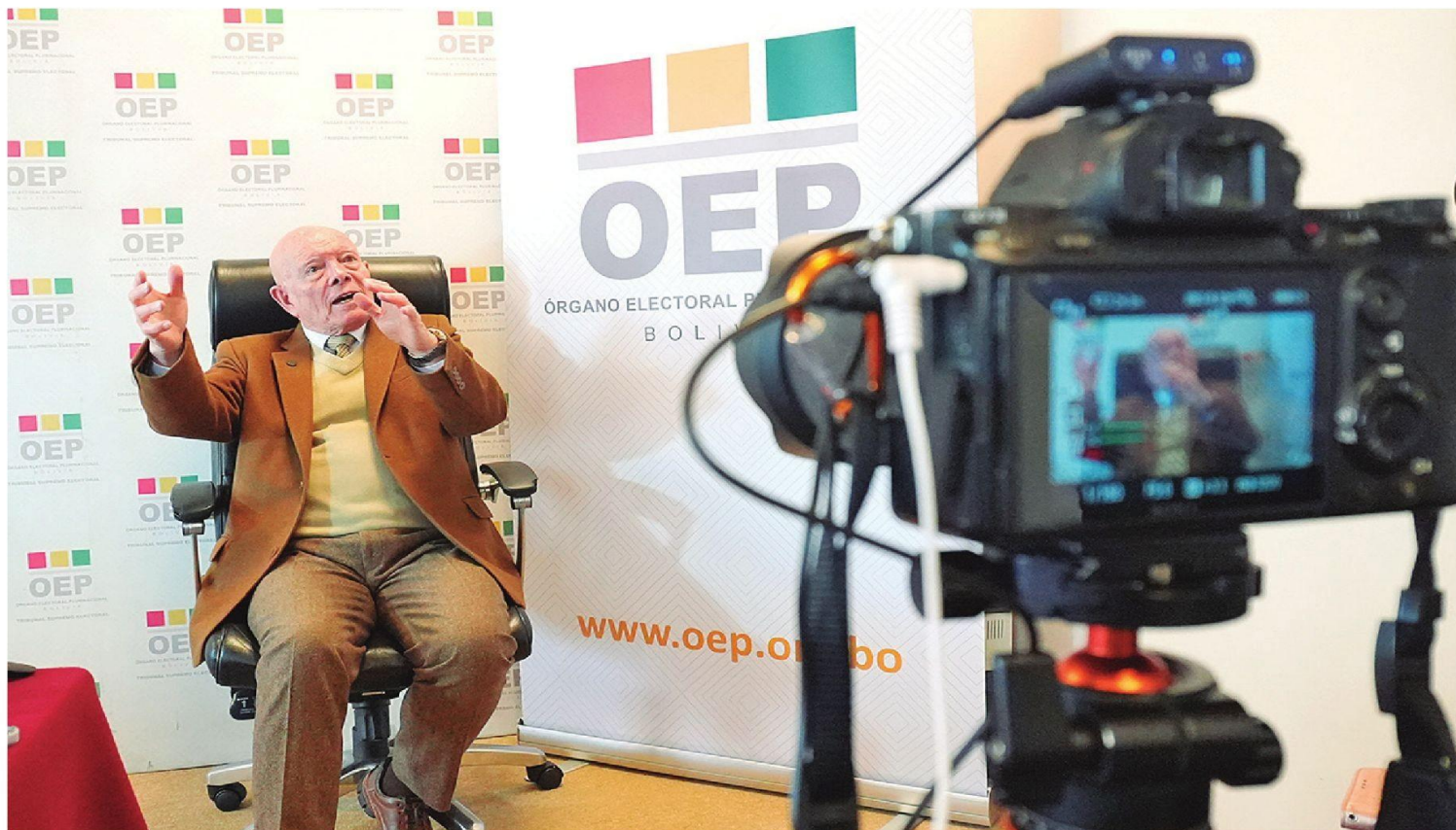
Discreto en su conducta. Estuvo cuatro años al mando del TSE y fue el arquitecto de los consensos internos en la Sala Plena