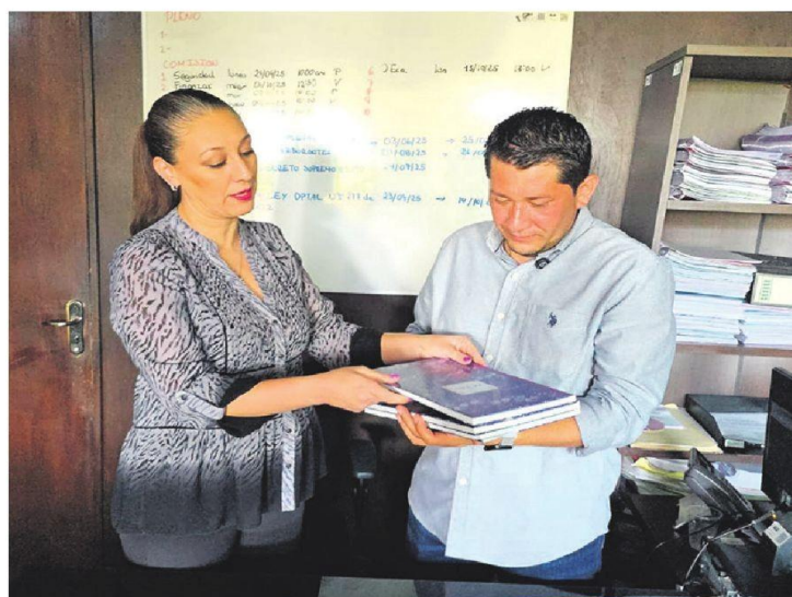
En la ALD cruceña ya reciben los documentos de registro.