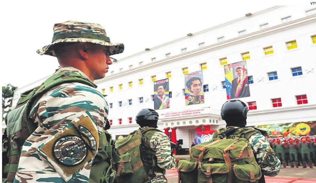
En la ciudad de Caracas se realizó la juramentación del Contingente Septiembre 2025