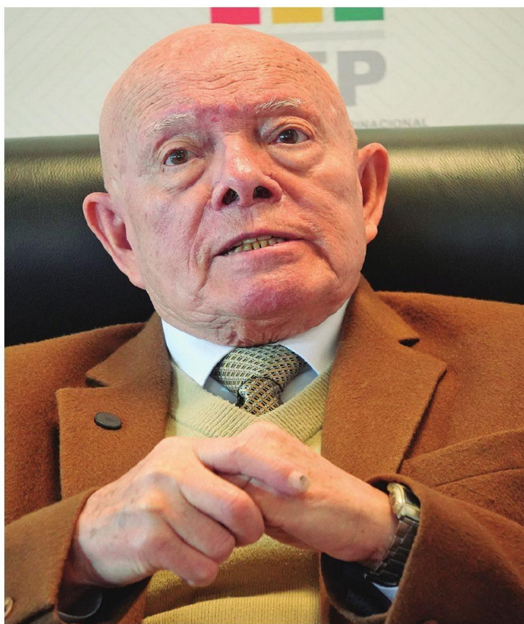
Llega el tiempo de volver a casa y acompañar a su esposa

— ¿Cuántos hijos tiene? ¿Qué le dice su esposa?