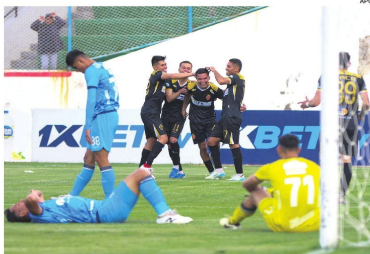
Jugadores de Bloomington sufrieron la peor goleada de este 2025, hasta el momento