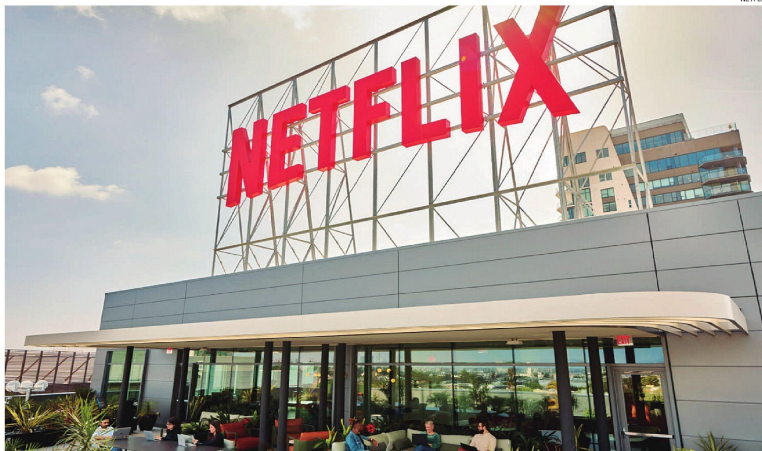
Netflix es la mayor plataforma de 'streaming' de pago, con títulos clave en la cultura contemporánea, como 'Squid Game' o 'Stranger Things'.