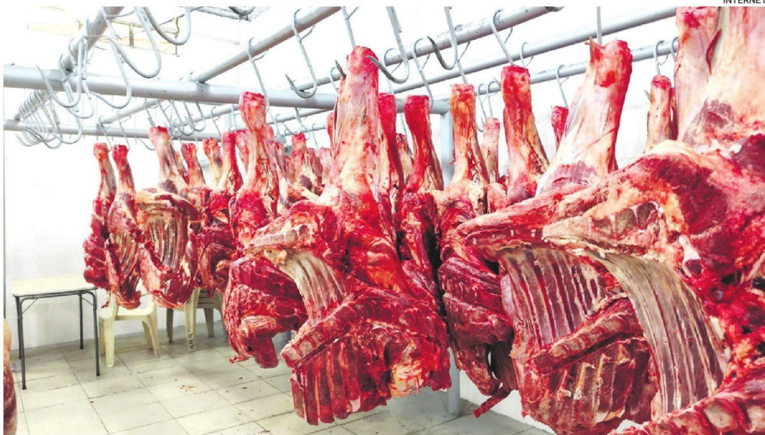
Se abrió el mercado egipcio y la próxima meta es Chile

6 octubre 2025. Órdenes de aprehensión por avasallamientos en Guarayos, San Julián y Cuatro Cañadas. Autoridades identificaron una "estructura móvil tipo nómada" culpable de múltiples tomas ilegales — al menos 11 personas con mandamientos de captura. Último trimestre de 2025. Avasallamiento en predio El Encanto (Guarayos). A pesar de desalojos judiciales anteriores, invasores retornaron al predio, paralizando cosechas y exigiendo reconocimiento de "inversiones".