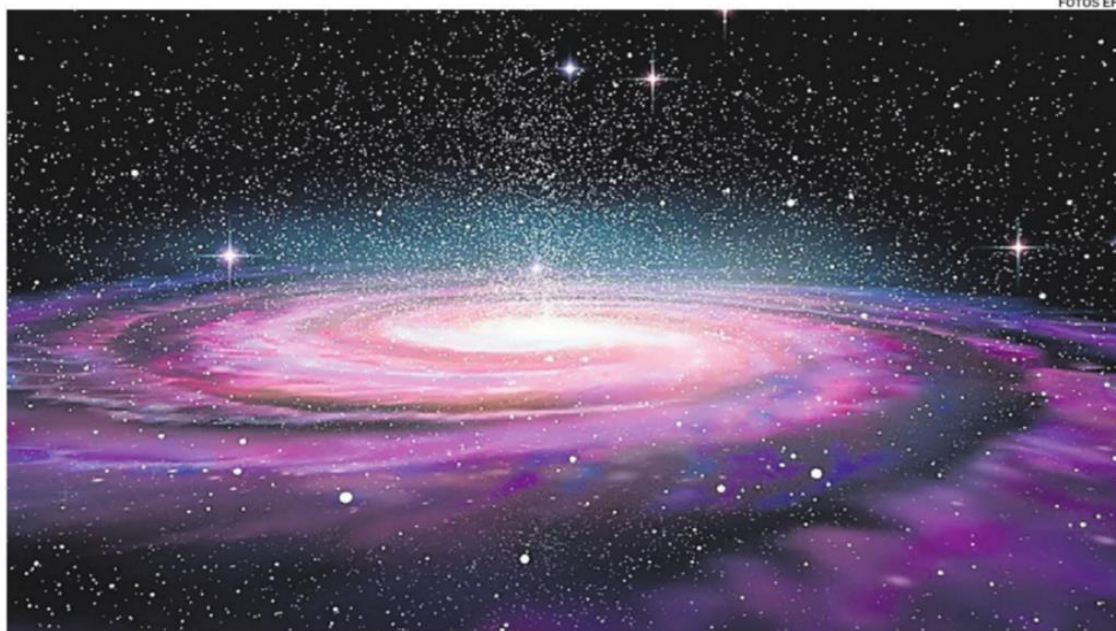
Los filamentos cósmicos son estructuras creadas por formaciones de galaxias y materia oscura

De forma sorprendente, muchas de esas galaxias parecen girar en la misma dirección que el propio filamento, mucho más