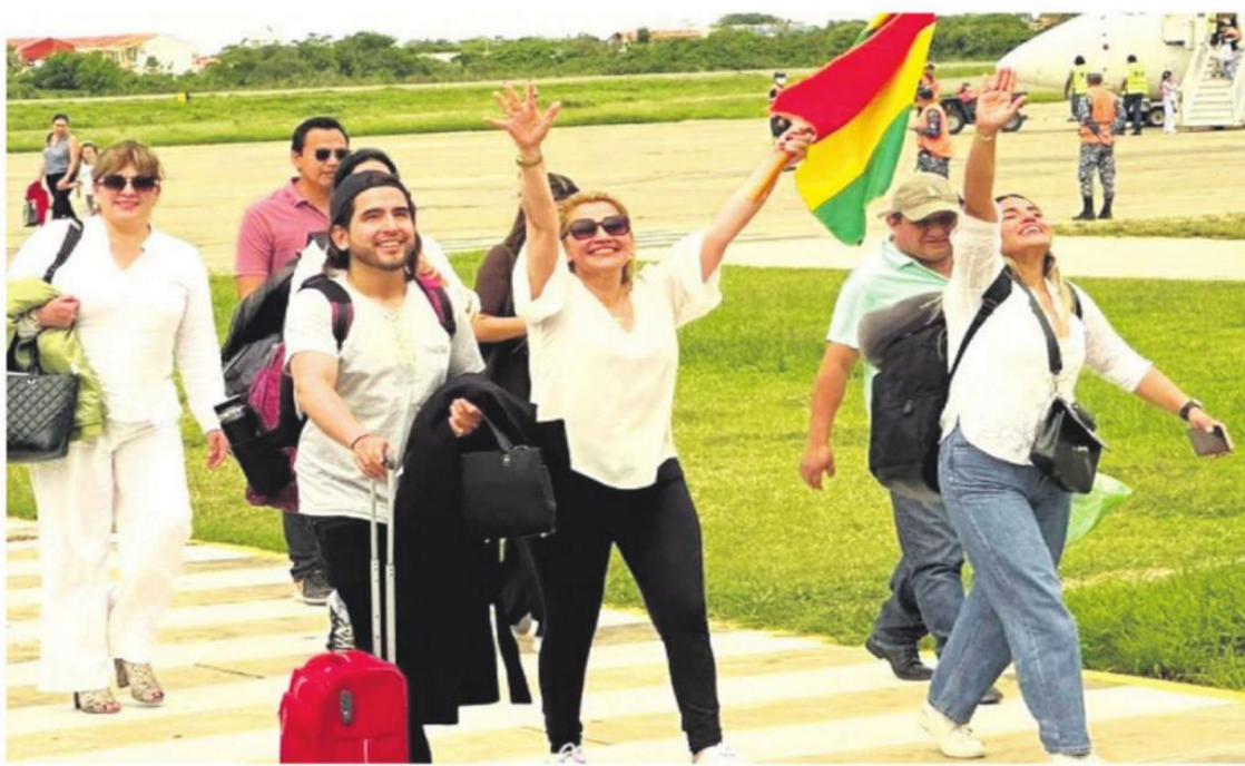
Flameando la tricolor, descendió del avión en su retorno a Trinidad, acompañada de familiares y amigos

donde me toque. No necesariamente como política activa o desde un cargo público.