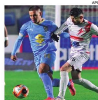
El club paceño le ganó al potosino