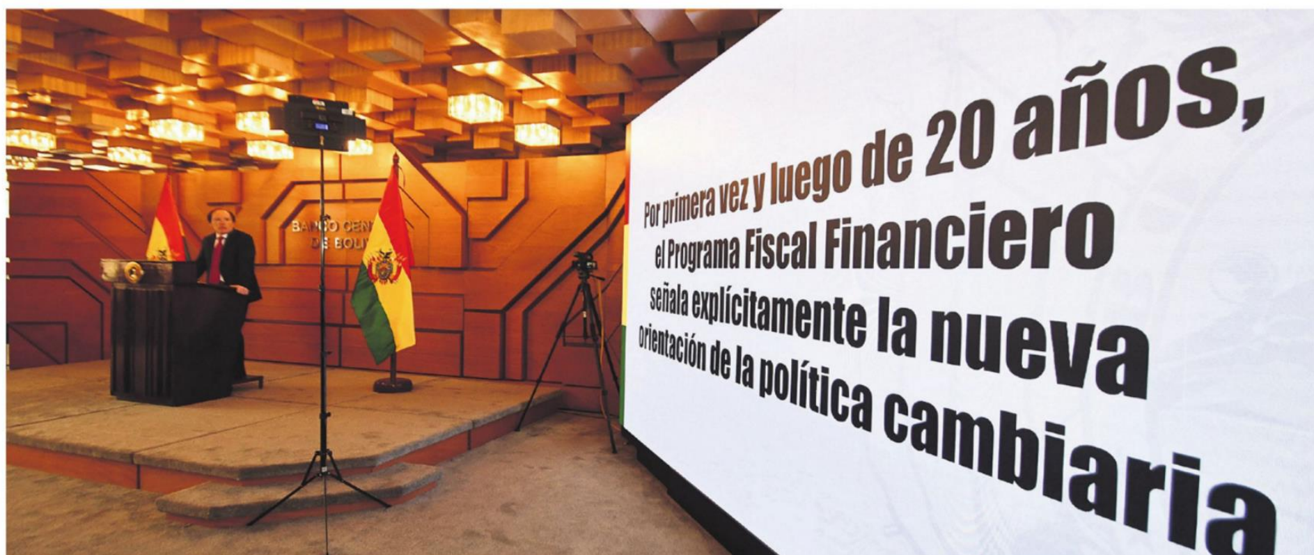
La delicada situación económica del país ha sido y es objeto de profundos análisis por parte de la nueva administración nacional