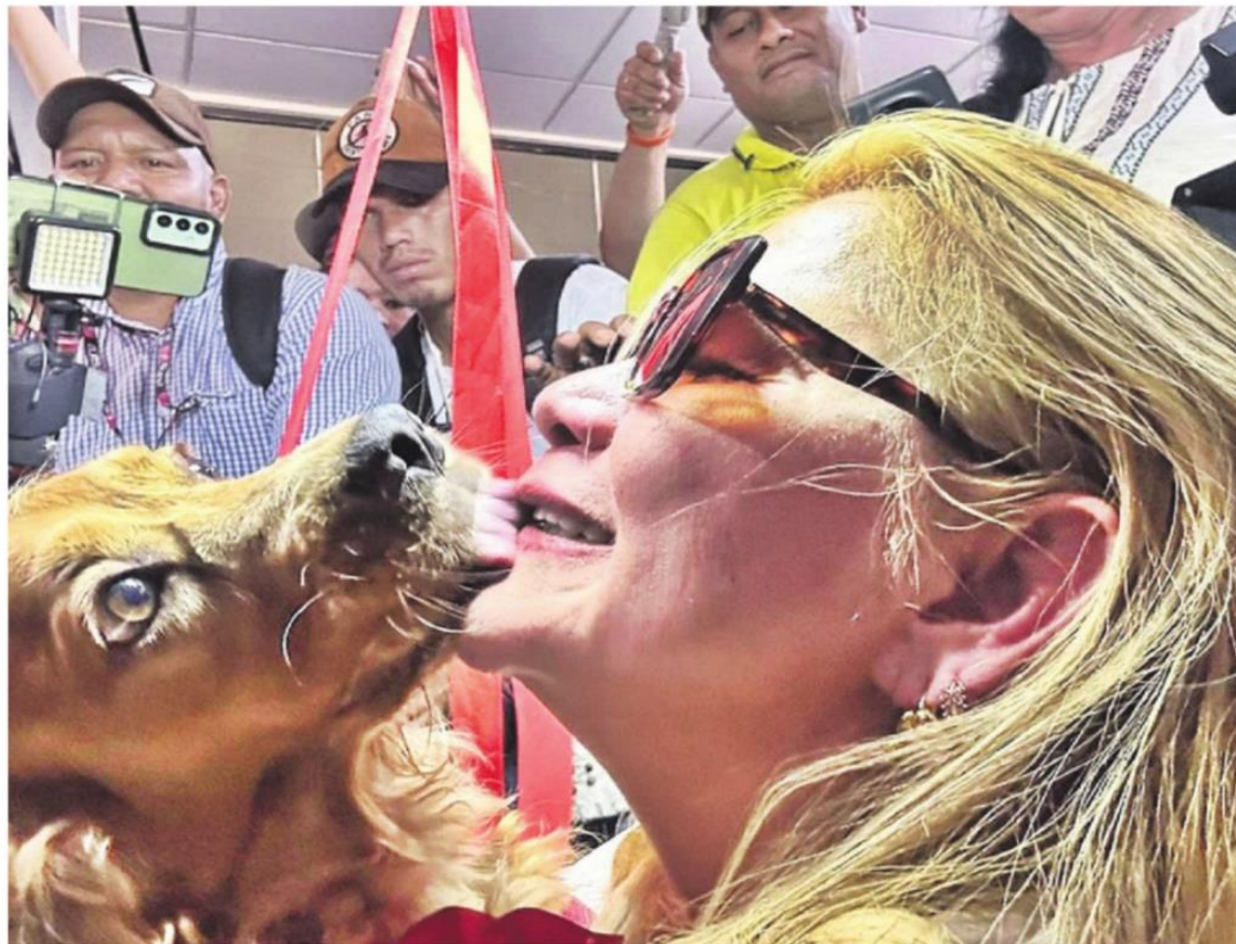
El emotivo reencuentro de la expresidenta con su mascota después de casi cuatro años

He manifestado muchas veces que voy a servir a mi país desde