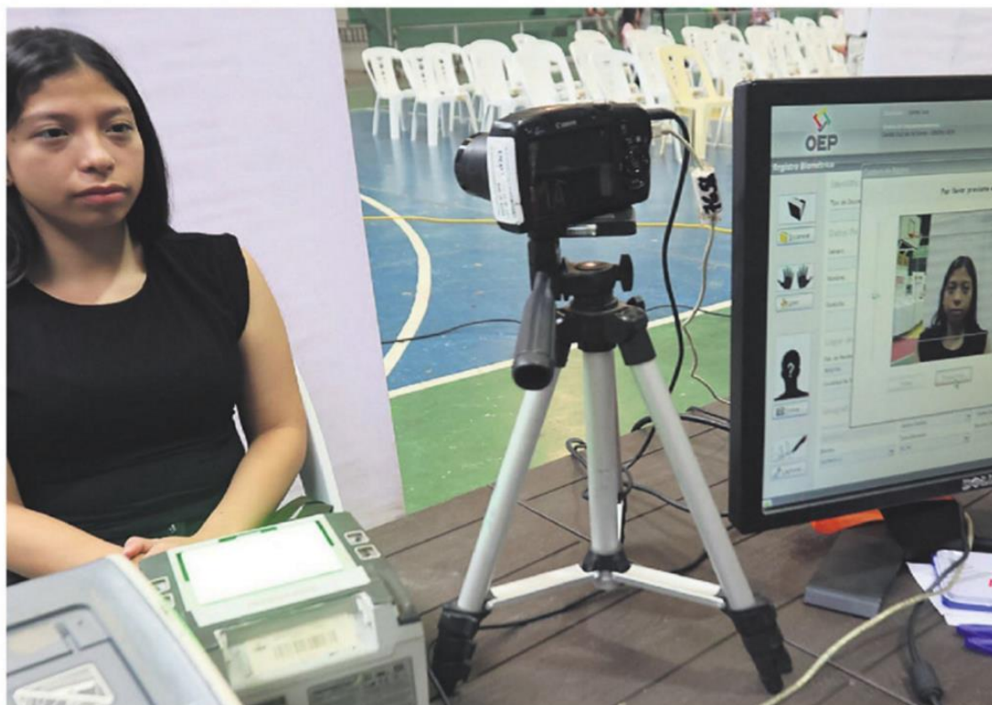
El primer día del registro masivo atrajo un número considerable de nuevos electores a los centros