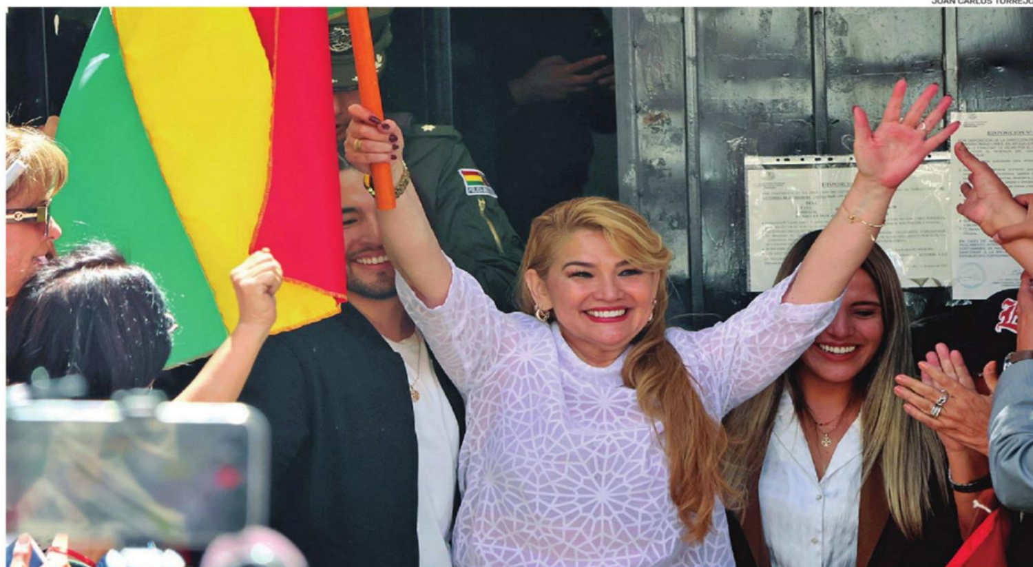
El 6 de noviembre, la expresidenta Jeanine Áñez salió de prisión. Estuvo detenida 1.701 días en una cárcel de La Paz

ENTREVISTA / JEANINE ÁÑEZ CHÁVEZ EXPRESIDENTA DE BOLIVIA