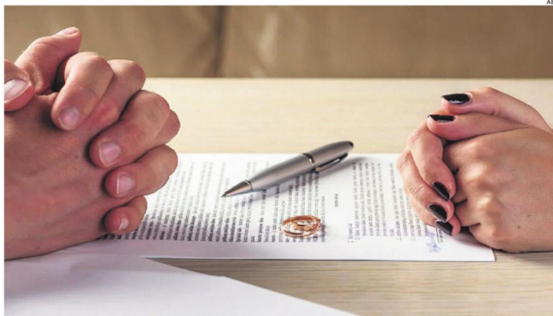
Los trámites de divorcio son sencillos, pero muchas veces se complican por la disputa de bienes

Con respecto a los matrimonios, en el mismo periodo hubo 41.744 casamientos en el país, siendo Santa Cruz, con 12.173, el departamento con más casa-