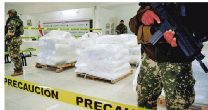
Efectivos antidroga custodian el cargamento de marihuana

El operativo fue realizado por fuerzas policiales y militares. La droga tenía como destino Brasil