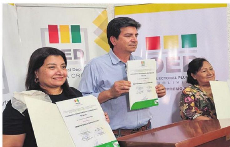
Los tres assembleístas que recibieron credenciales