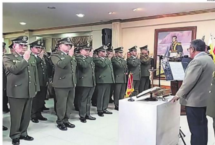
El juramento de los nuevos comandantes departamentales

El acto oficial se desarrolló en el Comando General de la Policía, donde los nuevos mandos juraron cumplir con la misión de proteger y garantizar el orden público.