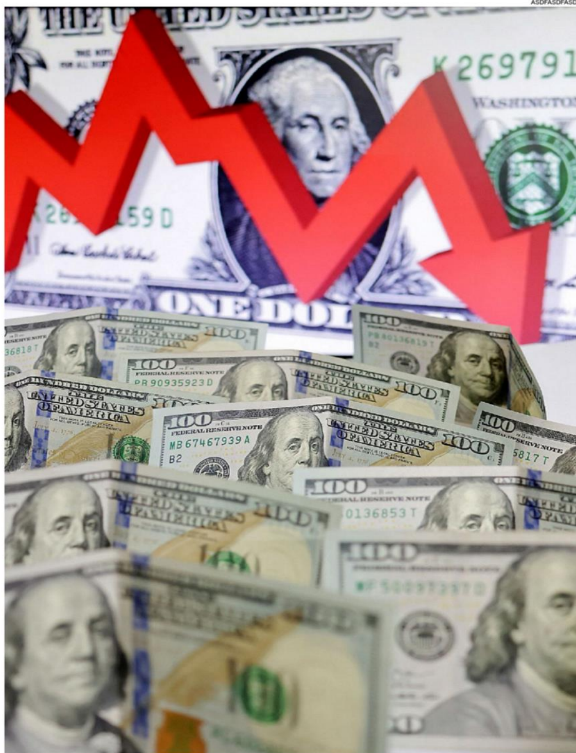
El anterior gobierno proyectaba una inflación del 10%. La realidad es que se cierra el año con el 21-22%

alta frecuencia mejora la eficiencia del mercado y facilita la toma de decisiones informadas por parte de los agentes económicos", destacó Aranda.