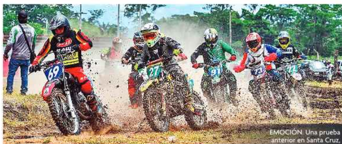
EMOCIÓN. Una prueba anterior en Santa Cruz.

Por su parte Cruz, aseveró que la sede de este campeonato internacional ya está definida y se realizará en Santa Cruz.