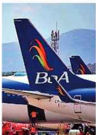
DATO. La gerencia de la aerolínea anuncia mejoras.

El ejecutivo reconoció que se genera un perjuicio para el usuario cuando ocurren eventualidades, por lo que agradeció por la paciencia, aunque aseguró que pronto "las mejoras serán visibles".