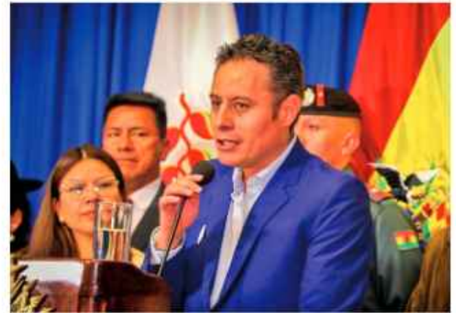
AUTORIDAD. El vicepresidente, Edmand Lara, en un acto.

En las redes sociales, internautas dividieron criterios a favor y en contra del anuncio formulado por Edmand Lara.