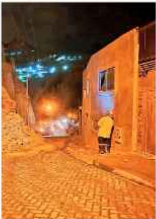
LUGAR. El material cayó desde 30 metros.

El volumen de material desprendido alcanzó los 150 metros cúbicos, según dio a conocer el funcionario municipal.