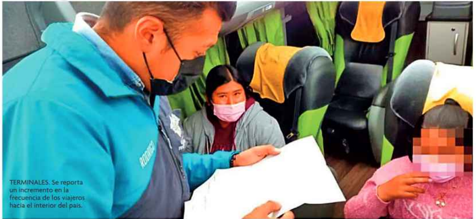
TERMINALES. Se reporta un incremento en la frecuencia de los viajeros hacia el interior del país.

Niños y adolescentes deben viajar acompañados por un adulto o tener las autorizaciones.