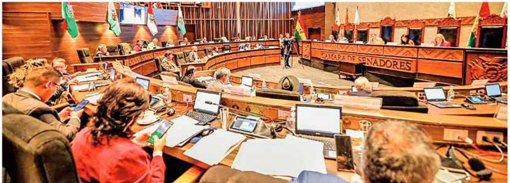
SESIÓN. La Cámara de Senadores dio luz verde al proyecto de ley para designar a nuevas autoridades del Órgano Electoral Plurinacional.

La Asamblea sesionará hoy desde las 17:00 para elaborar el proyecto de convocatoria a la sociedad.