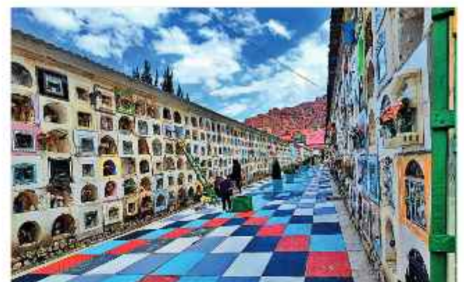
CEMENTERIO. Una de las calles de la necrópolis paceña.

La autoridad sugirió tomar los servicios de las funerarias para las cremaciones y aclaró sobre la posibilidad de exhumar cuerpos para cremarlos, aunque la normativa nacional exige esperar al menos cinco años antes de reabrir legalmente una sepultura.