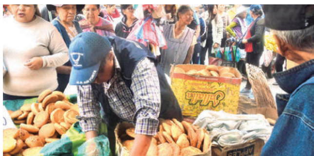
La venta de pan en los mercados de la ciudad. HERNAN ANDIA

Consumidores. La población acude a los puestos que ofrecen el pan de batalla a menor precio y evitan comprar a Bs 0,80