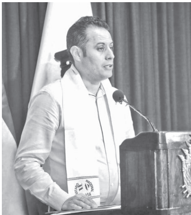
El vicepresidente Edmand Lara da un discurso.

también denunciará ante la Fiscalía al exministro de Gobierno Eduardo del Castillo, quien fue candidato a la Presidencia por el Movimiento al Socialismo (MAS), al exvi-