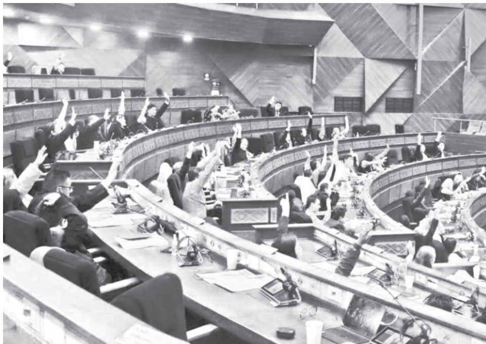
El pleno de la Asamblea Legislativa Plurinacional. CDEPB

Estos cambios buscan agilizar la convocatoria y disminuir las barreras administrativas para los postulantes, con el objetivo de asegurar que la Asamblea Legislativa Plurinacional (ALP) pueda designar oportunamente a las nue-