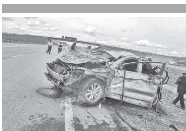
Accidente en Patacamaya, en la ruta La Paz - Oruro. APACHITA

El abogado ni su defensa se han pronunciado sobre estas denuncias hasta el momento.