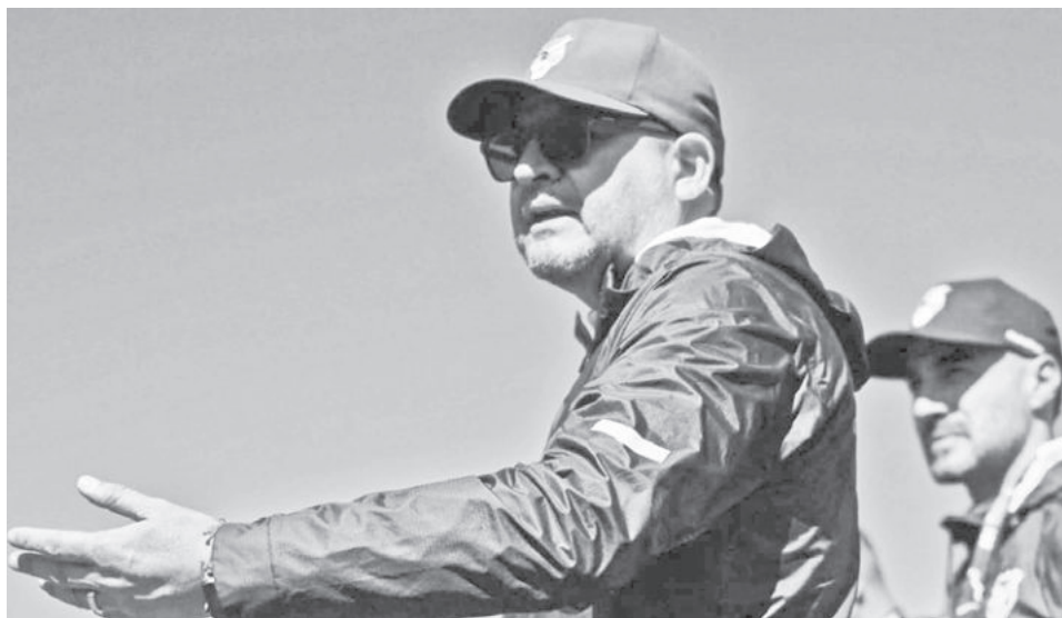
El DT de la Selección Nacional, Óscar Villegas.

“Todos los jugadores son evaluados, los vemos permanentemente y a todos, jóvenes, no tan jóvenes, los experimentados, y, si es necesario a los naturalizados, no tenemos problemas, pero hay una base que nos ha mostrado y nos ha llevado al repechaje y se merecen ser considerados”, aseguró el seleccionador nacional, quien ayer recibió muestras de cariño de la afición cochabambina, presente en los predios donde se construirá la Casa de la Verde.