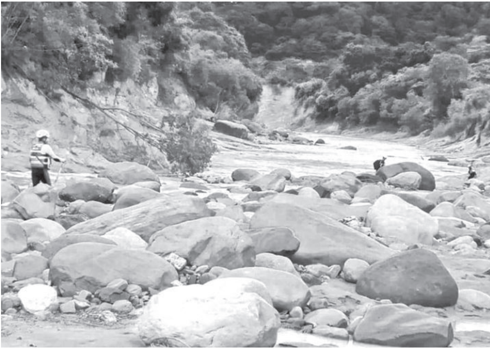
Rescatistas continúan la búsqueda de una desaparecida en Samaipata.

Pronóstico. El Senamhi emitió alertas hidrológicas mientras continúan los operativos de búsqueda y asistencia en Samaipata