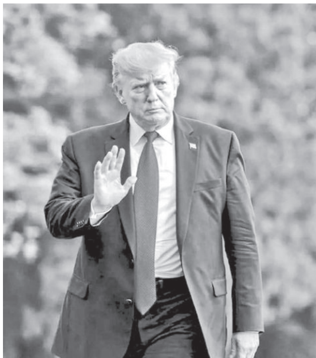
Donald Trump, mandatario de Estados Unidos.

La ofensiva militar estadounidense se produce en un contexto de relaciones ro-