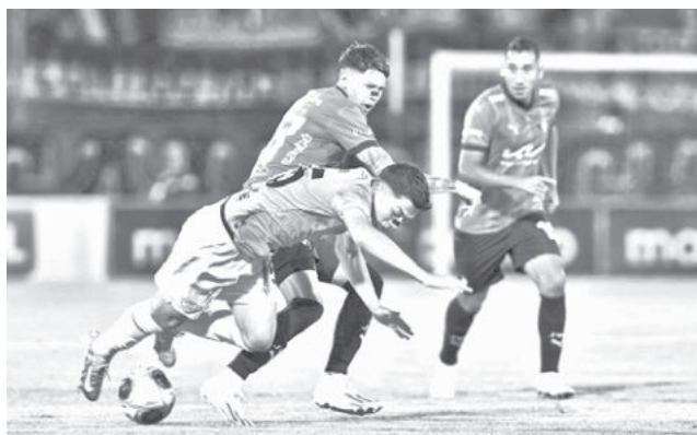
El partido Wilstermann y Aurora, el domingo.