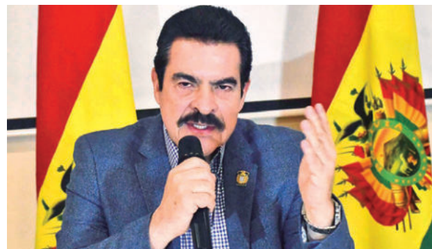
El alcalde Manfred Reyes Villa. CARLOS LÓPEZ

En materia de seguridad, se desplegará un equipo de guardias municipales para reforzar la vigilancia durante toda la feria, con el objetivo de prevenir hechos delictivos y garantizar la seguridad para visitantes y comerciantes.