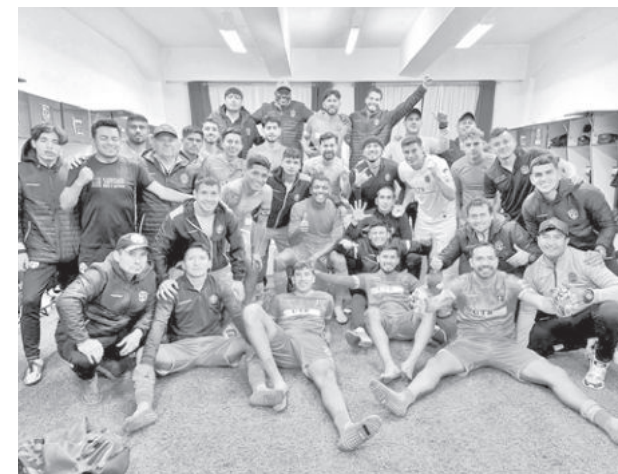
El plantel de San Antonio. SAN ANTONIO

Hoy continuará la fecha 27 con los siguientes partidos: Blooming-ABB (15:00), Tomayapo- Oriente Petrolero (18:00) y Wilstermann-Totora-Real Oruro (20:00). Mañana se completa la fecha con: Always Ready- Aurora (15:00), Universitario-The Strongest (18:00) y Bolívar- Nacional Potosí (20:00).