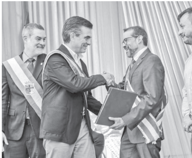
El presidente del Estado, Rodrigo Paz Pereira. GADSC

“Quiero dejar en claro que está absolutamente asegurado el pago de las jubilaciones, rentas, pensiones y seguros de todos los jubilados”, afirmó, al señalar que el enfoque de inversión de la Gestora será redireccionado hacia el sector privado para fortalecer la economía nacional.