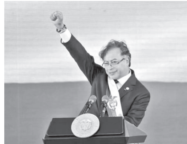
Gustavo Petro, presidente de Colombia.

Trump, según estas fuentes, negó la mayoría de las peticiones, aunque ofreció un plazo de una semana para que Maduro y sus allegados salieran de Venezuela con un salvoconducto, opción que expiró el viernes pasado. Tras el vencimiento de ese plazo, Trump decretó el cierre total del espacio aéreo venezolano.