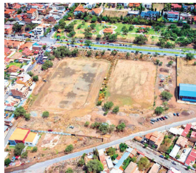
Una vista aérea del predio para la Casa de la Verde, en el cruce Taquiña.