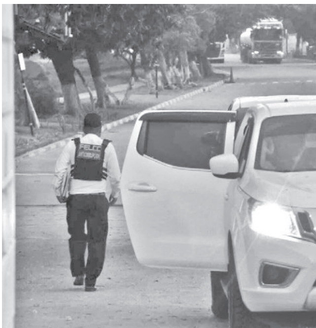
Allanamiento de la Fiscalía en YPFB de Santa Cruz.

Delitos. Las pesquisas apuntan a delitos que incluyen incumplimiento de deberes, corrupción y otros.