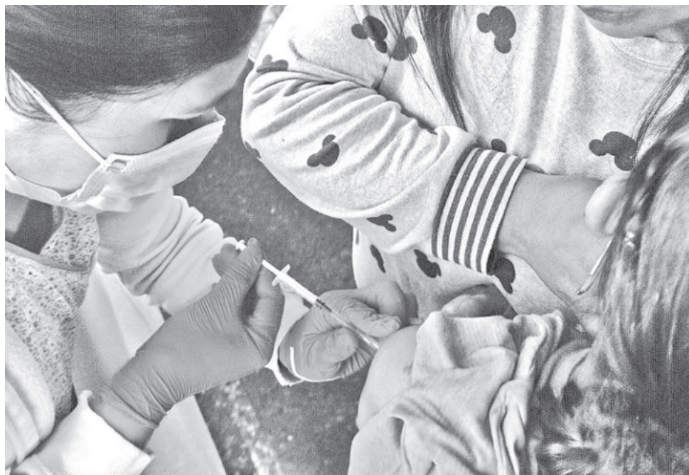
La vacunación contra el sarampión en Cochabamba.

Con respecto al dengue, el departamento mantiene 15 casos, pero los sospechosos subieron a 167, principalmente en mujeres y en municipios