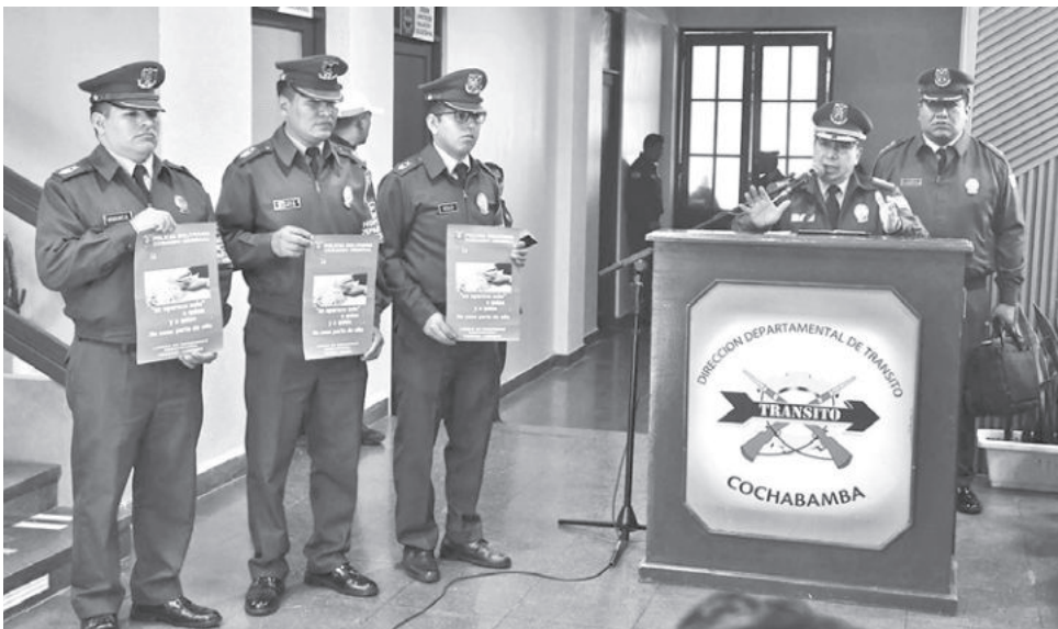
La presentación del plan anticorrupción de la Policía en Cochabamba, ayer. HERNAN ANDIA

El sábado, el comandante de la Policía emitió dos memorándums: uno prohíbe a los agentes "solicitar, exigir, aceptar o insinuar" la entrega de dinero a civiles o miembros de la institución, y otro ordena el cierre de comisarías dependientes de Tránsito a escala nacional que operaban de manera irregular y con fines extorsivos, además de disponer la creación de la "Oficina de Plataforma de Atención al Público". También supervisará los operativos de la Dirección de Prevención e Investigación de Robo de Vehículos (Diprove).