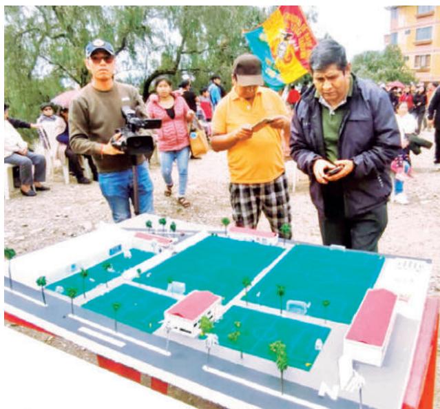
La maqueta de la Casa de la Verde. DANIEL JAMES