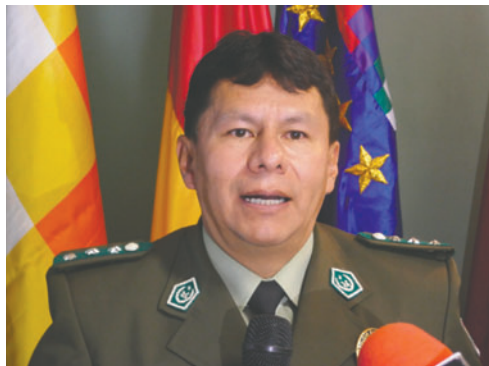
El comandante Helsner Torrico Valdez brindó detalles del caso

Actualmente, además de la aprehensión del mayor, se emitieron mandamientos de aprehensión contra cinco personas vinculadas a la casa de cambios, dos de ellas hombres y tres mujeres.