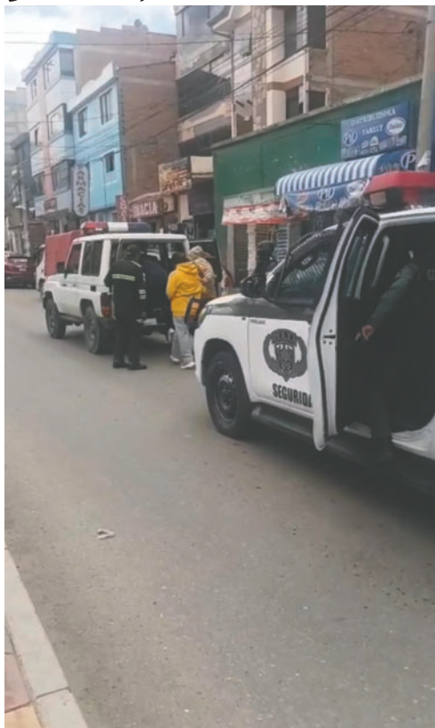
Momento en el que las cuatro personas son cambiadas de patrulla