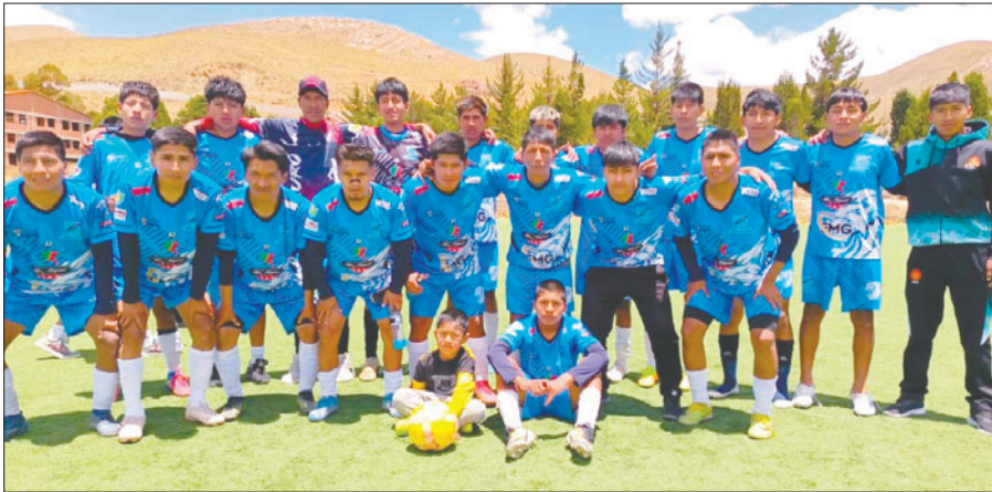
Felap campeón, con un plantel de jóvenes jugadores con hambre de gloria

Con estos resultados, la tabla de posiciones tiene a Felap primero con 24 puntos, en segundo Quirozinhos con 18, la tercera casilla le corresponde a Atlético Hermandad con 15 unidades, Futuro FC con 13, mientras que Morales Moralitos tiene cinco y luego Húngaros FC cierra la tabla con cuatro puntos, dejando un final electrificante en la lucha por el descenso de categoría.