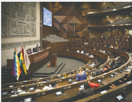
La sesión de la Asamblea Legislativa /RR.SS.