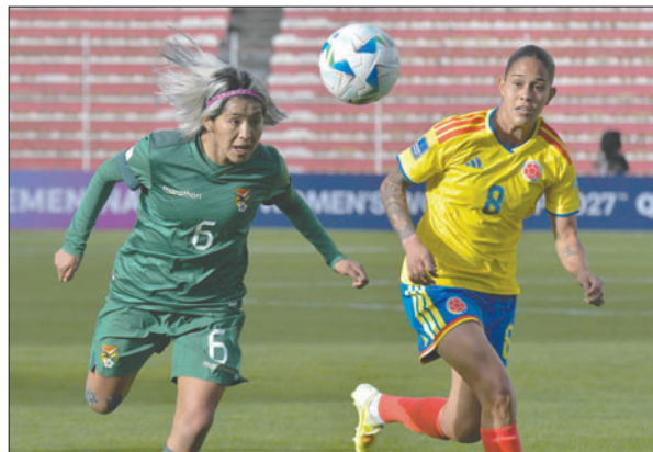
El empate ante Colombia obliga a las bolivianas a buscar un buen resultado

El elenco de Bolivia llegó a Buenos Aires como última en la tabla de esta competencia, con apenas un punto en su casilla, tras el empate que anotó frente a Colombia (1-1), en La Paz, el pasado viernes. En esta cuarta fecha de la Liga de Naciones, el cuadro verde procurará dar la sorpresa contra un rival que tampoco está teniendo el arranque esperado.