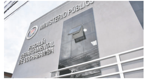
La Fiscalía de Cochabamba investiga el caso de oficio