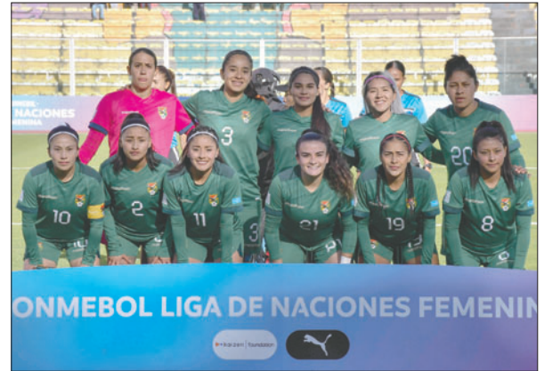
El equipo boliviano necesita recuperar terreno para no quedarse relegado