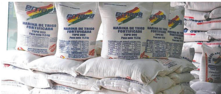
La harina de emapa fue el centro de una red de corrupción /REFERENCIAL

La situación ha generado una crisis en el sector agrícola, donde muchos productores han tenido que abandonar sus actividades debido a las pérdidas económicas ocasionadas por estas prácticas irregulares. La falta de acceso a biotecnología y las condiciones climáticas adversas han agravado aún más esta problemática para los agricultores locales.