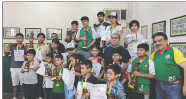
Los ganadores de la competencia nacional de ajedrez

Durante dos días se llevó adelante el certamen que se disputó a siete rondas de 15 minutos más cinco segundos de incremento por movimiento. Hubo un total de 129 ajedrecistas que compitieron entre todas las categorías habilitadas.