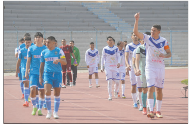
La última vez que jugaron en Oruro, empataron 2-2 el 29 de abril