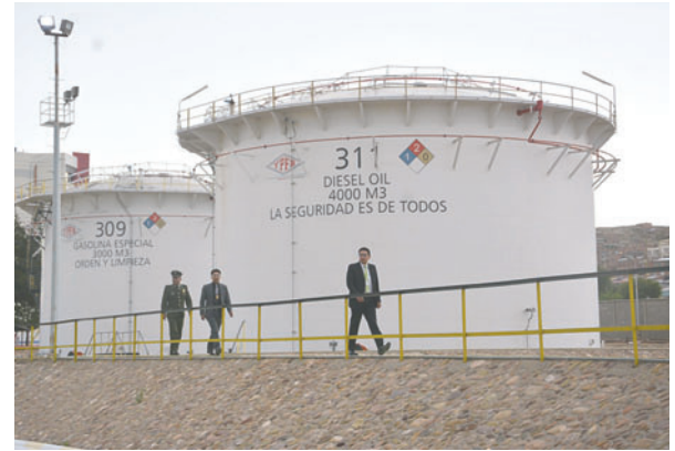
Allanamiento de las instalaciones de YPFB en Oruro

“Asimismo, y como medida preventiva de saneamiento institucional, se ha dispuesto el cambio inmediato del personal en las reparticiones involucradas, garantizando así la objetividad