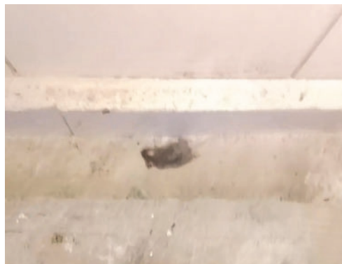
Un ratón muerto fue encontrado en el lugar /AMUN

En el lugar, la Intendencia Municipal verificó la presencia de heces de roedores y un ratón muer-