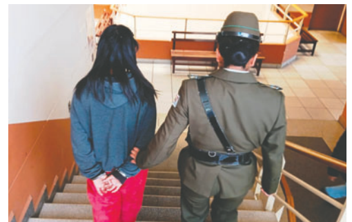
La mujer fue trasladada al penal de La Merced

El fiscal departamental, Aldo Morales, detalló que la madre consumió bebidas alcohólicas junto a unos amigos y durante esa reunión el menor empezó a llorar, por lo cual la mujer procedió a agredirlo. Según la Fiscalía, fueron los amigos de la progenitora quienes presentaron la denuncia.