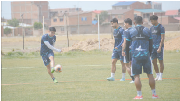
El cuadro orureño tuvo pocos días de preparación para este encuentro