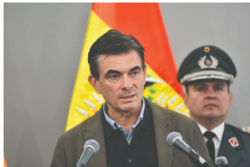
Gobierno elimina la exigencia de visa para ciudadanos de EEUU e Israel

Paz manifestó que debido a la obligatoriedad de las visas, el país perdió más de 80 millones de dólares estadounidenses en ingresos y que la medida fue un perjuicio para que ingrese la divisa norteamericana, además del incremento de visitantes al país, ya que durante las últimas