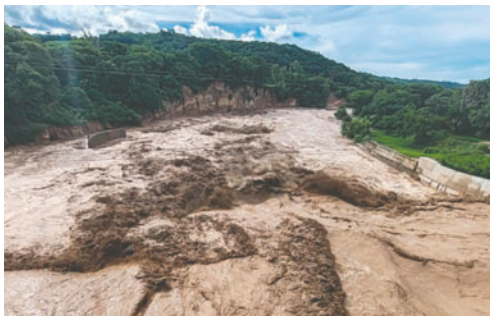
El río Pirai llegó a mover 20 millones de metros cúbicos por hora