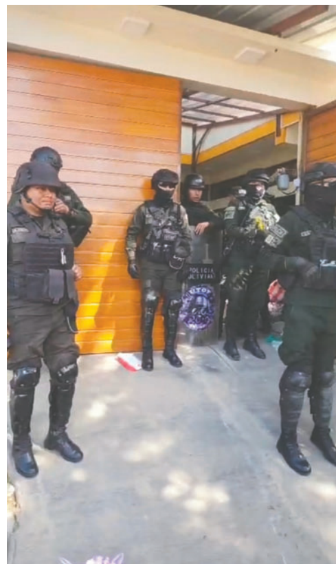
Personal policial fue al domicilio debido a la multitud de personas

El mayor dejó a las cuatro personas, dos mujeres y dos varones, en la calle Bolívar; antes de soltarlos,