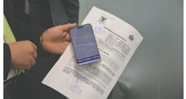
Secuestraron documentos

En Cochabamba, las oficinas de Redes de Gas y de Transparencia Corporativa fueron intervenidas para ve-