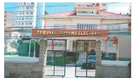
El proyecto de ley busca elegir nuevas autoridades en un periodo de 15 días

En el proyecto de ley que aprobó la pasada legislatura de la Cámara de Senadores se pretendía que el proceso se realice en un plazo de 45 días toman-