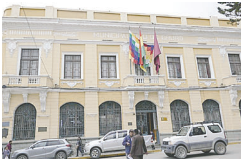
Municipio presenta querrela por caso de presunta red de falsificación de documentos oficiales/LA PATRIA

Indicó que la audiencia de medidas cautelares se desarrolló la semana pasada, concluyendo con la disposición de deten-