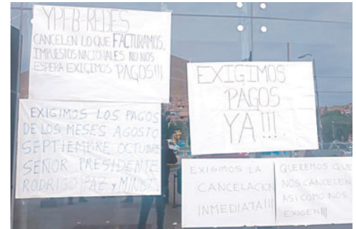
Piden la cancelación de los sueldos devengados desde agosto

La situación se complica aún más debido a las obligaciones fiscales. Los instaladores advierten que, a pesar de no haber recibido el dinero por los servicios prestados, Impuestos Nacionales ya les