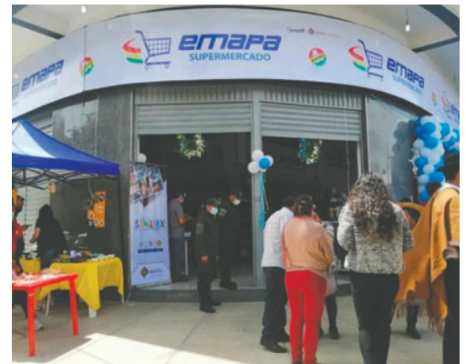
La empresa estatal es el centro de la polémica desde hace días