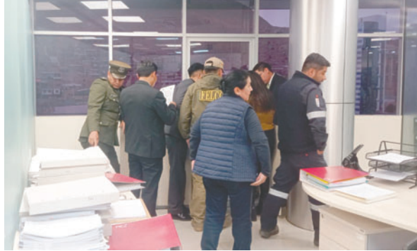
Las autoridades del orden durante el operativo

Durante el operativo, fiscales y agentes policiales verificaron la existencia de tres nuevos tanques cuya primera fase tenía un costo estimado de 144.244.000 bolivianos. Sin embargo, la cancelación registrada superaría los 305.168.695 bolivianos, lo que representa un incremento de más del 100% respecto al contrato inicial, pese a que la normativa vigente solo permite modificaciones de hasta un 10% en proyectos de inversión pública.