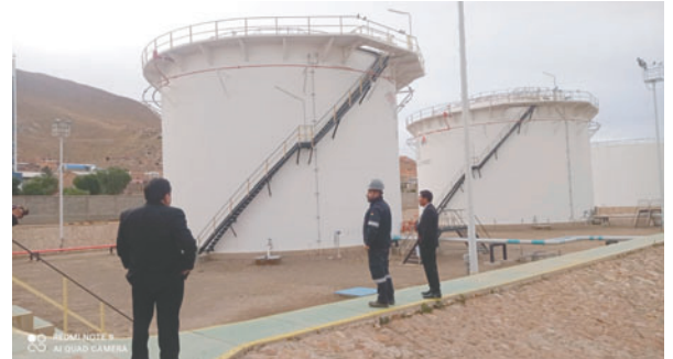
Señalaron observaciones en proyecto de ampliación de almacenaje de combustibles

rificar denuncias de cobros irregulares y posibles actos de concusión. En Santa Cruz, se ejecutaron operativos en