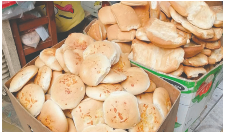
Aumento del precio del pan causó preocupación en la población

El municipio anunció que convocará nuevamente a la Federación de Panificadores para dialogar sobre la situación del precio y las medidas que puedan implementarse en beneficio del sector y de la población.