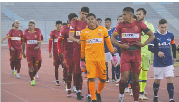
CDT Real Oruro, tiene cuatro finales por delante y los tiene que ganar

Si bien el elenco tiene algunas ausencias por tema de lesión, el plantel debe afianzarse para conseguir un resultado positivo y dar pelea. Luego del partido con el "avador", CDT Real Oruro tendrá dos encuentros como dueño de casa, ante Blooming el próximo sábado 6 de diciembre (17:30) en el estadio "Jesús Bermúdez". Luego en la penúltima fecha del torneo, recibirá a Nacional Potosí y en el cierre será visitante ante San Antonio en el Trópico de Cochabamba.