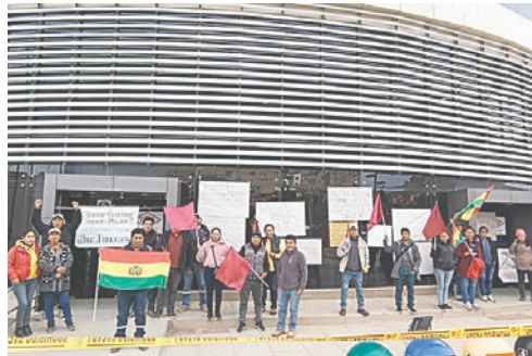
Trabajadores de empresa de instalaciones de gas se movilizan para exigir sueldos atrasados

La representante hizo un llamado urgente a las autoridades, solici-