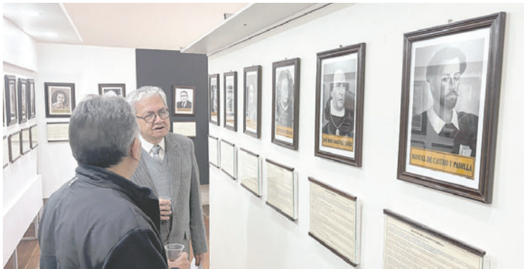
Museo “Ildefonso Murguía” amplió su sala de notables de Oruro

Soliz recordó que el museo alberga actualmente siete salas en total: Notables de Oruro, Fundación de Oruro, Pinacoteca