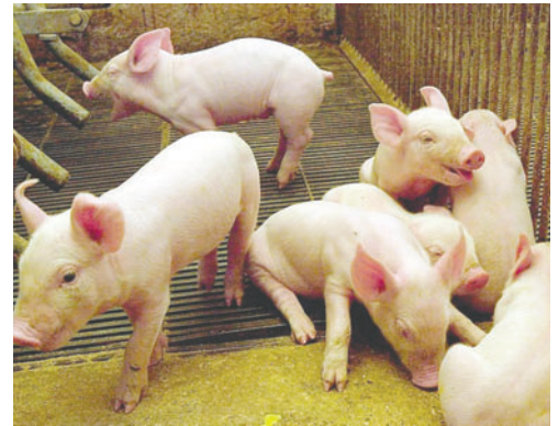
Senasag activa controles ante brote de peste porcina en España

La institución del Estado pidió a la ciudadanía no transportar cerdos ni productos de origen porcino. De llegar a hacerlo, solicitó que se declare al Senasag en cualquier puesto de control fronterizo y aeropuerto. También pidió no visitar establecimientos porcinos en áreas afectadas. "Se procederá al decomiso y destrucción inmediata de cualquier producto de origen porcino o material biológico prohibido conforme a normativa nacional e internacional vigente", señala el Senasag.