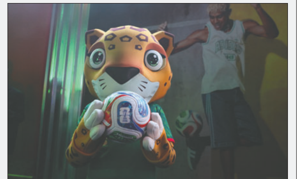
La fiesta del Mundial ya comienza a vivirse en el planeta

La transmisión se ofrecerá en directo por las plataformas de FIFA, incluyendo FIFA.com y el canal de YouTube de FIFA.