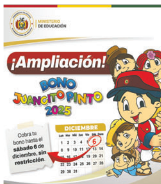
El anuncio fue oficializado por el Gobierno

La ampliación del plazo tiene como objetivo superar el 99,51% de cobertura logrado en la gestión 2024. Para alcanzar esta meta, el Ministerio de Educación ha realizado una con-