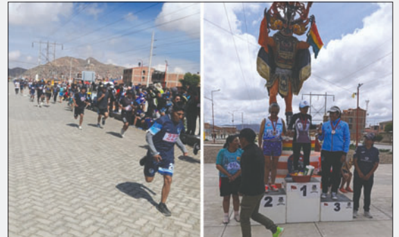
Buena cantidad de participantes y al final la premiación a los ganadores

La Milla Urbana de Altura Oruro 2025 dejó en claro que la población está ávida de espacios deportivos y que Oruro tiene mucho talento. El Club Atlético Oruro ya proyecta nuevas competencias con el objetivo de descubrir talentos y consolidar al departamento como referente del deporte base en Bolivia.