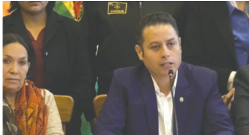
El vicepresidente Lara en conferencia de prensa

Lara afirmó: “No vamos a permitir que en el Tribunal Constitucional (TCP) y el Tribunal Supremo de Justicia (TSJ) se habiliten suplentes. La