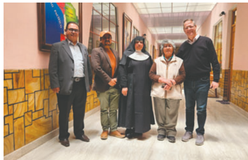
La visita al Hogar la Sagrada Familia se cumplió este lunes 1 de diciembre

Dunn expresó que siempre hay que estar presentes con nuestros papás, nuestros abuelos, personas que han trabajado tanto por el país, por sus familias y sus comunidades.