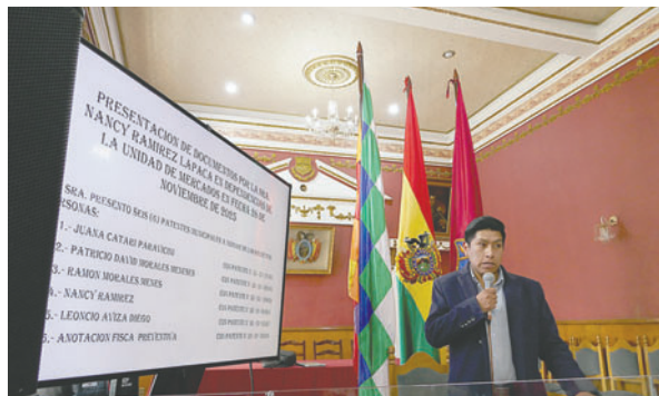
Unidad de Mercados detectó irregularidades en las patentes municipales de comerciante agresora

Desde la Unidad de Mercados se hace un llamado a